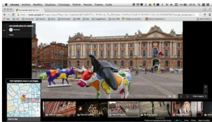
Figure 3. Une vue détaillée d'une photo avec la référence à l'endroit exact où elle a été prise

d'une technique d'interaction potentiellement plus souple et plus adaptée. Nous visons plutôt la définition d'un espace de conception structuré décrivant les relations complexes qui existent entre les données et les interactions présentes dans un espace d'information riche. Notre objectif est de tendre vers la conception de solutions interactives de type zoom contrôlé où les niveaux de zoom sont discrétisés et caractérisés en termes de type d'informations affichées, style d'interaction et déploiement. Les systèmes pertinents pour cette approche sont naturellement orientés vers des implémentations multi-dispositifs aptes à présenter simultanément les différents niveaux de zoom, et où chaque niveau est associé à des objectifs différents de connaissances et des modalités d'interaction spécifiques. Ce dernier point de vue est à notre avis pertinent pour améliorer le processus de conception.