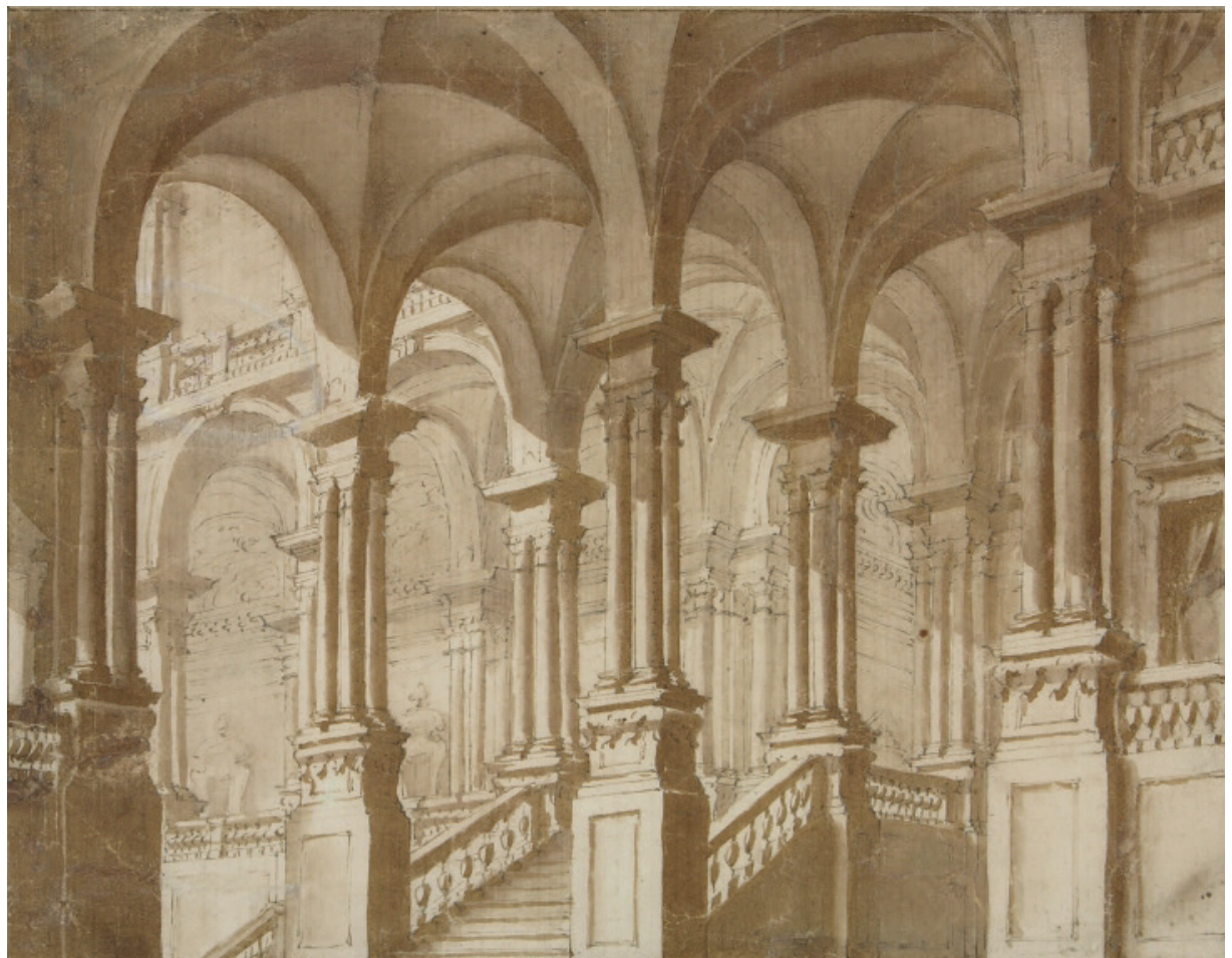
179. Prospero Zanichelli da F. Galli Bibiena Atrio magnifico penna e inchiostro su carta mm. 150x200 Reggio E. Musei Civici inv. C45

La documentazione acquisita dai Musei Civici di Reggio ci restituisce peraltro una conseguenza ancora più significativa, che testimonia quanta fu l’importanza e l’influenza della pur “piccola collezione” e degli studi di Giulio Ferrari. Questi nel 1901, sempre in preparazione del suo volume, aveva scritto a Giovanni Piancastelli su sollecitazione di Adolfo Venturi per sincerarsi se presso la Galleria Borghese o nella straordinaria