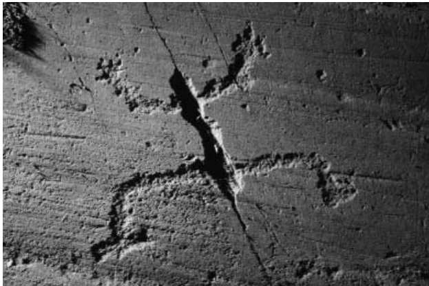
Fig. 3 – Orante con busto ricavato da una frattura. Campanine di Cimbergo, roccia 50 sett. E. (foto Dip. CCSP).