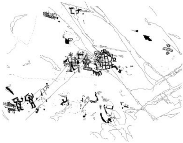
Fig. 1 – Ronchi di Zir, roccia 76 sett. B. Ricomposizione digitale dei rilievi (Dip. CCSP).