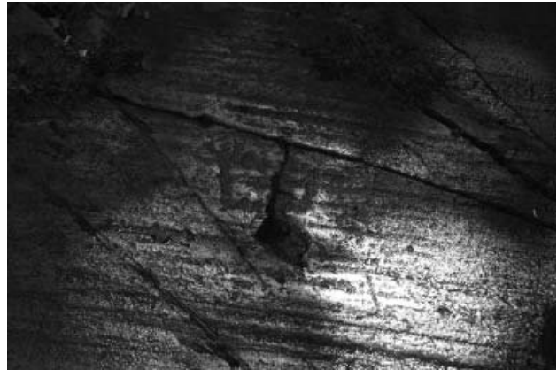
Fig. 2 – Grandi mani con busto ricavato da una frattura. Ronchi di Zir, roccia 76 sett. B..