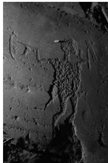
Fig. 4 – Grande armato che emerge da una frattura: a) fotografia. Campanine di Cimbergo, roccia 50 sett. E.