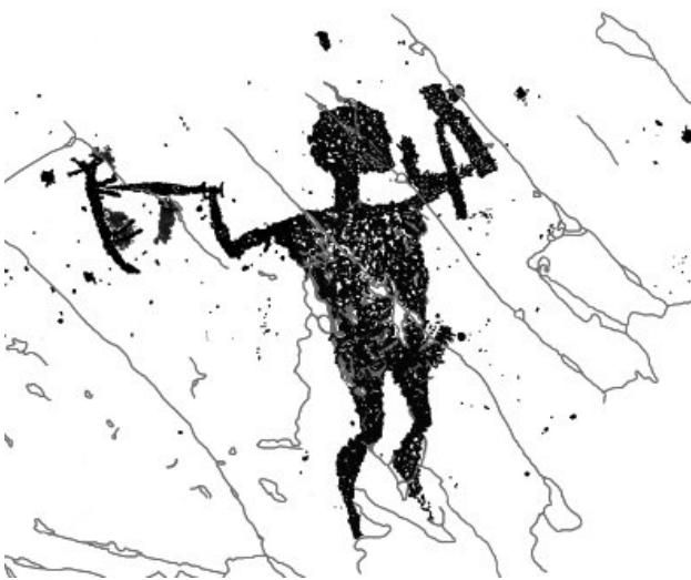
Fig. 4 – Grande armato che emerge da una frattura: b) rilievo. Campanine di Cimbergo, roccia 50 sett. E. (Dip. CCSP).