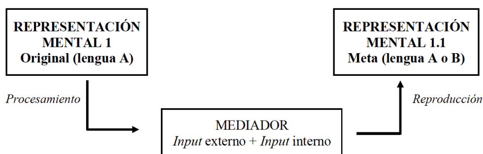
Gráfico 2. Proceso de mediación

Así pues, el mediador realiza esta labor de combinación de inputs externos (lengua) e internos (trasfondo) con el fin de comprender las representaciones mentales transmitidas por un hablante. Sin embargo, su procesamiento no se detiene cuando alcanza una interpretación satisfactoria, si no que el output obtenido es utilizado para codificar nuevamente el mensaje (Sánchez Castro, 2013: 793), dicho de otro modo, para activar nuevamente la misma representación mental descodificada originalmente, pero a partir de otras combinaciones de expresiones lingüísticas (cfr. Gutt, 2000). Para la reproducción de la representación mental, puede emplearse la misma lengua original (A) o una segunda lengua (B):