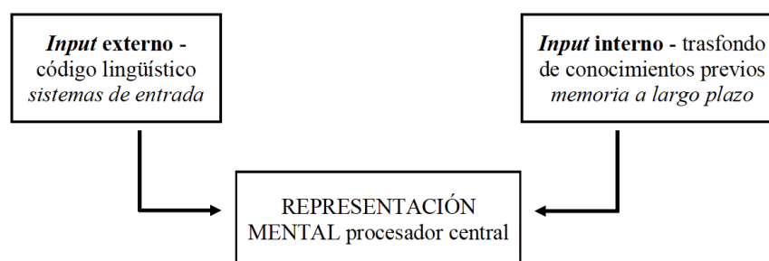
Gráfico 1. Procesamiento de representaciones mentales (adaptado de Pons, 2004 y Nadal, 2019: 31)