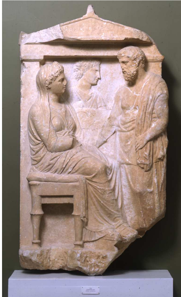
Fig. 2 : Stele di Timariste, probabilmente da Halai Araphenides conservata a Copenaghen, IN 2558.