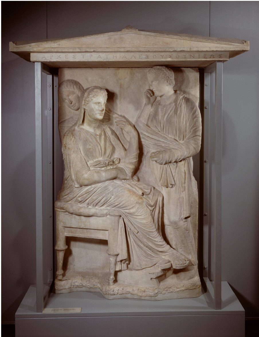
Fig. 4: Stele di Archestrates.