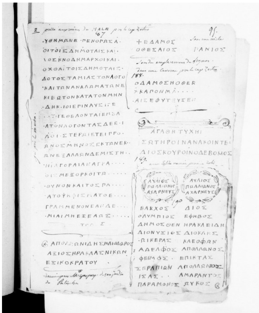
Fig. 1: Trascrizione di IG II 2 1174 realizzata fa Fauvel.