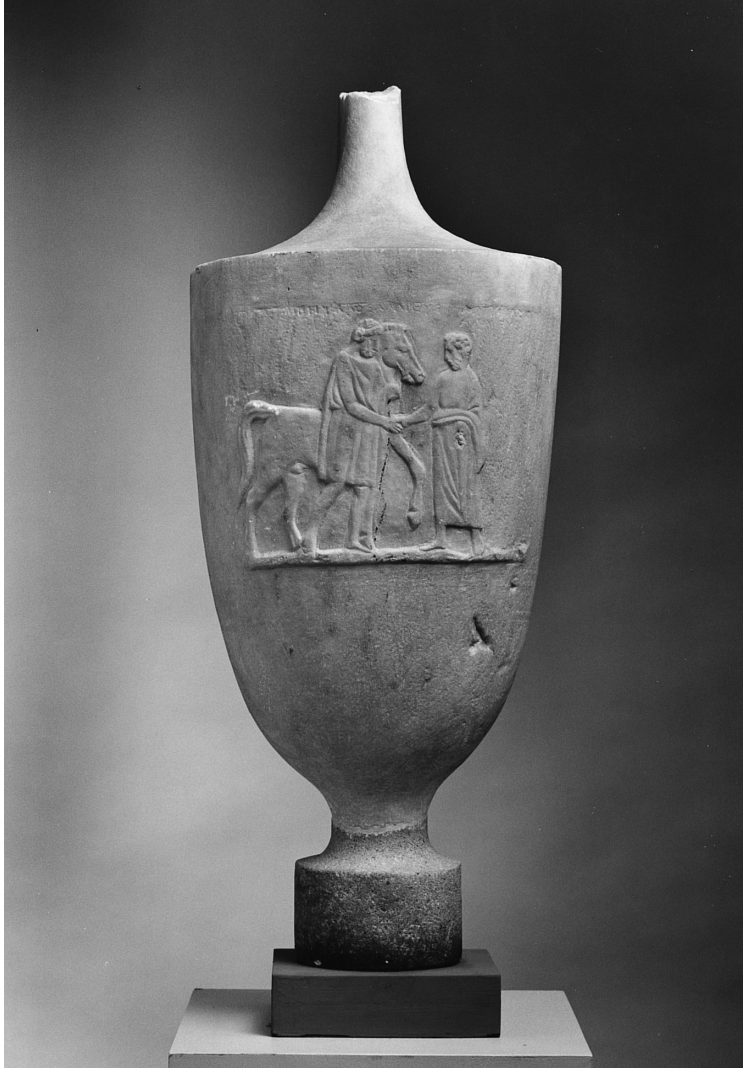
Fig. 5: Lekythos di Menyllos conservata a Copenhagen (IN 2786; Poulsen 1951, 221b).

Ricostruire il corpus epigrafico di un demo attico