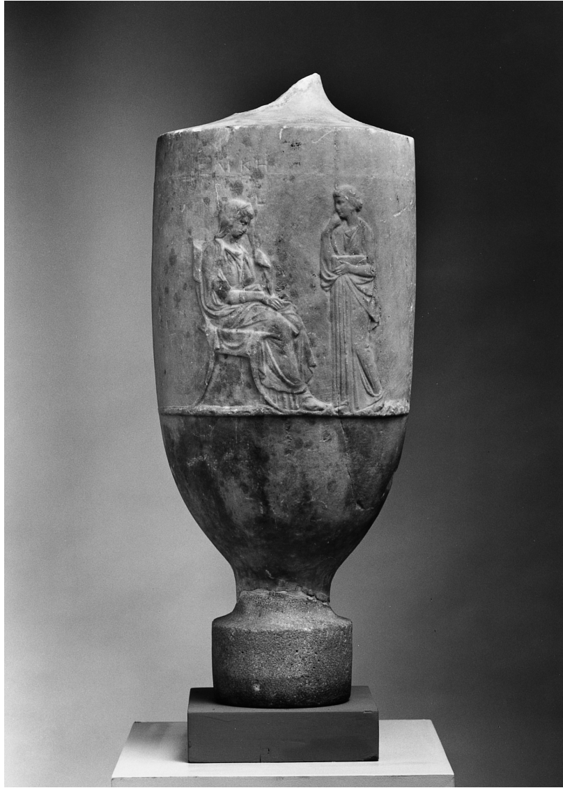
Fig. 6: Lekythos di Helike conservata a Copenhagen (IN 2785; Poulsen 1951, 221a).