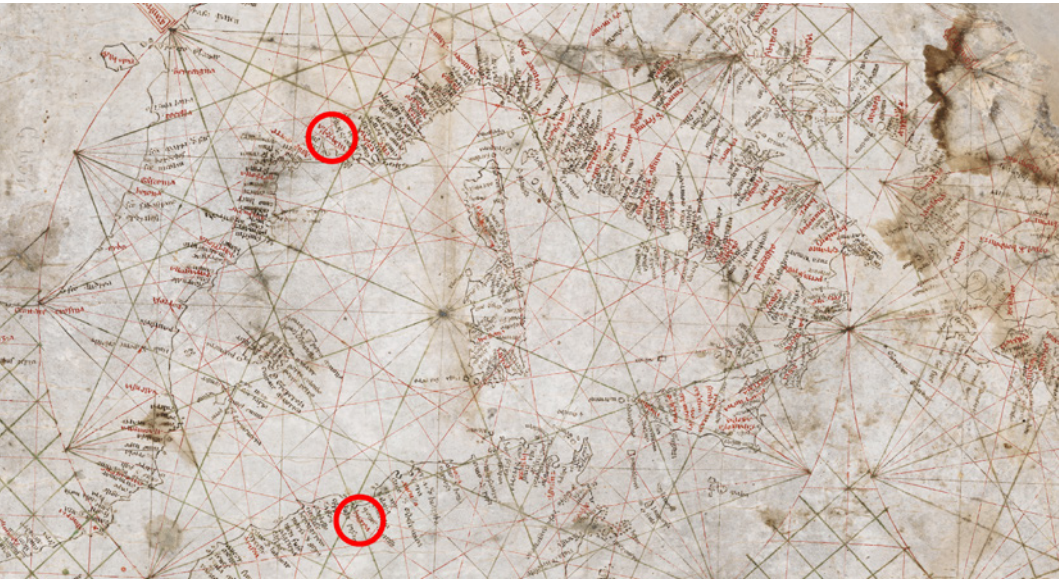
FIG. 11 - Buggea e Marsiglia sulla Carta Pisana

«La maggior valle in che l'acqua si spanda», incominciaro allor le sue parole, «fuor di quel mar che la terra inghirlanda, tra ' discordanti liti contra 'l sole tanto sen va, che fa meridiano là dove l'orizzonte pria far suole.