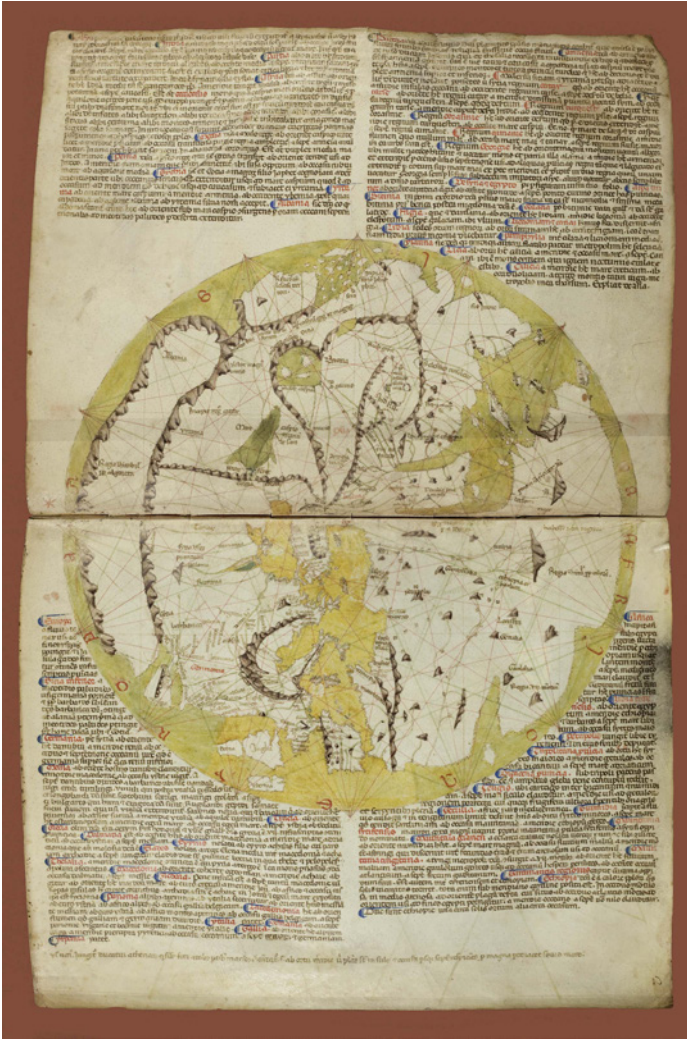
FIG. 5 - PIETRO VESCONTE, Planisfero, 1320-1321 ca.; pergamena, cm 60x47,6; Città del Vaticano, Bibl. Apostolica Vaticana, Pal. lat. 1362 A, 1v-2r