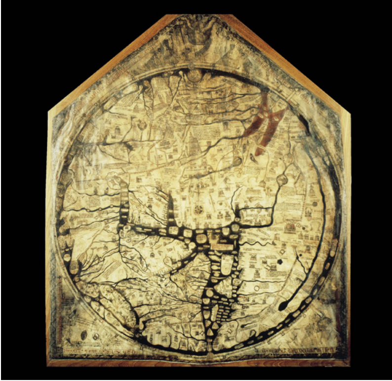
FIG. 3 - Mappamondo di Hereford, 1290 ca.; pergamena, cm 165×135; Hereford, Hereford Cathedral

gogia ma alla conoscenza del territorio, e dunque prive di elementi narrativi, sacri o fantastici, e integrate dalla cartografia nautica nell'accuratezza dei profili costieri. Sono esempi di alto livello qualitativo il planisfero di Pietro Vesconte, parte dell'apparato cartografico del Liber secretorum di Marino Sanudo [Fig. 5], databile al 1320-1321, e il planisfero allegato, fra il 1328-29 e i primissimi anni Trenta, alla Chronologia magna di Paolino da Venezia nel Parigino latino 4939 [Fig. 6].