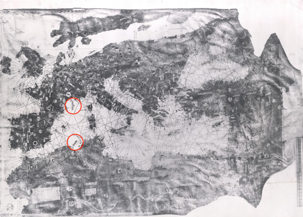
FIG. 12 - GIOVANNI DA CARIGNANO, carta nautica del mar Mediterraneo, del mar Nero e del mar Baltico fino al golfo di Finlandia, sec. XIV (primo quarto?); riproduzione fotografica b/n ante 1943, cm 134x90; Firenze, Archivio di Stato, Carte nautiche 2

Il passo illumina il ruolo della cartografia nell'officina letteraria della Commedia : strumento per la costruzione di un quadro geografico quanto più possibile aderente alla realtà dei luoghi, e insieme immagine interiorizzata, suggestione e modello narrativo per l'elaborazione di una moderna carta del mondo plasmata attraverso il linguaggio della poesia.