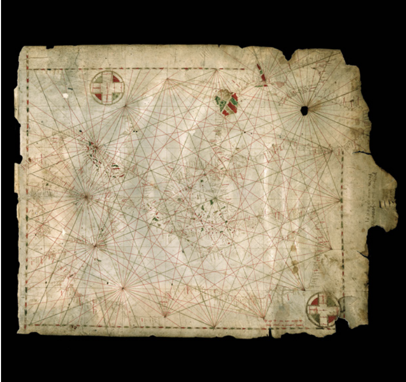
FIG. 10 - PIETRO VESCONTE, carta nautica del mar Mediterraneo orientale, del mar Nero e del mar d'Azoŕ, 1311; pergamena, cm 63x48; Firenze, Archivio di Stato, Carte nautiche 1

Alla spiccata precisione empirica della morfologia litoranea, che costituisce la peculiarità del genere cartografico, corrisponde il vuoto informativo circa le zone interne. Non dovette comunque mancare, fra Due e Trecento, una cartografia d'entroterra, di analogia impostazione realistica e concreta, funzionale all'incremento della mobilità