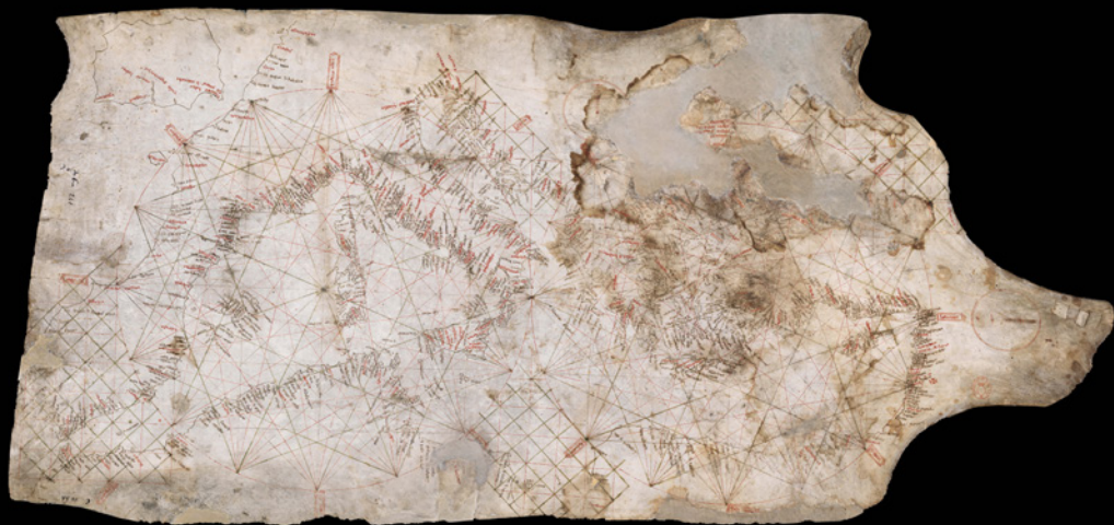
FIG. 8 - Carta Pisana, sec. XIII; pergamena, cm 104×50; Paris, Bibl. Nationale de France, GE B-1118 RES

testimoni pervenutici, ovvero la Carta Pisana [Fig. 8], realizzata forse a Genova, e la Carta di Cortona [Fig. 9], questa prassi cartografica risale a un'epoca certamente anteriore, benché difficile da precisare 10 . La prima mappa di cronologia sicura è la carta del Mediterraneo orientale di Pietro Vesconte [Fig. 10], firmata e datata al 1311, e il XIV secolo segna l'infittirsi delle testimonianze accanto alla messa in atto di una tecnica esecutiva più raffinata. Strumenti pratici di una modalità di navigazione prevalentemente di cabotaggio, in contatto visivo con il litorale, le carte marine riportano il profilo costiero, i nomi sequenziali