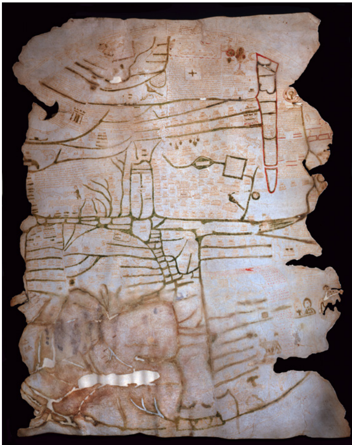
Fig. 2 - Mappamondo di Vercelli, sec. XII-XIII; pergamena, cm 84x72; Vercelli, Archivio Capitolare

cronaca contemporanea, confluenti in un dispositivo narrativo unico e sincronico, solo in apparenza caotico, in realtà saldamente inscritto in una prospettiva cosmica e dotato di una precisa organizzazione interna, specchio dell'ordinamento divino del Creato.