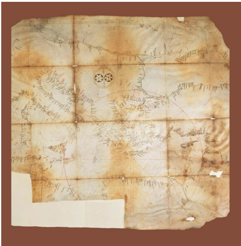
FIG. 9 - Carta di Cortona, sec. XIII; pergamena, cm 60×47; Cortona, Bibl. del Comune e dell'Accademia Etrusca di Cortona, Membranacei 105

dei centri rivieraschi e un intreccio di linee direzionali originate da due o più rose dei venti, estranee al contenuto topografico ma necessarie per la determinazione e il controllo della rotta 11 .