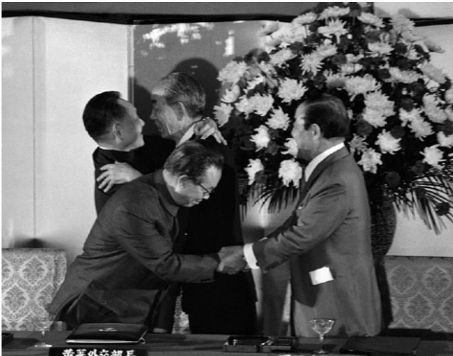
Fig. 2. L’abbraccio tra Deng Xiaoping e Fukuda Takeo (sullo sfondo) durante la visita del leader cinese a Tokyo per la firma del Trattato di Pace e Amicizia, il 31 ottobre 1978. In primo piano, la stretta di mano tra i ministri degli esteri Huang Hua e Sonoda Sunao.

“Silk Road”, anche in vista delle Olimpiadi di Pechino del 2008. Ma le questioni legate al rispetto dei diritti umani nelle regioni di Xinjiang e Tibet, gli scandali alimentari e l’annosa questione dell’inquinamento ambientale contribuiscono ulteriormente a peggiorare l’immagine della Cina nell’arcipelago. I tempi sono cambiati e gli abbracci tra leader cinesi e giapponesi, come quello tra Deng Xiaoping e Fukuda Takeo a Tokyo nel 1978, sembrano sempre meno probabili.