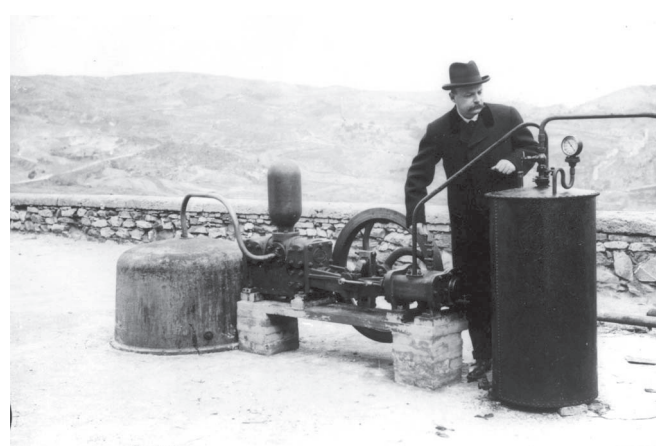
Fig. 1 - Piero Ginori Conti e l'esperimento del 1904.

Da allora il progresso fu continuo e inarrestabile. Nel 1905 fu installato un motore prototipo a pistoni capace di generare 20 kW, che per ben dieci anni illuminò l'intero palazzo del Principe ed alcune altre residenze a Larderello; nel 1908 un nuovo motore iniziò a generare energia elettrica per gli impianti di produzione chimica dell'azienda. Nel 1913 venne inaugurata la prima centrale geotermica al mondo (Larderel-