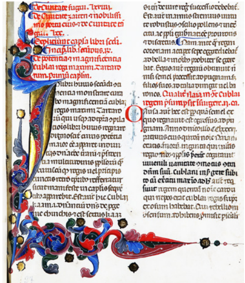
Figura 3 Biblioteca Nazionale Centrale di Firenze, ms. Conv. soppr. C.VII.1170, c. 27v