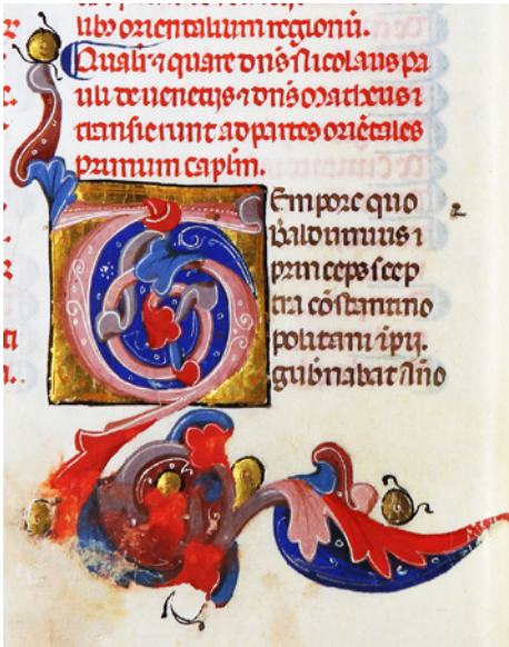
Figura 2 Biblioteca Nazionale Centrale di Firenze, ms. Conv. soppr. C.VII.1170, c. 2v