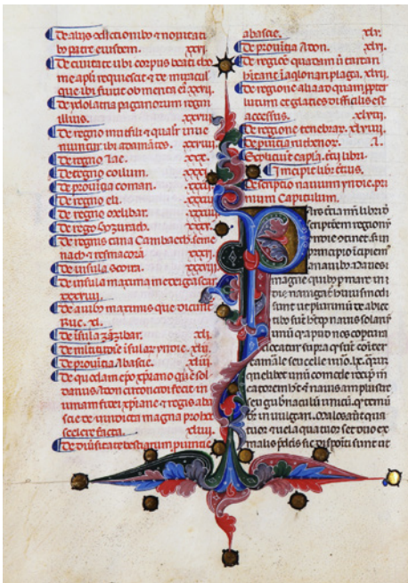
Figura 4 Biblioteca Nazionale Centrale di Firenze, ms. Conv. soppr. C.VII.1170, c. 53v