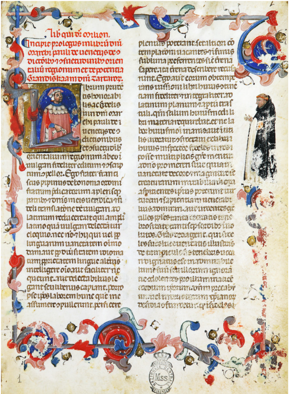
Figura 1 Biblioteca Nazionale Centrale di Firenze, ms. Conv. soppr. C.VII.1170, c. 1v