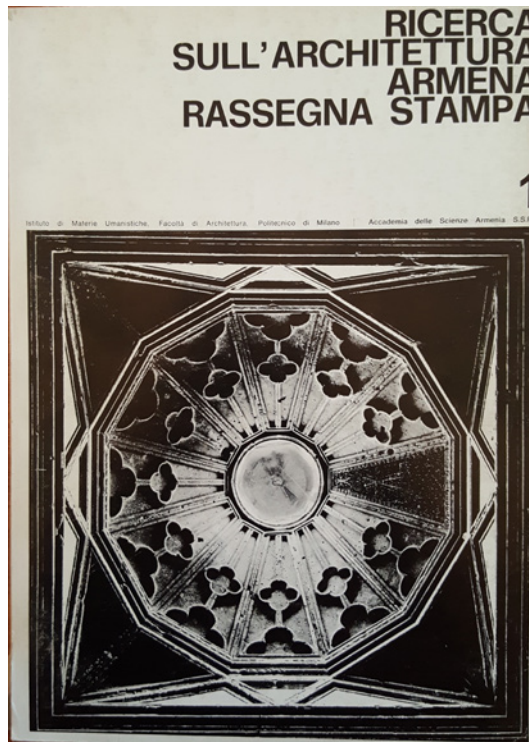
Figura 2 Prima di copertina. Documenti di architettura armena. Vol. 2, Khatchkar