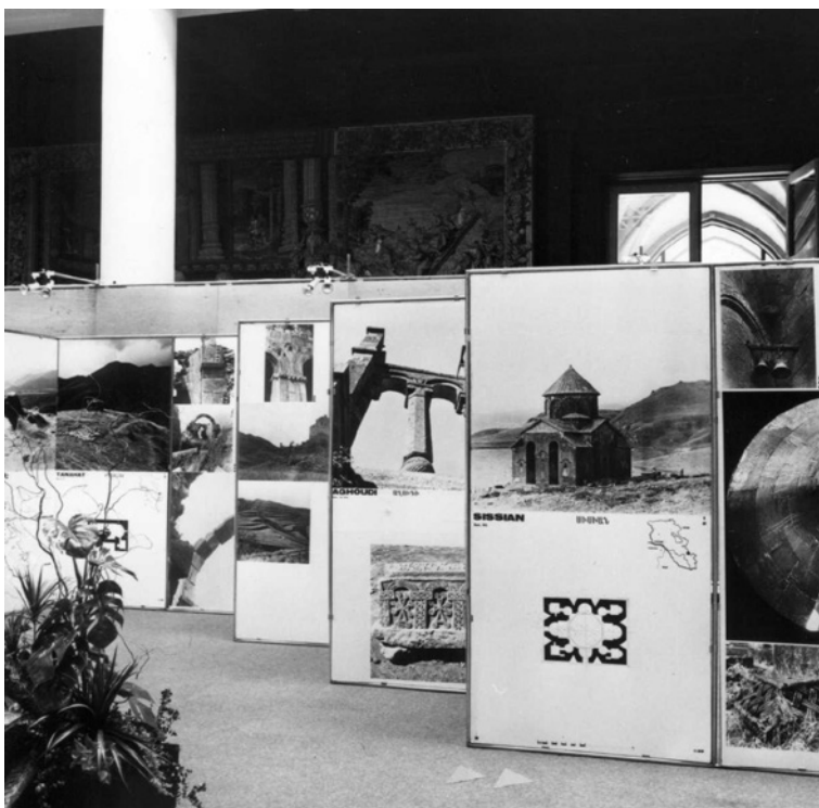
Figura 5 Allestimento mostra Architettura armena dal IV al XVIII secolo. Lyon, Palays Saint Jean, ottobre 1980.

la carica di umanità e di simbolismo in essa contenuta. Lo studioso bellunese lamentava che il giudizio sulla cultura armena fosse basato su un esame di tipo «puntiforme» (per singoli monumenti, fossero di architettura religiosa o laica) o «a livello tipologico» indicando le motivazioni nella «quasi totale scomparsa del tessuto connettivo all'intorno, per cui i singoli manufatti superstiti emergono in modo surreale in un isolamento, talora splendido e magico, ma in sostanza di una drammatica tragicità» (Alpago Novello 1986a, 265).