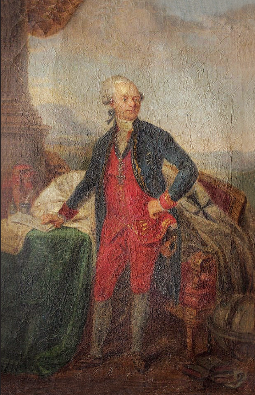
Fig. 3: Franz Linder (attr.), [Karl von Zinzendorf con le insegne dell'Ordine Teutonico], 1792 ca., olio su tela (collezione privata).