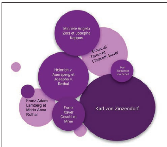
Fig. 1: Elaborazione grafica della rete di amicizie e relazioni a Trieste e Lubiana che emerge dal diario del conte Zinzendorf nel 1766.

detti Auersperger Miniaturbücher , due album contenenti 81 disegni inediti eseguiti intorno al 1760 recentemente donati dalla Fondazione benefica Kathleen Foreman Casali alla città di Trieste per essere custoditi presso il Civico Museo Teatrale “C. Schmidl” (Bongiorno, 2019). Questi album, noti agli storici dell’arte come Album Auersperg dal nome della grande famiglia nobiliare austriaca che li custodì per oltre un secolo (la più documentata ricerca rimane quella di Reitinger, 2016, 248–252, 352–359), evidenziano il ruolo della famiglia Auersperg nella costruzione e nella conservazione di importanti network familiari tra Lubiana, Trieste e Gorizia lungo tutto il corso del XVIII e l’inizio del XIX secolo.