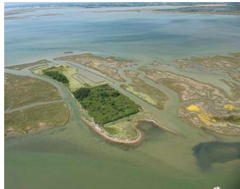
L'Isola di Sant'Ariano.

Da un'altra isola della Laguna nord, San Lorenzo di Ammiana, provengono ancora due frammenti solidali di un'iscrizione funeraria tardoantica, il