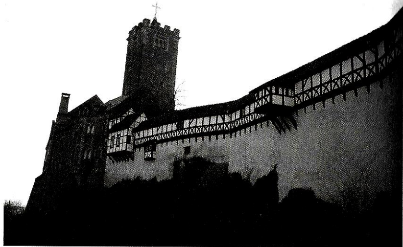
아이제나흐의 바르트부르크 성

로 주장하면서 구동독의 성립이 부르주아 민주주의를 완성하고 새로운 단계로 나아가고 있다는 것을 계속 주장했다. 5