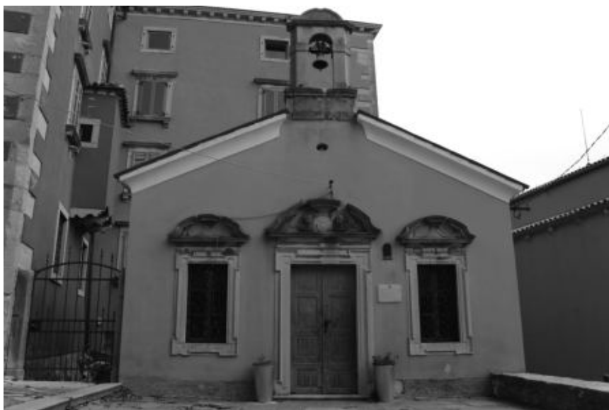
Sl. 13. Kapela sv. Stjepana, Labin

Kako svjedoče nadgrobne ploče, Battiale su kao svoju obiteljsku kapelu oblikovale onu sv. Stjepana u neposrednoj blizini palače, čije pročelje također pokazuje odlike dekorativnog jezika XVIII. stoljeća, s pravokutnim otvorima s naglašenim uglovima i razvijenim isprekidanim zabatima. 463 Ponovno, i ove se kvalitetne dekoracije i dvije andeoske glave odmiču od oblikovnih principa profilacija prozora i figura glava na palači, pa su vjerojatno djelo nekih drugih izvođača.