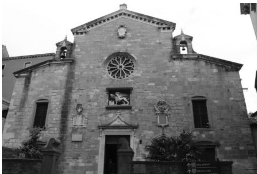
Sl. 7. Župna crkva Rođenja Blaženje Djevice Marije Labin

Komuna je preko funkcije prokuratora za crkvu ( Procuratore della chiesa ) kontrolirala i crkvenu imovinu, kako onu župne crkve tako i bratovštinskih kapela. 432 Prokurator su se birali iz redova vijećnika, što je i inače bio slučaj u komunama pod mletačkom vlašću.