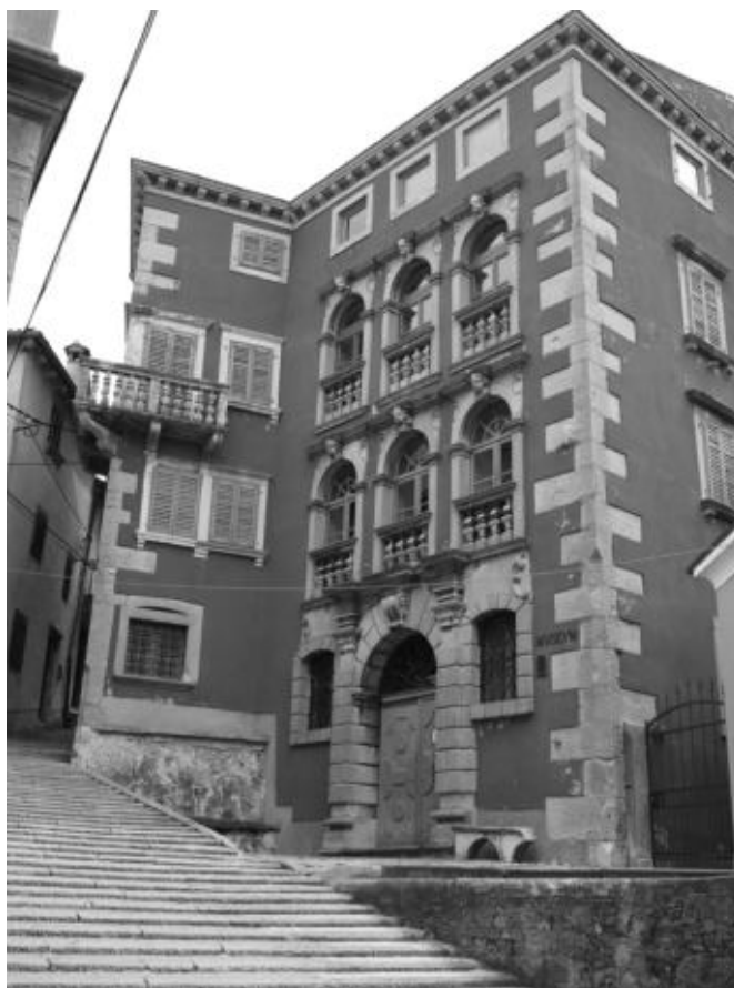
Sl. 12. Palača Battiala Lazzarini, Labin

na žbukanoj crvenoj fasadi. Naglasak je na rustikom oblikovanom portalu, no hijerarhija otvora prizemlja negirana je ravnomjernim ponavljanjem lučno zaključenih velikih prozora dva piana nobile , s balustrima u donjoj zoni i skulpturalnom izražajnim ljudskim glavama u ključnom kamenu. Iza monumentalne fasade reprezentativne su prostorije sa stubištem smještenim u stražnjem dijelu kuće, s kamenim okvirima otvora prema dvoranama, pa se mletački model osjeća i u prostornoj organizaciji, naravno, prilagođenoj nepravilnom i neravnom terenu.