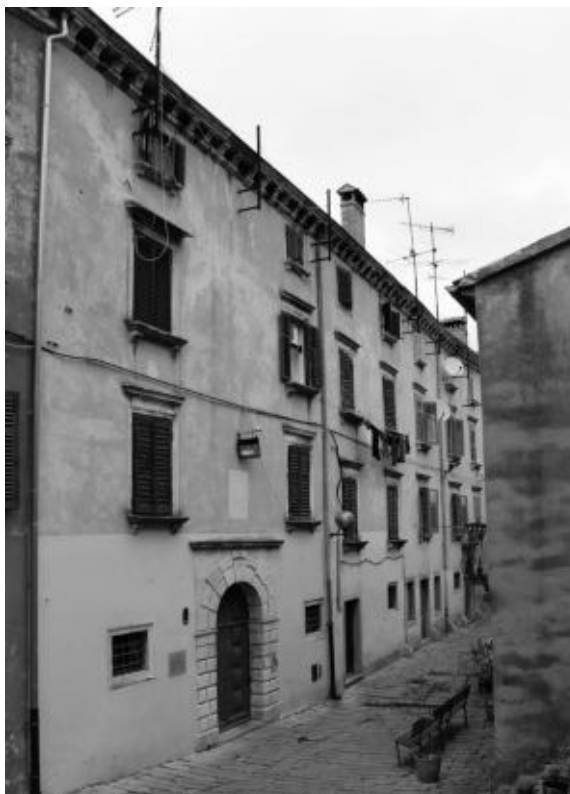
Sl. 14. Kuća Negri, Labin

čije je oblikovanje ipak jednostavno i oslonjeno tek na profilirane volute konzola. U toj su kući odsjedali mletački dužnosnici u proputovanju Labinom: primjerice, 29. studenog 1587. terminacija Nicolòa Salamona o sječi stabala pročitala se u dvorani kuće Negri, gdje je Salamon bio odsjeo 465 , dok naš mletački inženjer prvih godina Seicenta hvali udobnost Negrijeve, pa tako i drugih kuća u gradu. Tranquillo Negri dat će podignuti kapelu u neposrednoj blizini palače obitelji 1620., i to za bratovštinu sv. Antuna Padovanskog, no crkvice posvećena Gospi od Karmela funkcionirala je kao kapela obitelji, pa je za nju naručena i oltarna pala već spomenutog udomaćenog slikara Moreschija. 466