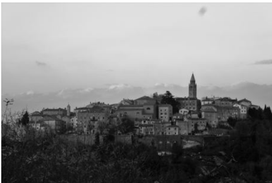
Sl. 1. Pogled na Labin (fotografirala Jasenka Gudelj, 2017.)

Povijesna jezgra staroga Labina jedna je od najvrednijih urbanih cjelina Istarskoga poluotoka, a sačuvanost kako arhitektonskih ostvarenja tako i arhivskih fondova iz vremena mletačke dominacije (1420. – 1797.) omogućuje analizu graditeljske baštine u društveno-povijesnome kontekstu. Dinamična ranonovovjekovna intelektualna i kulturna klima grada na granici s habsburškim posjedima te dugo trajanje institucija komune i plemićkih obitelji odlike su labinskoga društva, koje tijekom stoljeća gradi i oprema svoje prostore obraćajući se lokalnim i dovedenim majstorima, dok se kamen iz lokalnog kamenoloma u Presiki izvozi i na drugu obalu Jadrana. Cilj je, stoga, ovoga rada ocrtati odnos arhitektonskih ostvarenja i ranonovovjekovnih kolektivnih i pojedinačnih naručitelja te istražiti podatke o profesijama vezanim za graditeljstvo na području Labina u promatranom razdoblju.