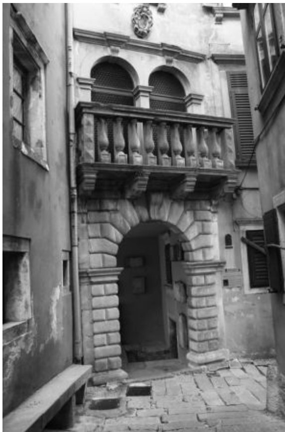
Sl. 15. Kuća Franković-Vlačić, Labin