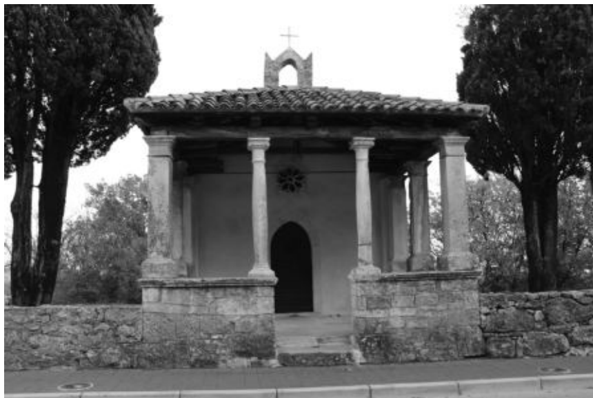
Sl. 11. Kapela sv. Marije Magdalene, Labin