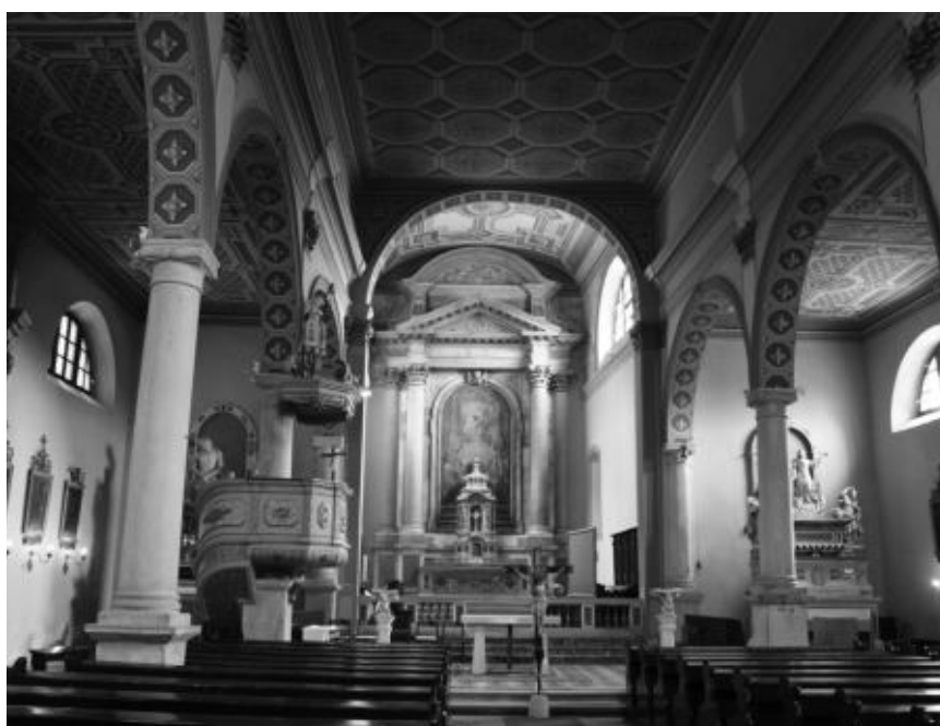
Sl. 8. Unutrašnjost župne crkve Uznesenja Blažene Djevice Marije, Labin

Možda su dijelovi intervencija koje su rezultirale lijepa rozeta na pročelju i šiljati luk nekadašnjeg portala, iako je moguće da pripadaju i nekoj ranijoj fazi građevine. Krajem drugog desetljeća XVI. stoljeća izgrađena je sakristija, o čemu svjedoči razmjena pisama između podestata Urbana Bollanija i puljskog biskupa Altobella Averoldija iz 1518. 436