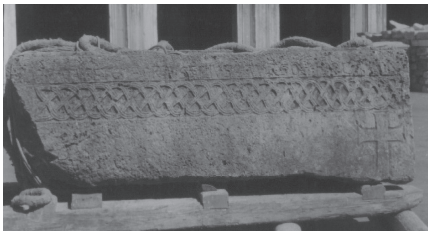
Fig. 8: Venezia, Museo Archeologico Nazionale, sarcofago da Sant'Ilario.

a sud) le attestazioni ricorrono in tutta l'area costiera fino alla laguna di Venezia e, dopo un vuoto coincidente con l'attuale zona friulana, riprendono in Istria e nell'area dalmatina. 45 Ravenna e la laguna di Venezia — soprattutto con esemplari a Rialto e Murano — e la zona circinvicina — Sant'Ilario di Mira (fig. 8), Equilo, Cittanova, costituiscono le aree con la massima concentrazione.