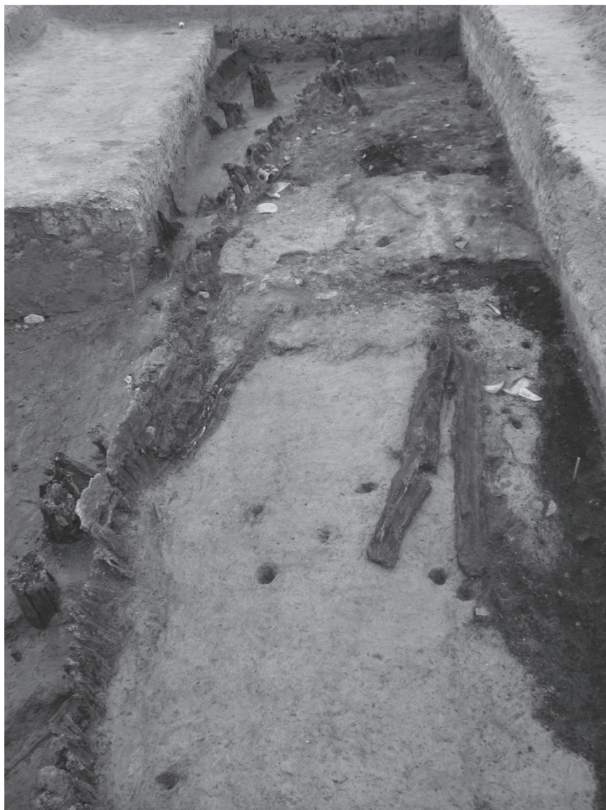
Fig. 4: Comacchio, Villaggio San Francesco, resti di strutture lignee.

di uno stato di salute in genere buono e di una correlata buona alimentazione. 24 L'ubicazione del cimitero, in prossimità dell'edificio di culto, indica infine la sua