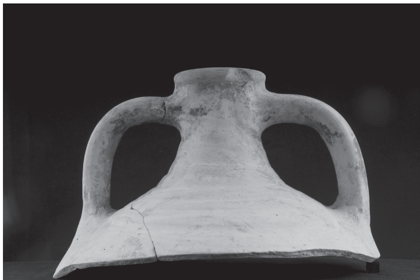
Fig. 5: Comacchio, Villaggio San parte superiore di anfora globulare.

nienza dei tipi comacchiesi dal centro Italia e hanno invece suggerito di identificare un'area di produzione nel nord della penisola (la stessa Comacchio, la laguna di Venezia?). 27 La rarità di questi prodotti e, soprattutto, l'areale distributivo finora conosciuto, ne fanno indiscutibilmente un prodotto specifico, forse di particolare pregio, collegabile a determinati contesti sociali: molto probabile anche a specifiche funzioni, vista la sostanziale ripetitività delle forme documentate — solo chiuse e spesso provviste di pippio-versatoio —. 28 La società comacchiese di IX secolo — e non solo il suo vescovo 29 — mostra dunque un certo grado di sofisticazione, che la differenzia dalle comunità anche cittadine dell'entroterra — per quanto possiamo al momento saperne della loro “cultura materiale” — e l'apparenta invece a centri come Rimini, la laguna di Venezia e forse Ravenna, le uniche altre aree dove questo tipo di ceramica è stato finora segnalato.