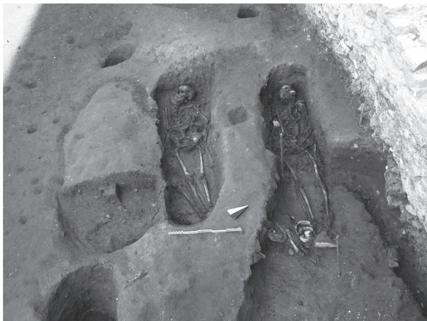
Fig. 3: Comacchio, piazza XX Settembre, necropoli alto-medievale.

Tiberio: 582–602). Per quanto riguarda il momento in cui venne istituito l'episcopio, ci sono almeno due opzioni che si possono proporre sulla scorta della documentazione scritta, oltre ad una serie di più o meno fantasiose ipotesi che non vale la pena di prendere in considerazione in questa circostanza. La prima rinvia alla cronologia indicata su un'iscrizione, un tempo murata sul campanile della chiesa di S. Cassiano e ora nella sagrestia del duomo, e cioè intorno al 723. Secondo quel testo, infatti, la sede episcopale sarebbe stata fondata al tempo dell'arcivescovo ravennate Felice, durante la seconda indizione del suo mandato. 19 La seconda non è una data precisa ma un terminus ante quem e cioè il 781, quando un vescovo comacchiese compare nel già menzionato diploma di Carlo Magno. Dunque 723 oppure, se non vogliamo dare credito all'epigrafe, 20 un periodo compreso tra la data del cosiddetto capitulare di Liutprando (715 o 730) — dove a rappresentare la comunità di Comacchio non c'è un vescovo ma solo un presbitero —, e il 781. Una cronologia del cimitero, tra seconda metà dell'VIII e IX secolo, è prudenzialmente la più plausibile (a niente