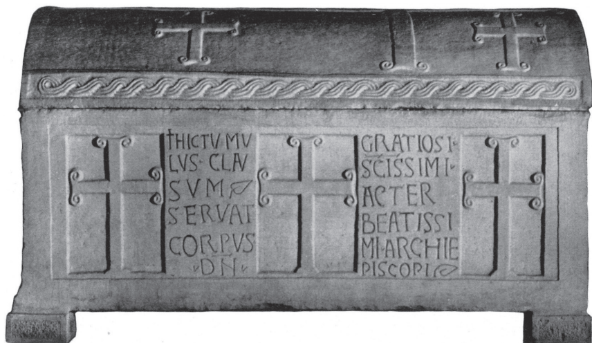
Fig. 9: Ravenna, chiesa di Sant'Apollinare Nuovo, sarcofago dell'arcivescovo Grazioso.

esempio — riduce il numero degli esemplari ancora nella collocazione originaria e dunque impedisce di comprendere appieno quali fossero le strategie comunicative che ad essi venivano espressamente associate. 47