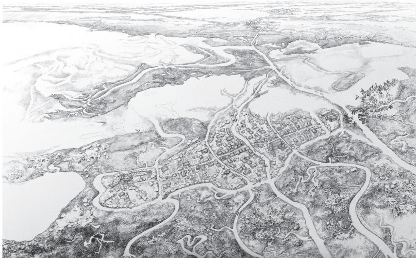
Fig. 2: Ricostruzione dell'abitato di Comacchio nell'alto medioevo (Studio Inklink).

recuperati dal vicino luogo di culto dopo un incendio, indica l'esistenza di episodi di tale portata da aver provocato almeno una parziale riorganizzazione dell'intero complesso ecclesiastico. Tutta la sequenza successiva, inoltre, certifica non solo una stasi nelle attività — si riconoscono solo alcuni modesti interventi edilizi di epoca tardo-medievale e moderna collegati alla chiesa cattedrale e la creazione di un nuovo grande spazio cimiteriale — ma soprattutto un diverso orientamento nelle componenti della “cultura materiale” del luogo. Da questo momento in poi, infatti, gli indicatori ceramici, che erano stati determinanti nel delineare la cifra commerciale di questo centro, si caratterizzano esclusivamente per produzioni di tipo locale o, al massimo, regionale. Nell'area di Villaggio San Francesco, invece, che si trova oltre la periferia ovest dell'abitato, magazzini e strutture connesse con attività marittime — pontili, banchine di legno — vengono abbandonati e la zona ricoperta da un sedime di natura alluvionale: processi deposizionali molto chiari che pongono fine alle funzioni di quest'area come snodo nelle comunicazioni endolagunari.