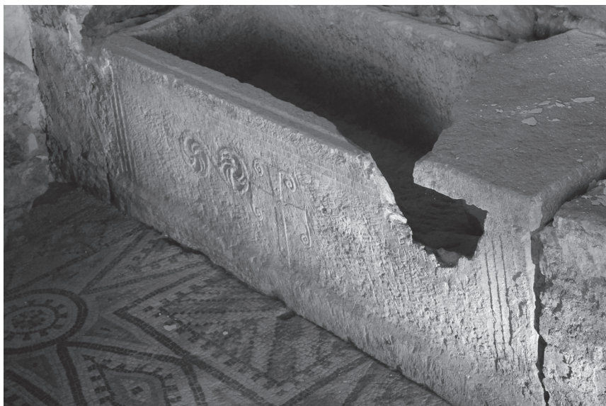
Fig. 11: Parenzo, Eufrasiana, sarcofago.

scorso, si vedono i resti frammentari di quello che sembra essere il coperchio di un sarcofago decorato con una grande croce (fig. 10). 52 Il tipo di decorazione rinvia ad un medesimo orizzonte iconografico e cronologico. Sempre nel territorio ferrarese, nello specifico a Voghenza, è conservato un sarcofago — noto come di San Leone — con decorazioni che rimandano al secolo VIII. 53 Il sarcofago di Stefano, dunque, sembra costituire un'opzione non sconosciuta, anche se non frequentissima, in questa area.