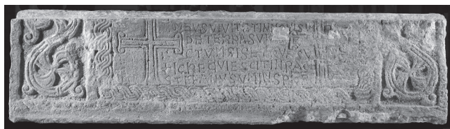
Fig. 7: Comacchio, chiesa cattedrale (ora Museo del Delta Antico), sarcofago di Stefano.

per la ricostruzione del duomo, iniziati sotto il vescovo Sigismondo Isei (1655–70). 33 Trasferito alla possessione di S. Vito per essere utilizzato come abbeveratoio per gli animali, 34 il sarcofago venne recuperato all'originaria funzione dal vescovo Nicolò D'Arcano (1670–1714) che lo scelse per la sua sepoltura. L'oggetto dunque fu riportato a Comacchio e sotterrato, insieme alle spoglie del presule, all'interno della chiesa e tale rimase, in questa collocazione — cioè totalmente nascosto alla vista —, fino al 1904, quando in occasione dei lavori di manutenzione straordinaria realizzati nella chiesa venne trasferito nel luogo dove si trovava fino al novembre del 2014 (quando venne smurato, restaurato e collocato nel Museo Delta Antico a Comacchio).