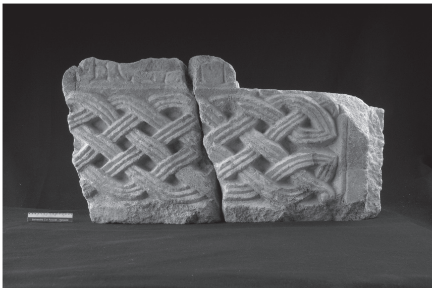
Fig. 6: Comacchio, piazza XX Settembre, frammento di recinzione presbiteriale.

La chiesa episcopale delle origini nelle sue consistenze materiali è sfuggita al momento all'evidenza archeologica, anche perché, con tutta probabilità, si trova la di sotto del duomo attuale. Tuttavia gli scavi di piazza XX Settembre ce ne hanno restituito una documentazione indiretta. Frammenti di colonne, di sectile, capitelli di reimpiego e resti di tesserine di mosaico, riutilizzati o confluiti in contesti più tardi, ci dicono che doveva trattarsi, molto probabilmente, di un edificio con impianto basilicale a tre navate divise da colonne — e non da pilastri come le coeve chiese plebane del territorio ravennate —, 30 riccamente decorata con marmi e pavimenti in mosaico. È molto probabile che alla sua realizzazione avesse concorso l'arcivescovo Vitale — se diamo credito all'epigrafe di cui abbiamo parlato — e questo spiegherebbe l'arrivo, a Comacchio, di numerosi spolia anche tardo-antichi verso gli inizi del secolo VIII (come il capitello a foglie d'acanto di epoca giustiniana o le stesse colonne). Questa chiesa venne poi interessata almeno da un'altra importante fase di rifacimento, coincidente con la realizzazione di una recinzione presbiteriale, a cui appartenevano una quarantina di frammenti che vennero poi riutilizzati, come semplice materiale da costruzione, in un muro eretto nel corso del secolo XI 31 (fig. 6). I materiali recu-