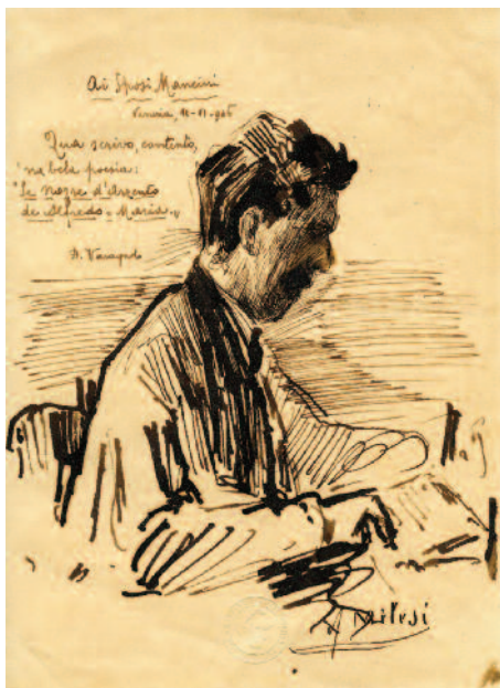
2. Alessandro Milesi, Il poeta Varagnolo , 1942 ca., Venezia, Fondazione Musei Civici Veneziani, Galleria Internazionale d'Arte Moderna di Ca' Pesaro