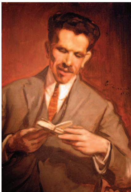
1. Emile Bernard, Ritratto di Domenico Varagnolo , 1922 ca., Venezia, Fondazione Musei Civici Veneziani, Centro Studi Teatrali di Casa Goldoni