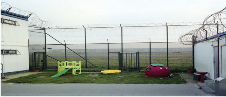
Figure 1 Centre fermé 127 Melsbroek (aéroport de Zaventem).