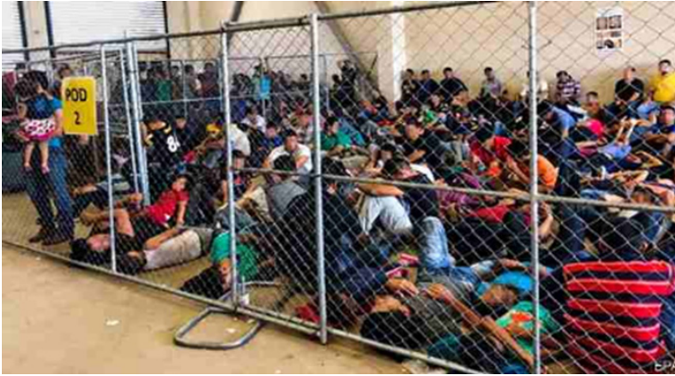
Figura 3 Minori detenuti nei centri di accoglienza. The Economist , 06-06-2019

dell'Accordo Flores, l'Amministrazione Trump ha contestato l'obbligo di fornire prodotti per l'igiene e condizioni normali per dormire, dichiarando che condizioni di vita decenti come sapone e materassi non sono contemplati nell'Accordo Flores. 43 La situazione è rimasta caotica e scandalosa, come si vede dall'immagine tratta dall' Economist del 6 luglio 2019 [fig. 3].