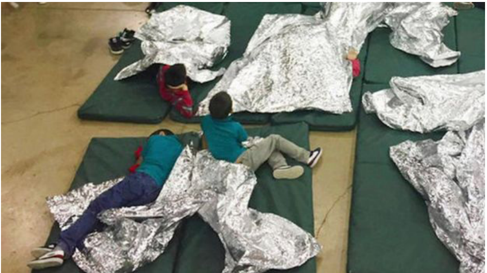
Figura 2 Foto del 17-06-2018, U.S. Customs and Border Protection, McAllen (Texas), pubblicata da Huffington Post , 22-06-2019