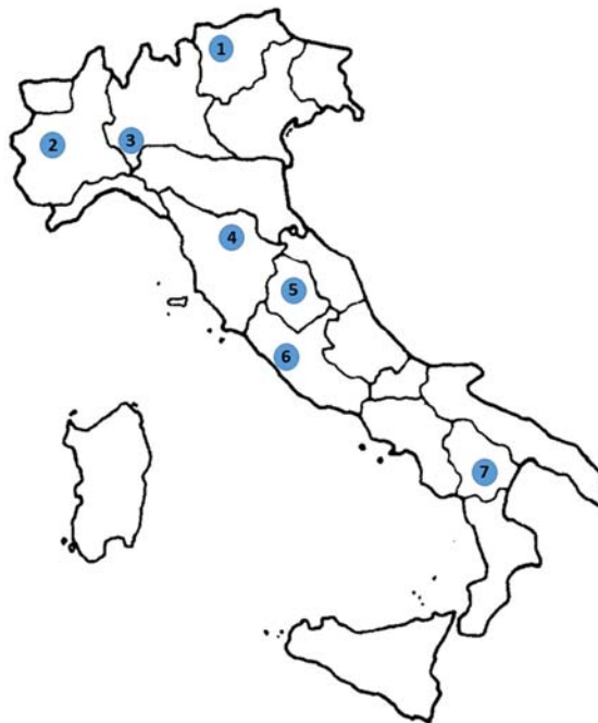
Figura 1. Distribuzione dei principali istituti nazionali con competenze di gestione e conservazione dei decapodi dulcicoli: 1) Fondazione Edmund Mach di S. Michele all'Adige (Trento); 2) Istituto Zooprofilattico Sperimentale del Piemonte, Liguria e Valle D'Aosta di Torino; 3) Università degli Studi di Pavia; 4) Università degli Studi di Firenze; 5) Università di Perugia; 6) Università degli Studi Roma Tre di Roma; 7) ARPA Basilicata di Matera

Il gruppo di studio dei decapodi d'acqua dolce proposto e realizzato all'interno dell'Associazione Italiana Ittiologi Acque Dolci ha come principale obiettivo quello di studiare e migliorare la conoscenza di tutti gli aspetti della biologia di gamberi, gamberetti e granchi d'acqua dolce nativi e alieni, che attualmente vivono negli ambienti lentici e lotici italiani, promuovendo allo stesso tempo la formazione di una rete di esperti che garantisca un'adeguata diffusione di corrette informazioni utili e fruibili non solo in attività gestionali dalle autorità competenti locali e nazionali, ma anche dai non addetti al settore. Il gruppo si occupa di investigare sulla tassonomia, sistematica, zoogeografia, ecologia, etologia, fisiologia, anatomia, genetica, conservazione (delle native) e gestione (delle aliene) dei decapodi dulciacquicoli presenti in Italia. Le principali istituzioni che, sotto diversi aspetti, si occupano di decapodi d'acqua dolce coprono gran parte del territorio nazionale (Figura 1). L'integrazione della eterogeneità delle competenze riscontrabili nei differenti istituti garantisce l'attivazione di una rete di esperti più efficiente nello studio e nel monitoraggio delle popolazioni di decapodi d'acqua dolce. In caso di infezioni legate ad agenti patogeni e/o parassiti, gli esperti di questo gruppo di lavoro possono ricevere il supporto tecnico e scientifico di addetti al settore dell'Istituto Zooprofilattico Sperimentale delle Venezie di Padova.