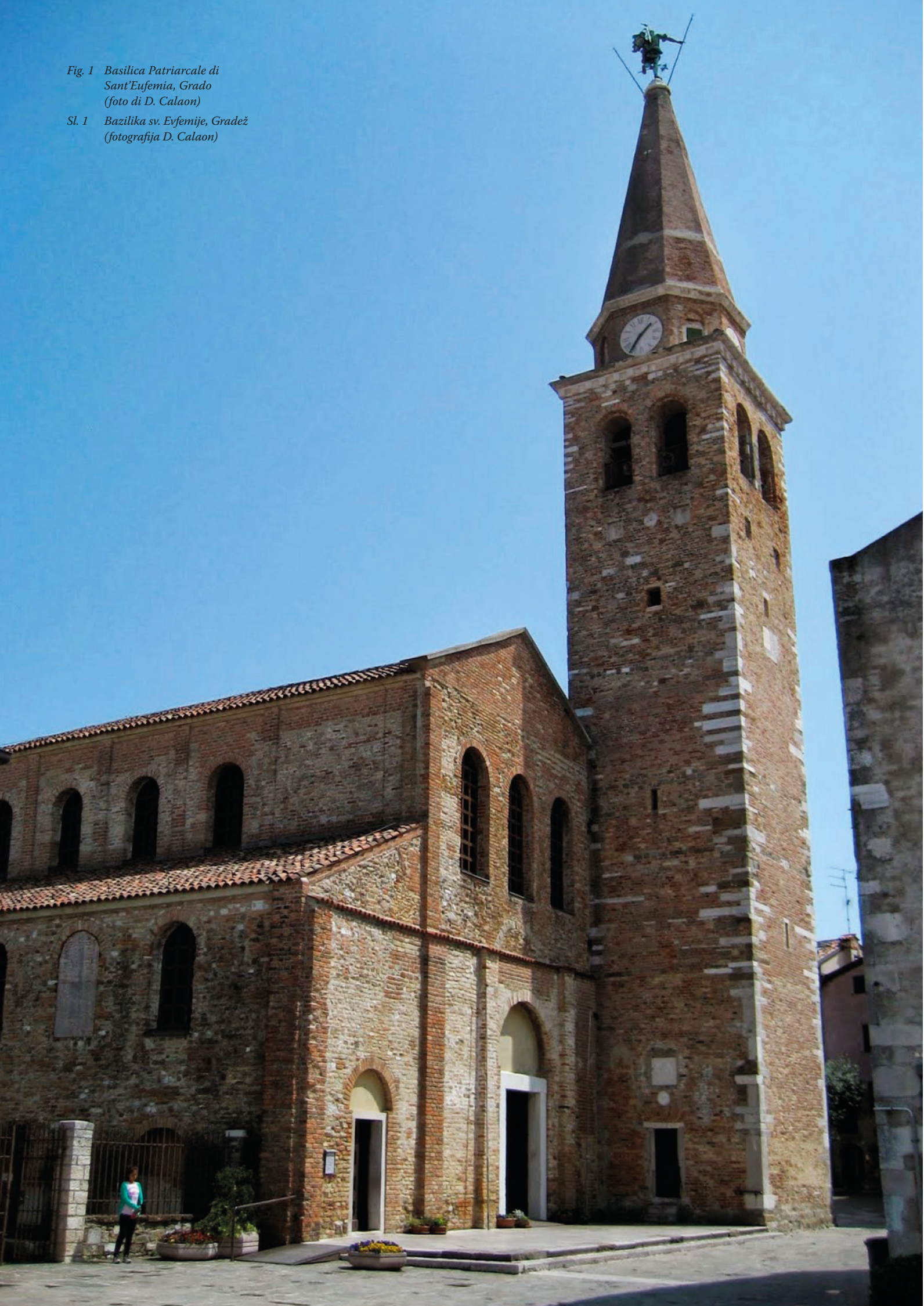
Sl. 1 Bazilika sv. Evfemije, Gradež (fotografija D. Calaon)