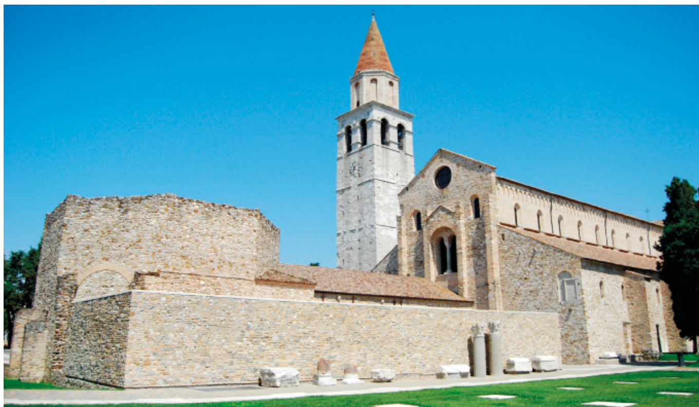
Fig. 2 Basilica Patriarcale di Santa Maria Assunta, Aquileia (foto di D. Calaon)

Istra je znova postala središče trgovskih politik s srednjeveško trgovsko "revolucijo" oziroma z vzponom Benetk. To pa je že druga zgodba.