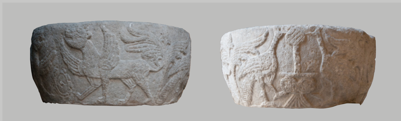
Fig. 3 Bacile in marmo greco, IX secolo