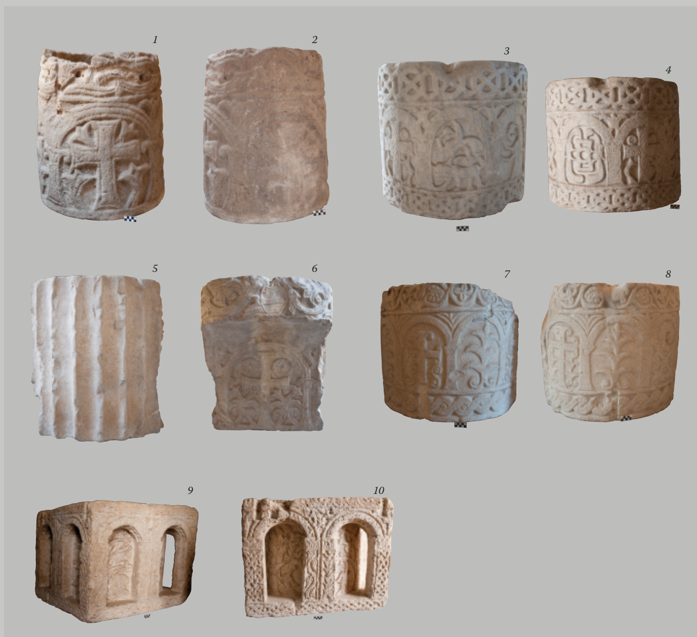
Fig. 2 Vere da pozzo altomedievali, a sezione circolare