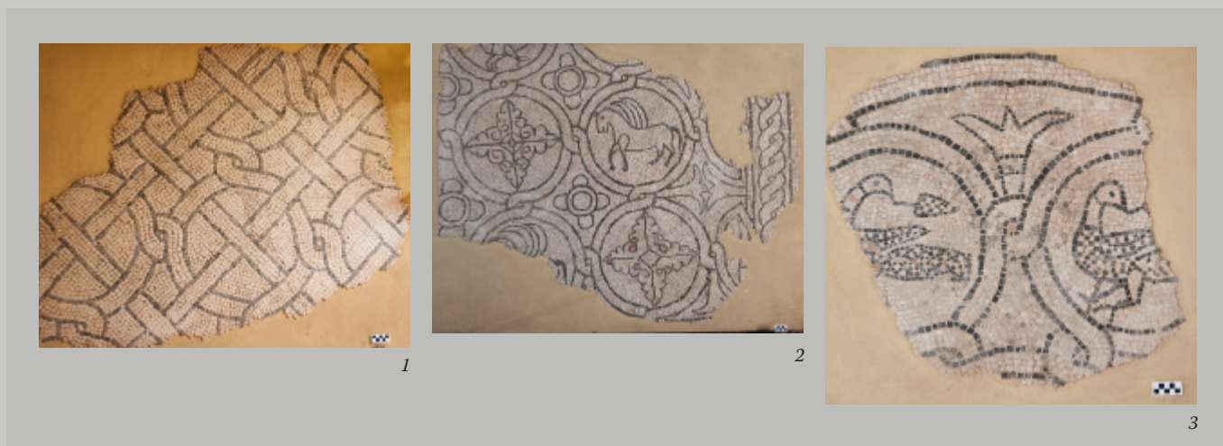
Fig. 4 Mosaici altomedievali dal monastero di Sant'Ilario di Mira