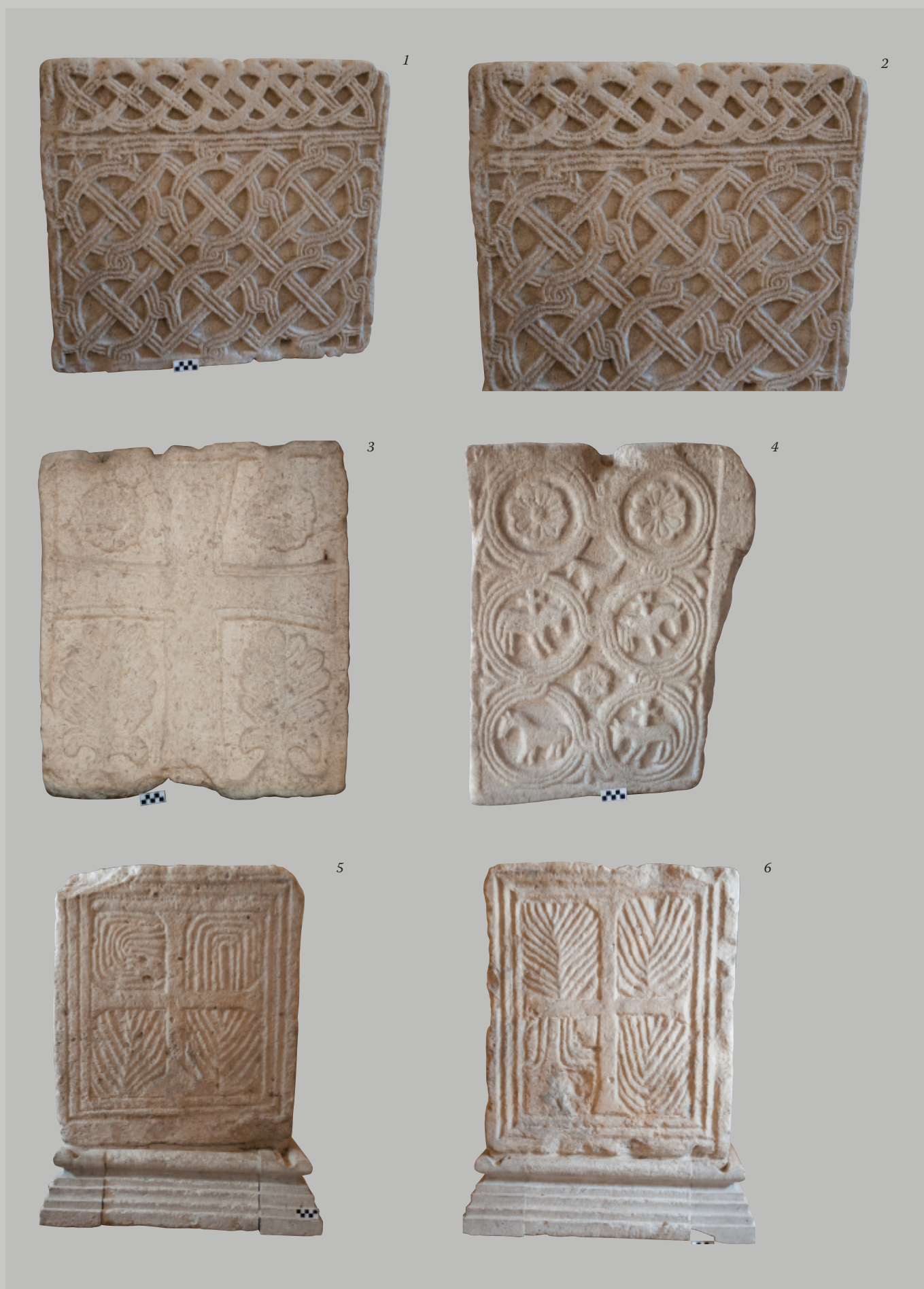
Fig. 1 Vere da pozzo altomedievali, a sezione quadrata