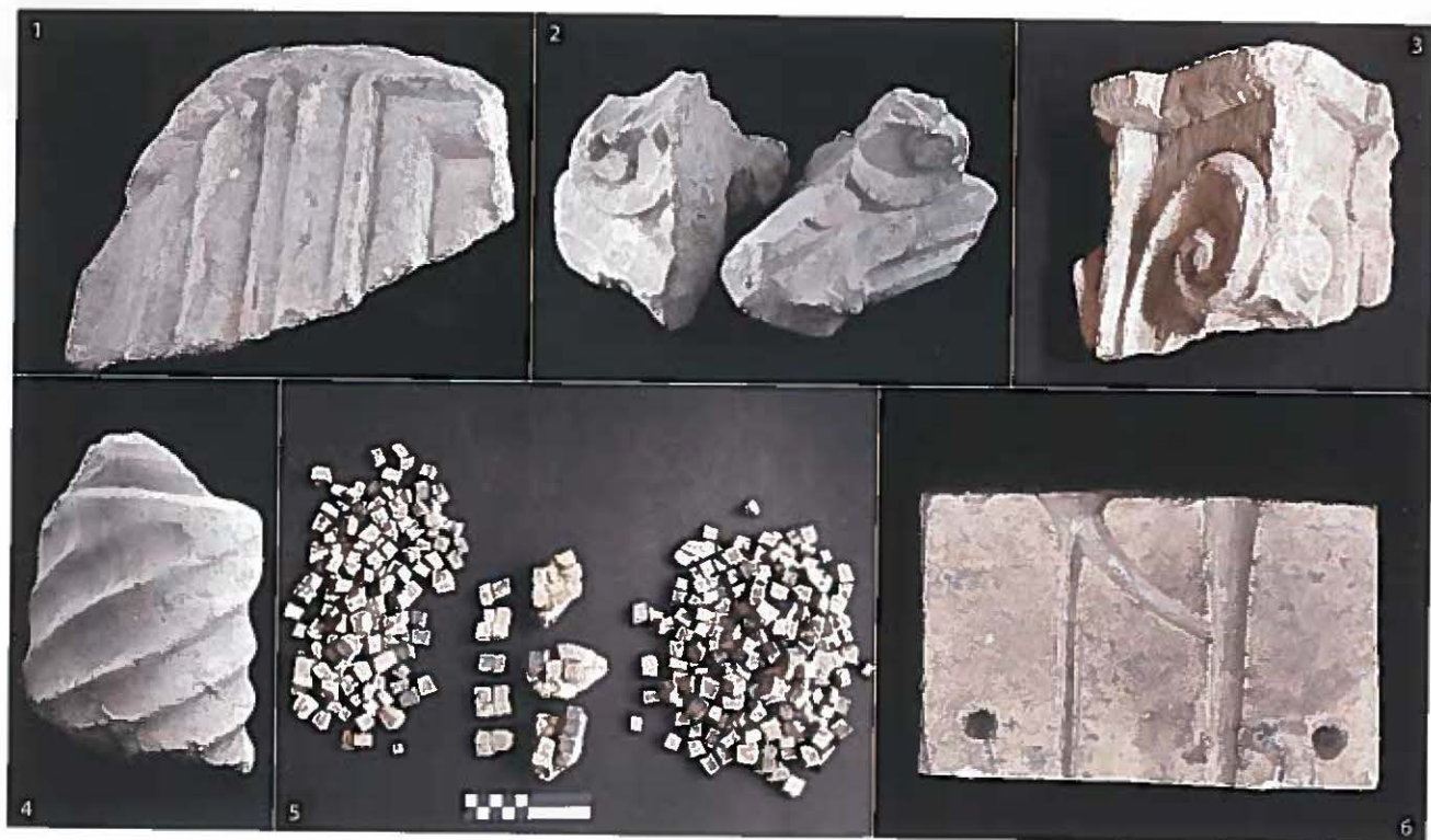
1-2. Frammenti di capitello, fiore d'abaco, nel calato volute e foglia d'acanto spinoso. 3. Frammento di elemento di arredo liturgico. 4. Frammento sommitale di colonnina tortile, levigata. 5. Tessere musive pavimentali in marmo bianco e grigio. 6. Matrice per lettera "N", fasi altomedievali.

Questa sorta di sagrato era realizzato in laterizi e malta e ospitava alcune sepolture privilegiate, con cordoli di contenimento o coperture realizzate con frammenti di laterizi di modulo romano.