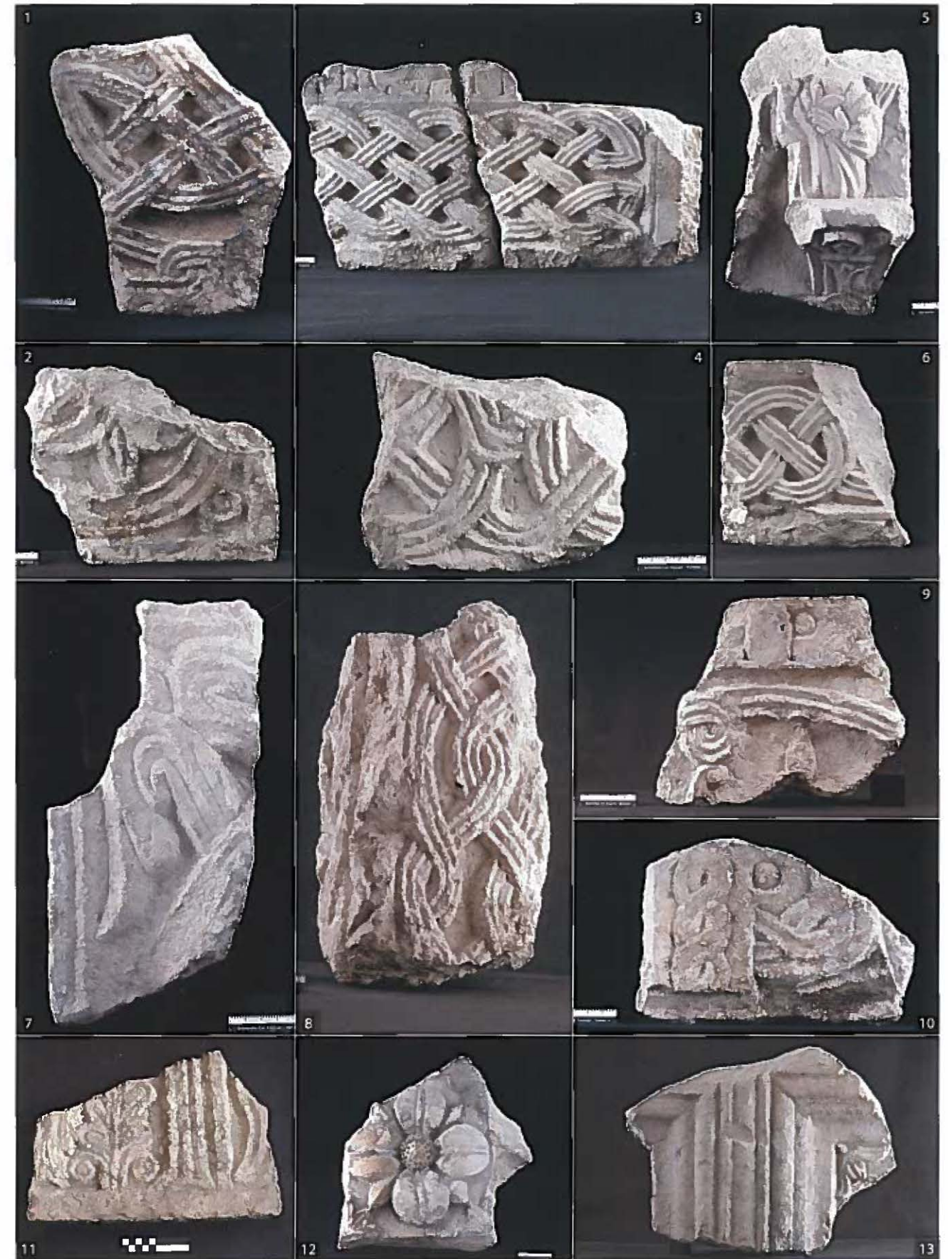
1. Frammento di lastra, motivo decorativo geometrico lineare ad intreccio (maglia di nastri bisolcati). 2. Frammento di lastra o cornice, motivo decorativo ad intreccio e fitomorfo stilizzato. 3. Frammenti di trabeazione con iscrizione dedicatoria e decorazione ad intreccio. 4. Frammento di cornice. 5. Frammento di trabeazione (pergola), con figura togata acefala su semi capitello. Decorazione fitomorfa e geometrica stilizzata. 6. Frammento di cornice (trabeazione), con motivo decorativo geometrico lineare ad intreccio (nastro bisolcato, e treccia a doppio otto). 7. Frammento di cornice, motivo decorativo fitomorfo. 8. Frammento pertinente a pilastro a sezione quadrangolare con tenone, motivo decorativo geometrico lineare ad intreccio. 9. Frammento di cornice o lastra, con motivo decorativo ad intreccio (nastro bisolcato) includente motivo fitomorfo stilizzato; entro listello liscio e con iscrizione mutila. 10. Frammento di lastra, con doppio motivo decorativo ad intreccio (matassa e motivo geometrico di superficie). 11. Frammento di lastra, con motivo decorativo vegetale stilizzato (alberelli ai lati di una croce). 12. Frammento di lastra, con motivo decorativo fitomorfo (fiore iscritto entro quadrato ed apici gigliati). 13. Frammenti di lastra con cornici a riquadro e motivo decorativo ad apice gigliato.