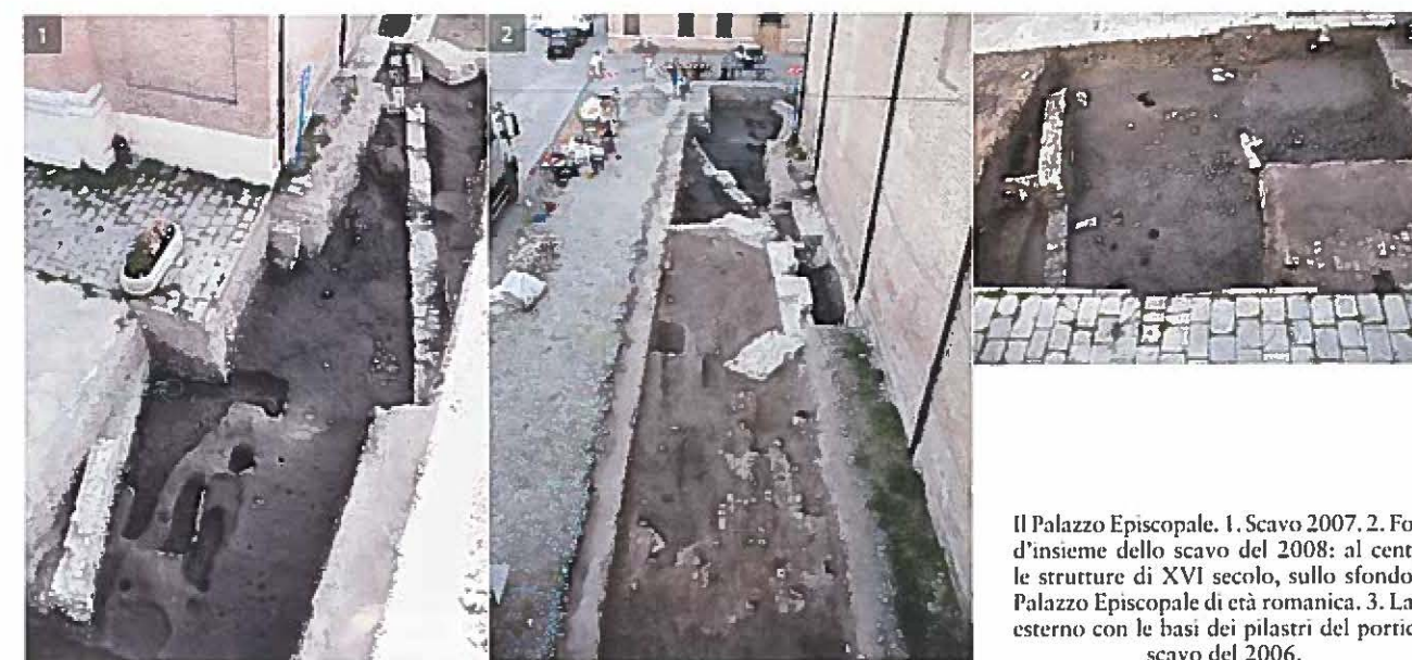
Il Palazzo Episcopale. 1. Scavo 2007. 2. Foto d'insieme dello scavo del 2008: al centro le strutture di XVI secolo, sullo sfondo il Palazzo Episcopale di età romanica. 3. Lato esterno con le basi dei pilastri del portico, scavo del 2006.