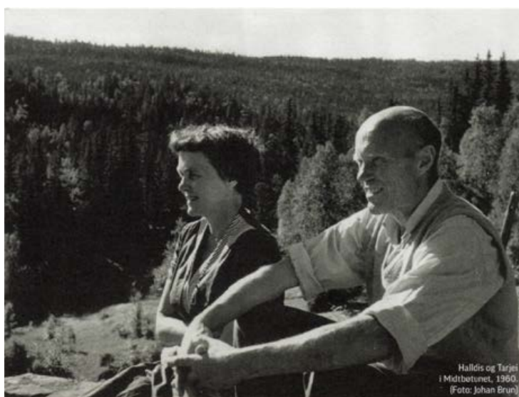
2 - Halldis e Tarjei Vesaas (1960).

Nonostante la posizione d'eccezione che la poetessa ricopre nel canone della letteratura norvegese e la diffusione capillare della sua opera ancora oggi (anche attraverso i canali scolastici, televisivi e radiofonici), è opportuno segnalare come la letteratura critica intorno ad essa non sia particolarmente ricca: sono disponibili alcuni articoli critici e raccolte di saggi commemorativi, a cui va aggiunta la monografia di Olav Vesaas, figlio di Tarjei e Halldis, uscita nel 2007 con il titolo Å vera i livet. Ei bok om Halldis Moren Vesaas (Essere nella vita. Un libro su Halldis Moren Vesaas) 7 .