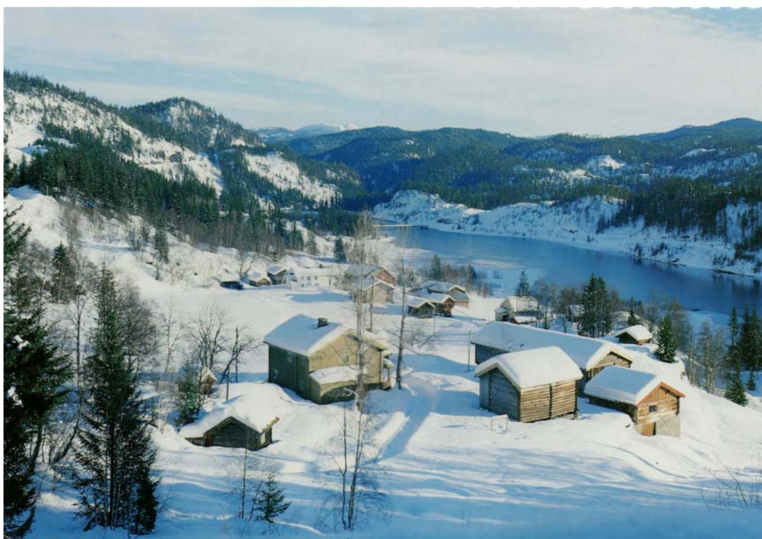
6 - Midtbø in inverno.