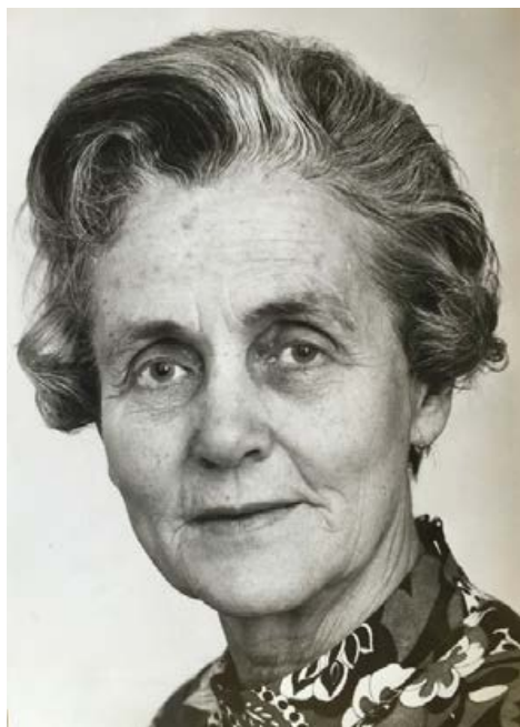
1 - Ritratto di Halldis Moren Vesaas (anni 1970).

Keywords: Guri Vesaas, Halldis Moren Vesaas, New-Norwegian poetry, translation, women's writing