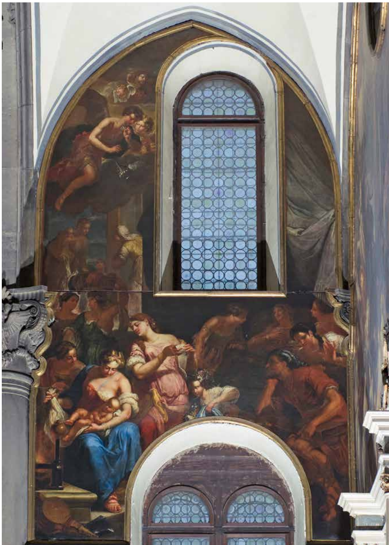
7 Pieter de Coster, Nascita del Battista . Venezia, chiesa di San Zaccaria