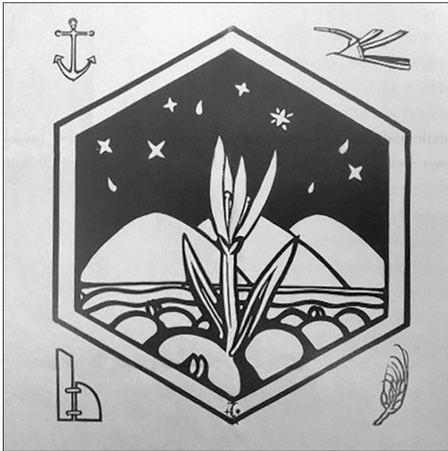
Figura 6. Tullio Garbari, Manifesto della Esposizione d'Arte raccolta nel Palazzo Pesaro a Venezia l'anno 1913 .

di poesia» (Rodriguez 1994, 15, 74-5). Primavera , che viene effettivamente pubblicato poi su La Voce del 17 marzo 1910, trasfigura l'esperienza di una passeggiata a Poggio a Caiano, in un momento in cui tutto è ancora madido di pioggia recente e il pittore intravede una margherita bianca, un tarassaco giallo, qualche viola mammola e le foglie del narciso selvatico, mentre tra il groviglio delle piante in crescita appaiono le colline «brulle, sassose, ferrigne», con le case che si arrampicano sui loro fianchi, con vicini cipressi e vigne ancora secche: solo in quel momento la sua anima è «pervasa di luce e di germinazione» e egli ha la perfetta sensazione che quella verità che fino a ieri cercava sui libri ora davvero la sente «concreta in questa serenità di primavera».