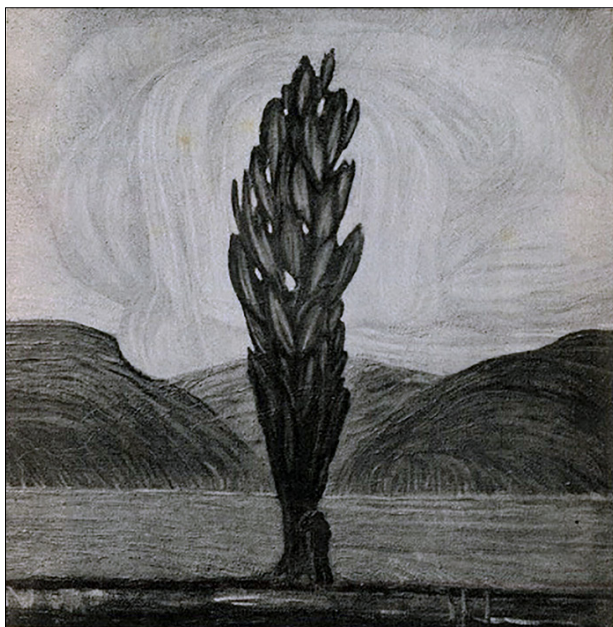
Figura 4. Tullio Garbari, Invocazione . Foto da Esposizione di Palazzo Pesaro 1913