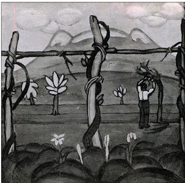
Figura 5. Tullio Garbari, Primavera trentina o Invocazione .