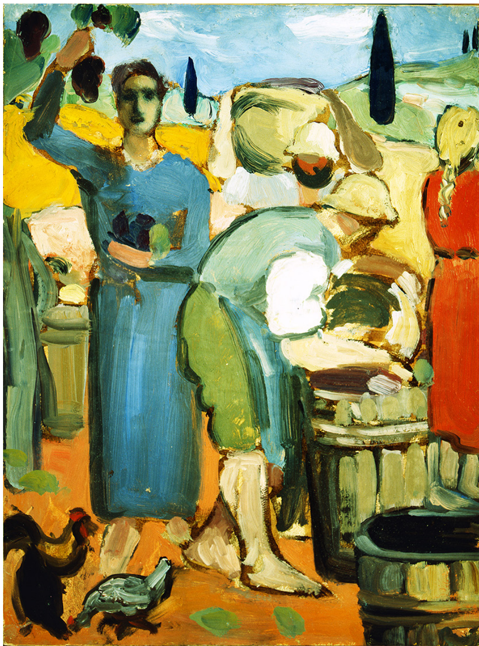
Figura 2. Ardengo Soffici, Scena di vendemmia . 1907. Olio su carta riportata su tela, 50 × 35 cm. Vicenza, Collezione Banca Popolare di Vicenza