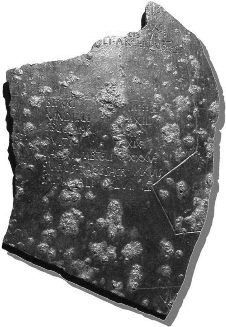
Fig. 5 Forma B (da Cavalieri Manasse-Cresci Marrone 2015a, 13 tav. I)