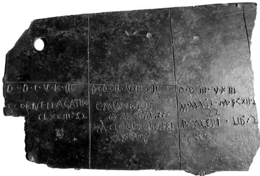
Fig. 1 Forma A (da Cavalieri Manasse-Cresci Marrone 2015a, 19 tav. VIIa)