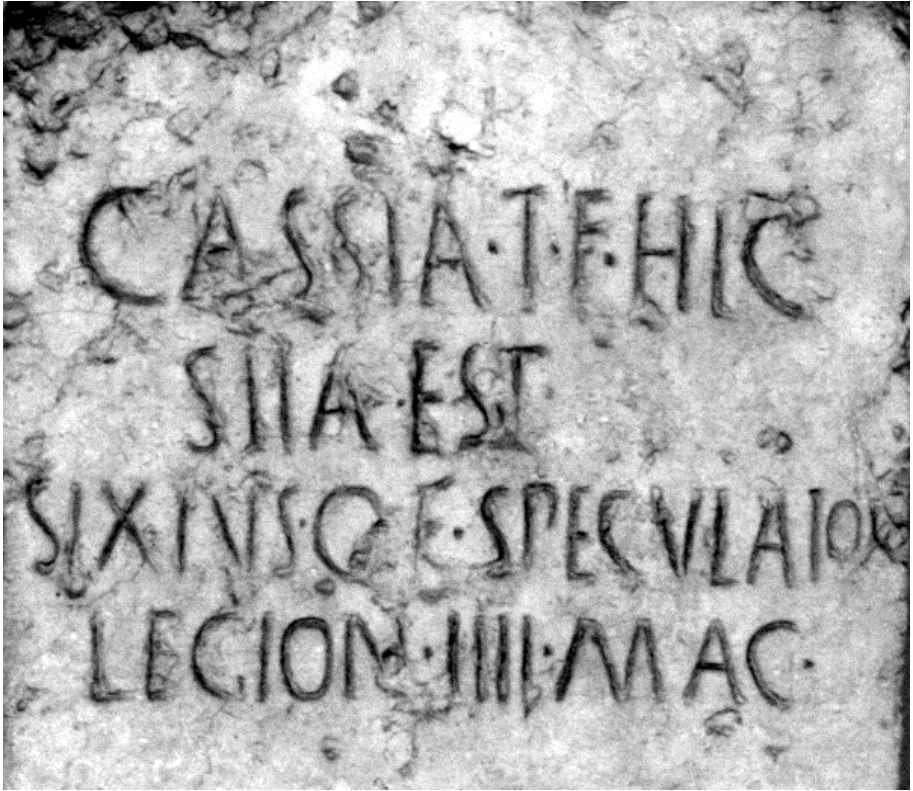
Fig. 2 Il cippo funerario da Illasi. Particolare dell'iscrizione (da Cavalieri Manasse 2000, fig. 4)