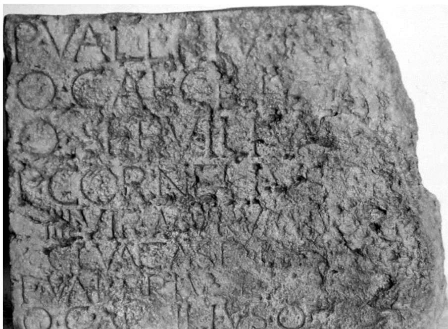
Fig. 3 L'iscrizione di Porta Leoni