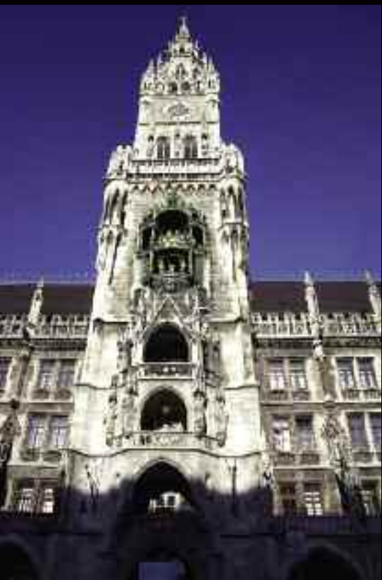
In alto: la Torre dell'Orologio a Monaco di Baviera. In alto a destra: L'orologio della Torre Maurizio a Orvieto. A destra: L'orologio del Palazzo Comunale di Praga.