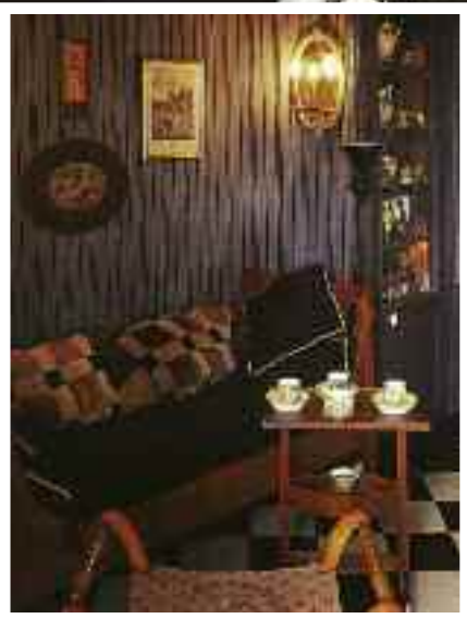
La "stanza degli oggetti" in cui Ravel aveva raccolto le sue collezioni di soprammobili e di ninnoli.