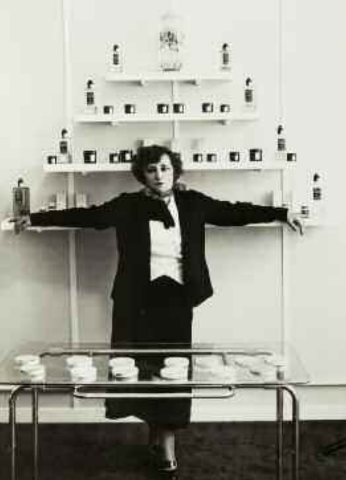
Colette, autrice del testo dell' Enfant et les sortilèges , fotografata intorno al 1924 nel salone di bellezza che aveva aperto a Parigi.

tesco innescato dal sarrusofono nell' Heure , entra un contrabbasso nel registro acuto con una frase pentafona, mescolando la funzione arcaica di una vox principalis a quella modernistica di realizzare un cozzo modale pungente. In pochi secondi due epoche si sono scontrate annullando qualsivoglia condizionamento temporale, consentendo inoltre a Ravel di attuare un gioco ironico sottile fra l'enorme contrabbasso, che canta in falsetto, e l'essere umano piccino che si agita in scena.