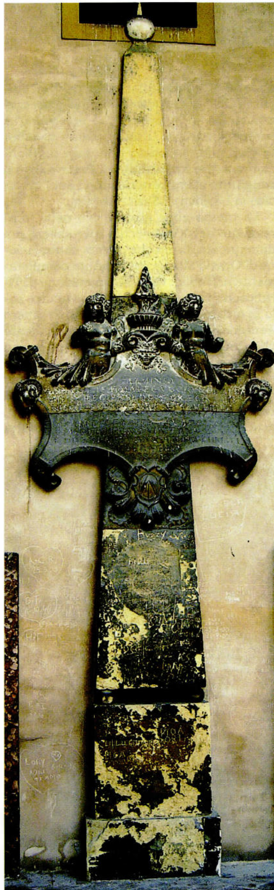
Monumento funebre di Flaminio Malaguzzi, Padova, chiostri della Basilica del Santo.