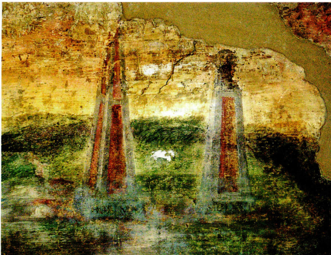
Anonimo reggiano del XVI secolo, affreschi della villa del Mauriziano, particolare della camera dell'Ariosto.

dovrebbero spettare a Lorenzo Rubini (il fratello plastificatore Gian Gerolamo infatti era già deceduto nel 1560). Nel corso della loro lunga attività a Padova, inoltre, i fratelli lasciarono alcuni significativi sepolcri proprio alla basilica del Santo. In particolare il monumento a Simone Ardeo del 1548 ha in basso in funzione di mensola «due putti metamorfosati in foglie d'acanto» (29) attorno a uno stemma a cartigli, quasi gemelli degli omologhi del monumento Malaguzzi sempre al Santo. Questi elementi, peculiari dell'arte dei due scultori trentini, ricorrono anche nel monumento Trombetta, mentre l'apparato decorativo con maschere e «nastri serpeggianti» sono ancora aspetti distintivi dell'opera dei Grandi, presenti in maniera quasi paradigmatica anche nel sepolcro di Flaminio. Non solo; la maschera con nastri del monumento del conte reggiano trova, sebbene su scale diverse, una stret-