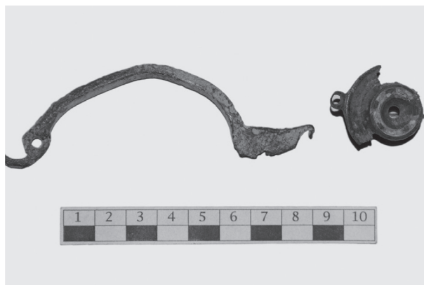
FIG. 3. RINVENIMENTI BRONZEI.

serendosi nel fenomeno della ‘fine delle ville’ ben testimoniato nel territorio bresciano e sul Garda. 12