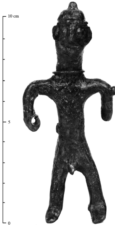
FIG. 3. : Altino, località Fornace, bronzetto di guerriero con elmo celtico e torquis in filo d'argento al collo.

A partire dal III secolo a.C., e più chiaramente con il secolo successivo, si verifica l'inserimento Cenomane nel comparto a sud-occidentale, che tradizionalmente aveva svolto il ruolo di confine con il mondo etrusco-padano, sull'asse Oppeano-Gazzo 25 . Il popolamento sparso di nuclei non rilevanti è ben documentato attraverso il rinvenimento delle necropoli, dove emerge un panorama, che, pur rivelando differenziazioni e specializzazioni, manifesta una considerevole omogeneità di riferimenti culturali, costituiti, per le élites, dagli status symbol del mondo etrusco padano, soprattutto nell'adozione del vasellame bronzeo da mensa. La comparsa di deposizioni con panoplie anche complesse, denota la salda acquisizione del potere e diventa una cifra di questo territorio che, tra II e I sec. a.C. si riconosce probabilmente nel polo di Verona 26 . I Cenomani rappresentano ormai un interlocutore ineludibile per i Veneti, con cui intrattengono un'alleanza allargata alla sfera romana, in chiara discontinuità con altri gruppi celtici.