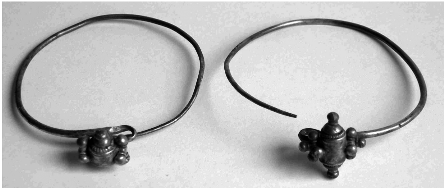
FIG. 2 : Padova, via Tiepolo 1990-1991, tomba 32, gli orecchini a terminazione complessa in argento.

Nel quadro della circolazione degli elementi di prestigio, inizia con il LT B1/B2 e perdurerà fino al C2, la circolazione di una gioielleria che si avvale di metallo prezioso e pasta vitrea, non usuale nel panorama locale 15 . Accanto alle fibule, si annoverano gli orecchini in oro o in argento a terminazione complessa (nella tipologia più e meno articolata) e armille in pasta vitrea. Gli orecchini a terminazione complessa, numerosi a Este, ritenuto un centro di elaborazione del modello, ma noti anche a Gazzo Veronese e Padova (FIG. 2), si distribuiscono in settori 'periferici' della pedemontana, anche in alcune varianti 16 . Le armille in pasta vitrea compaiono ad Adria in un contesto piuttosto precoce, con un esemplare associato ad una fibula con molla bilaterale, arco rialzato e piede libero, riferibile alla fine del IV sec. a.C. 17 , ma sono più diffuse tra LT B2 e C, quando si affermano anche fibule decorate con lo stile vegetale continuo, pur in una accezione tarda. Particolarmente prestigiosa è la fibula d'oro da Este 18 , cui si accostano quella in bronzo da Caverzano e quella in argento da Montebello Vicentino, oltre ad un bell'esemplare in argento da Montebelluna 19 .