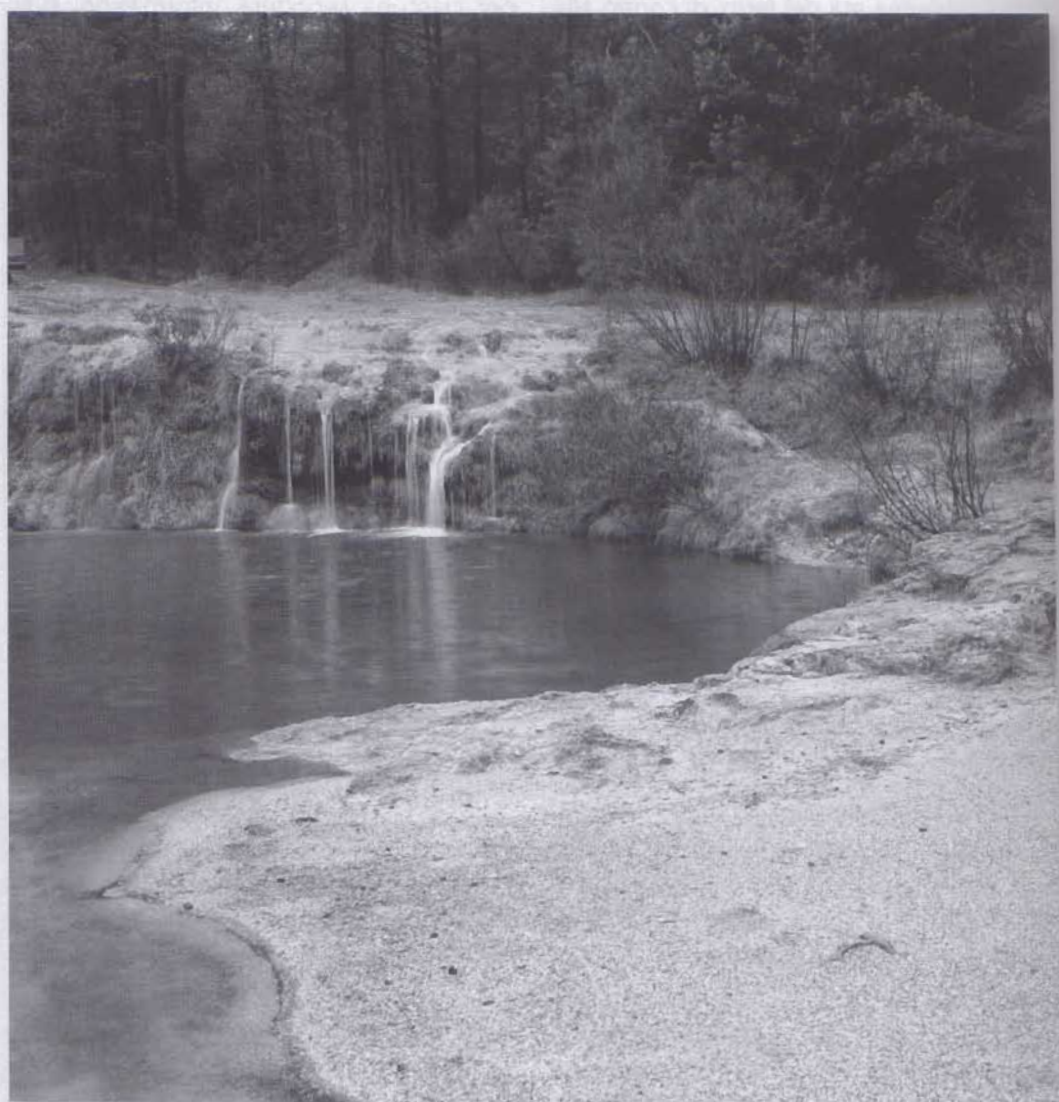
fig. 1 Lagole di Calalzo (Belluno).