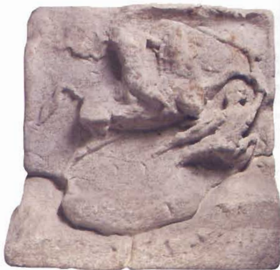
1. Stele Loredan, III sec. a.C., Museo Civico di Padova.