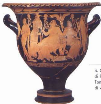
4. Cratere del Pittore di Filottrano dalla Tomba 270 del Dosso A di valle Pega, Spina.

Padova preromana 1976; BONOMI 1986a; BONOMI 1986b; GAMBA 1986; CHIECO BIANCHI 1987; BONOMI 2005; DESANTIS 2006, pp. 68-73; CASINI 2007; BONOMI 2009; CASINI - TIZZONI 2010; BONINI 2014; CASINI - TIZZONI 2014; CONTESSI 2014; ROSSI 2014a; ROSSI 2014b; GAMBACURTA - RUJA SERAFINI C.S.; MALNATI et alii C.S.; MUSCOLINO C.S.