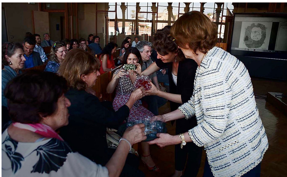
Al termine della Giornata di Studio viene distribuito a tutti i presenti l'elisir dell'immortalità contenuto nella bellissima «bottiglia diatreta».