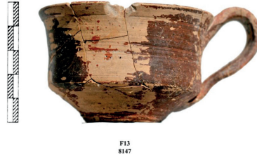
Fig. 8 : Phaistos 2013. Area of the Grotto M. MMII carinated cup.

able to proceed with the removal of the filling done by Levi at the end of his excavations, we tried to clarify the relationship of this cavity with adjacent Protopalatial structures, partly compromised by the construction of several buildings and, maybe, a paved ramp, all dating to the Early Iron Age.