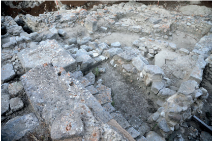
Fig. 7 : Phaistos 2013. Area of the Grotto M. From the North-East.