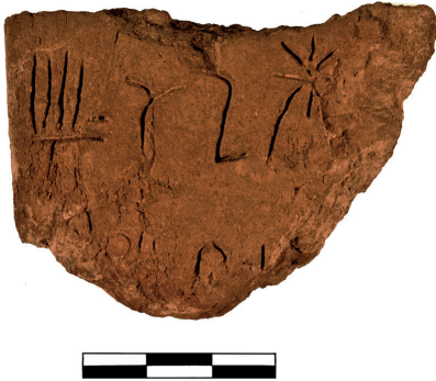
Fig. 4 : Phaistos 2013. North-Eastern Complex. Linear A Tablet.