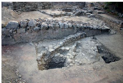
Fig. 1 : Ayia Triada 2011. Area to the North West of the Villa, from the North.