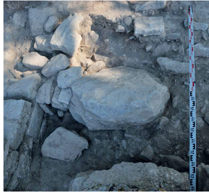
Fig. 5 : Phaistos 2013. North-Eastern Complex. Fallen blocks from the MM IIB/IIIA building (from the North).

Baldi's hypothesis of them being used for the processing of liquids. The Pernier's filling of Room 101-1 included almost exclusively MM III pottery, clearly coming from the same area (according to the way of acting of Pernier). Among this material a linear A tablet was found (fig. 4), which is the second administrative document from Vano 101 (with PH 1) and the third from MM III palace (with PH 3, Militello 2002). These data could confirm our former hypothesis that the processing of liquids was linked with textile production (Militello 2014) and put under the control of the palace.