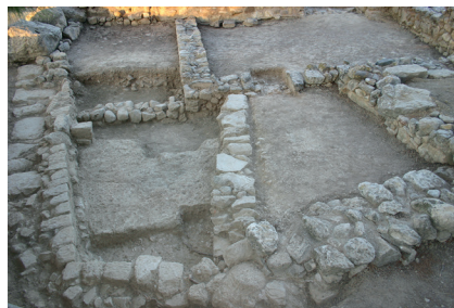
Fig. 2 : Ayia Triada 2012. Room 9 and Shrine E, from the West.

event of 1700 b.C., but present an immediate response to it, corresponding to the Phase of the shrines in Phaistos (final MM IIB).