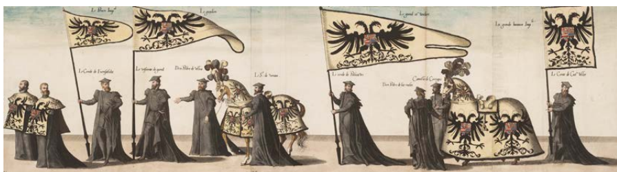
Fig. 5: Joannes e Lucas van Doetecum, da Hieronymus Cock, edito da Christophe Plantin, « La Magnifique et sumptueuse pompe funèbre... 1559 », Corteo funebre in onore di Carlo Quinto, Bruxelles, 29 dicembre 1558, Anversa, Museo Plantin-Moretus, Prentenkabinet, inv. R.44.8 (particolare).