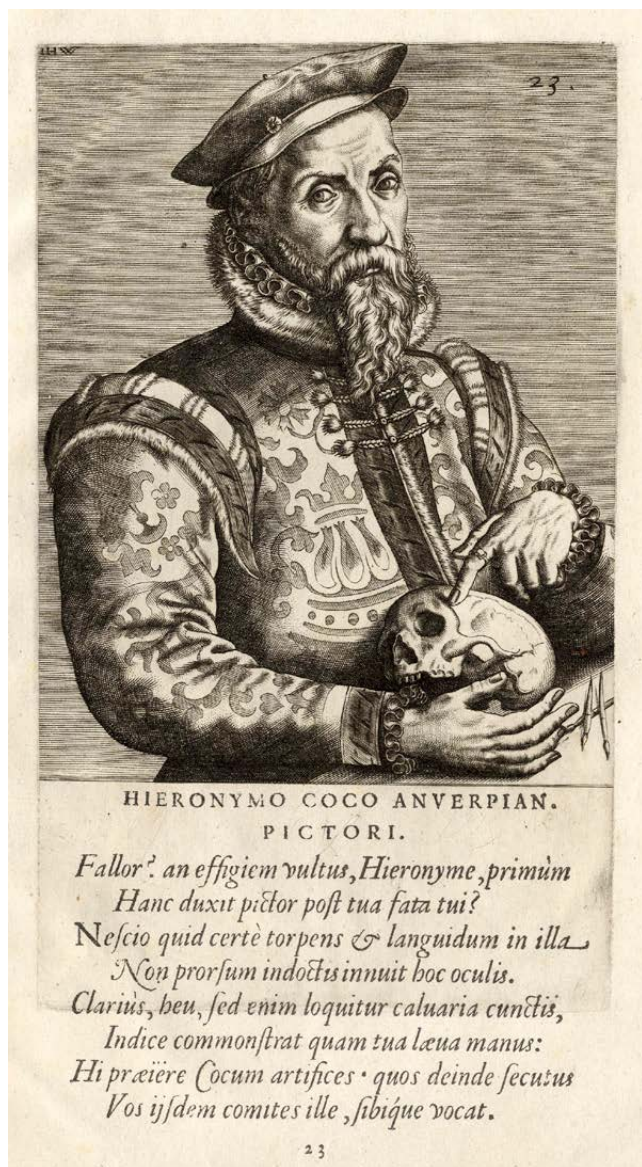
Fig. 2: Johannes Wierix, Ritratto di Hieronymus Cock (estratto della serie Pictorum aliquot celebrium Germaniae inferioris effigies ), Bruxelles, Bibliothèque royale de Belgique, Cabinet des Estampes, inv. V 5434.