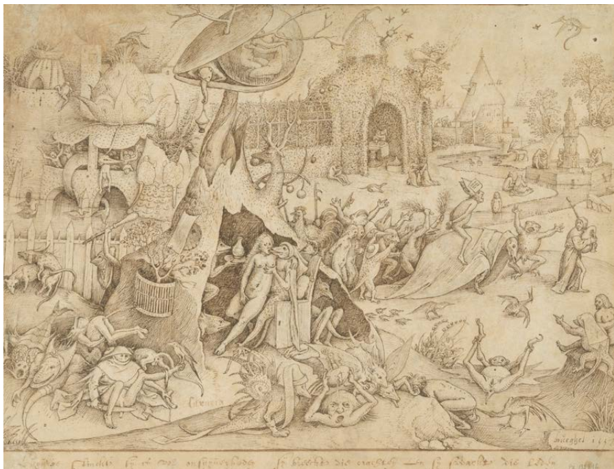
Fig. 4: Pieter Bruegel il Vecchio, Disegno preparatorio per La Lussuria , 1557, Bruxelles, Bibliothèque royale de Belgique, Cabinet des Estampes, inv. S.11 132816.