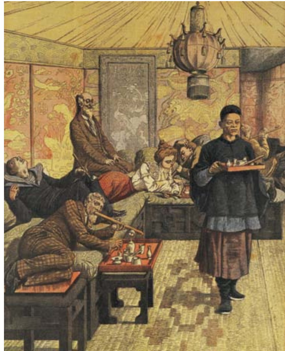
Un vice nouveau (fumeria d'oppio in Francia), in "Le Petit Journal", 5 luglio 1903, cromolitografia, Collezione privata

che facilitò una diffusione epidemica della droga. Alla fine del XIX secolo, i progressi della chimica resero possibile l'estrazione dall'oppio della morfina e, più tardi, dell'eroina. Le nuove sostanze, il cui uso fu reso agevole grazie alle siringhe, vennero proposte come antidoti proprio alla dipendenza da oppio, finendo con il sostituirlo come farmaci ad ampio spettro nella società europea.