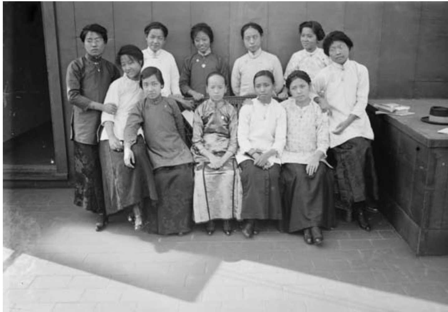
Bain News Service, Gruppo di studentesse cinesi, 1915, fotografia in bianco e nero, Washington DC, Library of Congress

bambine, soprattutto di famiglie povere, e offrirono un esempio influente ai riformisti. Nel 1897 venne fondata a Shanghai la prima scuola femminile non missionaria e, negli anni successivi, istituzioni simili si moltiplicarono soprattutto nei porti aperti esposti all'influenza straniera, sia per iniziativa governativa sia con il contributo dell' élite locale. All'inizio della repubblica, le ragazze iscritte a scuola erano, secondo i dati ufficiali, più di 140.000. Alcune giovani si recarono anche a studiare nelle scuole e nelle università estere.