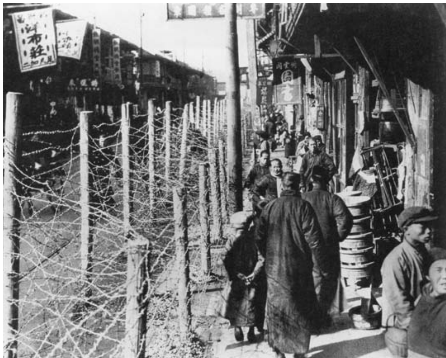
A Shanghai vengono erette delle barriere di filo spinato per difendere le concessioni internazionali, ca. 1925

Nel frattempo, le concessioni straniere organizzavano la loro difesa, pronte a intervenire con la forza in caso di minaccia. In questo frangente, Chiang Kai-shek prese la decisione di reprimere con la forza la protesta e la mobilitazione operaia e sindacale nella città, potendo contare sull'esercito nazionalista ma anche sulla partecipazione di diverse migliaia di affiliati alle organizzazioni mafiose della città, fra cui la famosa Banda Verde, e sull'acquiescenza, o addirittura la complicità, delle autorità delle concessioni.