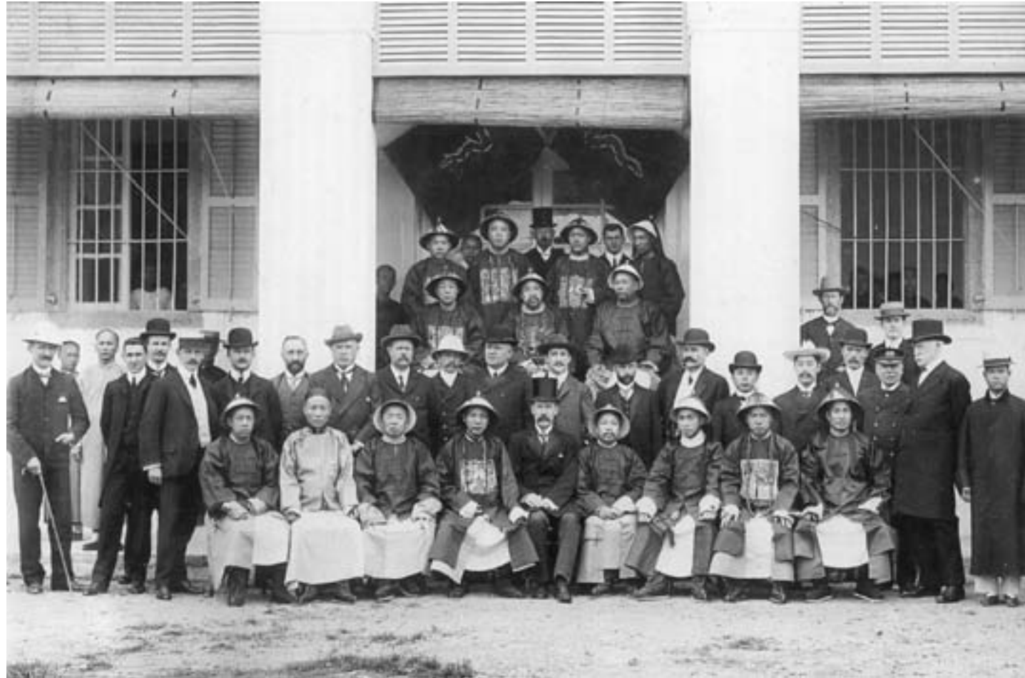
Rappresentanti occidentali e funzionari cinesi a Shantou, ca. 1890, fotografia in bianco e nero, Tokyo, Yoichi Yokobori

Inoltre, nel primo decennio del XX secolo, la posizione sociale dei mercanti, dei compradores e degli imprenditori guadagnò in riconoscimento e in influenza politica a livello locale grazie all'istituzione di nuove forme di coordinamento e di rappresentanza. Le tradizionali gilde mercantili, infatti, vennero gradualmente sostituite dalle Camere di Commercio, modellate su quelle occidentali. Le prime vennero fondate nei porti aperti, come Shanghai e Tianjin: nel 1909, nelle città cinesi, erano già attive quarantaquattro organizzazioni simili. Esse rivestirono un ruolo importante non solo in ambito economico, ma anche sociale, fungendo da organi di rappresentanza politica degli interessi dell' élite commerciale e imprenditoriale, specialmente in relazione alla formazione dei primi governi municipali, istituiti nel contesto della promozione dell'autogoverno locale da parte della dinastia Qing.