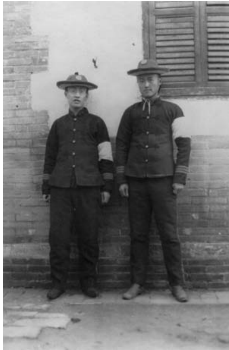
Due studenti dell'Università Imperiale di Pechino portano il lutto al braccio per la morte dell'imperatrice vedova Cixi, 1908, fotografia in bianco e nero

zionare il sistema di selezione dei funzionari e quello educativo. Nei primi anni del Novecento, l'Esercito delle Bandiere, l'organizzazione militare voluta dai sovrani mancesi ancor prima della conquista della Cina nel 1644, venne sostituita dal cosiddetto Nuovo esercito, con il quale si portavano sotto il controllo di Pechino le armate moderne nate nelle province nei decenni precedenti. Inoltre, con la creazione di nuove accademie militari, si sottolineò l'importanza della formazione culturale e delle competenze tecniche degli ufficiali.