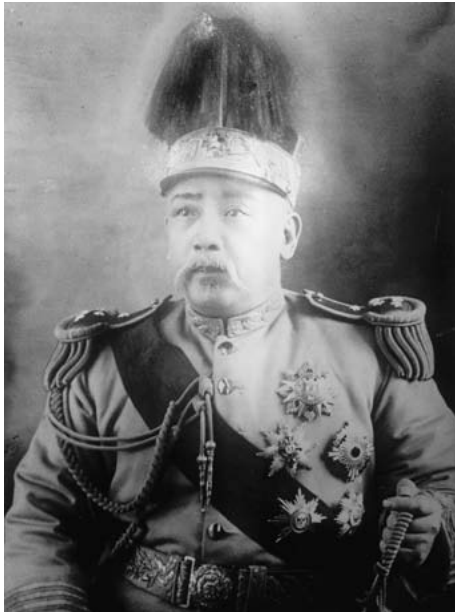
Ritratto di Yuan Shikai, presidente della Repubblica di Cina, 1915, fotografia in bianco e nero

Il 1° gennaio 1912, dopo l'abdicazione dell'ultimo imperatore mancese, Aisin Gioro Pu Yi (1906-1967), veniva proclamata la fine del millenario impero cinese e la nascita della Repubblica di Cina, lo "Stato del popolo cinese", Zhonghua minguo. Agli occhi di molti sostenitori, si apriva una fase nuova, carica di speranze e di aspettative per un futuro migliore: la Cina finalmente si sarebbe liberata dalla pesante eredità del passato e avrebbe trovato il suo posto nella moderna società internazionale, al pari degli Stati occidentali.