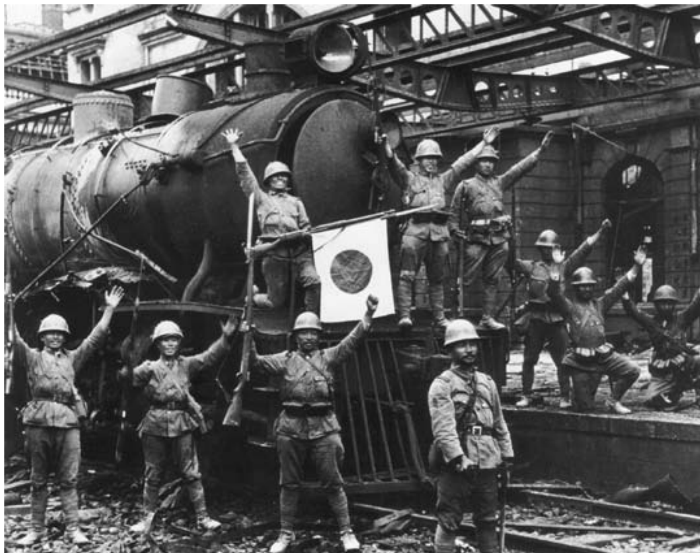
I soldati giapponesi occupano la stazione ferroviaria di Hankou, 1937, fotografia in bianco e nero, New York, Time-Life

e uno dei fondamenti del suo consenso: “Il grido dell’Esercito rivoluzionario nazionale all’epoca della Spedizione verso il nord - rovesciare l’imperialismo - è ora divenuto un crimine”, nelle parole di un leader del movimento per la salvezza nazionale (Schoppa, 2011: 78).