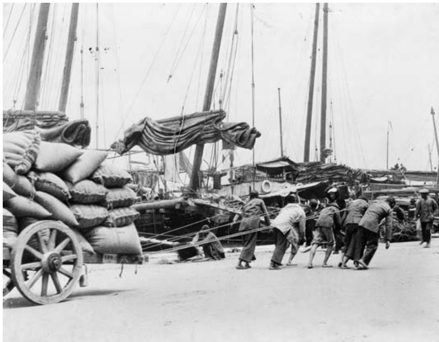
Lavoratori cinesi del porto di Hong Kong, 1890, fotografia in bianco e nero, Washington DC, Library of Congress

in primo luogo da mercanti, e poi quelle di commercianti e lavoratori nelle Chinatown delle metropoli americane e canadesi, lungo le coste del Pacifico e dell'Atlantico. Più recente e instabile era la presenza degli studenti cinesi all'estero, per i quali la permanenza in terra straniera rappresentava un'esperienza temporanea, ma carica di aspettative e di significati sul piano personale e collettivo.