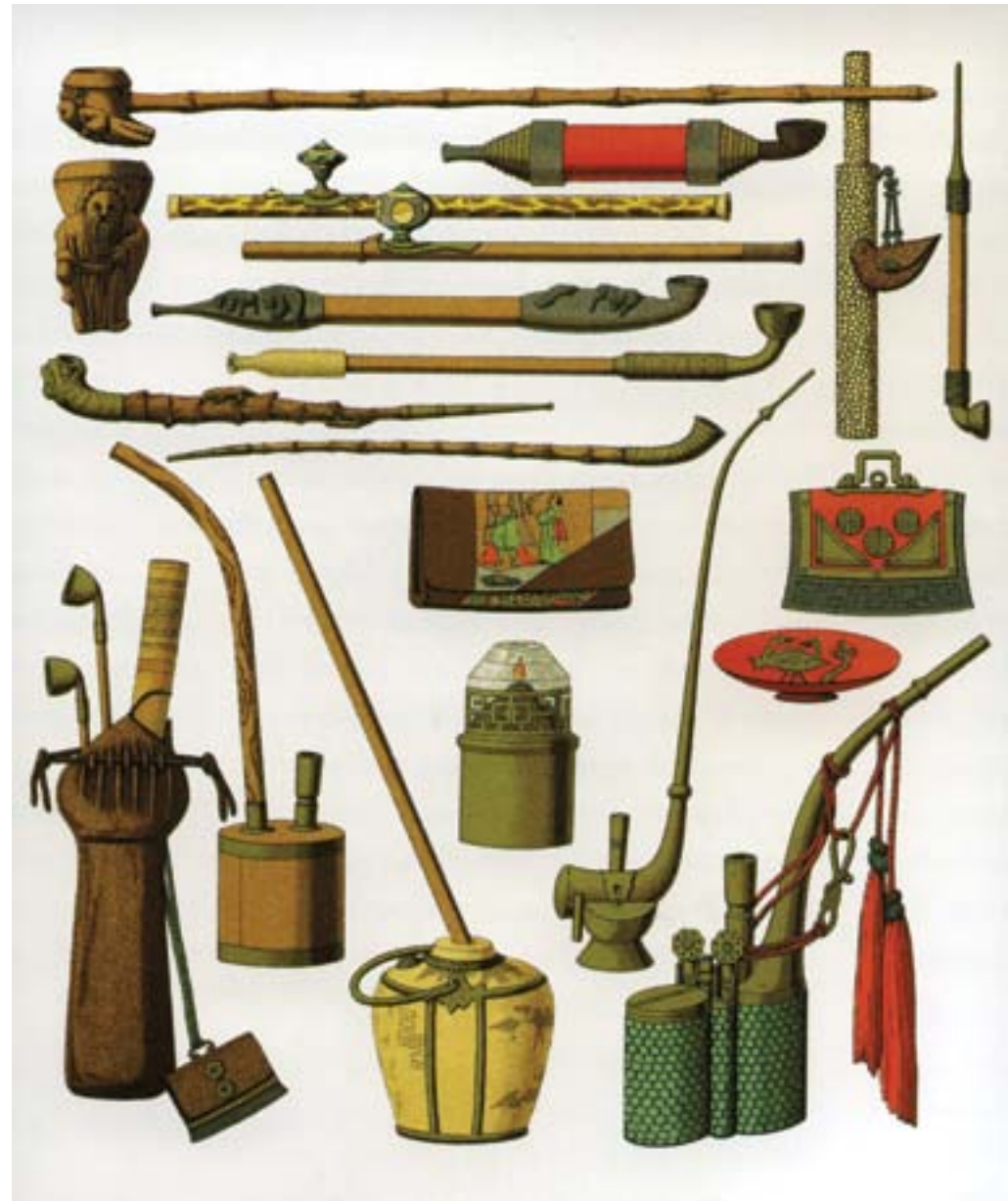
Albert Racinet, Le costume historique . Pipe da oppio, Parigi, 1888, litografia colorata, Londra, Sotheby's

il suo uso era prerogativa dei ceti sociali più agiati e colti, cominciò a essere associata al disordine sociale e alla corruzione. La lotta contro la diffusione del "fumo straniero" nell'impero finì per creare la crisi che portò, nel 1839, allo scoppio di un