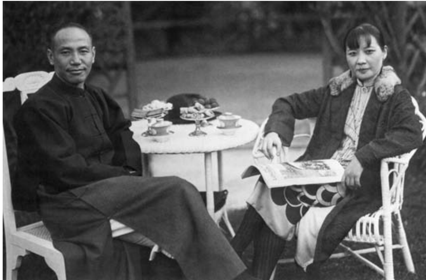
Chiang Kai-shek e Soong Meiling poco prima del loro matrimonio, 1927, fotografia in bianco e nero

Nei vent'anni che intercorrono fra il 1928, quando, con il termine della Spedizione verso il nord, si venne a compiere la riunificazione della Cina sotto il governo nazionalista a Nanchino, e il 1° ottobre 1949, quando Mao Zedong, presidente del Partito comunista cinese, proclamò a Pechino la fondazione della Repubblica Popolare Cinese, la Cina ridisegnò il suo profilo politico e le sue relazioni con l'Occidente e il mondo.