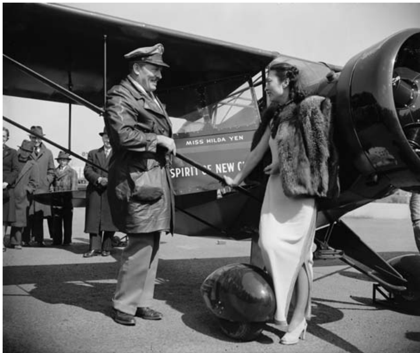
Harris & Ewing, L'aviatrice cinese Hilda Yen riceve in regalo un aereo nuovo dal colonnello Roscoe Turner, 3 aprile 1939, fotografia in bianco e nero, Washington DC, Library of Congress

lavoro fossero punitive, essere operai era comunque ritenuto meglio che vivere del lavoro dei campi, settore in cui la tecnologia produttiva era ancora sostanzialmente arretrata e la povertà, soprattutto in alcune regioni, era endemica. Contemporaneamente il commercio estero continuò a crescere, fino a raggiungere il suo picco massimo nel 1931: l'economia cinese era ormai completamente inserita nel circuito mondiale. Come si è detto, l'oppio indiano era ormai stato sostituito dal cotone come principale prodotto d'importazione, ma anche altre merci, come sapone, grassi artificiali, gomma e resine, divennero sempre più importanti. D'altro canto, la Repubblica di Cina, pur continuando a esportare in modo significativo la seta, il tè e la soia, aveva iniziato a vendere all'estero anche i propri manufatti, soprattutto tessili.