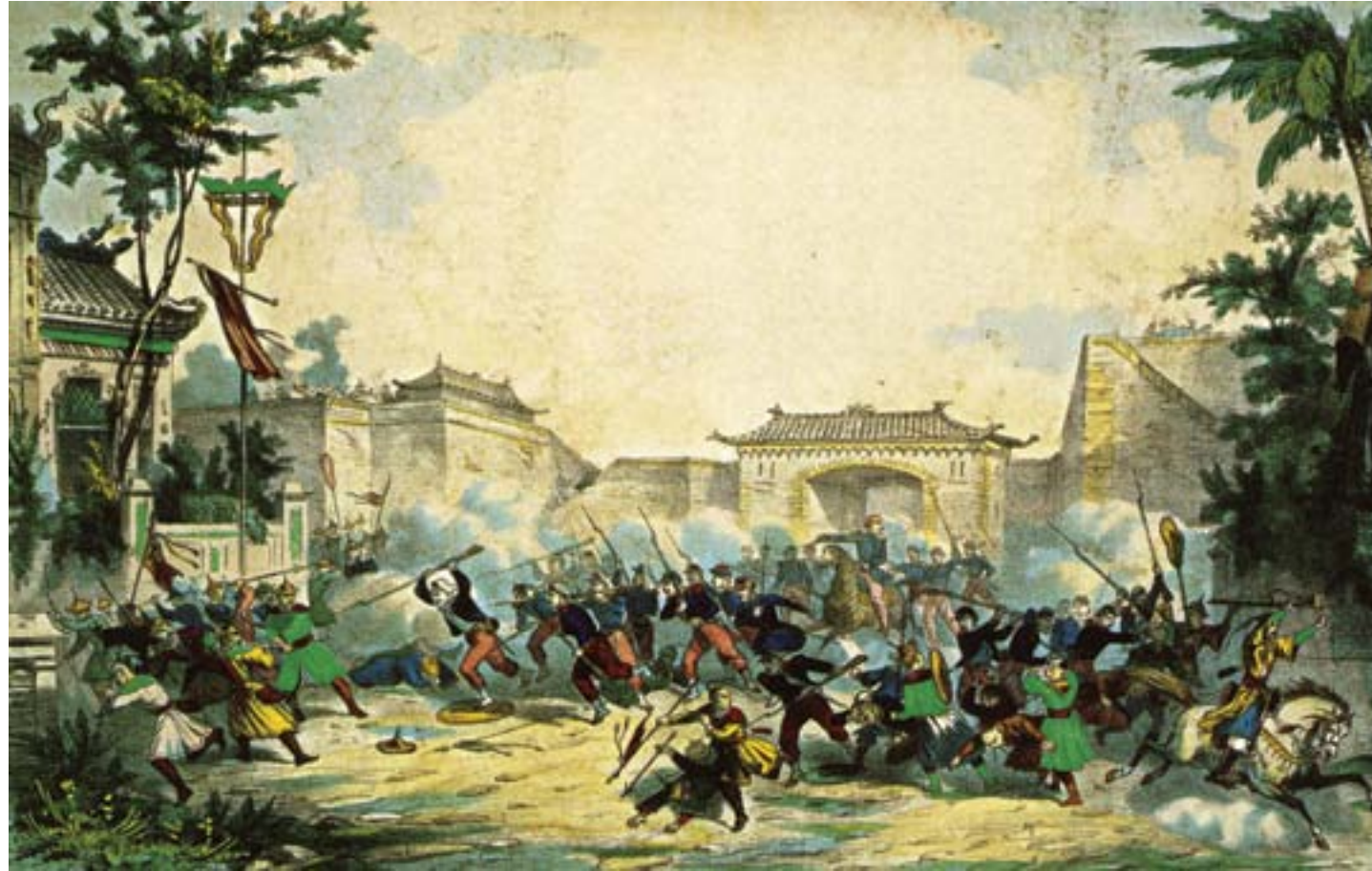
Le truppe francesi entrano a Pechino durante la Seconda guerra dell'oppio, 1861, litografia colorata, Londra, Sotheby's

un proprio regno con capitale a Dali. Poco dopo, nel 1862, iniziò una grande rivolta dei musulmani nel nord-ovest, destinata a durare fino a quasi al termine del decennio successivo, e giunta al punto di istituire, nella regione del Xinjiang ai confini con l'impero zarista, uno Stato indipendente. Neppure questa rivolta rappresentò un pericolo concreto per il trono, legata com'era all'identità etnica e religiosa degli insorti; tuttavia l'evento contribuì a minare la sicurezza dei confini con la Russia, che approfittò della rivolta per estendere la sua influenza nella zona, tanto più che, negli stessi anni, i mancesi subirono una nuova e drammatica sconfitta da parte dei britannici e dei francesi, decisi a ottenere un'estensione dei privilegi guadagnati con la vittoria nella Prima guerra dell'oppio.