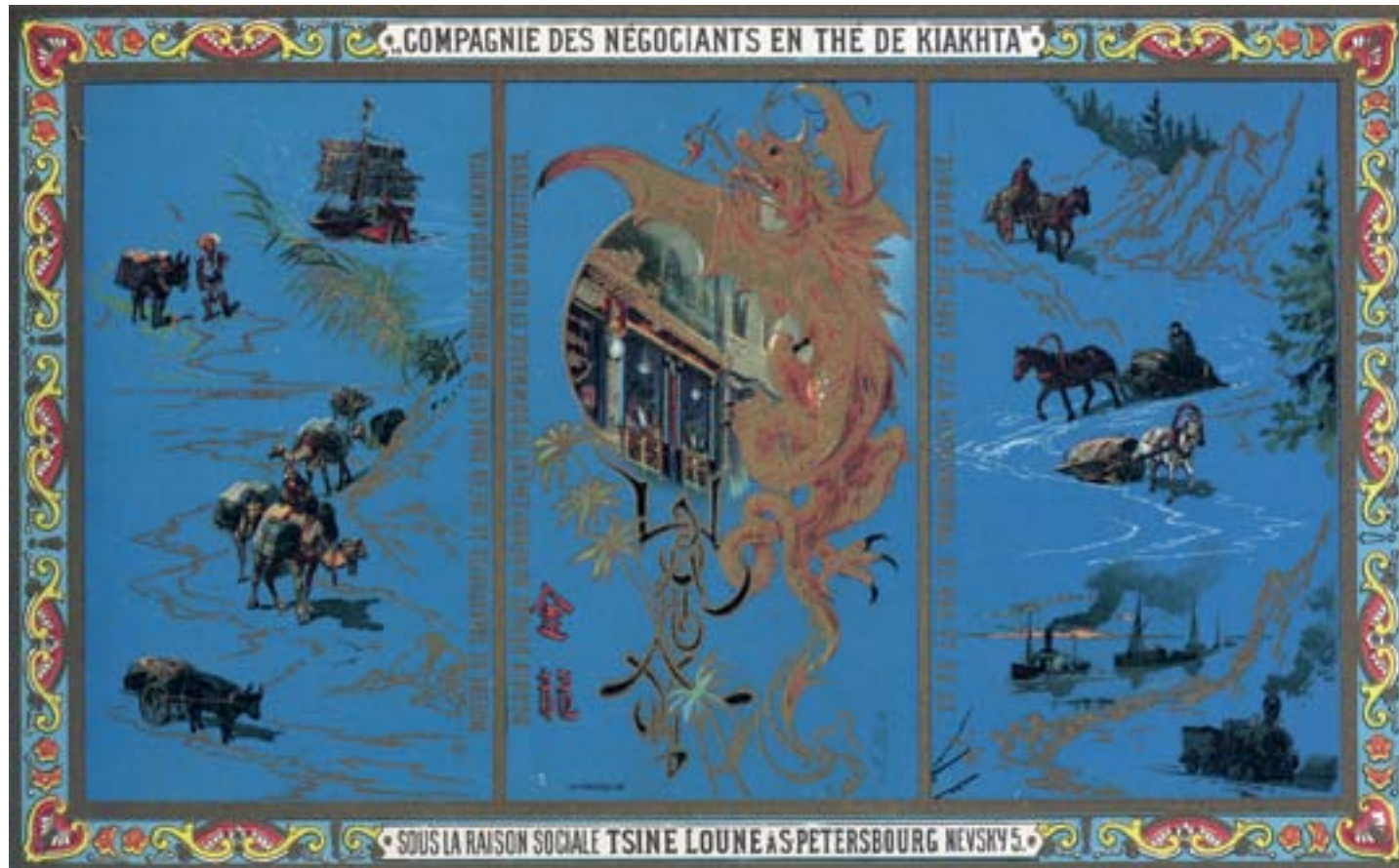
Annuncio pubblicitario della Compagnia dei Mercanti di Tè di Kiakta con i vari mezzi di trasporto utilizzati, ca. 1890, cromolitografia, Collezione privata

trattato, quello di Kulja del 1851, che permetteva la presenza e le attività dei mercanti russi in alcune città del Xinjiang.