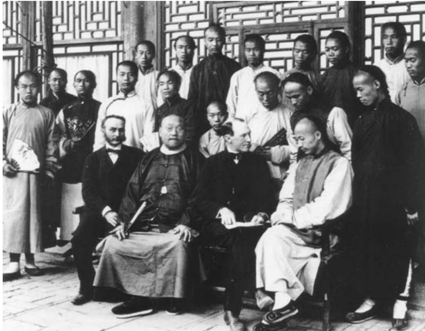
Docenti inglesi e studenti cinesi all'Università Imperiale di Pechino, ca. 1880, fotografia in bianco e nero

le sue aspettative non si concretizzarono. Il progetto ebbe poi termine nel 1881, per i forti dubbi che suscitava nella classe dirigente cinese, preoccupata che la formazione sui classici confuciani - comunque impartita anche agli studenti all'estero - cedesse definitivamente il passo al nuovo sapere.