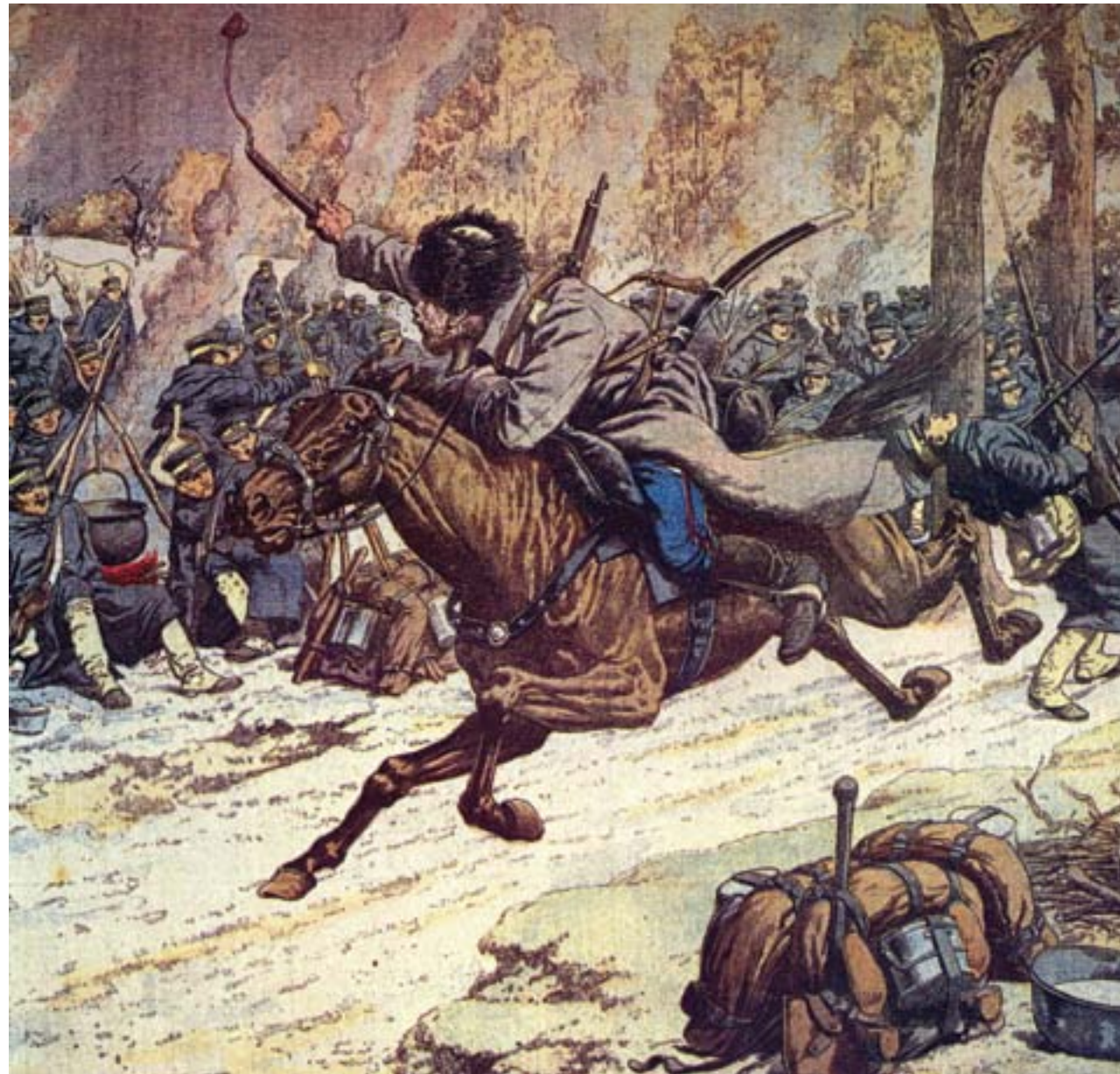
La cavalleria russa attacca un accampamento giapponese nella penisola del Liaodong, 1904, cromolitografia, Londra, Sotheby's

peso demografico. Il problema, ad esempio, era fondamentale anche e soprattutto per la Russia zarista, che vedeva minacciati i suoi progetti di estensione territoriale in Asia centrale e in Siberia dalla contemporanea tendenza all'espansione della popolazione cinese in queste aree.