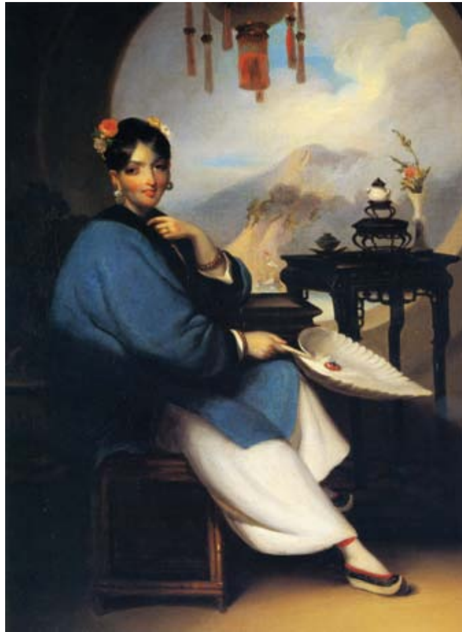
George Chinnery, Ritratto di una bella eurasiatica, ca. 1835, olio su tela, Hong Kong, Museum of Art