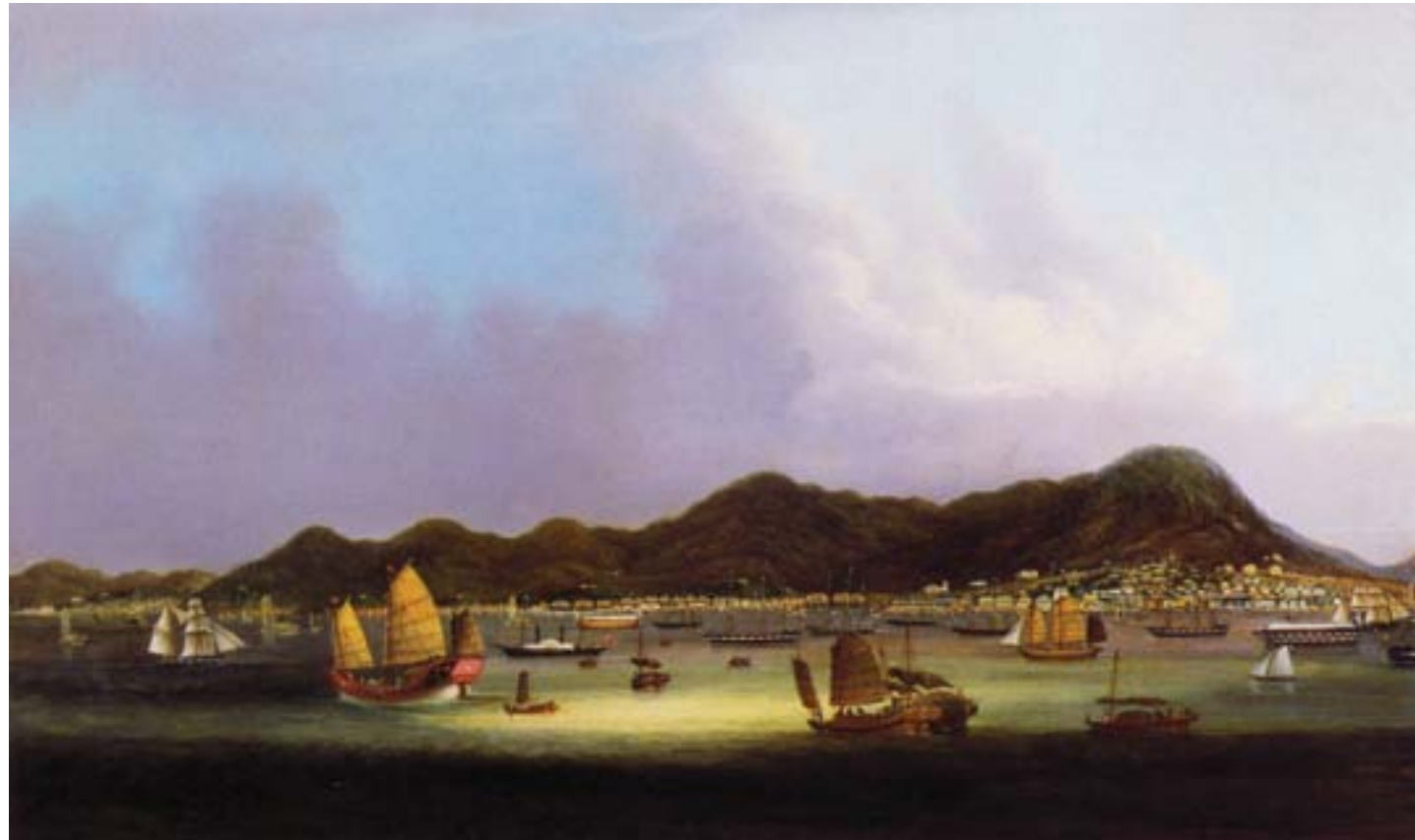
Youqua, Veduta della città di Victoria e del suo porto sull'isola di Hong Kong, ca. 1850, olio su tela, Hong Kong, Museum of Art

importanti cambiamenti. Mentre la seta, il tè e l'oppio rimasero ancora per qualche tempo le merci privilegiate dell'interscambio commerciale fra la Cina e il resto del mondo, altri prodotti, quali il cotone indiano, assunsero un peso maggiore nelle importazioni e la varietà di merci straniere che circolavano anche all'interno dell'impero crebbe significativamente.