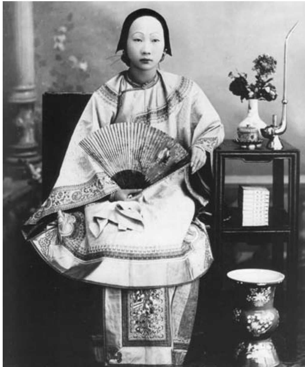
Una donna cinese con i piedi fasciati e la veste di seta, ca. 1890, fotografia in bianco e nero, Malibu (CA), John Paul Getty Museum