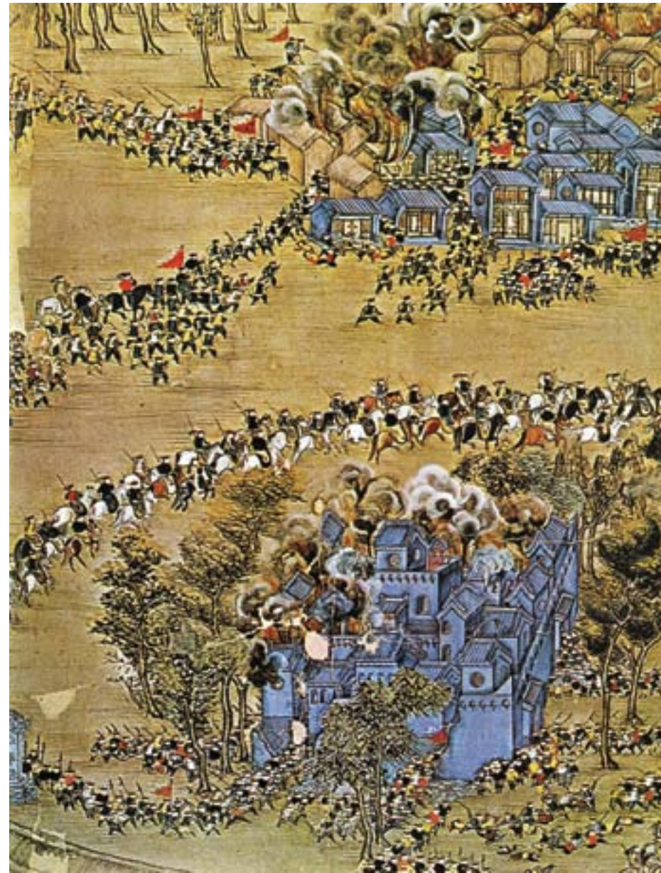
Le truppe dei ribelli Taiping assaltano una città durante la guerra civile, ca. 1860, incisione colorata, Londra, Sotheby's

formazioni a disposizione degli europei mettevano in luce il carattere cristiano del movimento, suscitando inevitabilmente una certa simpatia verso i ribelli.