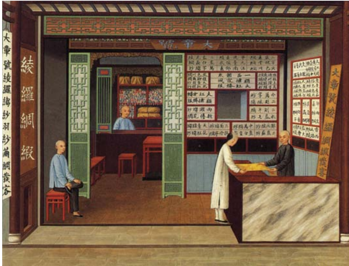
Artista cinese, Interno di una negozio di sete a Canton, ca. 1825, tempera su carta, Salem (MA), Peabody-Essex Museum