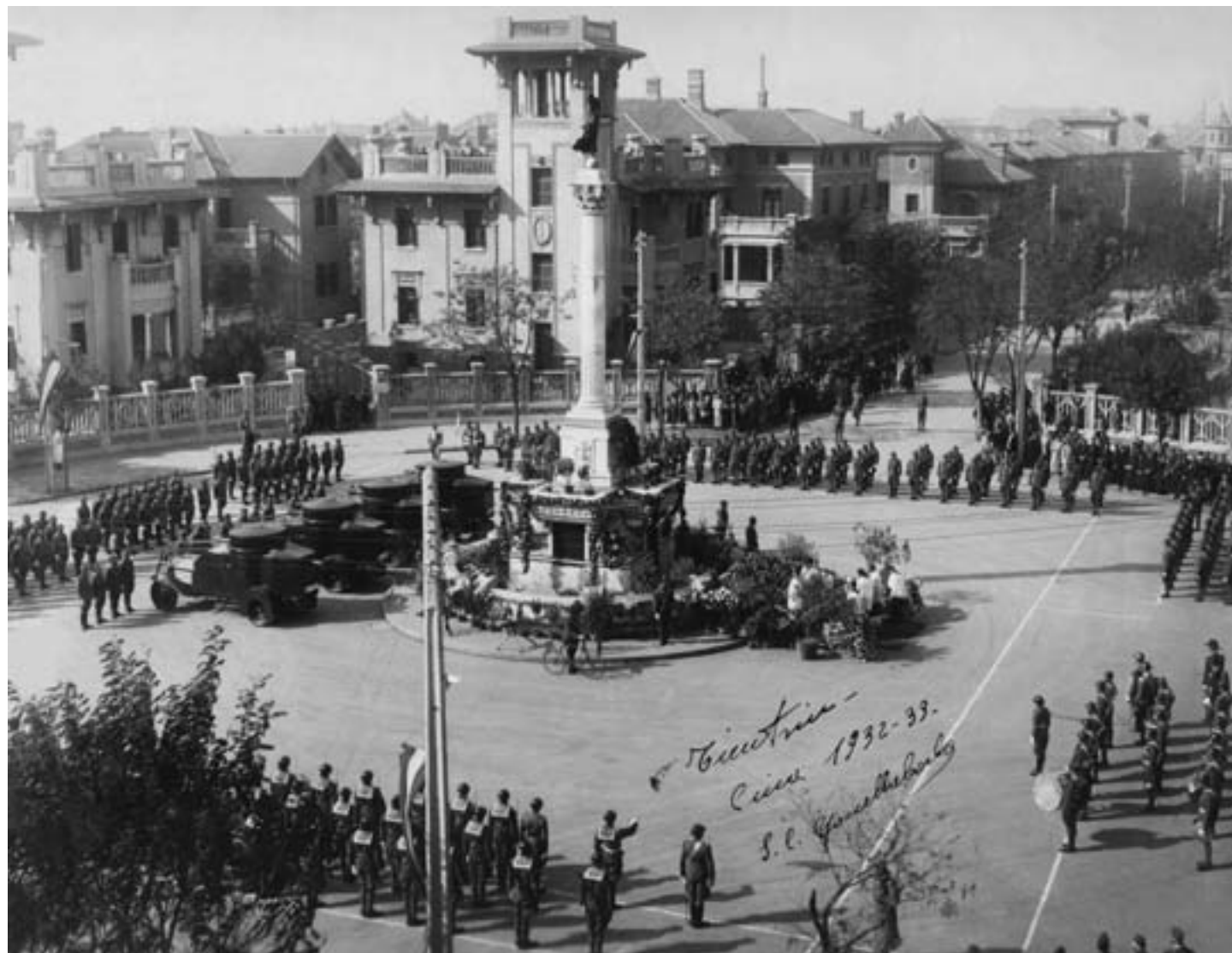
Piazza Regina Elena nella concessione italiana a Tianjin, ca. 1932-1933, fotografia in bianco e nero, Milano, Touring Club Italiano

ricane, elemento che favoriva una continua circolazione d'informazioni e idee fra la Cina e l'altra sponda del Pacifico. Dei più di 40.000 cinesi che si laurearono all'estero in questi decenni, metà aveva studiato negli Stati Uniti e l'altra metà o in Giappone o in Europa. Gran parte dell'ambiente accademico cinese, dunque, aveva un carattere internazionale, anche se il grado di apertura verso l'estero variava a seconda dell'istituzione, dato che nelle discipline umanistiche la tradizione letteraria, storica e filosofica, per quanto sottoposta al vaglio dei nuovi metodi di ricerca, rimase una componente imprescindibile del profilo formativo di docenti e studenti.