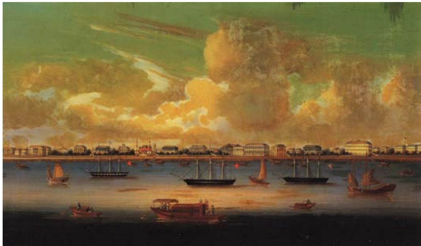
Artista cinese, Veduta della città e del porto di Shanghai, ca. 1847, olio su tela, Hong Kong, Museum of Art

estendere il privilegio dell'extraterritorialità anche ai sudditi cinesi. La "barbarie" della giustizia cinese costituiva, come si è visto, una delle giustificazioni più importanti per il privilegio occidentale in Cina, e, agli occhi europei, una delle prove della superiorità della propria civiltà. A Shanghai la questione dell'amministrazione della giustizia venne risolta, nel 1864, con l'istituzione di una Corte Mista, dove il giudice cinese era affiancato da consiglieri occidentali. La corte doveva giudicare i reati che vedevano coinvolti stranieri e cinesi e quelli compiuti da sudditi Qing nel territorio delle concessioni. Queste ultime finirono così per costituire, agli occhi di molti, delle isole dove proteggersi dal potere imperiale. Per molti cinesi, registrarsi presso le autorità di Hong Kong o risiedere nelle Concessioni poteva rappresentare una forma di salvaguardia contro le pretese dei funzionari Qing, ma anche una comoda copertura per attività poco lecite.