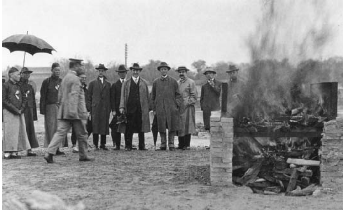
Distruzione di oppio a Shanghai per contrastare la diffusione della droga, ca. 1920, fotografia in bianco e nero, New Rochelle (NY), Grace Rothstein

re dall'extraterritorialità, considerati come diritti acquisiti e garantiti dalle norme internazionali. Gli Stati Uniti non modificarono neppure la loro politica di limitazione ed esclusione della migrazione cinese sul loro territorio. La giovane repubblica, tuttavia, ottenne anche una prima vittoria significativa, soprattutto sul piano simbolico: nell'aprile del 1913, infatti, la Gran Bretagna decise di mettere fine al commercio dell'oppio indiano in Cina.