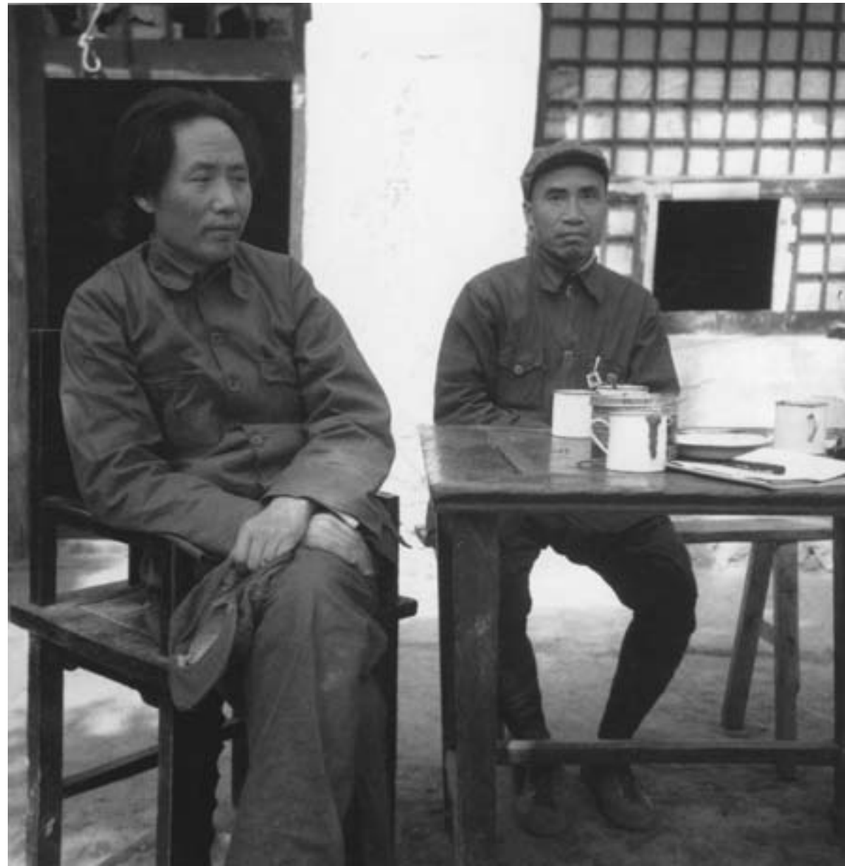
Helen Snow, Mao Zedong e Zhu De, rispettivamente capo politico e capo militare dei comunisti, a Yan'an, 1937, fotografia in bianco e nero, Hong Kong, Kan Yuet-keung Collection

a distinguersi da Chiang Kai-shek per il loro patriottismo. Dopo anni in cui gran parte delle loro attività si erano trovate inevitabilmente alla periferia rispetto alle dinamiche politiche domestiche e globali, potendo contare solo sull'alleanza e sull'appoggio limitato di Mosca, si stavano creando le condizioni per una nuova proiezione nazionale e internazionale, e per una più accentuata emancipazione dall'egemonia sovietica sul piano politico e ideologico.