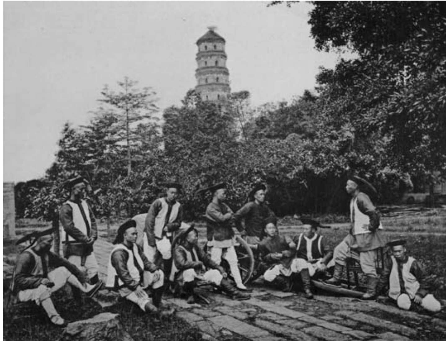
John Thomson, Soldati dell'esercito imperiale cinese con un pezzo d'artiglieria leggero, ca. 1870, fotografia in bianco e nero, New York, Public Library

Nel periodo successivo alla Seconda guerra dell'oppio parte della classe dirigente cinese divenne consapevole della necessità di affrontare un processo di rafforzamento istituzionale e militare al fine di mettere la dinastia Qing in grado di confrontarsi con i paesi occidentali. L'affermazione dell'ordine imperiale sulle grandi ribellioni, sconfitte soprattutto grazie all'adesione delle élite locali all'appello in difesa dei valori confuciani avanzato da Zeng Guofan, Li Hongzhang e altri grandi governatori provinciali, si accompagnò dunque all'avvio di un programma di modernizzazione noto come yangwu yundong , cioè "movimento per gli affari d'oltremare" o "occidentali".