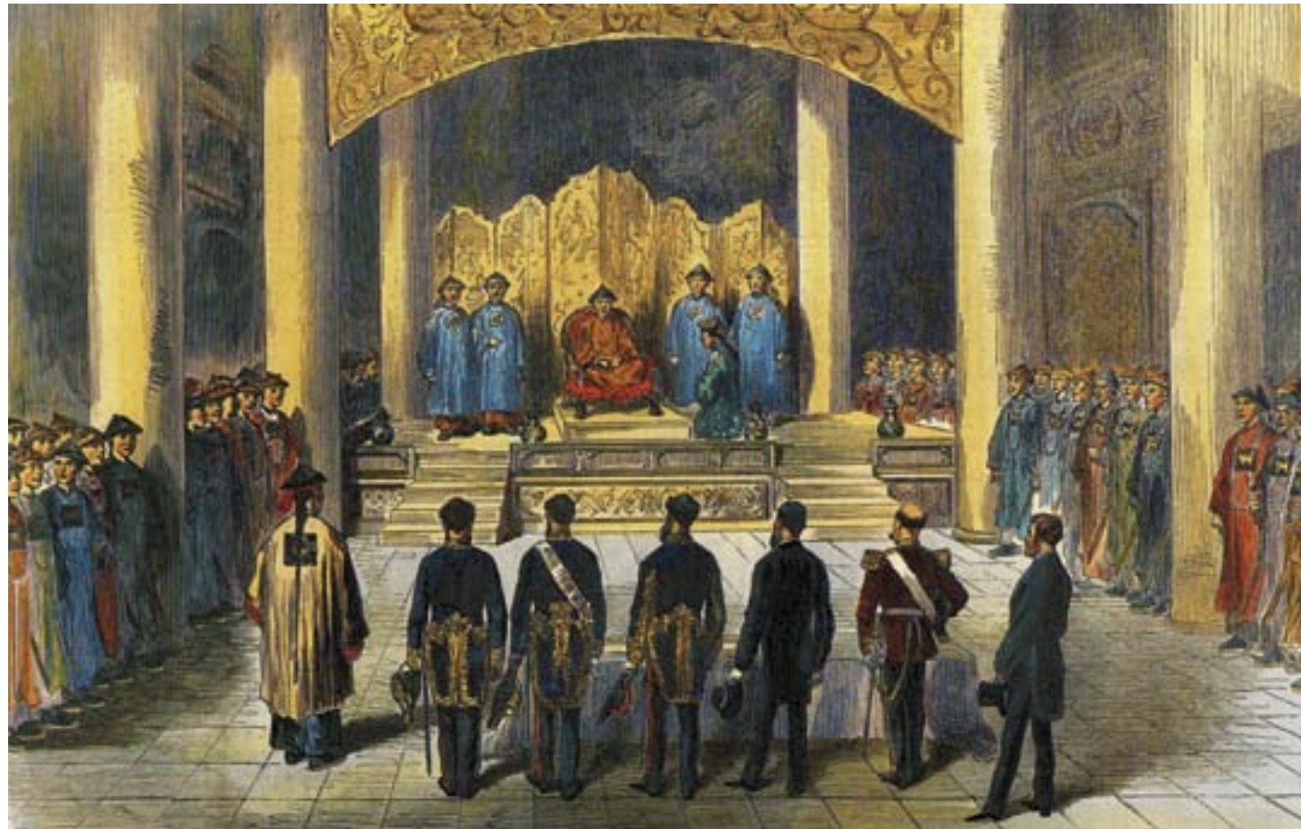
I diplomatici occidentali in udienza a corte per l'ascesa al trono dell'imperatore Tongzhi, 1861, litografia colorata, Londra, Sotheby's

il 1860, infatti, il contatto con le autorità imperiali divenne di pertinenza della diplomazia, e gli ambasciatori finalmente ebbero la loro residenza a Pechino, anche se, per diversi anni, fu loro negata la possibilità di essere ricevuti in udienza dall'imperatore. L'esistenza di una comunità diplomatica a Pechino aveva per la Cina un impatto simbolico maggiore rispetto alla presenza straniera nei porti aperti, come dimostrato dalla lunga e ostinata resistenza opposta dalla corte a questa richiesta avanzata fin dagli inizi dell'Ottocento. Tuttavia, la presenza più dirompente era, in realtà, quella dei missionari protestanti e cattolici. Il loro obiettivo di convertire al cristianesimo la popolazione dell'impero presupponeva, infatti, l'inevitabile ristrutturazione di molti valori ed elementi della società e della cultura cinesi, a partire dalla famiglia. Questo li rese influenti nel processo di modernizzazione avviato in questi decenni, ma rese spesso anche critica la loro posizione, specialmente quando le loro attività, protette dall'extraterritorialità, entravano in conflitto con la società locale e costituivano, di conseguenza, un possibile terreno di scontro fra le autorità cinesi e le potenze straniere.