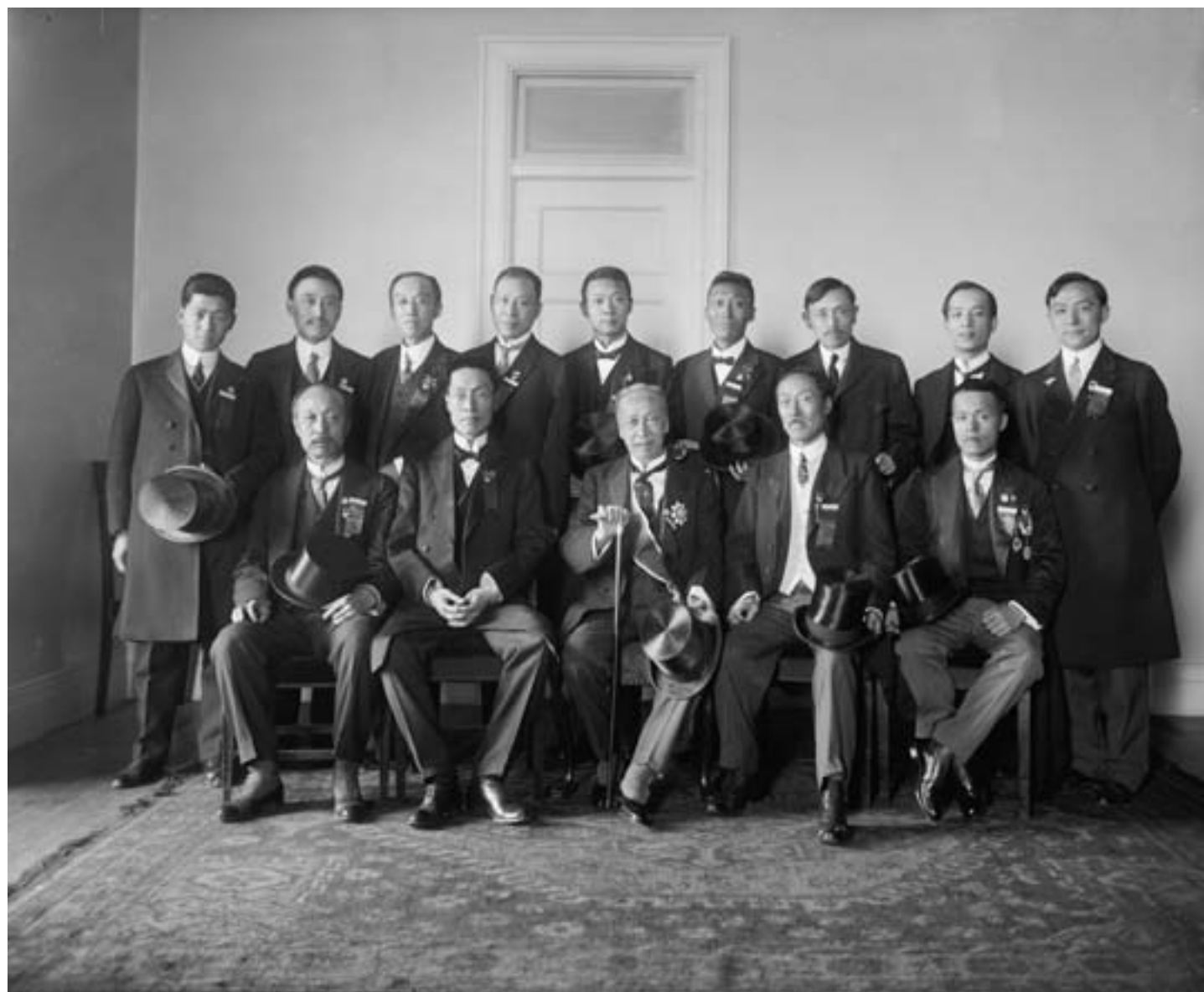
Harris & Ewing, Rappresentanti commerciali cinesi in visita negli Stati Uniti, 1920, fotografia in bianco e nero, Washington DC, Library of Congress

ci raggiunse allora fino al midollo, e ci risvegliò dall'incubo di riforme democratiche impraticabili. La questione degli ex-possedimenti tedeschi nello Shandong, che dette la via al tumulto del movimento studentesco, non poteva essere separato dai problemi più vasti" (Schoppa, 2011: 47). Per la