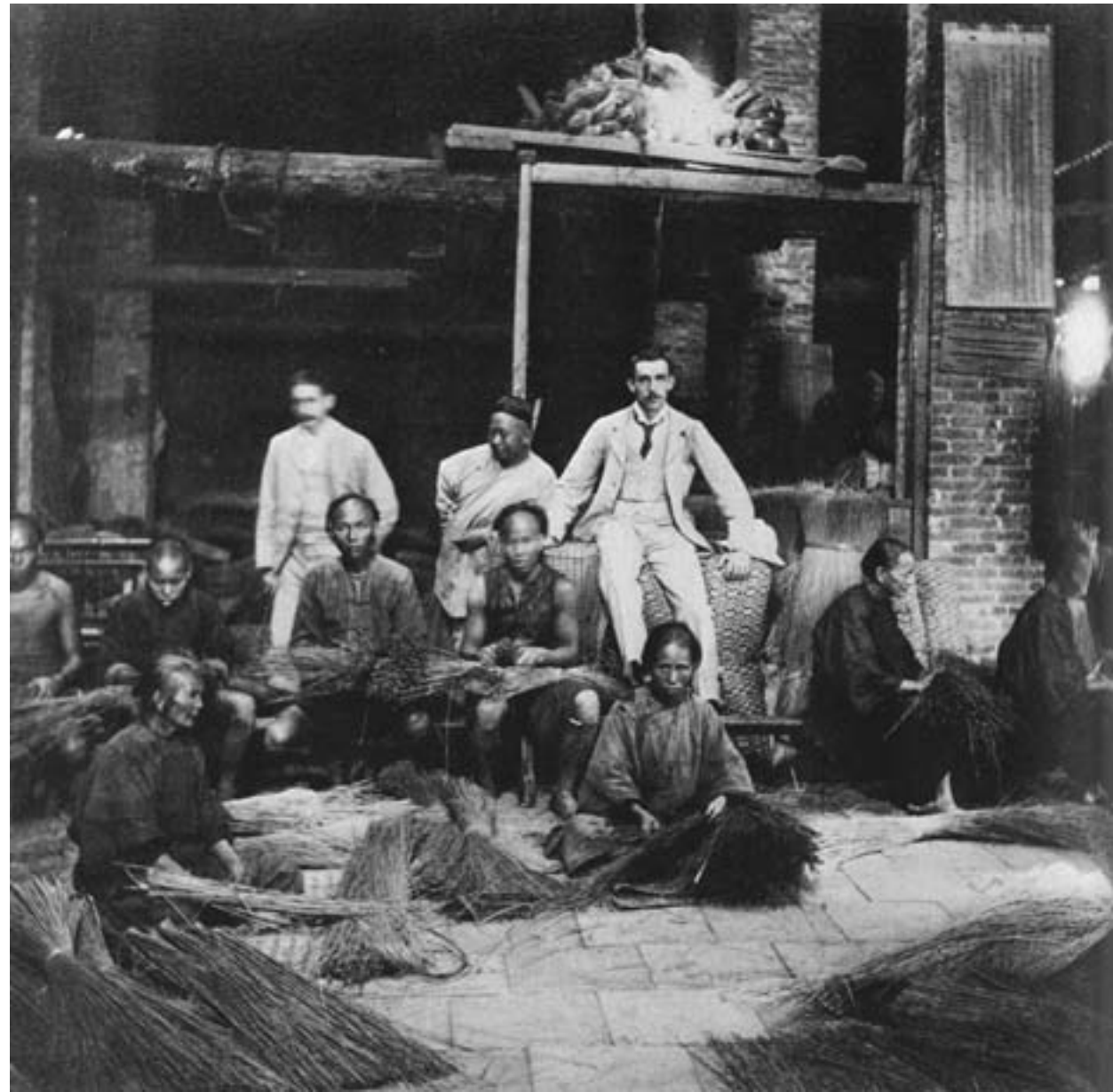
Imprenditori occidentali controllano la produzione di cesti di vimini a opera di lavoratori cinesi, ca. 1902, fotografia in bianco e nero

tradizionalmente attribuiti con il superamento degli esami imperiali, pratica autorizzata dal governo per rimpinguare le casse dello Stato, permise anche a coloro che si dedicavano al commercio di acquisire il prestigio pubblico connesso a questi titoli. Dall'altro, ci furono mercanti insigniti da Pechino di titoli imperiali per i meriti ottenuti nell'amministrazione e nella gestione delle attività promosse dai funzionari. Il comprador Zheng Guanying, ad esempio, ebbe addirittura il titolo di daotai , Sovrintendente di Circuito, per il suo ruolo pubblico nella comunità. Questo gli permise di godere dell'autorevolezza per esprimersi anche pubblicamente, al punto che i suoi saggi, che illustravano le sue proposte di riforma, furono letti e apprezzati da letterati e funzionari.