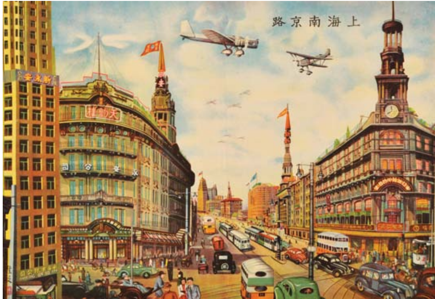
La via commerciale più trafficata della Cina, Nanjing Road a Shanghai, ca. 1935, cromolitografia su carta, Collezione privata