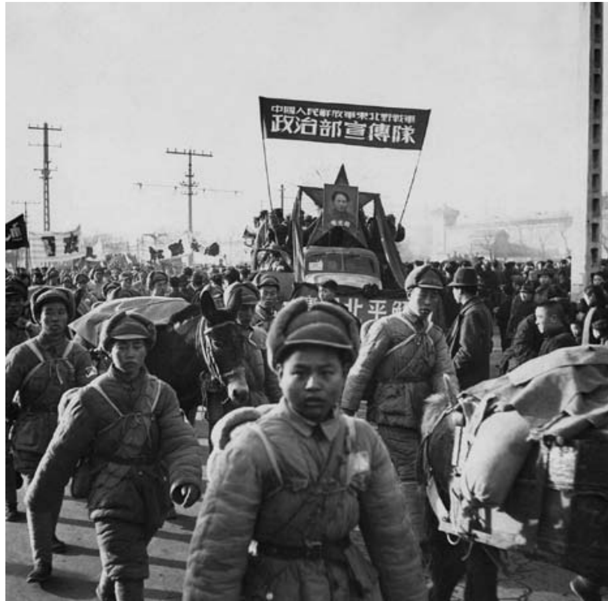
I soldati dell'Esercito Popolare di Liberazione entrano a Pechino, 31 gennaio 1949, fotografia in bianco e nero

mente riconosciuto. Se sul piano militare erano stati gli USA a guidare il fronte anti-nipponico, infliggendo al paese le sconfitte decisive che lo avevano condotto alla resa, la lunga resistenza opposta all'occupante dal 1937, tanto dai nazionalisti quanto dai comunisti, aveva contribuito in modo decisivo a minare la forza di combattimento giapponese. Ma il prezzo in termini di vite umane, di distruzioni materiali e di disgregazione sociale era stato enorme. Grazie al suo contributo alla vittoria finale, la Cina semicoloniale apparteneva ormai al passato e il governo repubblicano aveva assunto la piena sovranità, vedendo finalmente cancellati gli umilianti "trattati ineguali" e non potendo più essere considerata un oggetto della politica internazionale. Il suo futuro politico, però, rimaneva incerto. Ora si trattava di riprendere il controllo del territorio, dove, nell'agosto del 1945, l'esercito e i civili giapponesi erano più di tre milioni, ma anche di trovare un accordo fra le varie forze politiche cinesi per la creazione di un governo di unità nazionale.