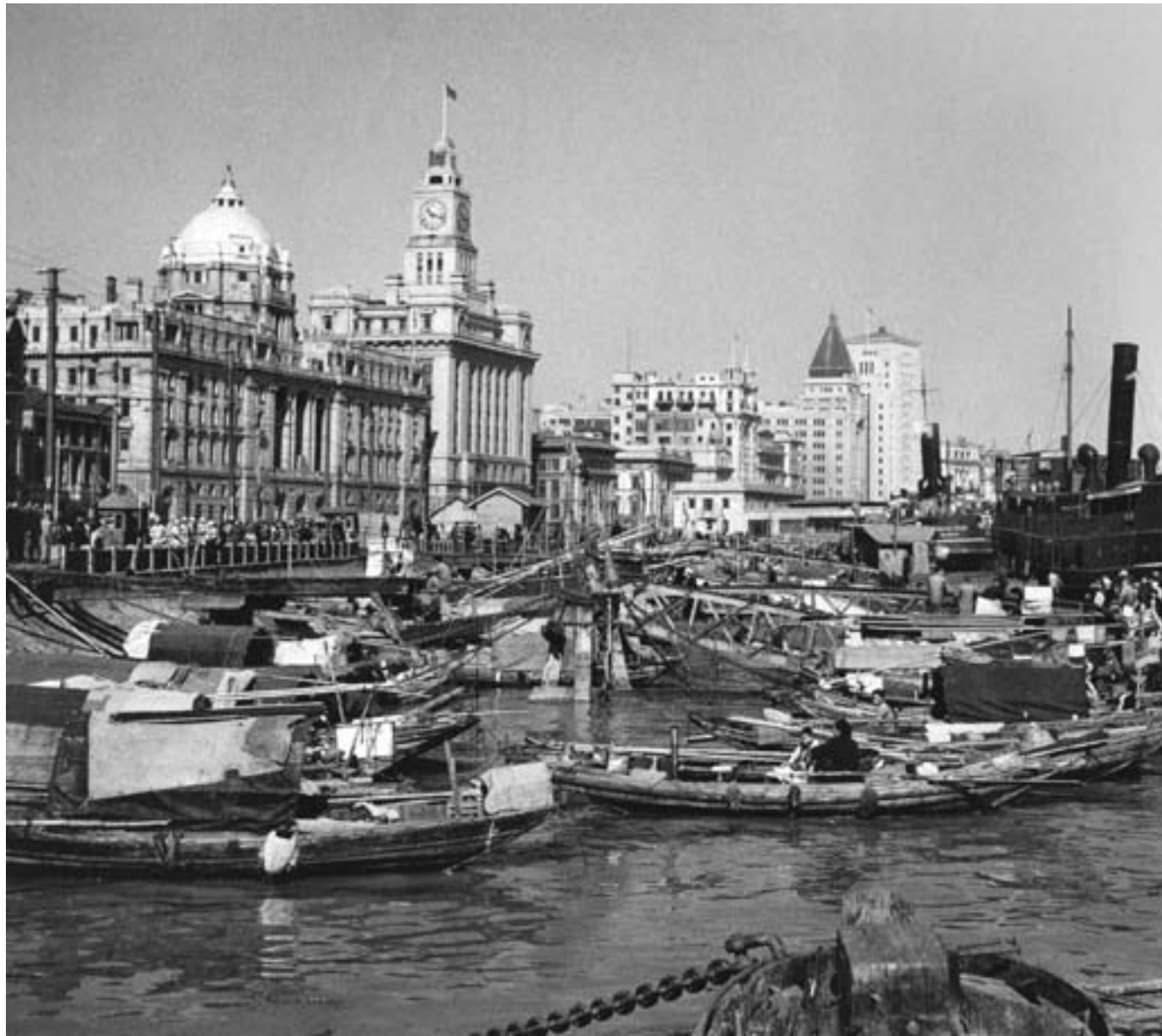
Il Bund di Shanghai visto dal fiume Huangpu, ca. 1920, fotografia in bianco e nero

La Prima guerra mondiale aveva profondamente cambiato il Vecchio Mondo e, inevitabilmente, aveva aperto una nuova fase anche per la Cina e le sue relazioni con l'esterno. Antiche potenze, come l'impero tedesco, distrutto dal conflitto, e quello zarista, travolto dalla rivoluzione bolscevica, erano scomparse; gli Stati Uniti avevano dimostrato il loro potere economico e militare, oltre che la propria capacità di leadership internazionale; il Giappone era riuscito a consolidare la propria potenza nel contesto regionale; Francia e Gran Bretagna, invece, avevano perso terreno, prostrate dal conflitto. Il primato globale della civiltà europea aveva subito un duro colpo, aprendo la strada a nuovi nazionalismi, alla lotta anti-coloniale e alla ricerca di nuovi modelli politici e culturali che portassero alla modernità.