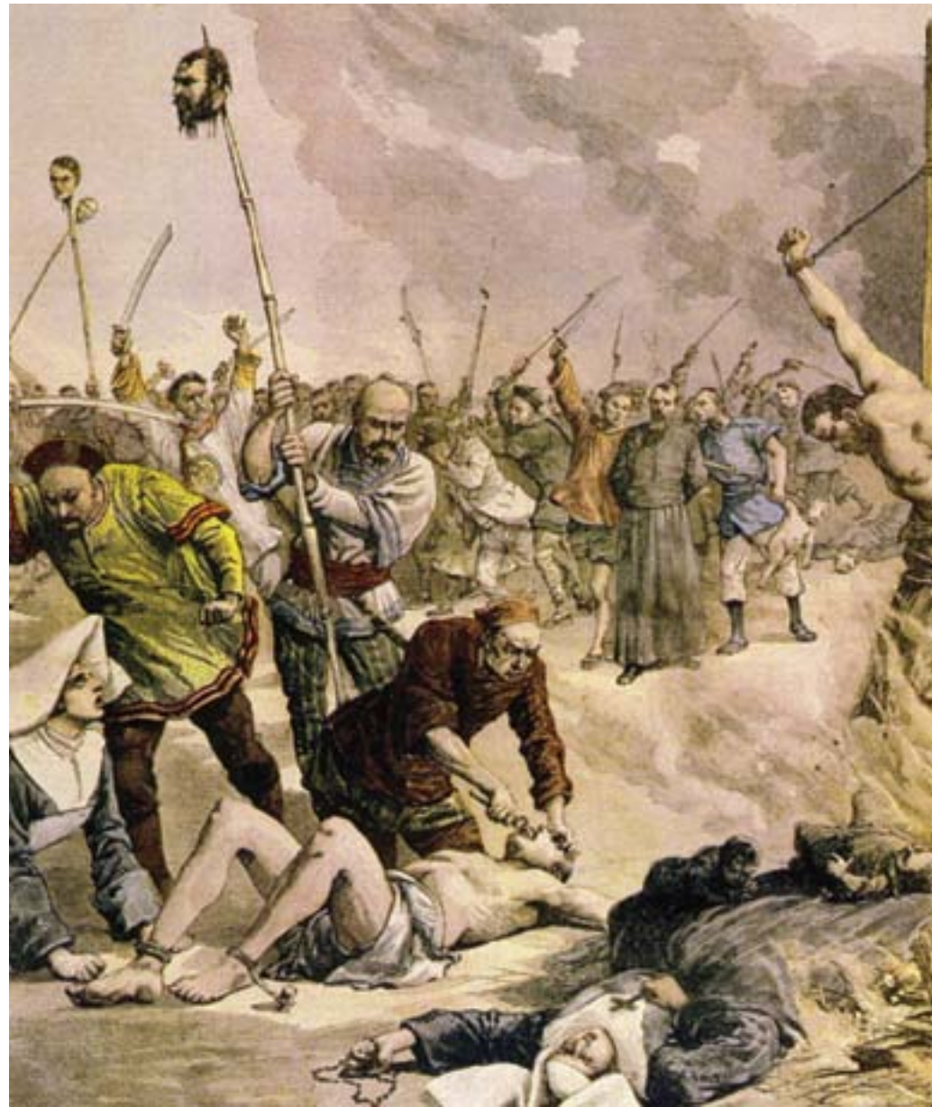
I Boxer operano violenze xenofobe contro i missionari cattolici, 1901, cromolitografia, Londra, Sotheby's

tetica divisione dell'impero, furono attenuate dalla posizione assunta, nella questione cinese, dagli Stati Uniti, fautori di una politica detta della "porta aperta", non sgradita, in realtà, neppure alla Gran Bretagna. Ad esempio, nel 1899, l'ammiraglio Charles Bereford (1846-1919), membro del Parlamento britannico, pubblicò un rapporto sulla situazione del commercio in Cina dal titolo The Break-up of China , nel quale si prefigurava una possibile frammentazione dell'impero e si suggeriva, dunque, la necessità di rafforzare piuttosto la sua unità mantenendo una politica di apertura e di libertà per i commerci e gli investimenti stranieri.