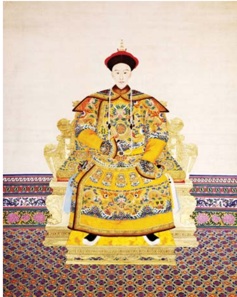
Artista cinese, Ritratto dell'imperatore Guangxu, 1875, dipinto su seta, Pechino, Museo del Palazzo Imperiale