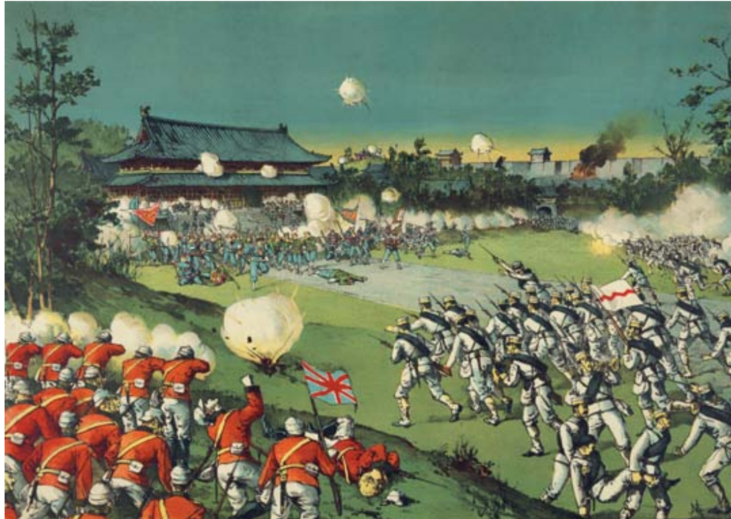
Torajirō Kasai, Attacco delle truppe anglo-giapponesi alle mura della Città Proibita a Pechino durante la rivolta dei Boxer, 1901, litografia colorata, Londra, Sotheby's

sempre più a prestiti internazionali, che rafforzarono il suo assoggettamento all'imperialismo finanziario.