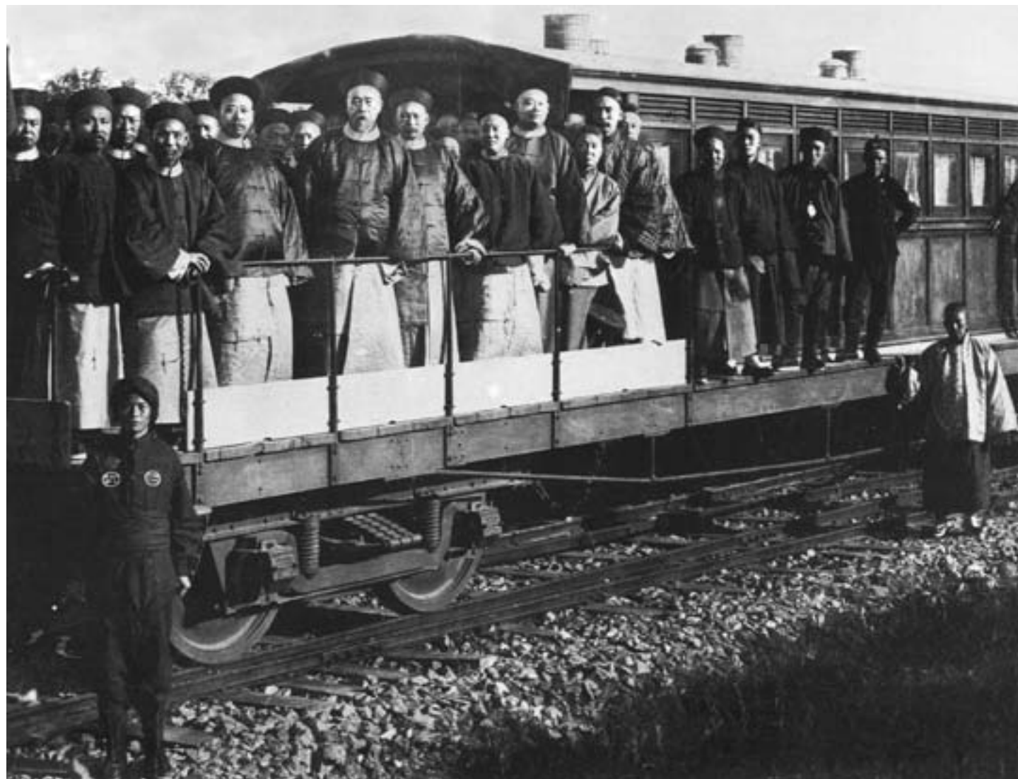
Il riformatore Li Hongzhang all'inaugurazione di una strada ferrata a Tianjin insieme a personalità cittadine, ca. 1890, fotografia in bianco e nero

tanti diplomatici delle potenze straniere. Alla fine, la prima udienza di un imperatore cinese agli ambasciatori residenti nella capitale fu accordata il 29 giugno 1873, in una sala del Palazzo imperiale in precedenza adibita, non a caso, a ricevere i convogli tributari provenienti dai regni vicini. Il primo a inchinarsi davanti all'imperatore Tongzhi, tuttavia, fu il ministro degli esteri giapponese, Soejima Taneomi (1828-1905), che si trovava all'epoca a Pechino per la ratifica del primo trattato sino-giapponese, concluso due anni prima. Di seguito, i ministri plenipotenziari russo, americano, britannico, francese e olandese presentarono le loro credenziali al Figlio del Cielo. Il rappresentante del Regno d'Italia, paese che aveva concluso qualche anno prima, nel 1866, un trattato di commercio e di navigazione che instaurava relazioni diplomatiche fra Roma e Pechino, non fu presente, in quanto preferiva risiedere nella capitale giapponese, Tokyo.