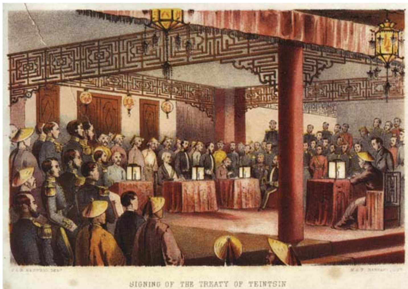
F.C.B. Bedwell, La firma del trattato di Tianjin, Londra, 1860, litografia colorata, Hong Kong, Museum of Art

mata per la ratifica ufficiale del trattato, venne accolto dalla reazione armata dell'esercito cinese proprio davanti ai forti di Dagu. Le perdite inflitte agli inglesi convinsero il governo Qing che fosse possibile rifiutare l'accordo dell'anno precedente, ma la risposta franco-britannica non si fece attendere. Forte di 17.000 soldati e dotato di fucili e cannoni di ultima generazione, ben superiori agli armamenti cinesi, il contingente europeo sbarcò a Tianjin, attaccò e distrusse i forti di Dagu e marciò sulla capitale, da cui l'imperatore era fuggito per riparare a Chengde, la sede ancestrale dei mancesi, nel nord-est.