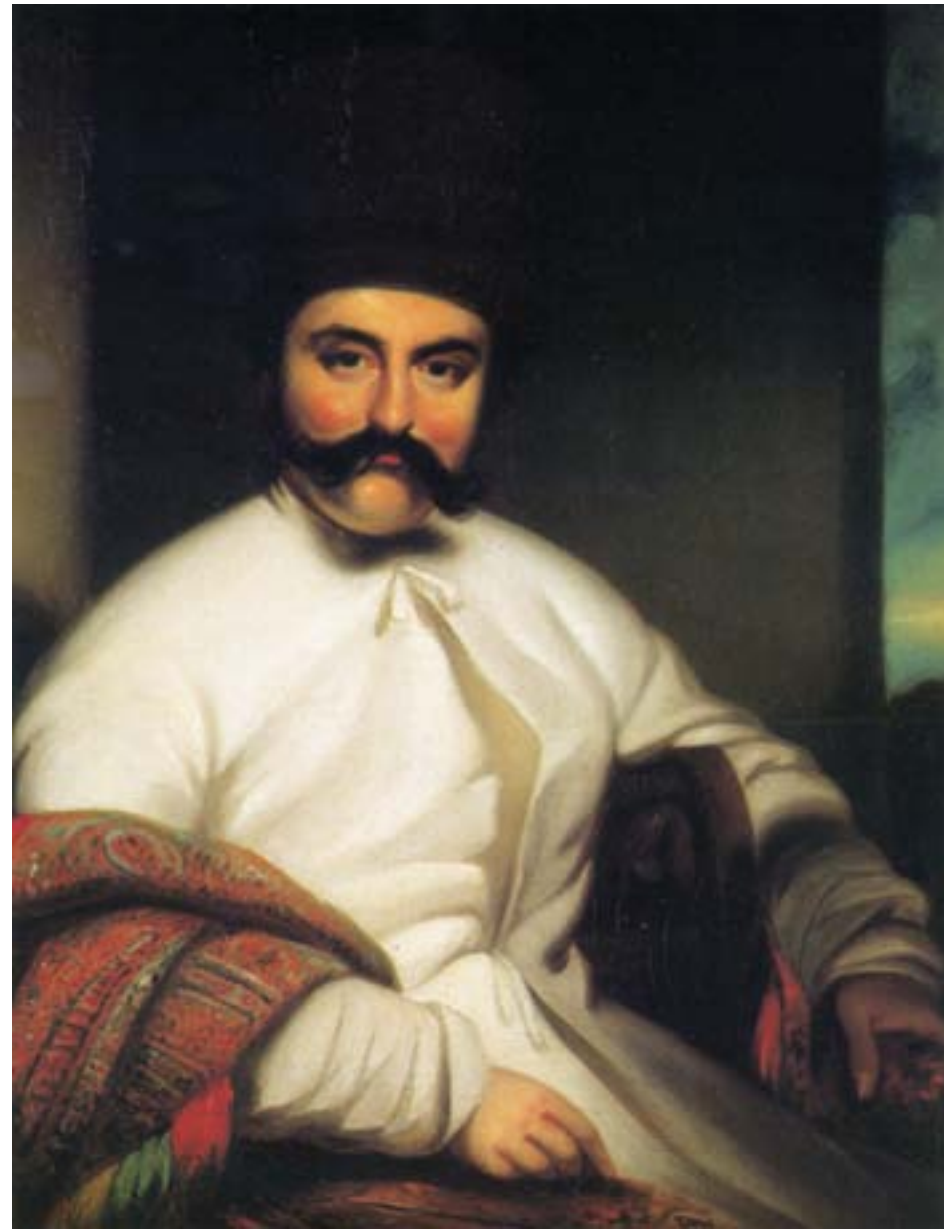
George Chinnery, Ritratto del mercante parsee sir Jamsetjee Jeejeebhoy, ca. 1846, olio su tela, Hong Kong, Museum of Art

la responsabilità della riorganizzazione e della gestione del servizio doganale, che a Shanghai già negli anni dei disordini era stato gestito come un'impresa sino-straniera, la scelta alla fine ricadde dunque su di lui. Hart rimase alla guida delle dogane cinesi dal 1861 fino al 1910, vivendo a Pechino, nel cuore politico dell'impero. Sotto la sua direzione, le dogane, il cui personale includeva esponenti di diverse nazionalità, divennero un'istituzione multinazionale, moderna e funzionale, che garantiva grandi introiti alle casse imperiali e permise l'introduzione di nuove procedure amministrative e di raccolta delle informazioni. Alle sue dipendenze, nei nuovi uffici doganali localizzati nei porti aperti, lavoravano inglesi, francesi e americani; successivamente vi entrarono anche tedeschi, italiani e danesi, tutti vincolati a un rigoroso codice di comportamento nelle relazioni con le autorità cinesi e con l'istituzione a cui appartenevano.