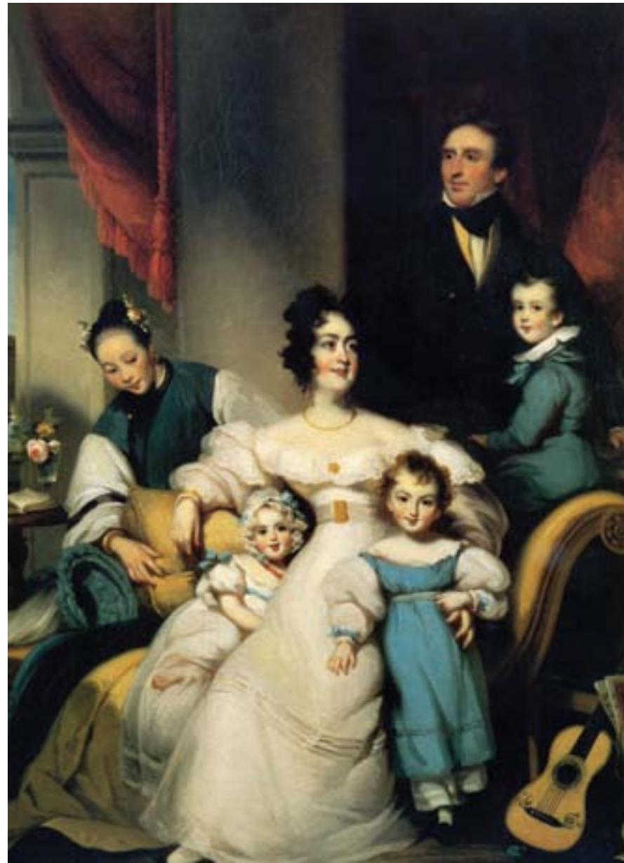
George Chinnery, Ritratto di una ricca famiglia inglese di Hong Kong con domestica cinese, ca. 1846, olio su tela, Hong Kong, Museum of Art

nota come la concessione modello - fu quello di Shanghai. I quartieri della Concessione internazionale divennero rapidamente una vetrina delle innovazioni urbanistiche. Nel 1862 fu introdotta l'illuminazione pubblica a gas, vent'anni dopo la distribuzione di energia elettrica, nel 1883 l'acqua corrente, nel 1902 il tram. La Concessione francese non tardò a seguire l'esempio.