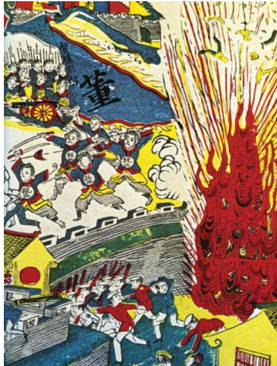
Assalto dei Boxer e delle truppe imperiali cinesi alle concessioni occidentali a Tianjin, 1901, incisione colorata, Collezione privata

litarmente quando, nel giugno del 1900, lo stesso governo Qing decise di appoggiare i combattenti per la giustizia e dell'armonia. In quel mese, infatti, le armate dei ribelli arrivarono a Tianjin e nella capitale imperiale Pechino, dove attaccarono le chiese cristiane. Il rappresentante diplomatico tedesco, il barone Clemens von Ketteler (1853-1900), ordinò di reprimerli, ma la reazione difensiva degli europei, che provocò diverse vittime cinesi, non fece che allargare il fronte della ribellione, dato che anche le armate imperiali formate da musulmani cinesi, giunte nella capitale due anni prima e guidate dal generale Dong Fuxiang (1839-1908), noto per la sua xenofobia, si unirono ai Boxer.