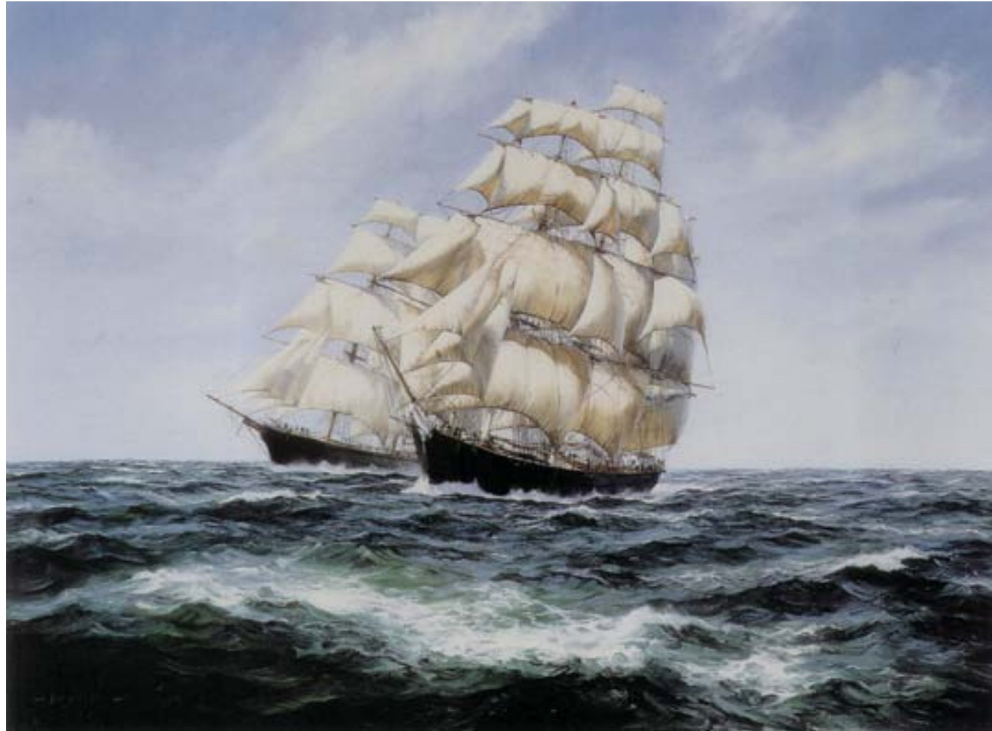
Montague Dawson, Gara fra i clipper americani Lightning e Red Jacket , ca. 1950, olio su tela, Greenwich, National Maritime Museum

questi velieri potevano trasportare carichi minori, ma erano senza dubbio più veloci e maneggevoli rispetto ai precedenti e quindi consentivano di sveltire il ciclo delle operazioni commerciali. La rotta dell'oppio seguita dai clipper , che erano impiegati anche per il trasporto del tè in Europa, partiva dal porto di Calcutta e, attraverso lo Stretto di Malacca, terminava a Canton, all'epoca l'unico porto cinese aperto agli scambi con i mercanti europei.