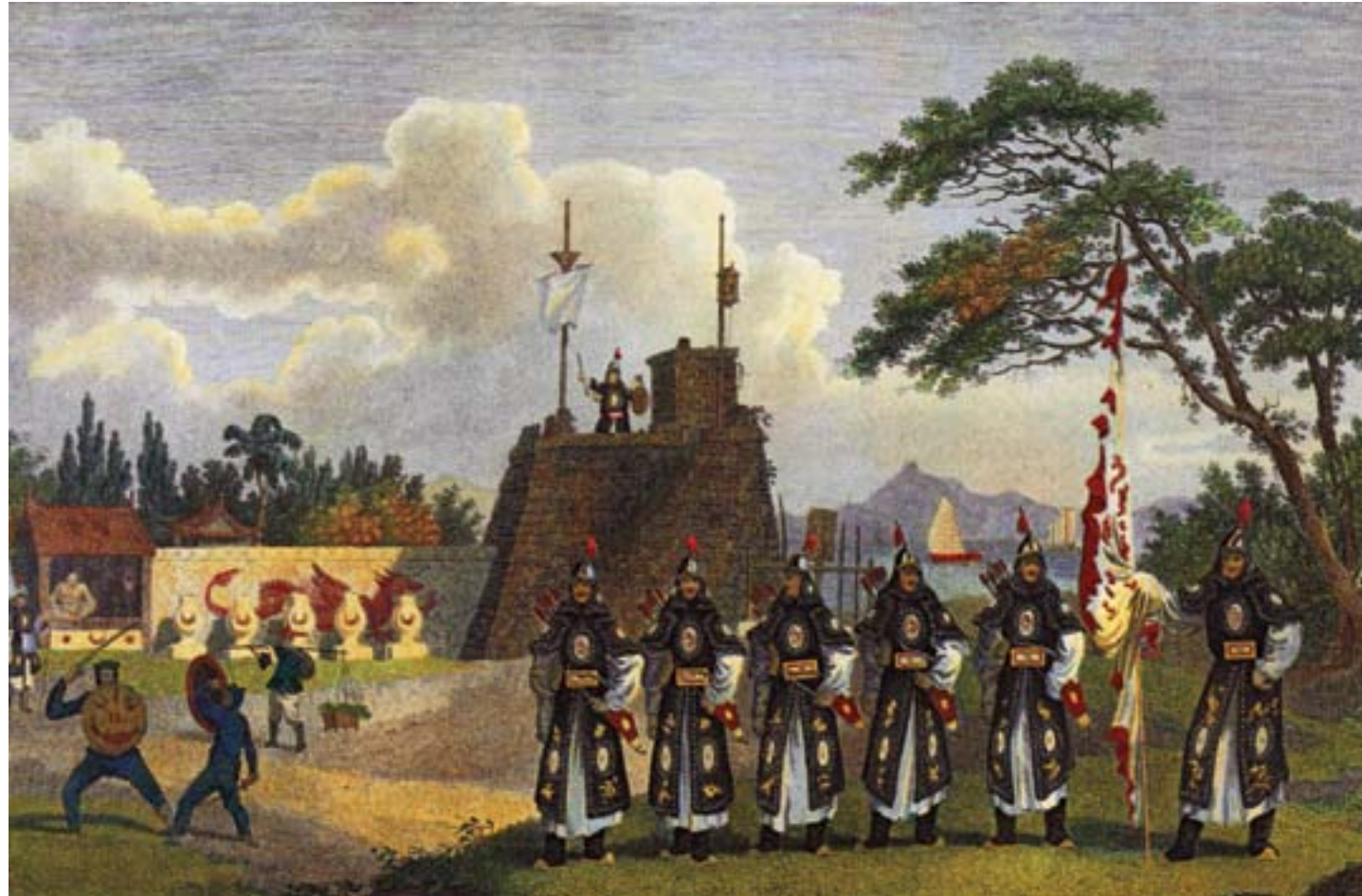
William Alexander, The Costume of China . Ambasceria di lord Macartney. Soldati cinesi di guardia a un fortino, Londra, 1805-1814, incisione colorata, Londra, Sotheby's

In parte, dunque, la religione da lui predicata rifletteva l'influenza che gli europei avevano iniziato a esercitare, per quanto a livello locale e limitato, sulla società cinese. Nel cristianesimo, rielaborato alla luce della tradizione, Hong aveva trovato ispirazione per immaginare e proporre un mondo nuovo, dove avrebbe regnato l'uguaglianza in nome di un'etica puritana priva di compromessi: abolizione della proprietà terriera, parità di diritti fra uomini e donne, vita comunitaria improntata al rispetto di un rigido codice di castità, segregazione sessuale. Dal cristianesimo Hong prese riti e preghiere, come i dieci comandamenti biblici, rivisitati alla luce della morale cinese. Tuttavia, la religione dei Taiping differiva in modo significativo dalla fede cristiana, a partire dalla non accettazione della divinità di Cristo, mentre il confucianesimo rimase una fonte inconscia importante nell'elaborazione del sistema di credenze e di valori.