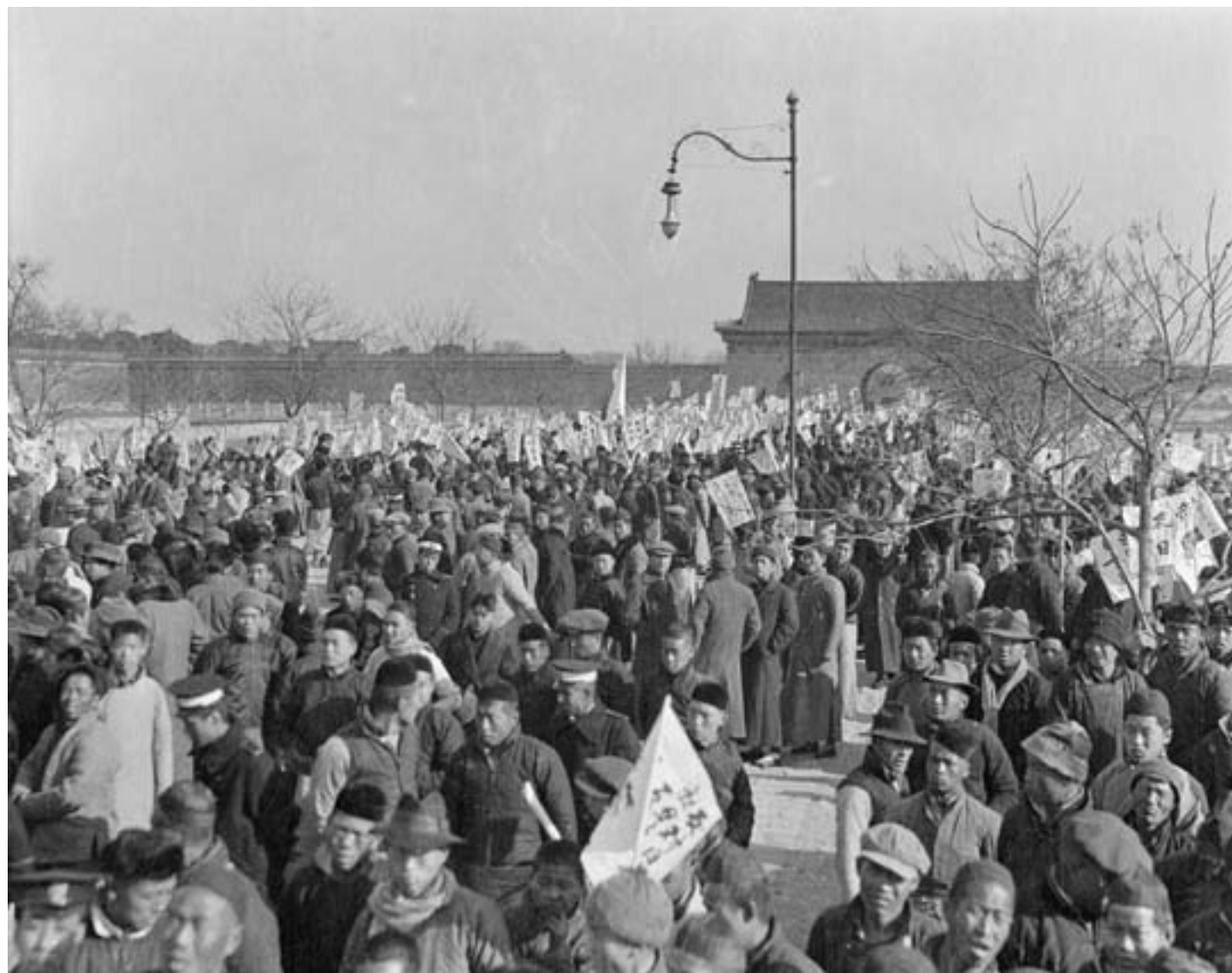
Sidney D. Gamble, Dimostrazione studentesca in piazza Tiananmen a Pechino, 29 novembre 1919, fotografia in bianco e nero, Durham (NC), Duke University

contesto urbano, risentirono sempre più dell'influenza occidentale, con un processo di adattamento culturale che portò, per le donne, alla creazione del qipao , l'abito lungo e stretto ispirato alla tradizione e, per gli uomini, all'adozione del lungo abito ( changshan ), particolarmente amato da accademici e letterati, o della semplice giacca in stile militare occidentale, che Sun Yat-sen fece divenire il simbolo del suo partito e che dal leader rivoluzionario prese anche il nome ( zhangshan zhuang ). Ma, per quanto i simboli fossero importanti, essere cittadini non poteva consistere solo in un cambiamento esteriore. Non fu un caso che, nelle campagne, l'abbandono dei vecchi costumi, compreso il lungo codino, fosse molto più lento, risultando un gesto incomprensibile ai più - alcuni generali arrivarono addirittura a promettere ai propri soldati una retribuzione per ogni codino tagliato! I valori del passato plasmavano ancora la vita sociale e la mentalità di gran parte dei cinesi, come dovettero rendersi ben presto conto molti intellettuali progressisti.