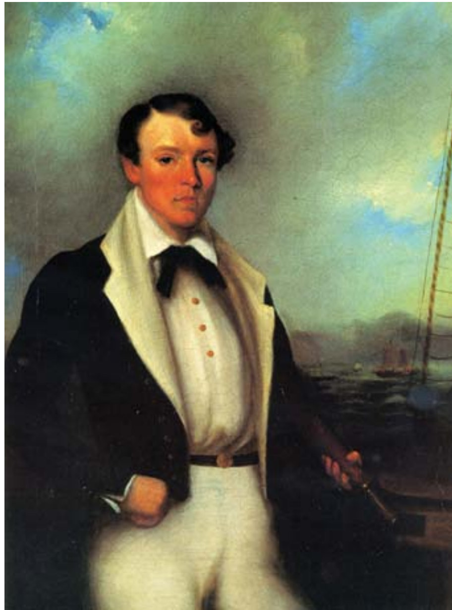
George Chinnery, Ritratto di un capitano di mare inglese attivo nei traffici con la Cina, ca. 1830, olio su tela, Hong Kong, Museum of Art

Alla comunità britannica, posta praticamente sotto assedio, non restò che accettare la richiesta cinese. Charles Elliott (1801-1875), all'epoca Sovrintendente per il commercio con la Cina, giunse rapidamente a Canton da Macao e promise agli affaristi inglesi un risarcimento per l'oppio consegnato ai cinesi, il cui valore fu calcolato ammontare a circa due milioni di sterline dell'epoca. Ai trafficanti tale soluzione sembrò un ottimo affare, tanto che, per consegnare i ventimila chest promessi da Elliott a Lin, in quel momento non disponibili, si preoccuparono di far arrivare velocemente dei nuovi carichi dall'India.