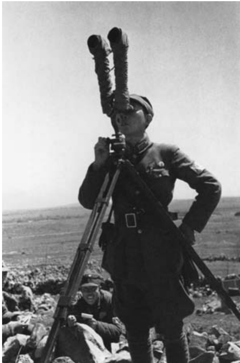
Robert Capa, Un ufficiale d'artiglieria regola l'alzo dei suoi cannoni durante la battaglia di Taierzhuang, 1938, fotografia in bianco e nero, Hong Kong, Kan Yuet-keung Collection

Dalla Seconda guerra mondiale alla guerra civile: verso la fine del "secolo dell'umiliazione nazionale"