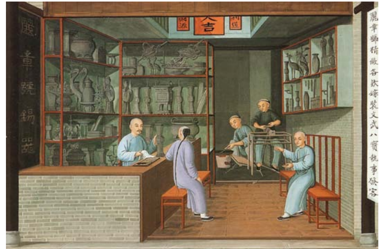
Artista cinese, Interno di un negozio di peltro a Canton, ca. 1830, tempera su carta, Salem (MA), Peabody-Essex Museum

gno delle autorità imperiali cinesi per rimediare al disastro diplomatico, l'incidente era destinato ad avere conseguenze a lungo termine, rafforzando la convinzione di molti europei che i cinesi fossero sostanzialmente xenofobi e che il governo Qing fosse incapace di difendere gli stranieri, e al tempo stesso contribuendo a consolidare i sentimenti ostili di molti sudditi dell'Impero Celeste nei confronti della presenza occidentale.