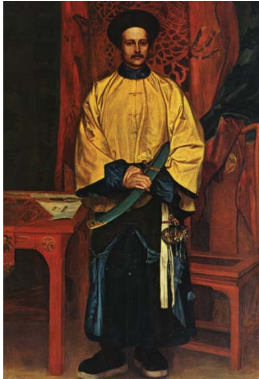
Valentine C. Prinsep, Ritratto del colonnello Charles "Chinese" Gordon vestito da mandarino, 1866, olio su tela, Chatham, Royal Engineers Headquarters Officers Mess

rilevanti. Una crescente regionalizzazione del potere, segnata dall'ascesa politica di alcuni grandi governatori provinciali, e una diffusa militarizzazione della società cinese, soprattutto nel contesto rurale, furono la manifestazione più evidente dell'insicurezza endemica innescata dalla rivolta.