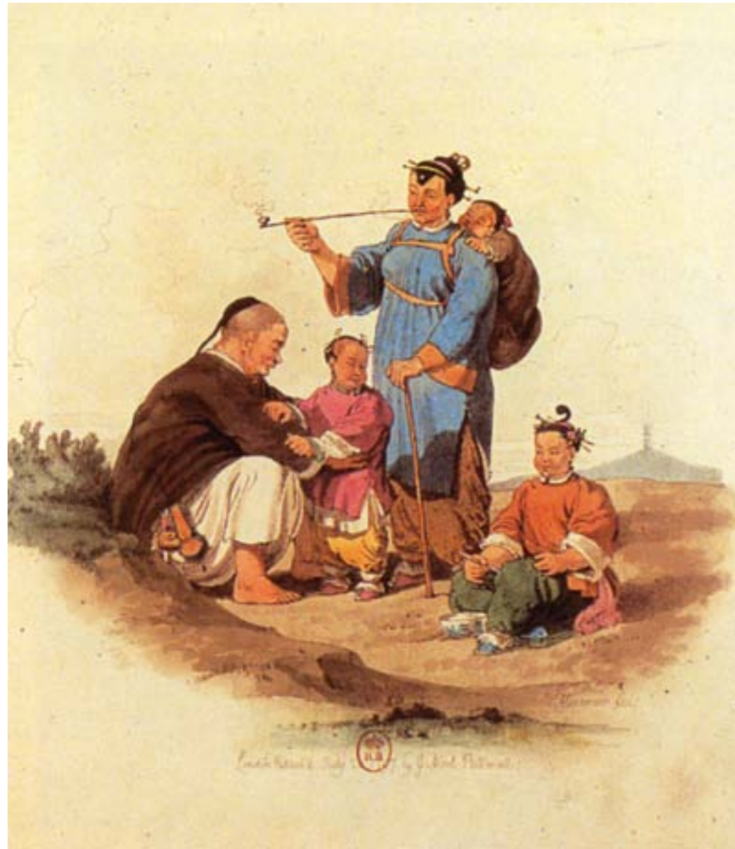
William Alexander, The Costume of China . Ambasceria di lord Macartney. Una famiglia di contadini cinesi, con la moglie intenta a fumare la pipa, Londra, 1805-1814, incisione colorata, Londra, Sotheby's