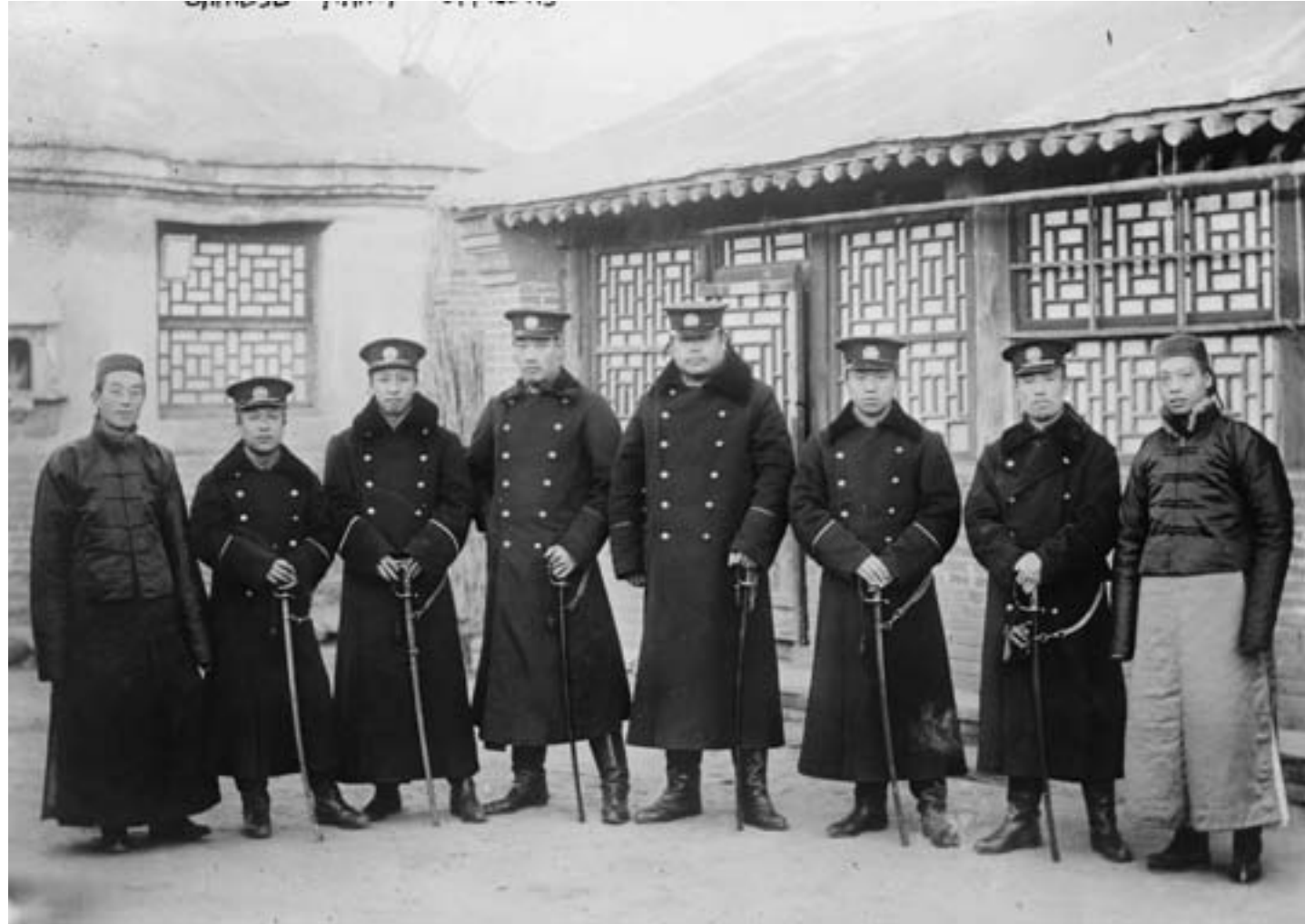
Bain News Service, Ufficiali dell'esercito repubblicano cinese, 1915, fotografia in bianco e nero, Washington DC, Library of Congress

Davanti a questa prospettiva, pur in assenza di qualunque piano preciso, i rivoluzionari presenti a Wuchang proclamarono l'insurrezione armata contro i rappresentanti del governo Qing. In pochi giorni, mentre i combattimenti nella città vedevano la vittoria degli insorti contro le truppe rimaste fedeli alla dinastia, l'ondata rivoluzionaria iniziò a diffondersi nelle regioni meridionali e centrali, dove diversi governatori provinciali, accogliendo le pressioni e le istanze dei repubblicani, dichiararono la loro indipendenza dal governo Qing. Entro sei settimane dallo scoppio della rivolta, quindici province avevano optato per la secessione. Per avere ragione dei ribelli, la corte si rivolse a Yuan Shikai, il generale più prestigioso dell'esercito, che negli anni dell'imperatrice Cixi aveva gestito la modernizzazione delle forze armate. Yuan dichiarò il suo intento di accelerare il processo di riforma della monarchia in senso costituzionale e divenne Primo ministro il 1° novembre 1911. L'esercito da lui controllato, l'Armata Beiyang, era l'unico in grado di riportare l'ordine nella Cina centrale e meridionale ribelle alla dinastia.