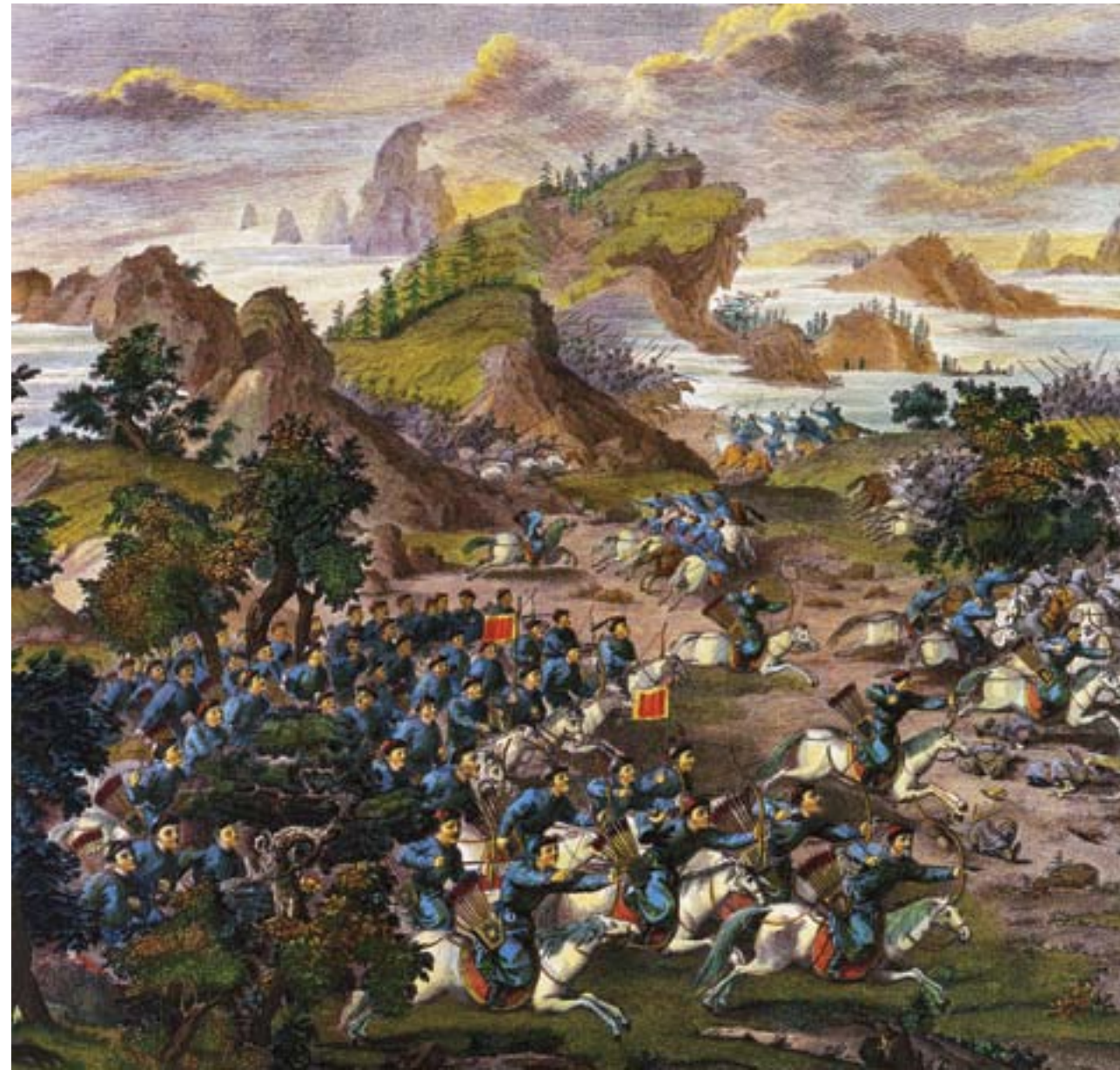
Charles-Nicolas Cochin, Les Conquêtes de l'Empereur de la Chine . La battaglia di Qurman (3 febbraio 1759) durante la campagna di Zungaria, Parigi, 1783-1788, incisione colorata, Londra, Sotheby's

Nonostante l'impegno riversato nel rafforzamento sul piano militare, nella seconda metà del XIX secolo l'impero Qing non vide allentarsi le minacce ai suoi confini continentali e marittimi. La posizione dominante della Cina in Asia orientale era sulla via del tramonto e l'impero stava perdendo la sua influenza sui popoli e gli Stati che avevano tradizionalmente guardato al trono celeste come fonte di civiltà.