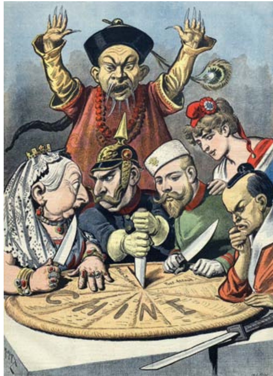
Henri Meyer, Chine. Le gâteau des Rois et... des Empereurs , supplemento de "Le Petit Journal", Parigi, 16 gennaio 1898, cromolitografia, Parigi, Bibliothèque Nationale de France

Dopo il 1895 si aprì una nuova fase nelle relazioni fra la Cina e il resto del mondo: iniziò, infatti, quella corsa alle concessioni, alla ricerca di un posto al "banchetto cinese" che, grazie anche alle garanzie comportate dai trattati, avrebbe vincolato in modo sostanziale il governo cinese al rispetto degli interessi finanziari ed economici delle grandi potenze. Apertasi legalmente per gli stranieri la possibilità di effettuare investimenti diretti sul territorio dell'impero, la competizione per lo sfruttamento delle risorse e per fare profitti sulla costruzione e la gestione delle infrastrutture, a partire dalle ferrovie necessarie alla penetrazione nell'interno, si fece molto più intensa.