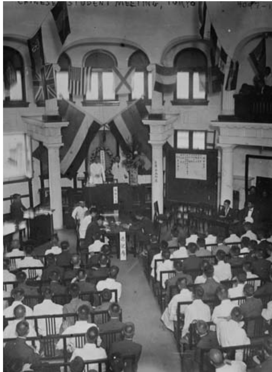
Bain News Service, Incontro di studenti cinesi residenti a Tokyo, 1915, fotografia in bianco e nero, Washington DC, Library of Congress

tamente i progressi raggiunti dal Giappone come Stato moderno. Per loro fu facile identificare la causa principale dello stato di debolezza e di scarso sviluppo del proprio paese nel dominio mancese. Cacciare i Qing e restaurare la sovranità cinese iniziò a rappresentare, ai loro occhi, una tappa ineludibile per liberare la patria dalla condizione di debolezza e d'inferiorità, anche nel contesto internazionale, in cui i mancesi l'avevano costretta. Nel 1903, uno di loro, Zou Rong (1885-1905), influenzato dalle idee di Sun Yat-sen, aveva composto un pamphlet , dal titolo L'esercito rivoluzionario ( Geming jun ), pubblicato nello stesso anno a Shanghai e ampiamente diffuso sia in Cina che all'estero. In esso si teorizzava la necessità della rivoluzione violenta contro la dinastia mancese, rea di violenze, abusi e dispotismo nei confronti dei cinesi: "Cacciamo i mancesi dalla nostra terra o uccidiamoli per vendicarci. Uccidiamo l'imperatore messo sul trono dai mancesi per assicurarci che, in eterno, non ci potrà mai più essere un altro despota" - recitava, fra le altre cose, il suo testo (Cheng, Lestz, 1999: 211).