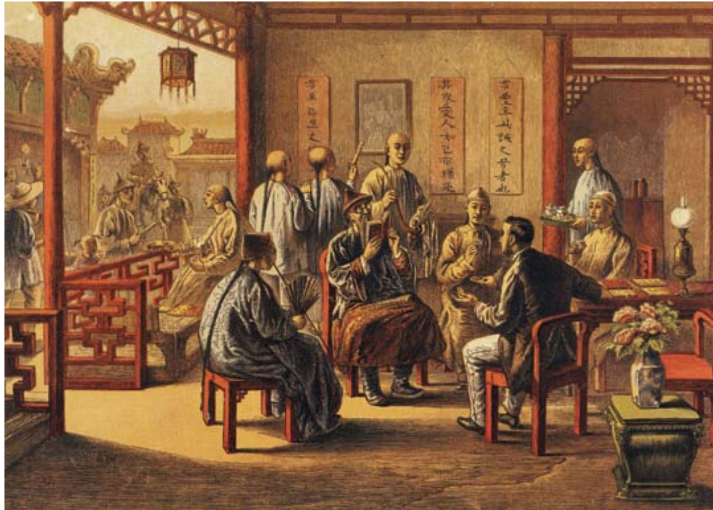
Un missionario inglese della Church Missionary Society intrattiene un gruppo di ospiti cinesi, Londra, ca. 1850, incisione colorata, Hong Kong, Museum of Art

Nel 1807, Robert Morrison (1782-1834), membro della neonata London Missionary Society, aveva iniziato il suo operato a Batavia, gettando le basi per un ampio progetto di evangelizzazione del popolo cinese, che a suo parere poteva essere favorito anche attraverso la stampa di trattati religiosi in lingua cinese. A questo scopo, nel 1815 aveva persino iniziato a stampare un periodico in mandarino, il primo giornale moderno della Cina. Lui, come altri, si convinse presto che era necessario cercare in modo deciso l'apertura della Cina alla presenza straniera, condividendo nei fatti la posizione dei mercanti di droga.