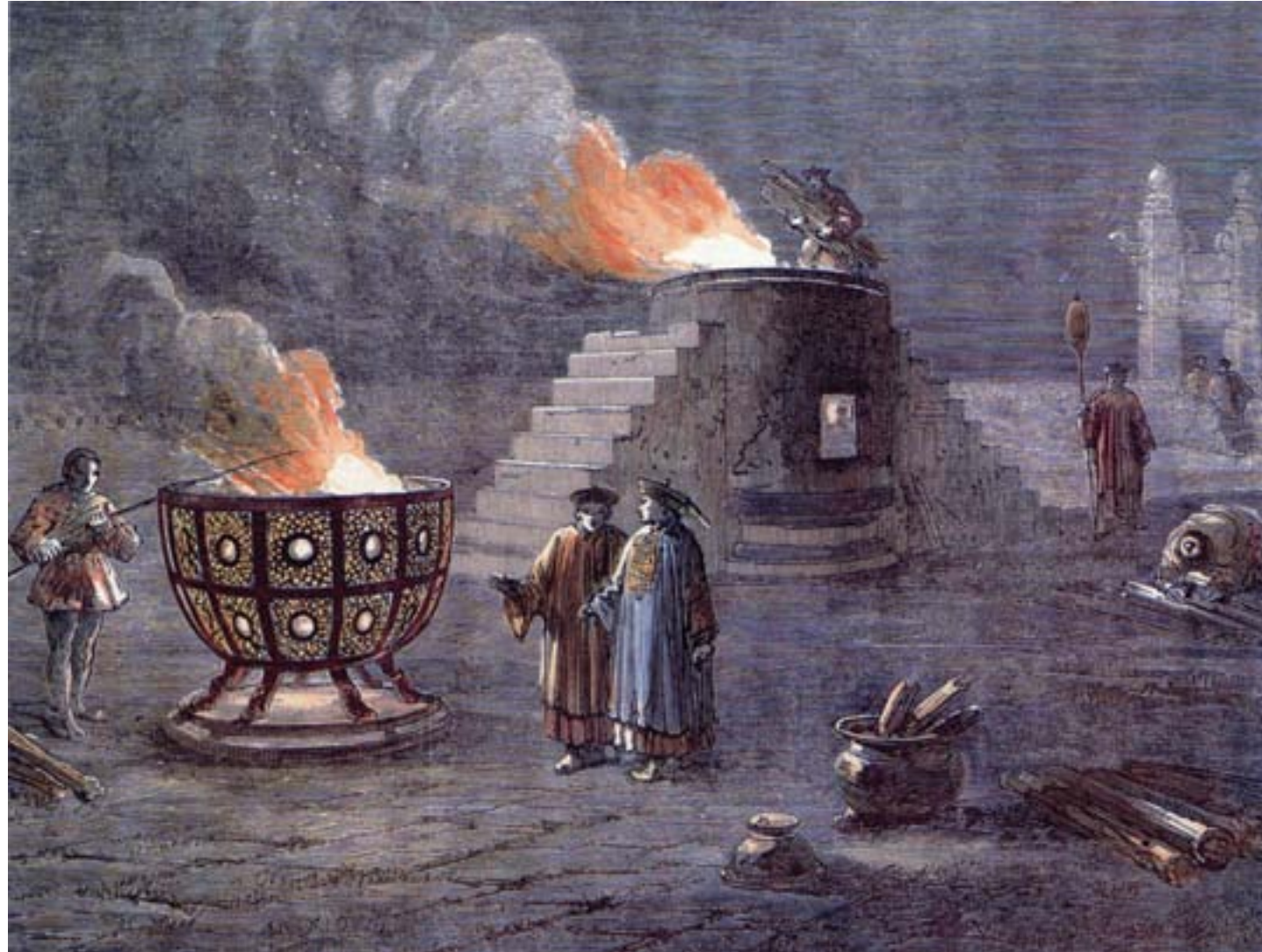
Thomas Allom, China Illustrated . Altare per i sacrifici con bracieri, Londra, 1845, incisione colorata, Londra, Sotheby's

polemica con il movimento per gli affari occidentali, rivendicava il primato della morale pubblica per il rafforzamento dello Stato, sostenendo come la debolezza della Cina dovesse essere combattuta soprattutto sconfiggendo la corruzione e la carenza etica nell'amministrazione. Questa corrente di pensiero preannunciava le accuse che, dopo la sconfitta subita dal Giappone, sarebbero state rivolte contro la classe dirigente protagonista del movimento yangwu . Nel 1895, infatti, l'insoddisfazione precedente nei confronti del grande potere di cui godevano taluni funzionari, come Li Hongzhang, si saldò con un rinnovato e diffuso interesse per l'attualità, nutrito da nuove riflessioni a carattere politico e intellettuale e domande di riforma. Tali istanze, pur in parte radicate nella tradizione confuciana, risentivano anche dell'influenza del pensiero europeo, e segnalavano una nuova apertura intellettuale cinese agli apporti del mondo esterno.