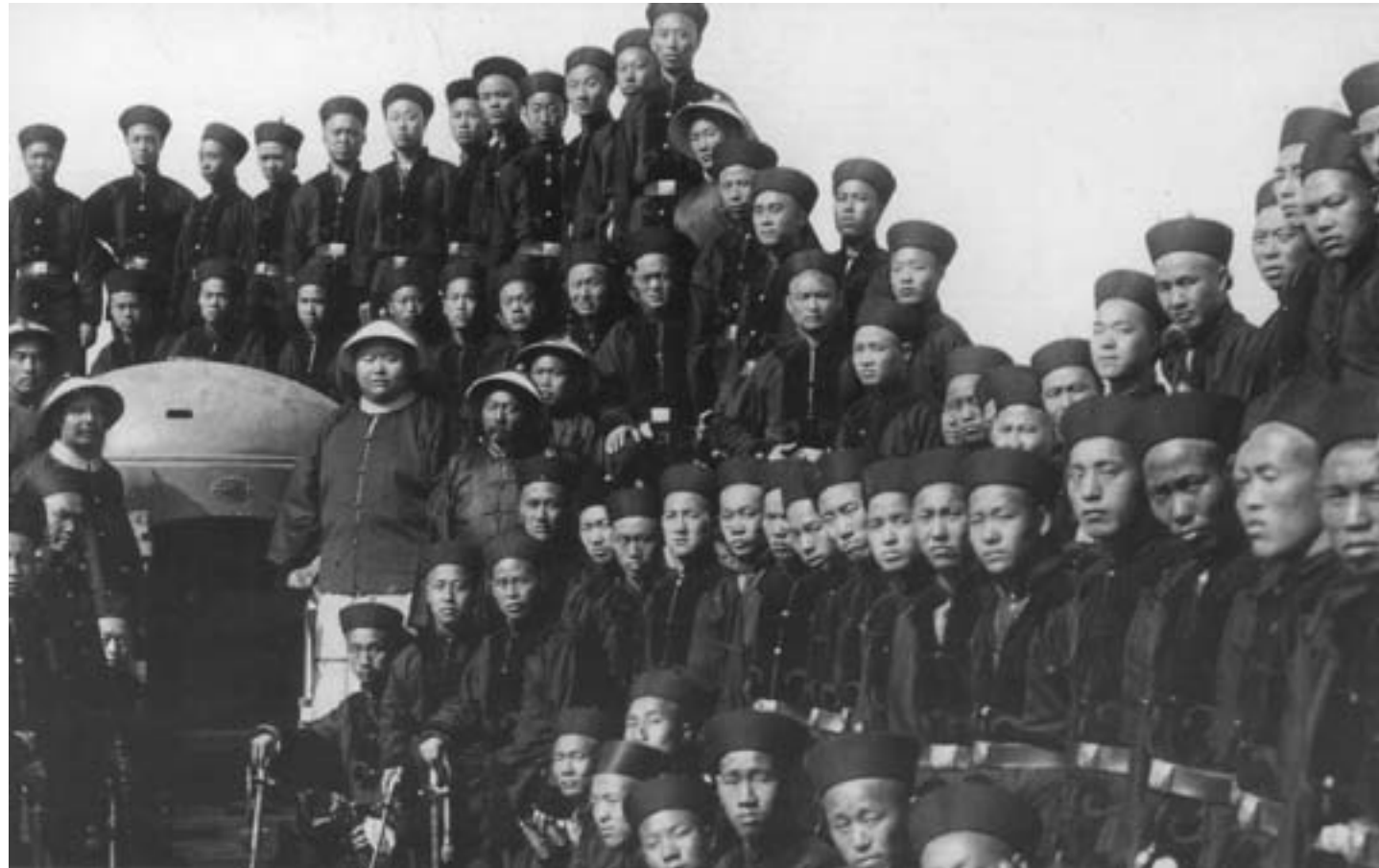
Ufficiali e soldati dell'esercito imperiale cinese a Pechino, ca. 1905, fotografia in bianco e nero, Monaco di Baviera, Beate Ambros

La crisi che aveva aperto il XX secolo fu premonitrice di trasformazioni irreversibili su molti piani per la Cina imperiale. Gli esiti disastrosi della rivolta dei Boxer, con l'umiliazione di un trattato di pace che sanciva, di fatto, l'assoggettamento agli stranieri delle risorse finanziarie e anche di parte delle prerogative dello Stato cinese, accelerarono infatti il processo di cambiamento i cui segni si erano già manifestati alla fine dell'Ottocento.