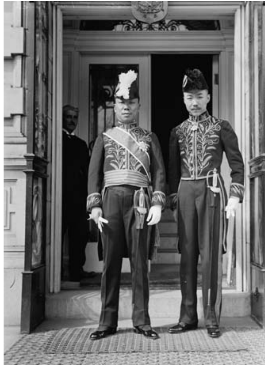
Harris & Ewing, L'ambasciatore e il primo segretario della legazione cinese nella capitale americana, 1917, fotografia in bianco e nero, Washington DC, Library of Congress

preferirono restare, gettando i presupposti per la presenza della diaspora cinese nell'Europa continentale. Il loro lavoro guadagnò alla Cina un posto alla conferenza di pace di Versailles, nel 1919, fra i paesi vincitori.