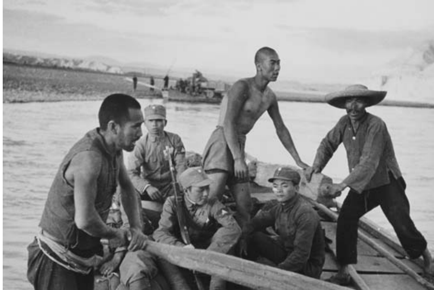
Robert Capa, Soldati nazionalisti traghettati sul Fiume Giallo, luglio 1938, fotografia in bianco e nero, Hong Kong, Kan Yuet-keung Collection

Indeboliti i rapporti con l'Unione Sovietica dopo la rottura con i comunisti cinesi nel 1927, il governo nazionalista, forte di un corpo diplomatico cosmopolita e istruito, guardò piuttosto alle potenze occidentali. Riconosciuto come legittimo rappresentante del popolo cinese, fra il 1928 e il 1931 portò avanti lunghe trattative per riprendere, come si è visto, l'autonomia tariffaria e quella giurisdizionale sui propri cittadini nei porti aperti, contando su una certa disponibilità del governo di Londra verso le legittime richieste cinesi. Nanchino ricevette poi il supporto di potenze europee emergenti, come la Germania che, persi i privilegi dei trattati con la Prima guerra mondiale, si poneva su un piano di piena parità diplomatica ed era disposta ad aiutare, almeno fino alla prima metà degli anni Trenta, l'impresa nazionalista anche attraverso i propri consiglieri. Tra il 1933 e il 1939, la Germania inoltrò in Cina un notevole quantitativo di armi e rifornimenti bellici, apparecchiature radio e telefoniche, oltre a uniformi militari, scarponi ed elmetti di foggia tedesca. Ma Berlino procurò a Nanchino anche attrezzature ferroviarie e macchinari per l'industria. Pure l'Italia fascista sviluppò relazioni positive in ambito militare con Chiang Kai-shek, cooperando nello sviluppo di un'aviazione militare.