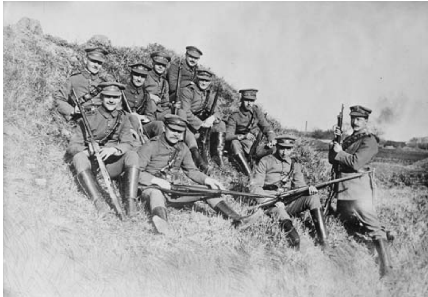
Soldati tedeschi della guarnigione di Qingdao, 1914, fotografia in bianco e nero

si vennero formando fra di loro all'inizio degli anni Venti. La faziosità venne ulteriormente peggiorata dalla corruzione diffusa dei parlamentari, mentre, a fasi alterne, la stessa capitale vide l'arrivo e l'occupazione degli eserciti dei militaristi regionali. Il risultato fu un'inesorabile erosione della fiducia nei confronti delle istituzioni nate con la rivoluzione del 1911.