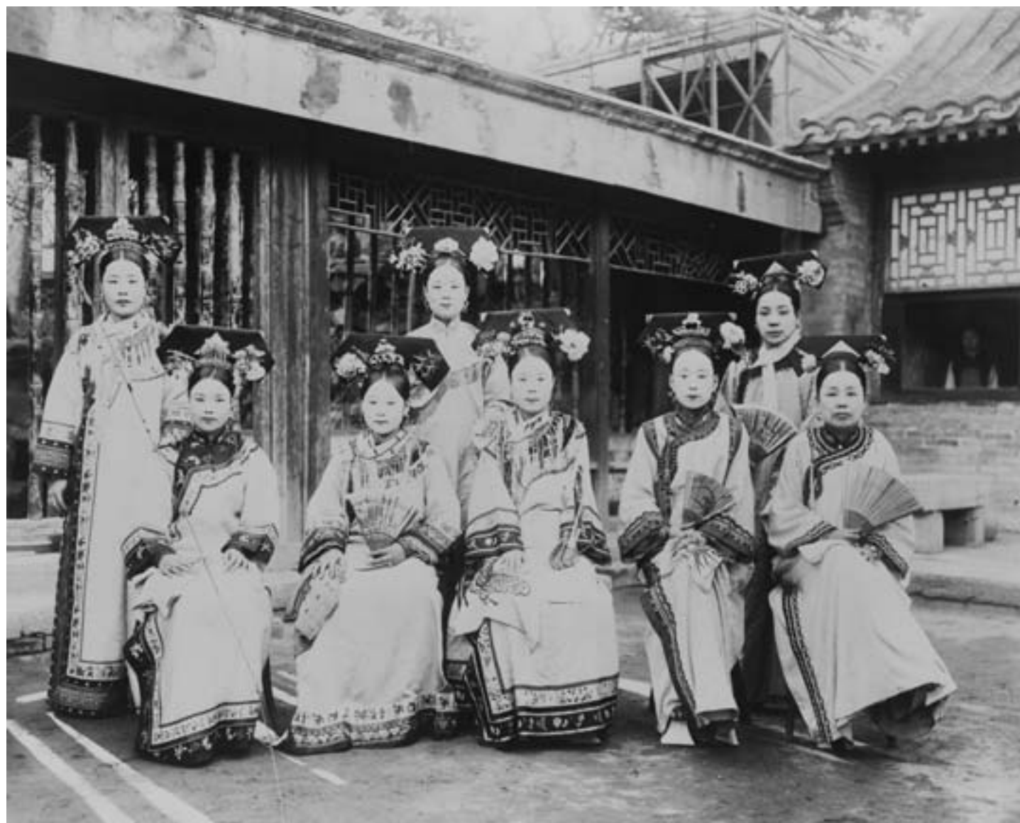
Gruppo di donne mancesi residenti nel Palazzo Imperiale di Pechino, ca. 1920, fotografia in bianco e nero, Washington DC, Library of Congress

Columbia University, fortemente influenzato da John Dewey (1859-1952); ma anche i racconti in lingua vernacolare di Lu Xun (1881-1936), uno dei più talentuosi scrittori e saggi cinesi, pronto a denunciare l'ipocrisia di una retorica rivoluzionaria che nascondeva o ignorava i veri nodi sociali e culturali della crisi cinese.