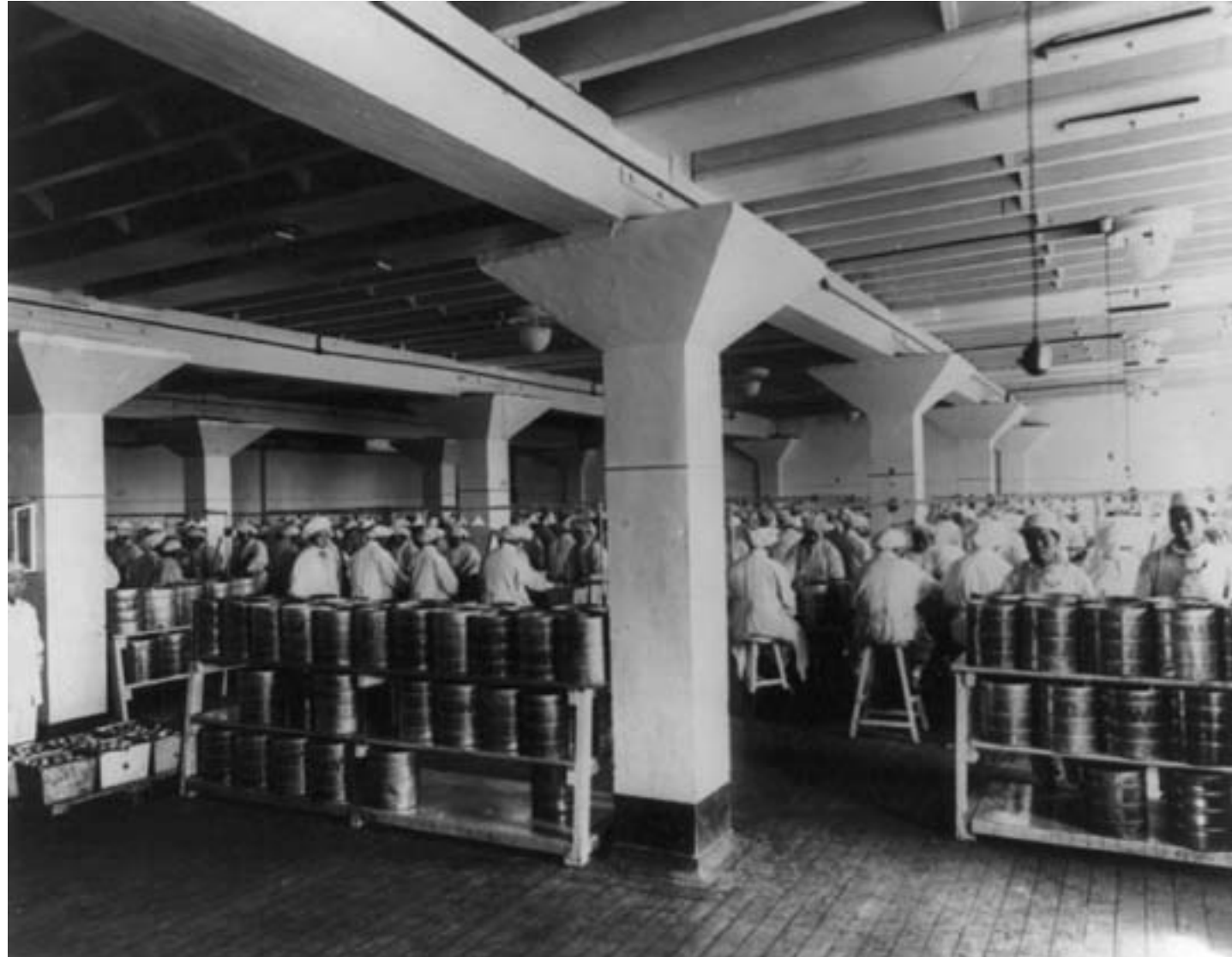
Separazione del tuorlo dal bianco e imballaggio delle uova in uno stabilimento a Shanghai, 1920, fotografia in bianco e nero, Washington DC, Library of Congress

noscevano negli obiettivi rivoluzionari del fronte unito fra nazionalisti e comunisti, ma erano ben radicate anche nella diplomazia del governo di Pechino. L'attivismo del governo repubblicano non aveva però ottenuto i risultati attesi. Dopo Versailles, la diplomazia cinese aveva raggiunto solo in parte i propri obiettivi con la conferenza di Washington fra il 1921 e il 1922, quando il Giappone era stato costretto a restituire lo Shandong a Pechino e tutte le potenze si erano impegnate a non chiedere ulteriori concessioni, mantenendo lo status quo nel Pacifico. La Repubblica di Cina era membro della Società delle Nazioni, organizzazione con la quale Pechino collaborò attivamente in diversi ambiti, aderendo a molte convenzioni internazionali. Tuttavia, in linea generale, questa partecipazione non aveva scalfito in modo significativo la condizione d'ineguaglianza giuridica fra cinesi e stranieri sul suolo della repubblica e le rendite e le posizioni privilegiate occidentali e giapponesi sul piano economico. Si faceva strada, nella società cinese, la convinzione che solo con la forza si sarebbe potuto ottenere l'uguaglianza sul piano internazionale.