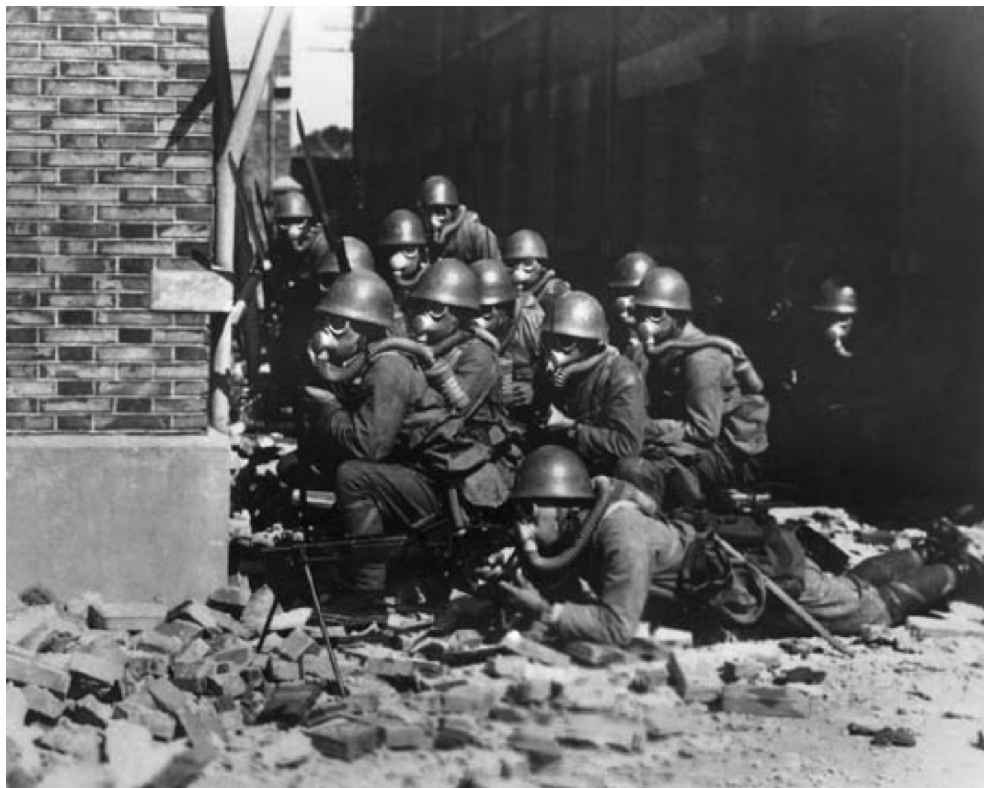
James B. Barnes, Forze da sbarco speciali della Marina imperiale giapponese in azione durante la battaglia di Shanghai, 1937, fotografia in bianco e nero, Tokyo, Ministero della Marina

Zuolin, il governatore Zhang Xueliang aveva concordato con Chiang Kai-shek l'affermazione della sovranità del governo nazionalista su queste tre province del nord-est. Tokyo, a sua volta, aveva riconosciuto il governo di Nanchino. La tensione fra il Giappone, che in Manciuria aveva i suoi maggiori interessi economici in terra cinese e guardava con timore ai rischi di un'espansione sovietica nell'area, e i cinesi lì residenti, tuttavia, rimase molto alta, a causa delle discriminazioni a cui gli autoctoni erano sottoposti da parte dei giapponesi.