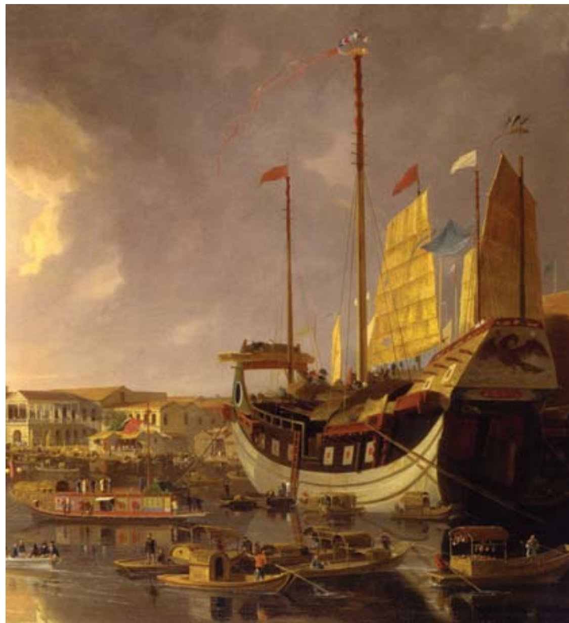
William Daniell, Una giunca da carico cinese ormeggiata di fronte alle factories europee a Canton, ca. 1790, olio su tela, Greenwich, National Maritime Museum

Nell'agosto del 1839, quando la Prima guerra dell'oppio non era ancora scoppiata, il Commissario imperiale Lin Zexu, inviato a Canton per porre fine al contrabbando dell'oppio, nel quale un ruolo essenziale avevano i mercanti inglesi, scrisse una lunga e appassionata lettera alla regina Vittoria, che da poco era ascesa al trono e che avrebbe fornito un contributo fondamentale - come è noto - allo sviluppo della vita economica, sociale e culturale della Gran Bretagna e al suo processo di espansione coloniale. Nella lettera, Lin Zexu affermava tra l'altro (cit. da R. Keith Schoppa, The Columbia Guide to Modern Chinese History , New York, Columbia UP, 2000, pp. 270-71; traduzione mia):