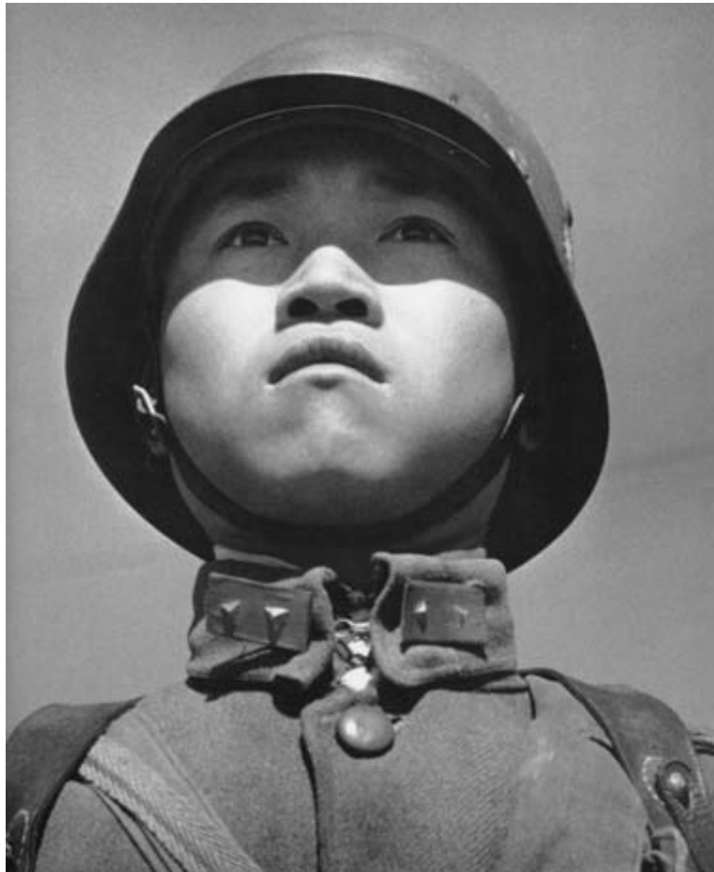
Robert Capa, Un giovane soldato nazionalista pronto per la battaglia, 1938, fotografia in bianco e nero, Hong Kong, Kan Yuet-keung Collection

a giustificazione della debolezza cinese sul piano internazionale. Quella degenerazione era simboleggiata agli occhi di molti dal vizio dell'oppio, la cui diffusione nessun governo repubblicano era riuscito, purtroppo, a sradicare. All'oppio si erano gradualmente affiancate la morfina e l'eroina, all'epoca della Prima guerra mondiale importate in grande quantità dall'Europa, ma ora sintetizzate in loco dalla malavita organizzata, al punto che Shanghai stava diventando uno dei centri globali di produzione di droga anche per il mercato internazionale.