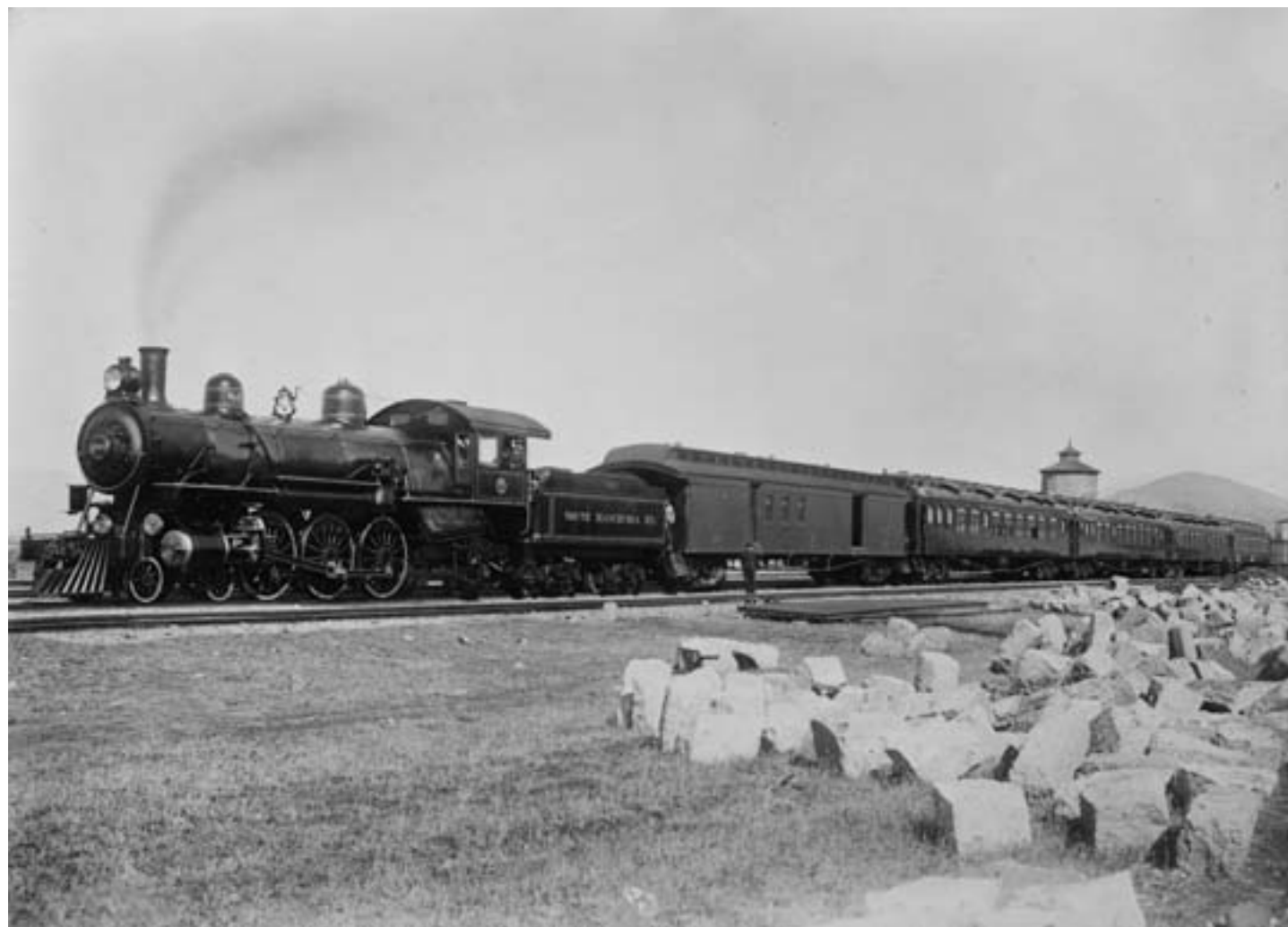
Treno espresso in transito sulla South Manchurian Railway, ca. 1920, fotografia in bianco e nero

passato costituisse una risorsa importante per l'affermazione dell'identità nazionale e per la modernizzazione del paese. Queste, a loro volta, non potevano però prescindere da un rafforzamento dello Stato centrale e della sua capacità di guidare e modellare le dinamiche sociali. Autoritario, e per nulla alieno all'uso della violenza nell'esercizio del potere, Chiang Kai-shek era soprattutto un militare, tanto che, agli occhi di diversi osservatori stranieri, per lungo tempo egli sembrò di fatto l'ultimo dei signori della guerra.