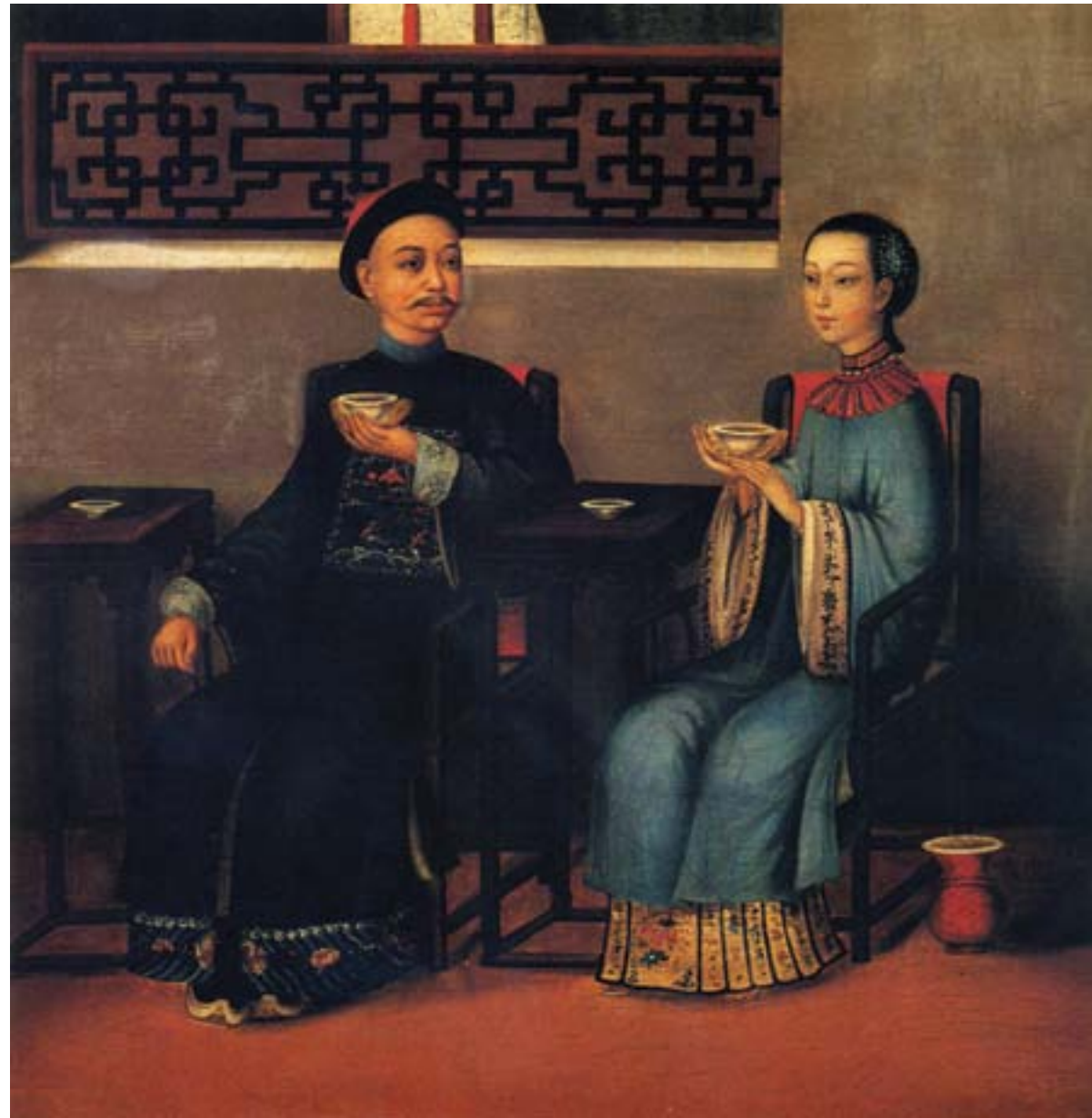
Artista cinese, Ritratto di una coppia cinese di Hong Kong che beve il tè, ca. 1835, olio su tela, Hong Kong, Museum of Art

popolare molto diffusa. Il console francese - era la Francia, infatti, la potenza protettrice dei missionari cattolici nell'impero Qing - si recò dal funzionario locale per chiedere spiegazioni, ma nella foga sparò un colpo di pistola uccidendo l'assistente del magistrato imperiale. La folla inferocita attaccò la Cattedrale cattolica e l'annesso convento di suore, bruciando gli edifici e uccidendo le religiose, oltre allo stesso console e ad altri stranieri, in gran parte francesi. Nonostante l'impe-