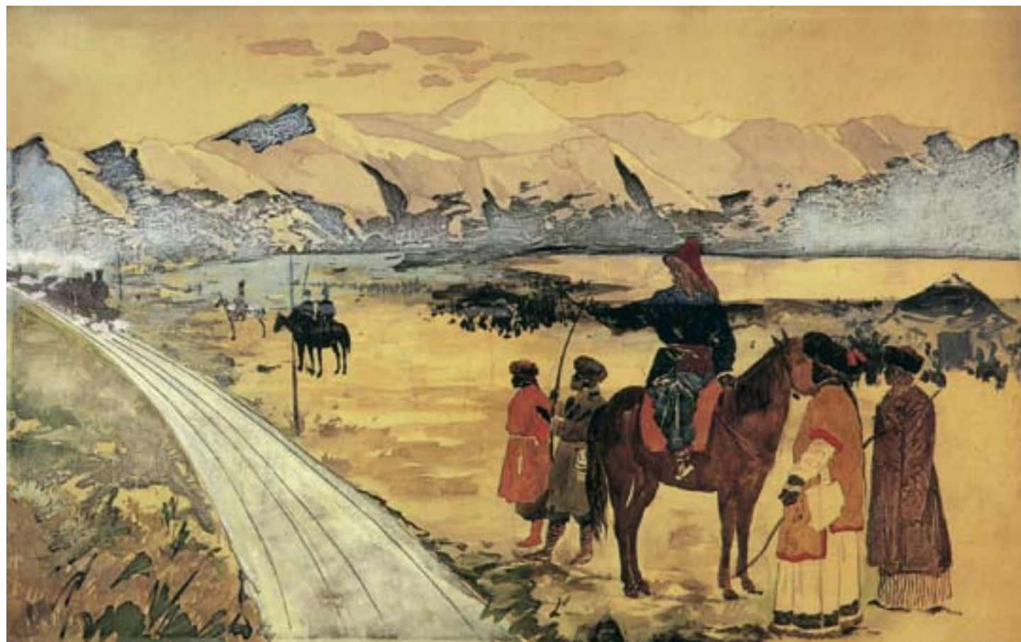
Henry Gray, La ferrovia Transmanciuriana, 1904, tempera su carta, Collezione privata

sconfitte ad Adua, nel 1896, dalle forze abissine, il più grave smacco subito da una potenza europea in una guerra coloniale): la scomposta reazione di Roma, che giunse persino a presentare un ultimatum, poi precipitosamente ritirato sotto pressione britannica, e il fallimento diplomatico ebbe gravi conseguenze politiche in Italia e comportò la caduta del governo.