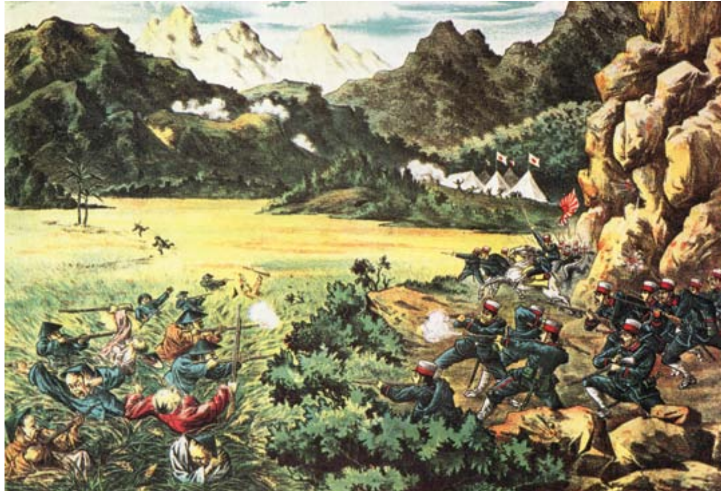
Uno scontro fra truppe giapponesi e guerriglieri taiwanesi nell'estate del 1895, per determinare il controllo dell'isola, ca. 1896, cromolitografia, Londra, Sotheby's

le parole di Dikötter, con riferimento alla provincia interna dello Shanxi, "il filo di cotone era il solo collegamento con il mondo esterno, ed erano i cammelli che trasportavano il prodotto di Fall River, nel Massachusetts, fino al Gansu e alla Mongolia Interna" (Dikötter, 2007: 194).