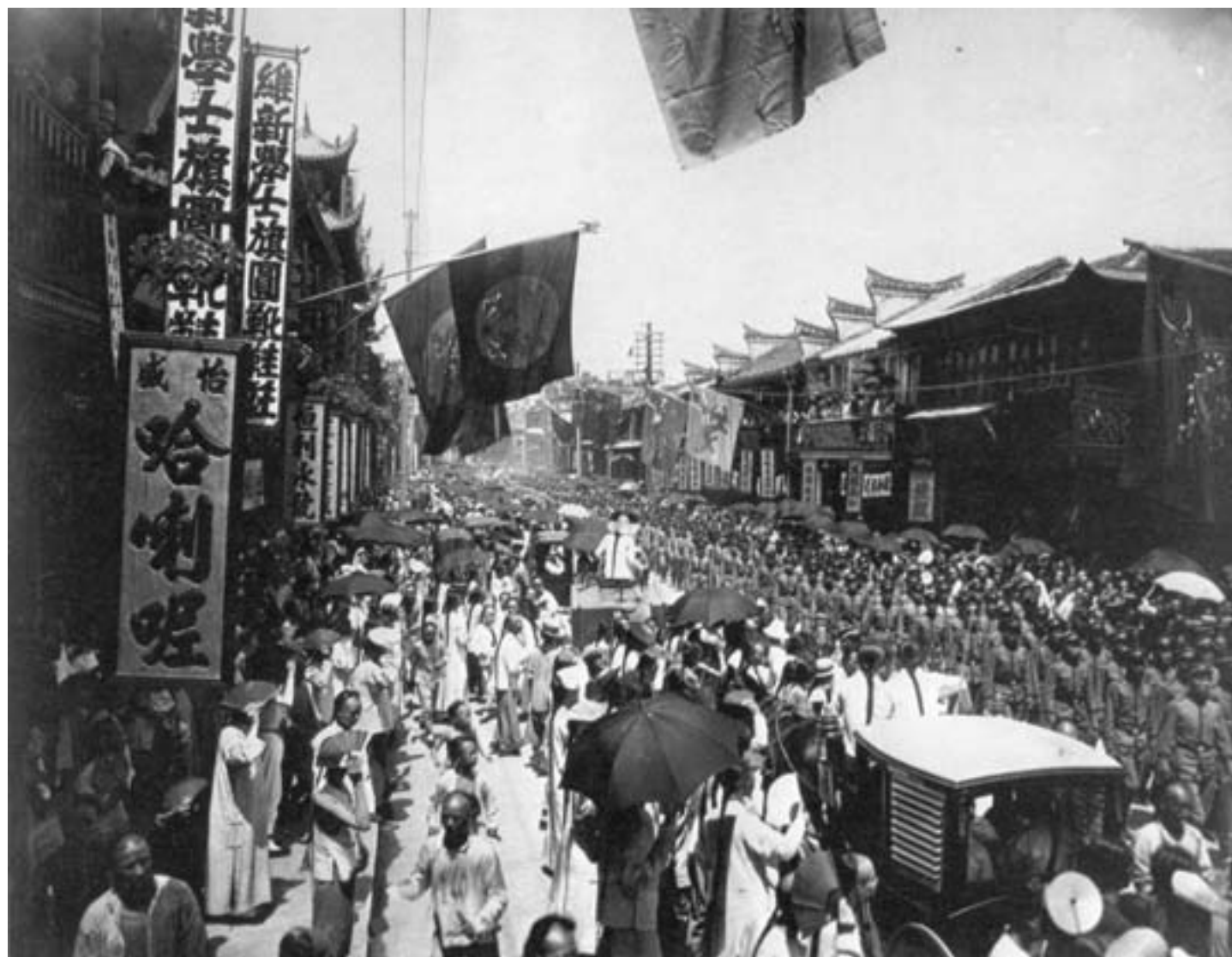
Sfilata di truppe a Shanghai, 1906, fotografia in bianco e nero

ste e insurrezioni armate. Nella primavera del 1916 Yuan fu costretto a tornare sui suoi passi e a rinunciare. Nel giugno dello stesso anno, morì per malattia, lasciando un vuoto di potere che avrebbe avuto pesanti conseguenze sul paese.