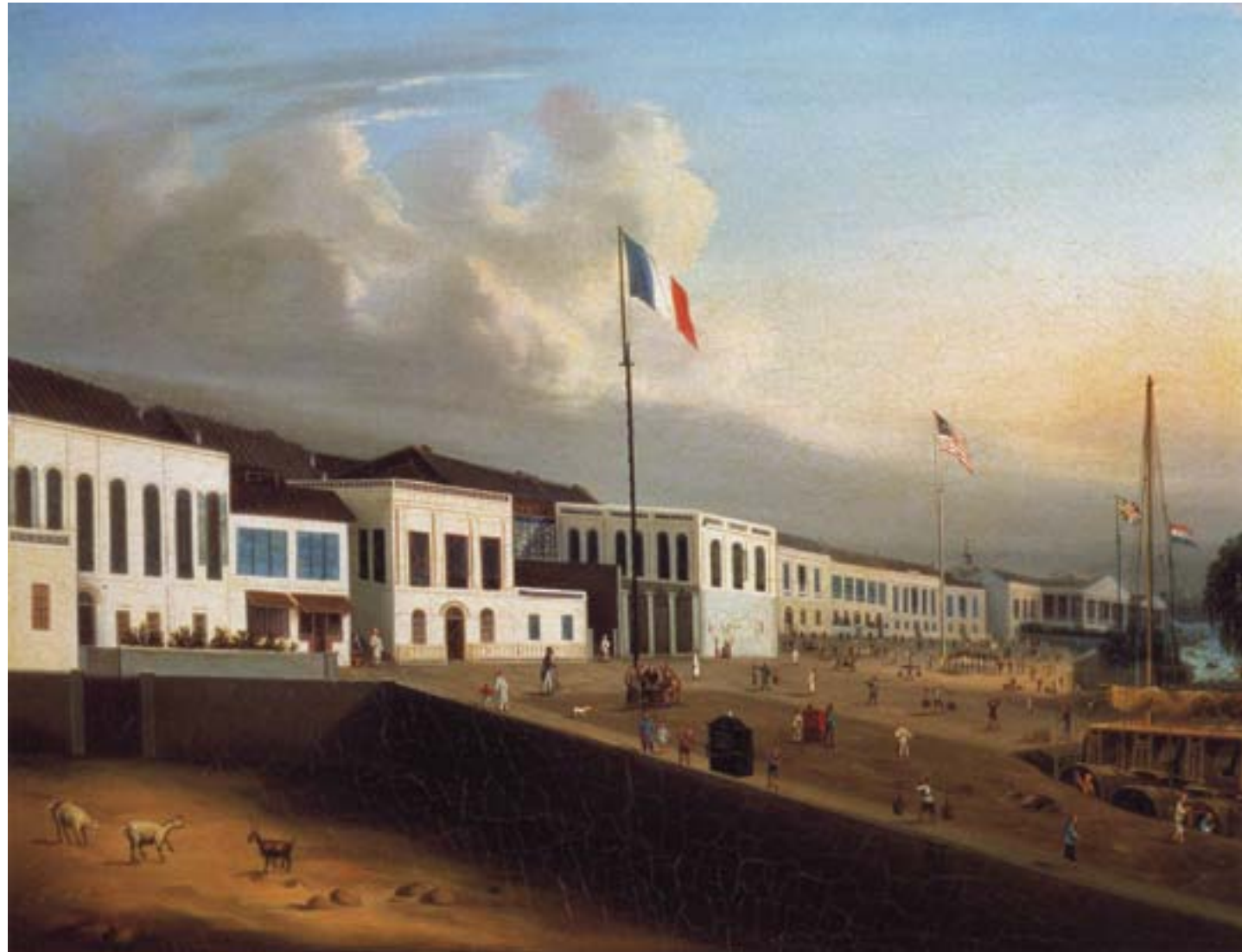
Lamqua, Veduta delle factories occidentali a Canton, ca. 1830, olio su tela, Hong Kong, Museum of Art

“Non si trova traccia diabolica dell'intenzione di sedurre e distruggere un antico impero dall'altra parte del mondo. La rovina è stata una conseguenza incidentale di quel commercio orientale di cui l'Inghilterra è così orgogliosa. È stato il trionfo della bilancia dei pagamenti sul senso comune di umanità” (Merwin, 1906: 9).