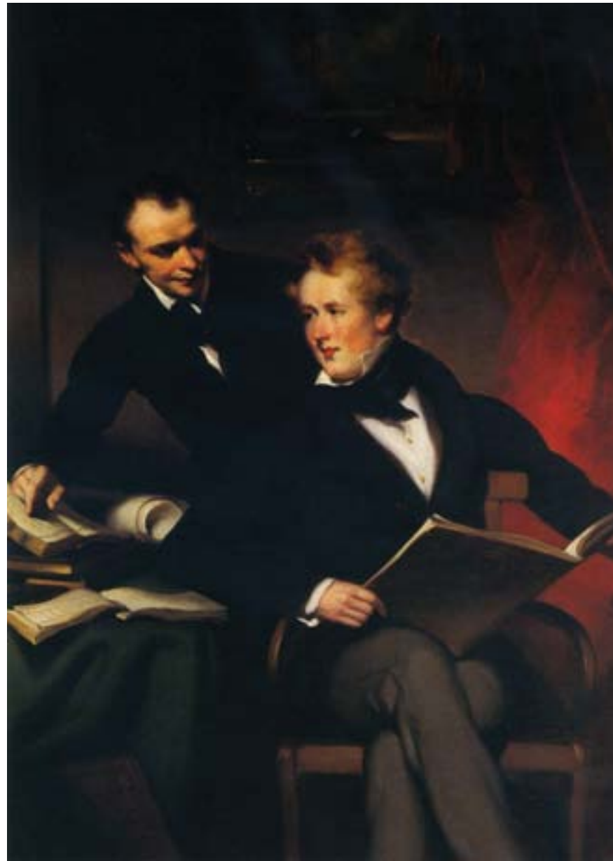
George Chinnery, Ritratto di John Robert Morrison, segretario coloniale inglese a Hong Kong, ca. 1842, olio su tela, Hong Kong, Museum of Art

Con il 1860 si apriva, per le relazioni fra Europa e Cina, una nuova fase. La corsa al “banchetto cinese”, che alla fine dell'Ottocento avrebbe trasformato la Cina in un oggetto della politica internazionale, subordinando la sovranità dello Stato cinese agli interessi economici e geopolitici delle potenze straniere, era appena iniziata. Tuttavia la presenza e l'influenza europea in Cina andarono rapidamente crescendo in particolare a Hong Kong e nei treaty ports (porti dei trattati), dove nacquero delle aree, dette concessioni, non sottoposte alla giurisdizione cinese.