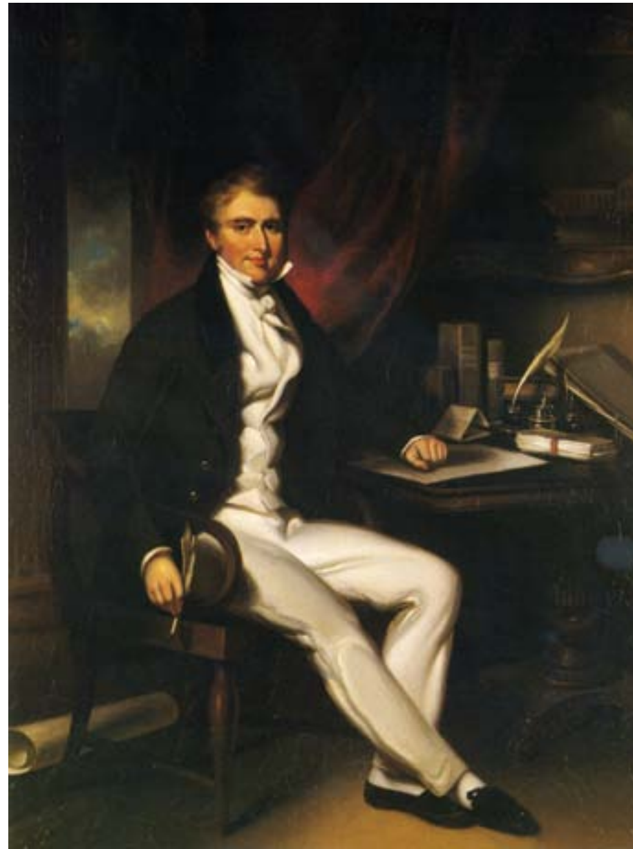
George Chinnery, Ritratto del taipan dottor William Jardine, ca. 1825, olio su tela, Hong Kong, Museum of Art

mercato cinese da riequilibrare a favore degli inglesi una bilancia dei pagamenti tradizionalmente in perdita per Londra. Fra il 1752 e il 1800, ben 105 milioni di dollari messicani entrarono in Cina grazie al commercio con gli europei; fra il 1808 e il 1856, invece, furono oltre 384 i milioni di dollari messicani d'argento che lasciarono le coste cinesi: in gran parte erano serviti ad acquistare l'oppio prodotto nel Bengala. Nei primi vent'anni dell'Ottocento, furono contrabbandati in Cina circa quattromila chest di oppio; dieci anni dopo, erano già ventimila, e all'epoca della Prima guerra dell'oppio, la quantità di droga smerciata in Cina era ormai raddoppiata.