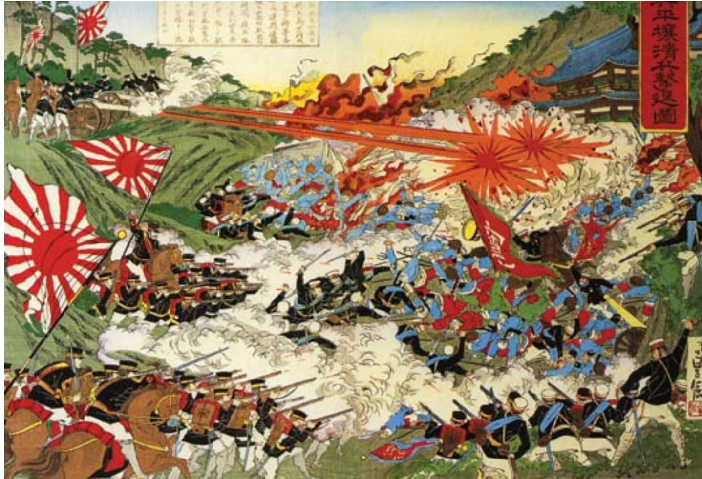
Battaglia campale ai piedi di una collina durante la Prima guerra sino-giapponese, 1895, incisione colorata, Londra, Sotheby's

dal Golfo del Tonchino, ma impegnava il paese europeo a non avanzare pretese territoriali nell'impero cinese. Tuttavia, nello stesso anno, nella corte Qing iniziarono a prevalere le tendenze più radicali, non disposte al compromesso con i "barbari" auspicato da funzionari come Li Hongzhang, consapevole della debolezza militare della Cina nei confronti dell'Europa. Per molti mandarini si trattava di una questione di principio: a loro dire una posizione troppo arrendevole verso le richieste francesi avrebbe inevitabilmente aperto la strada a nuove richieste e pretese su territori di confine da parte di altre potenze, come la Gran Bretagna e la Russia.