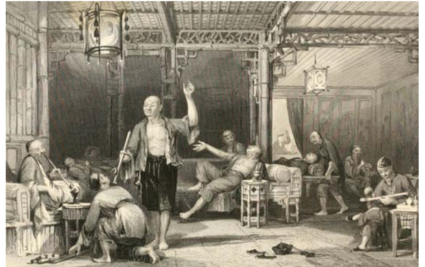
Thomas Allom, China, in a Series of Views . Fumatori d'oppio cinesi, Londra, 1843, incisione su carta, Londra, Sotheby's

conflitto con la maggiore potenza marittima dell'epoca, la Gran Bretagna, ansiosa di affermare i suoi interessi economici e strategici in Asia orientale. La Prima guerra dell'oppio aprì una nuova fase nella storia della regione.