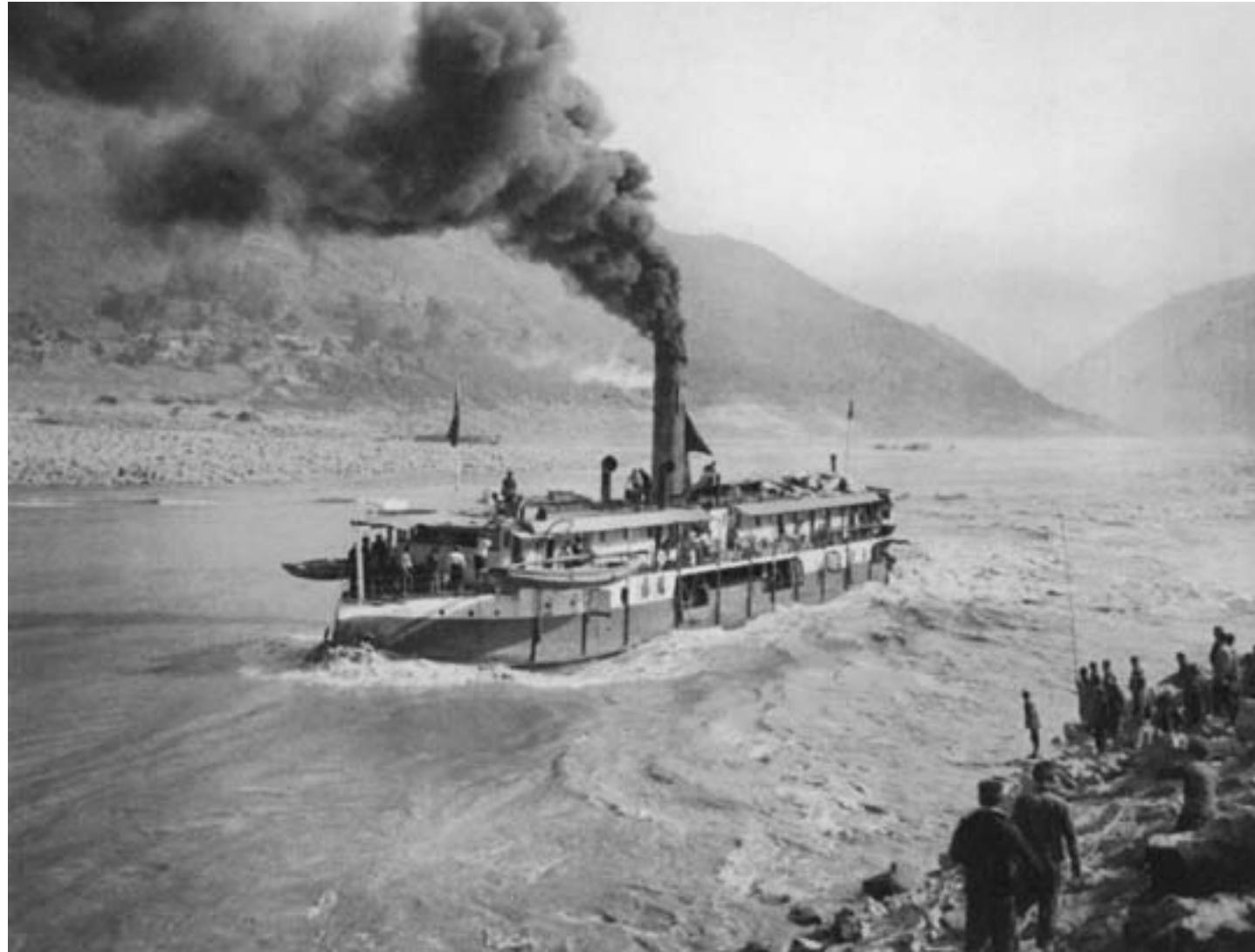
Il vapore fluviale SS Hung-Fu compie il suo secondo tentativo di superare le rapide di Ye-Tan sullo Yangzi, ca. 1890, fotografia in bianco e nero, Collezione privata

venne acquistata dal funzionario Shen Baozhen (1820-1879), che la fece smantellare e trasferire a Taiwan. Pochi anni dopo, nel 1881, la società mineraria cinese che controllava le miniere di Kaiping, grazie al sostegno deciso di Li Hongzhang, fece costruire una linea ferroviaria lunga una decina di chilometri fra le miniere e la cittadina di Xugezhuang, dalla quale il carbone era trasportato per via fluviale fino al porto di Tianjin. Solo successivamente, vinte le resistenze dell'opposizione, il collegamento ferroviario venne esteso fino a raggiungere il mare.