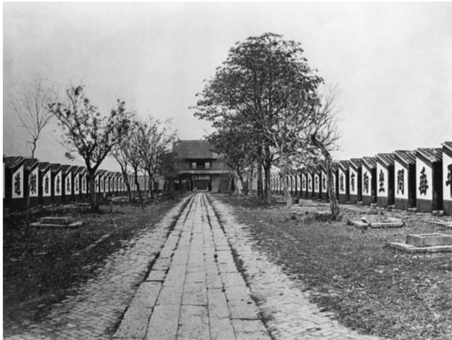
Sale degli esami a Canton, con 7.500 celle per gli studenti, ca. 1873, fotografia in bianco e nero

la collaborazione con gli stranieri fu inevitabile, per quanto ritenuta problematica dai funzionari più conservatori.