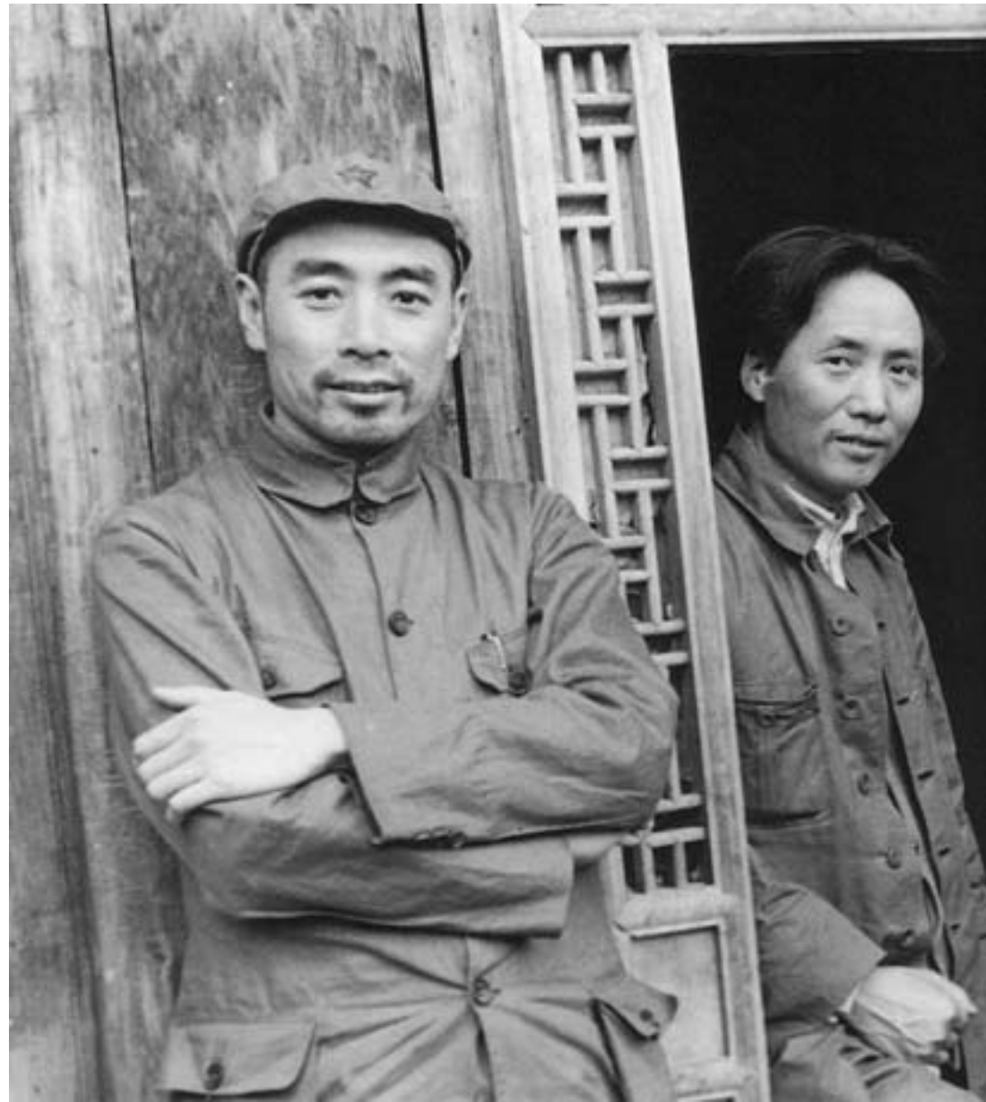
Helen Snow, Zhou Enlai e Mao Zedong a Yan'an tre mesi prima dello scoppio della Seconda guerra sino-giapponese, 1937, fotografia in bianco e nero

tradizionale in famiglia, optando poi per la carriera militare, proseguita anche in Giappone, dove aveva aderito alla Lega di Sun Yat-sen. La sua esperienza personale a Mosca fu breve, solo qualche mese, ma suo figlio maggiore, Chiang Ching-kuo (1910-1988), vi rimase ben dodici anni.