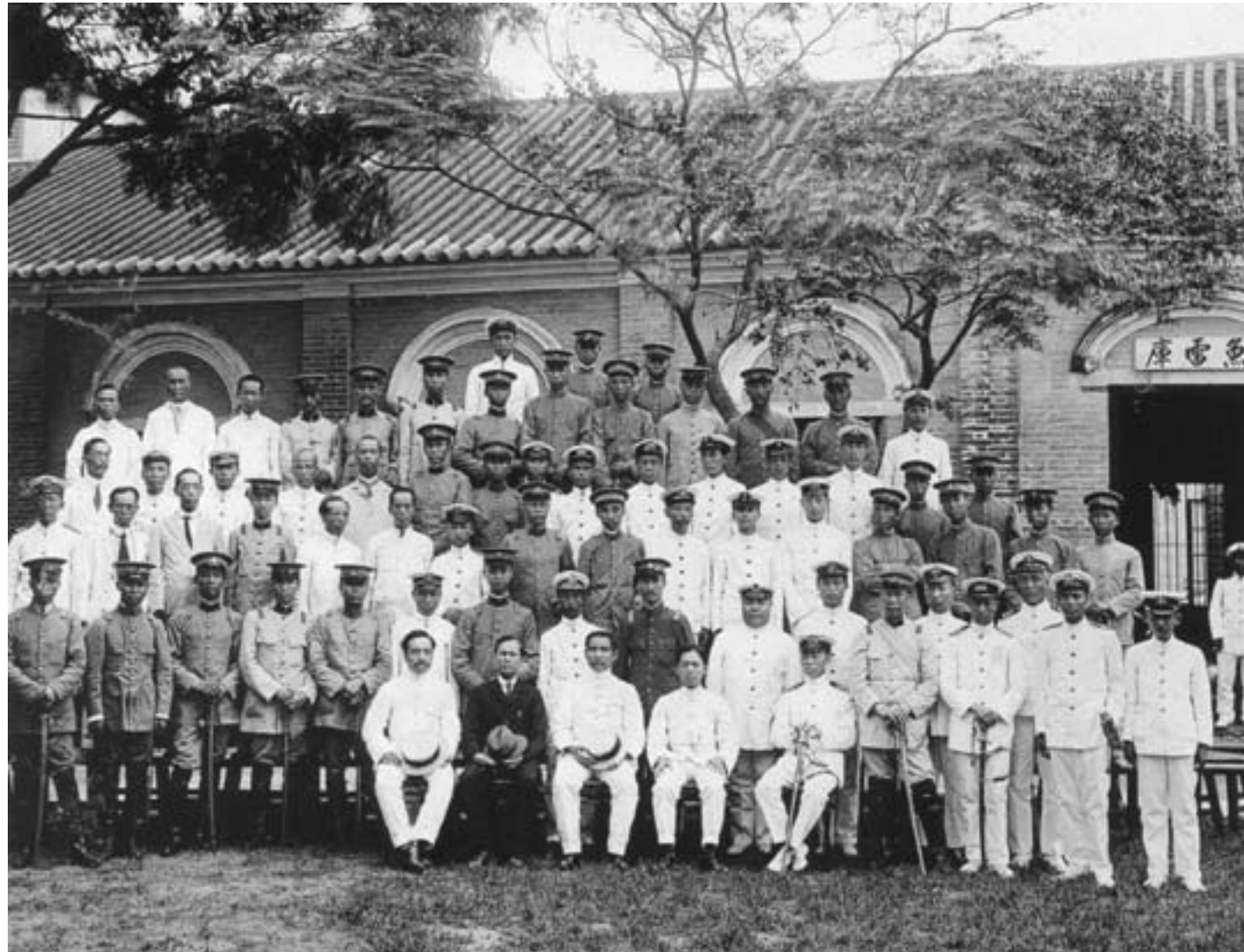
Sun Yat-sen e i suoi sostenitori militari a Canton, ca. 1920, fotografia in bianco e nero

zione del partito. Nel luglio del 1921, i rappresentanti dei diversi gruppi presenti nelle varie province si ritrovarono a Shanghai, nella Concessione francese, per il congresso di fondazione. Erano presenti una cinquantina di delegati e un paio di rappresentanti del Comintern, fra cui il più noto era Henk Sneevliet, conosciuto come Maring (1883-1942). Fu eletto segretario Chen Duxiu, uno dei protagonisti del movimento di nuova cultura. Anche Mao Zedong (1893-1976), futuro leader della Cina comunista, era presente come delegato della sua provincia d'origine, lo Hunan.