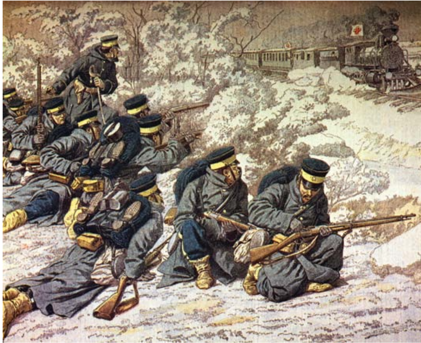
I soldati giapponesi attaccano un treno russo lungo la ferrovia Transiberiana, 1904, cromolitografia, Londra, Sotheby's

ingorda del capitalismo europeo, pronto a ricorrere anche alla violenza pur di accaparrarsi le migliori fonti di materie prime e ampi mercati di sbocco per i propri prodotti industriali. Ma Hobson ricordava anche come lo stesso capitalismo occidentale avrebbe finito per consegnare ai cinesi gli strumenti, tecnici, economici e culturali, per guadagnare una posizione di assoluta preminenza economica e commerciale a livello globale, grazie all'enorme potenziale demografico.