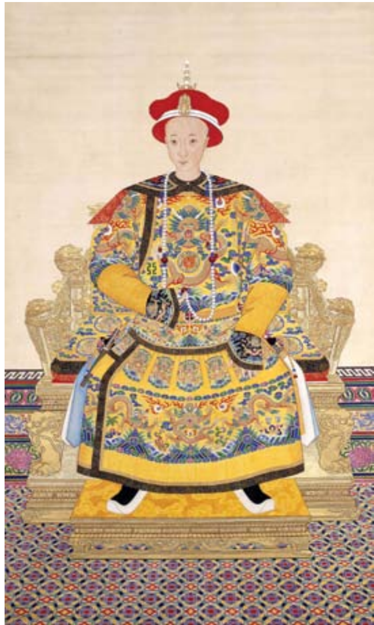
Artista cinese, Ritratto dell'imperatore Tongzhi, 1861, dipinto su seta, Pechino, Museo del Palazzo Imperiale

il principale leader degli insorti; due anni dopo, la ribellione musulmana era terminata, riportando sotto il controllo imperiale regioni di notevole importanza strategica. Le crisi che avevano minacciato la dinastia Qing nel decennio precedente