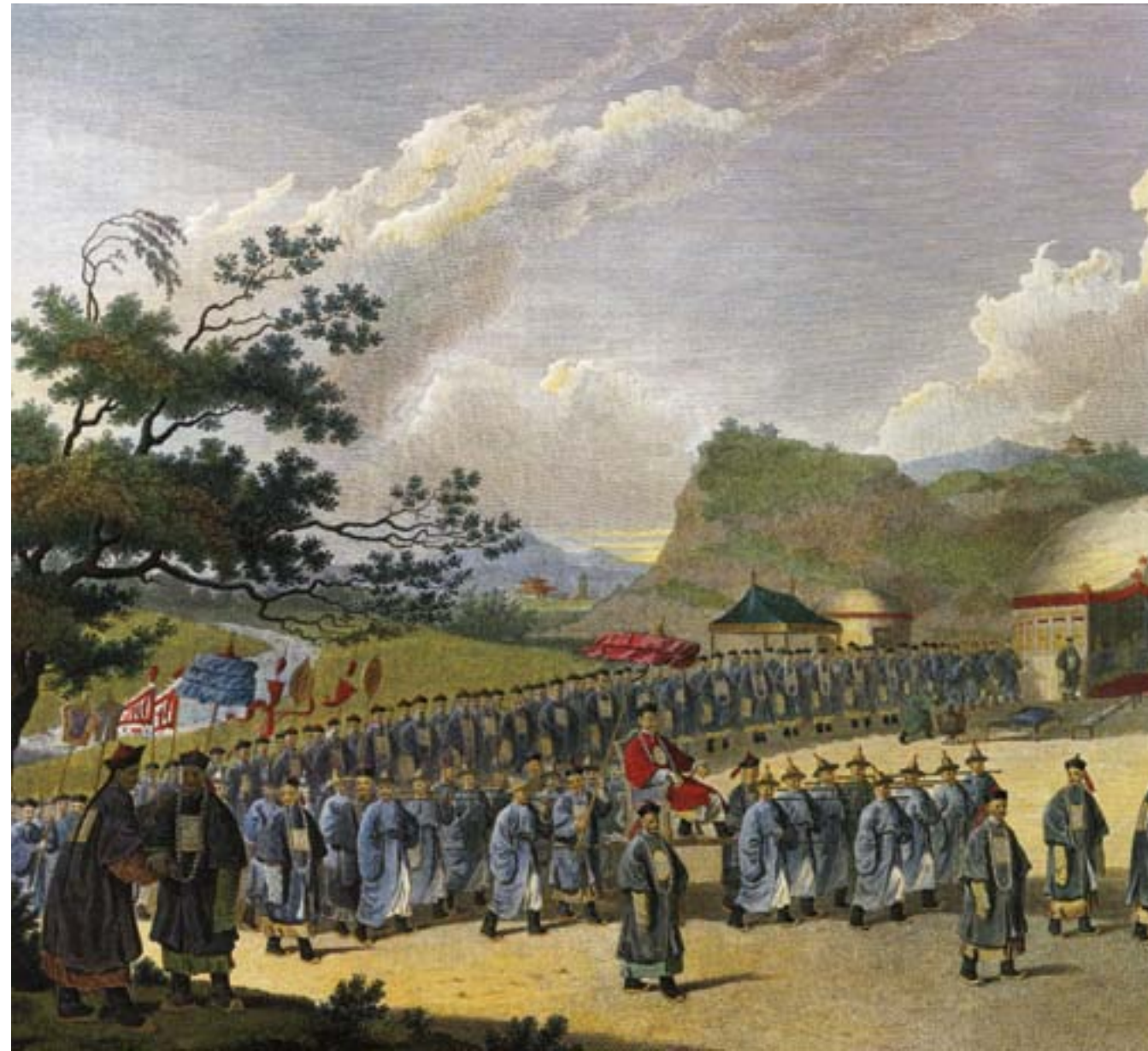
William Alexander, The Costume of China . Ambasceria di lord Macartney. Un mandarino cinese viene condotto su un palanchino a ricevere gli ospiti inglesi, Londra, 1805-1814, incisione colorata, Londra, Sotheby's

di paesi che, pur indipendenti politicamente, riconoscevano l'egemonia regionale della dinastia regnante a Pechino e la superiorità culturale cinese di cui questa si faceva interprete. Queste relazioni gerarchiche si esprimevano attraverso le missioni tributarie che, al di là degli aspetti politico-simbolici, costituivano anche delle occasioni di scambio economico e commerciale. Al di fuori delle relazioni tributarie, il commercio fra la Cina e i paesi confinanti era strettamente regolamentato per ragioni di sicurezza dei confini, sia continentali che marittimi.