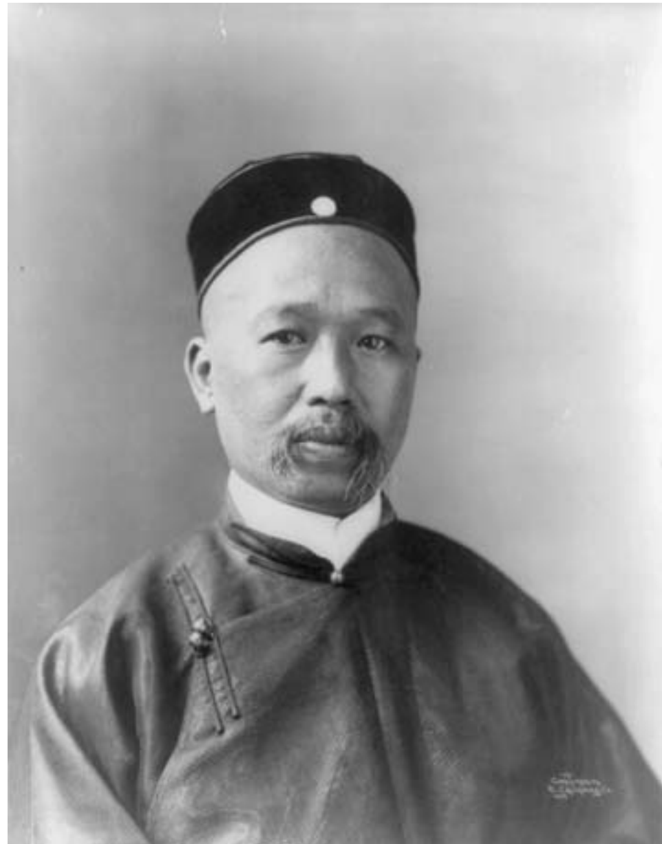
Ritratto di un diplomatico cinese, ca. 1905, fotografia in bianco e nero, Washington DC, Library of Congress

un passaggio fondamentale verso una nuova epoca. In realtà nelle aree urbane e, soprattutto, nei porti aperti all'influenza straniera, diversi fattori avevano già iniziato a indebolirne l'importanza: le famiglie dell' élite , le più abbienti e colte, cominciarono a preferire per i propri figli, dopo l'iniziale educazione confuciana impartita spesso nella scuola di famiglia, lo studio del "nuovo sapere" occidentale. Ma altrove, nelle province interne e nelle aree rurali, la decisione del governo dette avvio a un processo, graduale ma inarrestabile, d'indebolimento del prestigio e del potere informale dei letterati confuciani, lasciando di fatto un vuoto d'autorità significativo nella struttura della società locale.