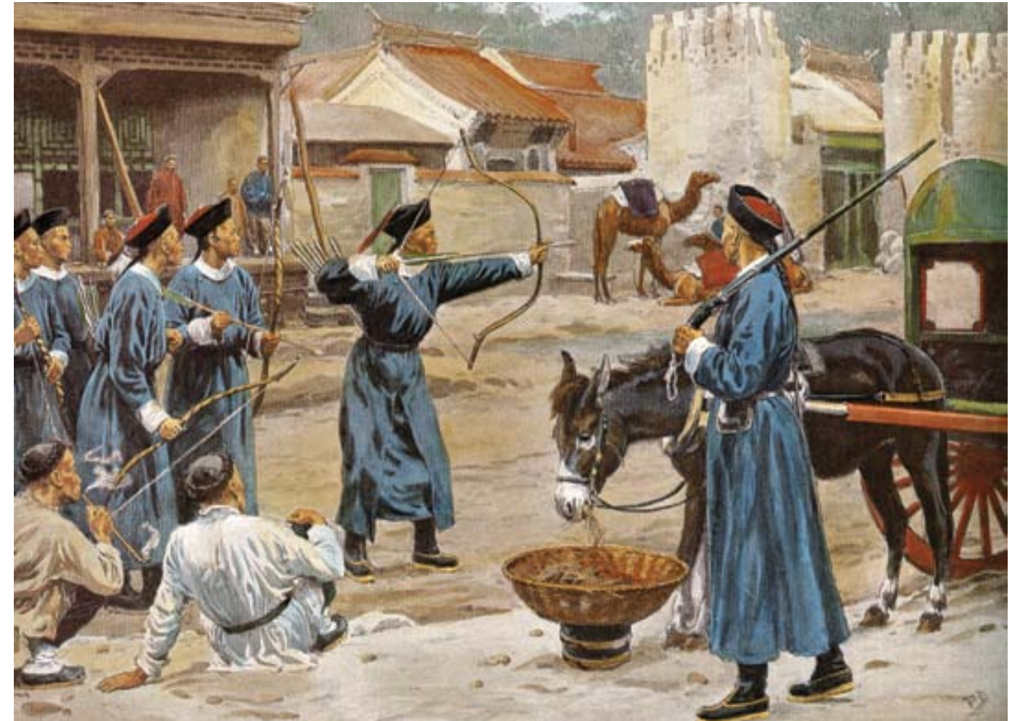
Gara di tiro con l'arco per addestramento dei soldati, ca. 1870, tempera su carta, Collezione privata

furono gradualmente dunque risolte. Una nuova sfida era divenuta però evidente sul piano politico e culturale: la necessità di comprendere ed adattarsi alla più aggressiva presenza occidentale sul territorio dell'impero.