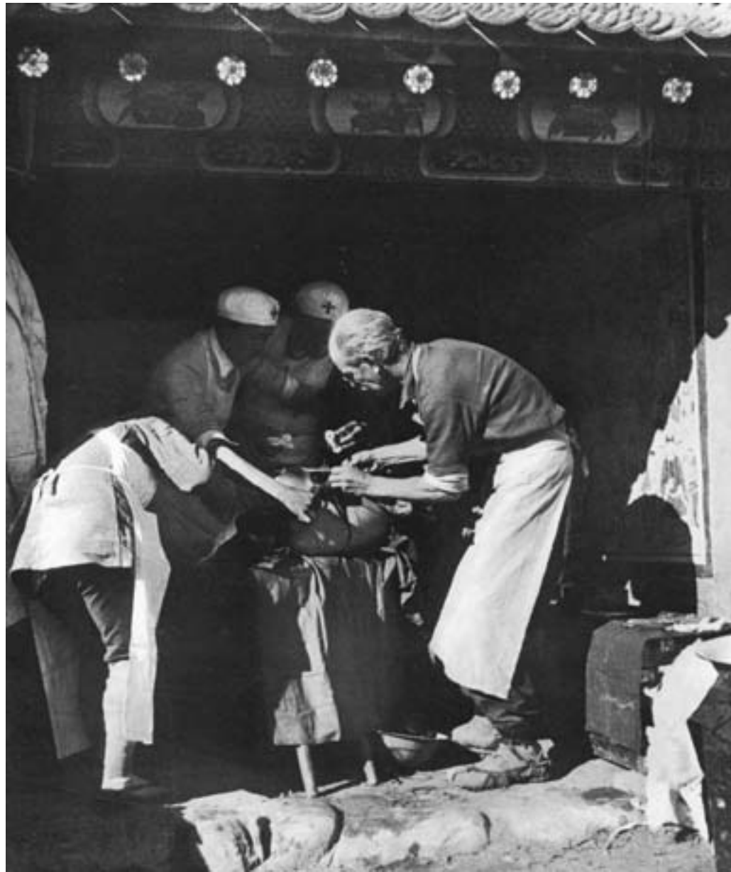
Norman Bethune, medico canadese e combattente internazionalista, opera un ferito dell'Ottava armata cinese, 1939, fotografia in bianco e nero, Collezione privata

d'affari come il tedesco John Rabe (1882-1950), rappresentante della Siemens in Cina e pure membro del Partito nazionalsocialista, missionari ed educatori come Minnie Vautrin (1886-1941), responsabile dell'istituto femminile missionario Jinling College, e John Magee (1884-1953) ottennero dalle autorità occupanti il permesso di organizzare nella capitale una zona di sicurezza che potesse dare rifugio ai civili in quelle terribili settimane. La loro testimonianza delle violenze inflitte dall'esercito giapponese contribuì a sensibilizzare le opinioni pubbliche occidentali sul dramma cinese, anche se non al punto di modificare immediatamente le scelte attendiste di gran parte dei governi stranieri.