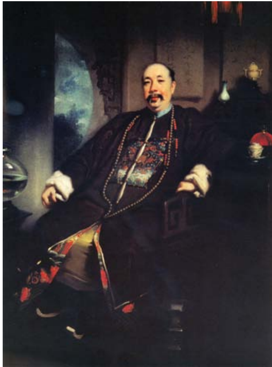
George Chinnery, Ritratto di un mercante bong, mandarino di nona classe, ca. 1832, olio su tela, Hong Kong, Museum of Art

il governatore cinese, con il dichiarato intento di superare la mediazione dei mercanti della cobong e ottenere dunque nei fatti la parità diplomatica. L'atteggiamento inglese, aggravato dalla minaccia di Napier di usare le armi, non fece che irritare le autorità cinesi di Canton, che pretesero e ottennero che il Sovrintendente lasciasse la città per trasferirsi a Macao, dove egli morì poco dopo.