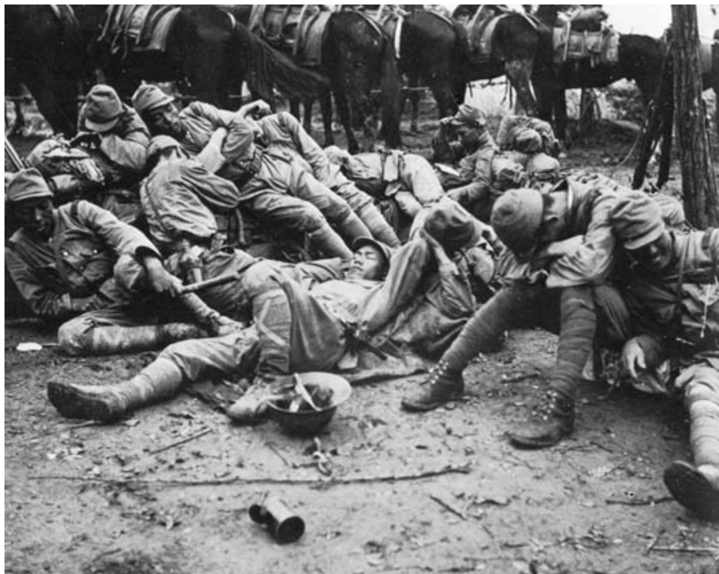
Soldati giapponesi si riposano durante la campagna contro il Guomindang nel sud-ovest della Cina, ca. 1939, fotografia in bianco e nero

economica e l'opulenza del passato divenne, per molti, solo un ricordo.