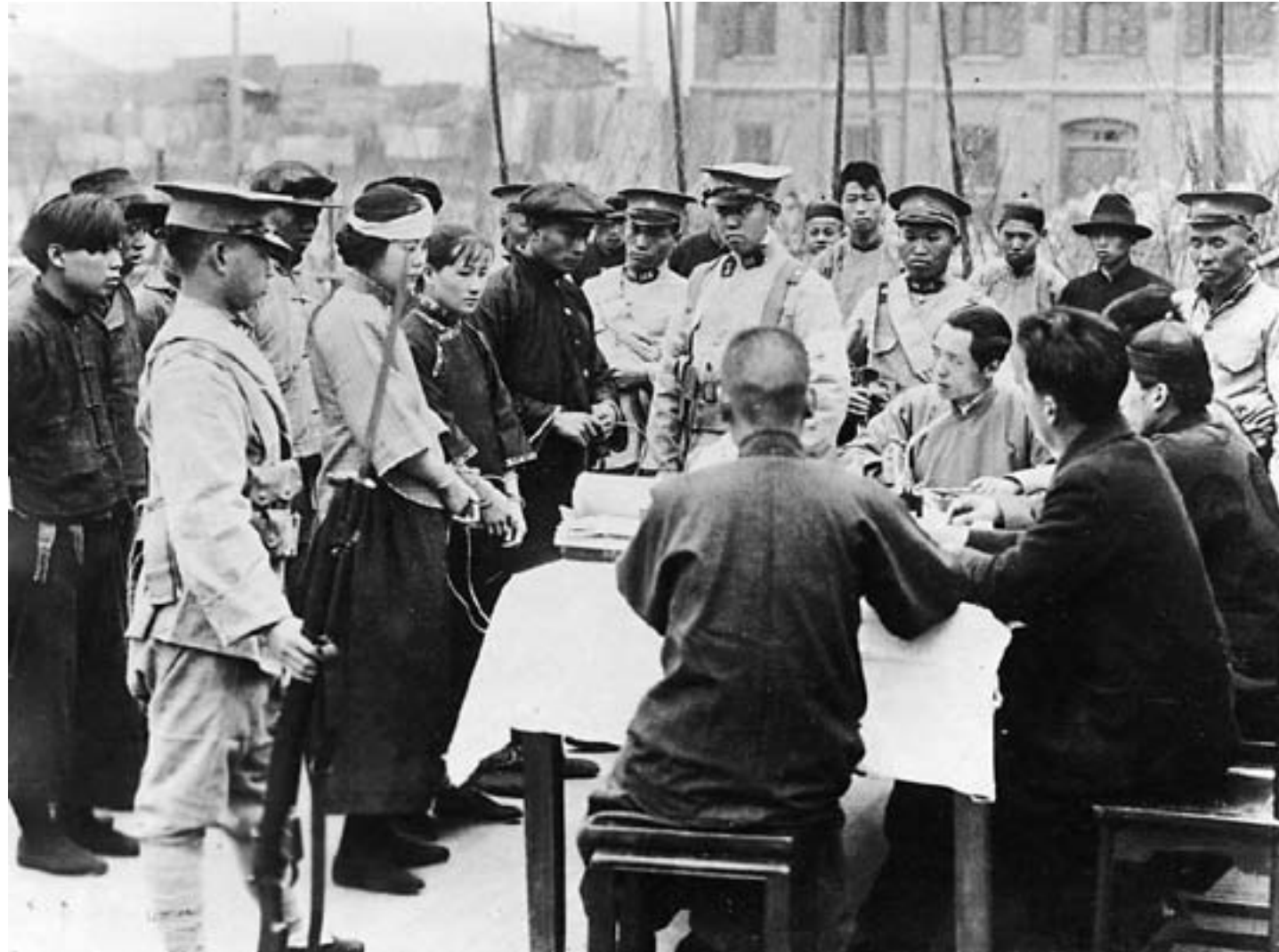
Giovani rivoluzionari catturati dai soldati nazionalisti a Canton vengono interrogati da funzionari di polizia, ca. 1928, fotografia in bianco e nero

va una premessa indispensabile perché essa potesse diventare nuovamente ricca e forte. Fin dalle prime settimane dopo la sua scomparsa, la figura di Sun venne assunta a simbolo dell'unità del paese; negli anni Trenta i "tre principi del popolo" sarebbero divenuti il fulcro di un'intensa opera di educazione patriottica e indottrinamento nelle scuole e nell'amministrazione pubblica perseguita dal Partito nazionalista. Il ruolo del leader cantonese e cosmopolita nella storia cinese del Novecento fu poi sancito dalla decisione, presa nel 1940, di celebrarlo come "padre della patria" ( guofu ).