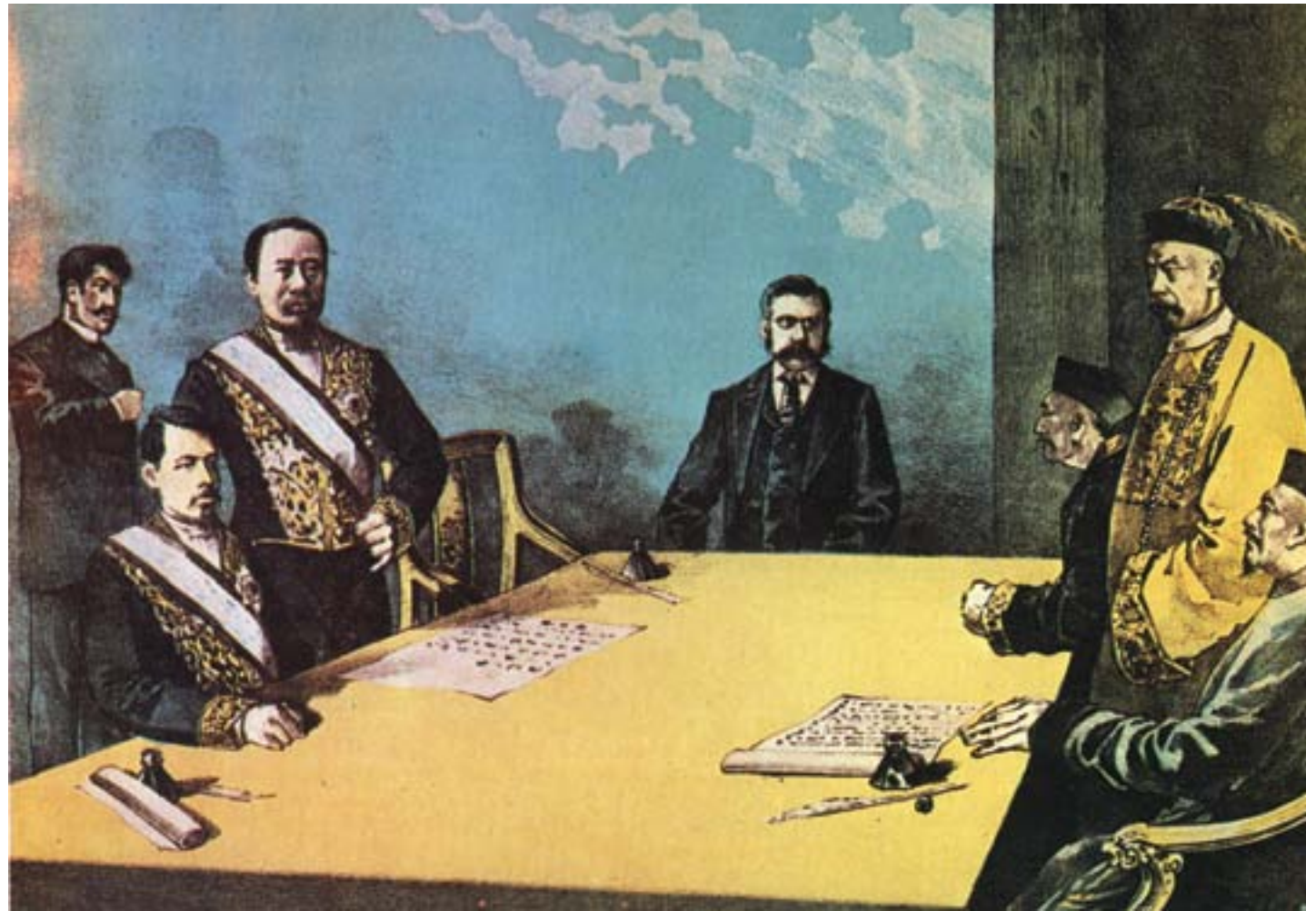
La firma del trattato di Shimonoseki, il 17 aprile 1895, fra i rappresentanti giapponesi e quelli cinesi, ca. 1895, cromolitografia, Londra, Sotheby's

La guerra fra la Cina e il Giappone venne dichiarata ufficialmente il 1° agosto 1894, sebbene si fossero già verificati alcuni combattimenti già nelle settimane precedenti. Il conflitto metteva a confronto due imperi che, negli ultimi decenni, si erano entrambi impegnati a rafforzarsi sul piano militare, ma lo avevano fatto in modo diverso. L'impero Qing aveva puntato, fra molte difficoltà e contraddizioni, a creare soprattutto una moderna flotta da guerra, riformando solo in parte il suo sistema militare; il Giappone, invece, aveva intrapreso un processo di modernizzazione molto più radicale, attraverso l'istituzione della coscrizione obbligatoria, una rapida industrializzazione e l'imposizione di un'organizzazione militare modellata su quella europea.