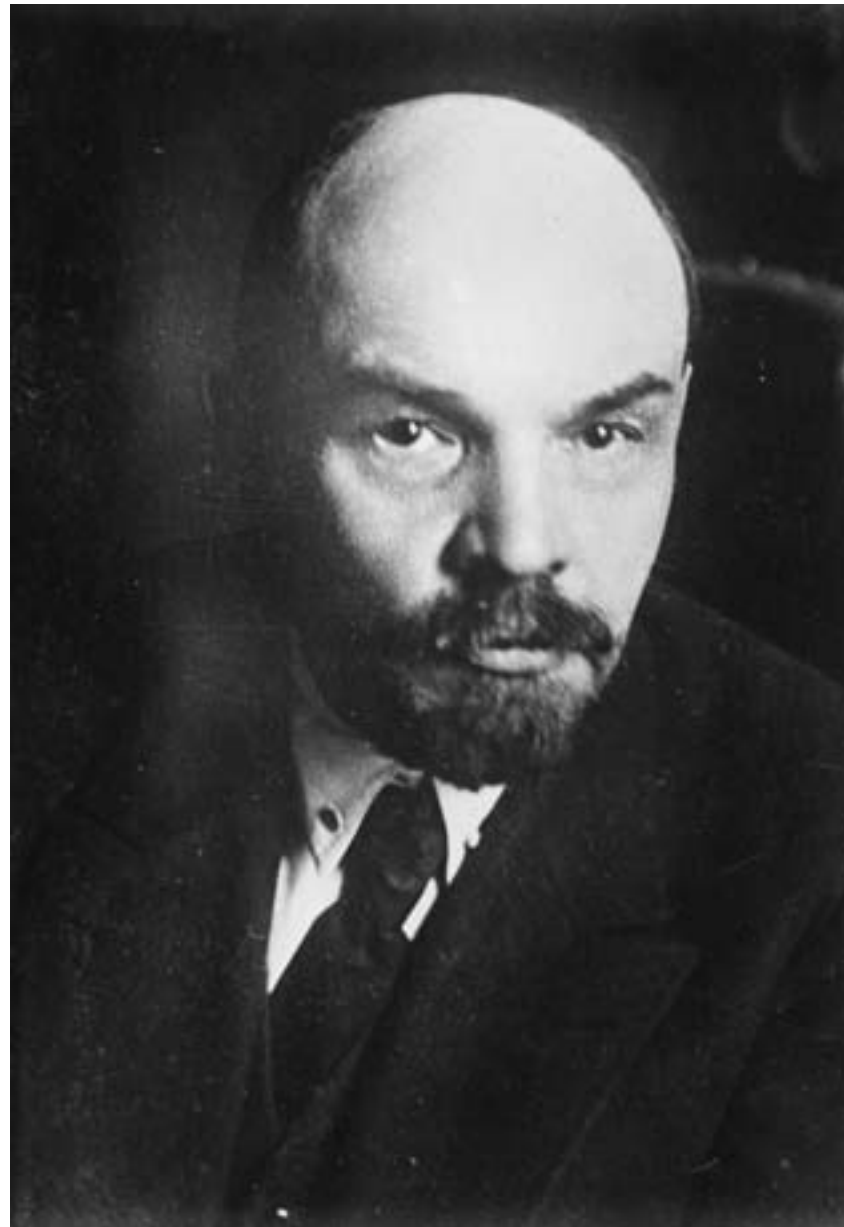
Bain News Service, Ritratto del leader rivoluzionario russo Vladimir Lenin, 1919, fotografia in bianco e nero, Washington DC, Library of Congress

assunto una dimensione internazionale. In questa prospettiva la Cina, solo apparentemente uno Stato sovrano, era assimilata a una colonia, perché le sue risorse, materiali e umane, erano subordinate agli interessi della borghesia dei paesi capitalisti, grazie anche alle debolezze del governo nazionale repubblicano e alla complicità dei militaristi e dei signori della guerra, espressione della vecchia società.