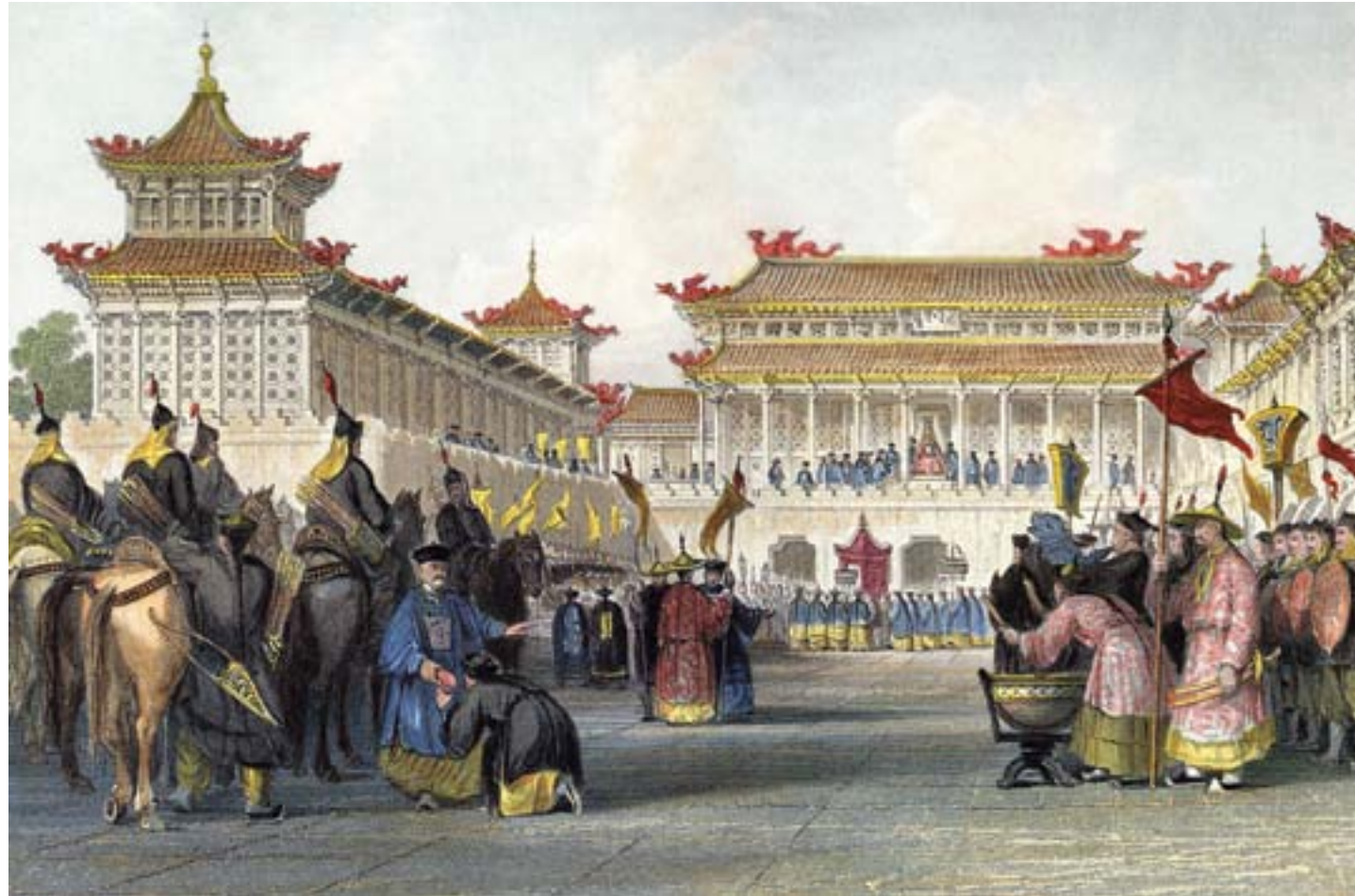
Thomas Allom, China, in a Series of Views . L'imperatore passa in rassegna le sue guardie nella Città Proibita, Londra, 1843, incisione colorata, Londra, Sotheby's

Se la sconfitta subita per opera degli inglesi e il nuovo quadro giuridico ed economico nelle relazioni con l'estero determinato dal Trattato di Nanchino non vennero percepiti da parte della dinastia Qing come una sfida esiziale per il proprio dominio fu perché altre drammatiche urgenze impegnarono la classe dirigente cinese a metà del XIX secolo.