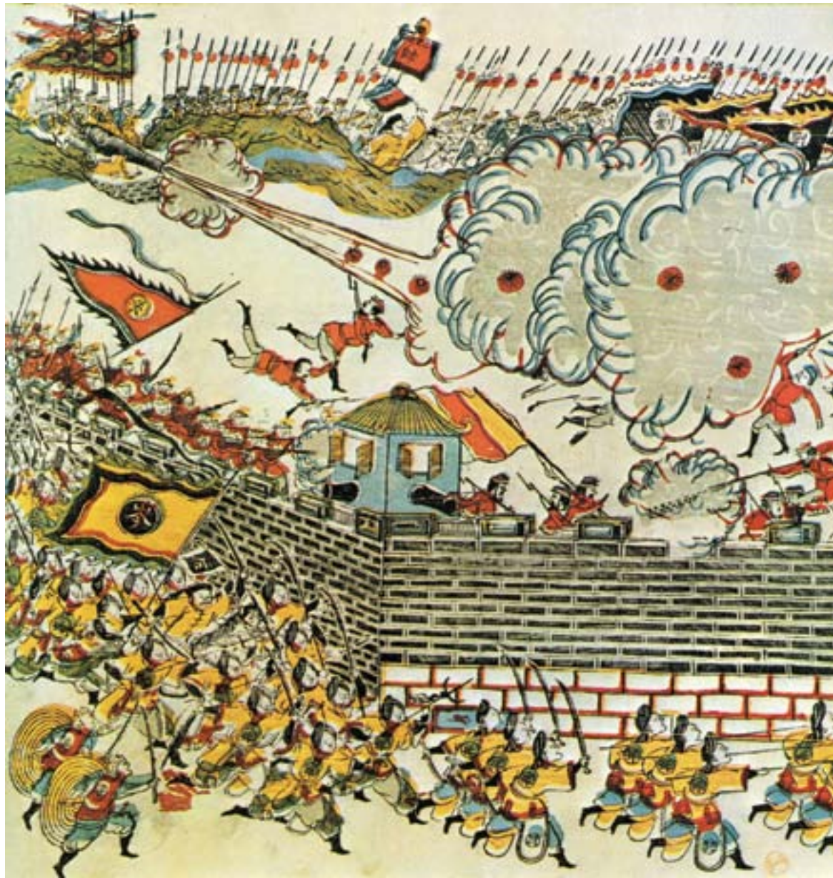
Le truppe sino-vietnamite attaccano quelle francesi durante la Guerra del Tonchino, ca. 1885, incisione colorata, Londra, Sotheby's

Le minacce ai confini marittimi: il confronto con il Giappone e la guerra con la Francia