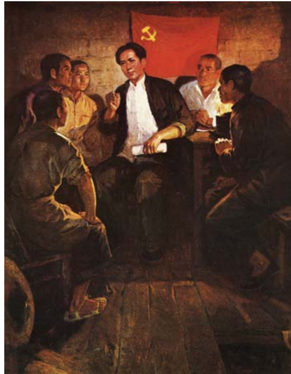
Artista cinese, La prima cellula del Partito comunista cinese formata da Mao Zedong a Shaoshan, suo villaggio natale, nel 1925, Pechino, ca. 1966, olio su tela, Collezione privata