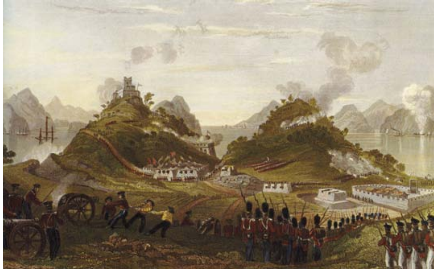
Thomas Allom, China, in a Series of Views . Attacco e presa di Chuanbi, vicino a Canton, il 7 gennaio 1841, durante la Prima guerra dell'oppio, Londra, 1843, incisione colorata, Londra, Sotheby's

All'inizio del 1841, la linea di difesa mancese era distrutta e l'occupazione britannica di Canton ormai una certezza. Un primo accordo di pace, la convenzione di Chuanbi, fu conclusa da Elliott, che voleva comunque evitare la distruzione di Canton. Ma l'accordo non venne riconosciuto né dal governo inglese, né da quello mancese: sia Elliott che Qishan, l'inviato della corte Qing, furono destituiti. Il conflitto armato si estese dunque lungo le coste settentrionali. Il nuovo comandante britannico, Sir Henry Pottinger (1789-1856), spinse la flotta fino a Xiamen (Amoy), e poi alla conquista di Shanghai, occupata nella primavera del 1842. Da qui, le navi inglesi puntarono sul Gran Canale, la via navigabile che metteva in collegamento il sud con il nord dell'impero e che avrebbe loro permesso di raggiungere Pechino, e distrussero la città di Zhenjiang, dove, per non cadere in mano nemica, molti militari si suicidarono con le loro famiglie.