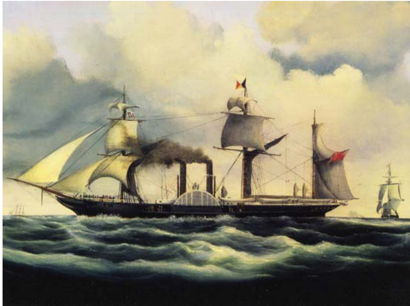
J.F. Stace, Il piroscafo Pottinger della Peninsular and Oriental Steam Navigation Company (P&O), 1852, olio su tela, Collezione privata

trasbordi per superare, via ferrovia, i numerosi tratti terrestri (era la famosa “Valigia delle Indie”, gestita dalla compagnia di navigazione inglese Peninsular & Oriental Steam Navigation Company, che aveva come porti d’imbarco nel Mediterraneo Marsiglia e Brindisi). Recarsi in Cina rimase a lungo piuttosto oneroso, soprattutto per i privati, anche se il costo venne gradualmente diminuendo nel corso della seconda metà del secolo. Nei primi decenni del Novecento, erano ormai numerose le compagnie di navigazione che effettuavano il servizio passeggeri per la Cina, e i tempi di navigazione dai porti europei a Shanghai erano inferiori a un mese.