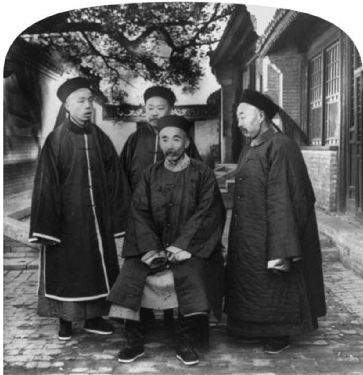
I membri dello Zongli Yamen , consiglieri dell'imperatrice vedova Cixi nei rapporti con le potenze occidentali, 1901, fotografia in bianco e nero, Washington DC, Library of Congress

go. A Bin fu richiesto di tenere un diario di quanto vedeva, e lui, con i suoi scritti, diede conto del proprio stupore davanti all'esotismo dell'Occidente, alle stranezze di una società così diversa dalla propria. Nei decenni seguenti, altre occasioni ufficiali avrebbero portato funzionari e letterati cinesi a scoprire in prima persona il mondo occidentale, e a raccontarne con acutezza e curiosità molti risvolti a un pubblico di lettori sempre più interessati a quanto succedeva al di là dei confini dell'impero.