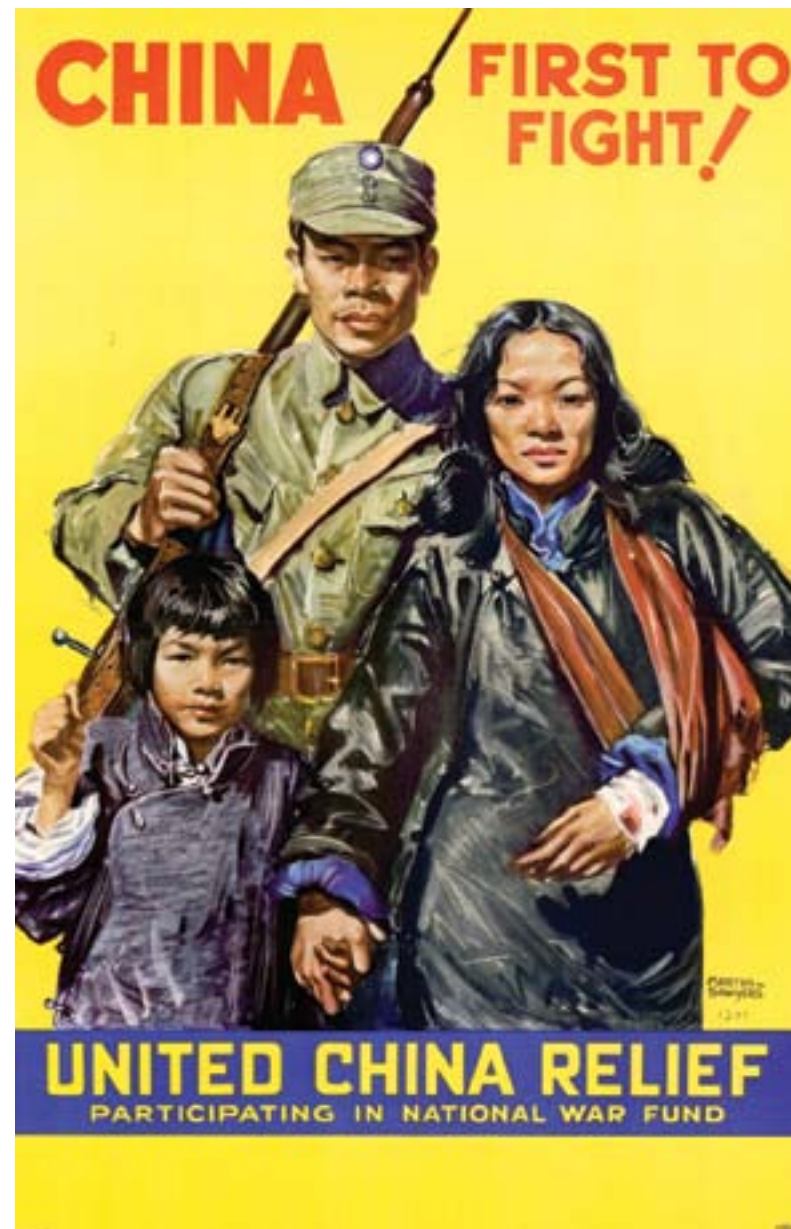
Sottoscrizione di fondi negli Stati Uniti per sostenere l'esercito nazionalista cinese nella lotta contro i giapponesi, 1939, manifesto a colori, Washington DC, Library of Congress