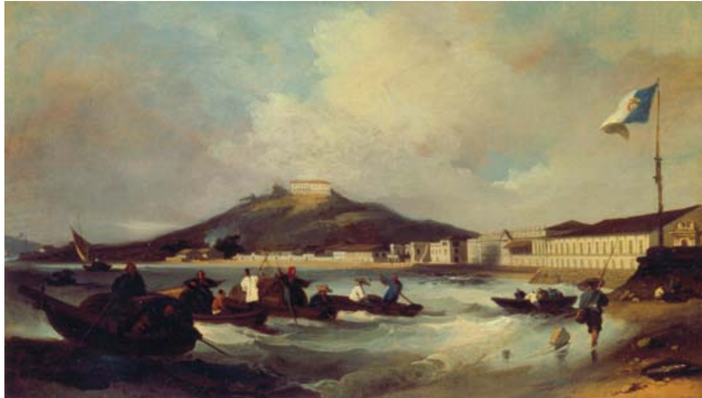
George Chinnery, Veduta della Praia Grande a Macao, ca. 1840, olio su tela, Hong Kong, Museum of Art

divenne la regione di Malwa, nell'India meridionale, il cui oppio, più economico, avrebbe in seguito fatto concorrenza a quello della regioni settentrionali.