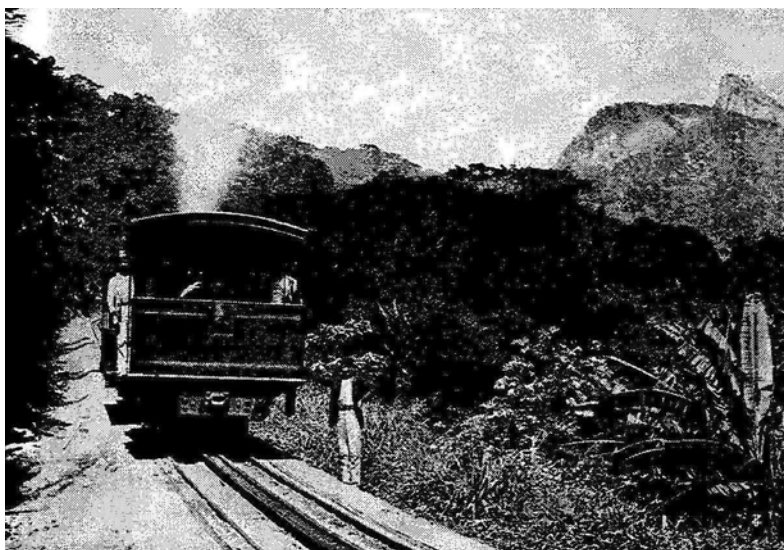
Imagem 3. Ferrovia do Corcovado

Outra característica, representada também na imagem que segue, a qual é inserida pelo próprio autor, em sua obra de divulgação, refere-se à vitória sobre a natureza, representada pelo avanço da ferrovia, no Corcovado, em forma de cremalheira. Ao destacar que tal obra – a cremalheira – construída pelo prefeito fluminense há muitos anos, é um sinal de sua audácia e talento, Buccelli reforça sua concepção de um poder público corajoso que está conduzindo a ferro e fogo a cidade à modernidade. Ela chega também com o vapor e permite conquistar este espaço de beleza incomparável, que permite uma vista panorâmica de toda a urbs , que é o cume do morro do Corcovado. Como se identifica emblematicamente na imagem selecionada por Vittorio Buccelli, a modernidade pode ser representada como um trem que vai penetrando na floresta, produzindo fragmentos imagéticos do progresso da tecnologia.