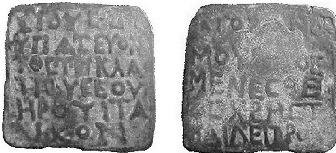
Fig. 1. Peso del Museo Histórico Nacional di Montevideo ( \times 0,75 ).