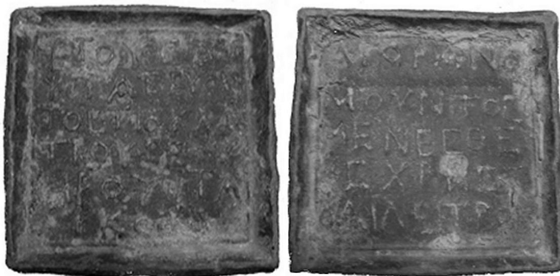
Fig. 2. Peso del Museo Nazionale Romano ( \times 0,75 ).