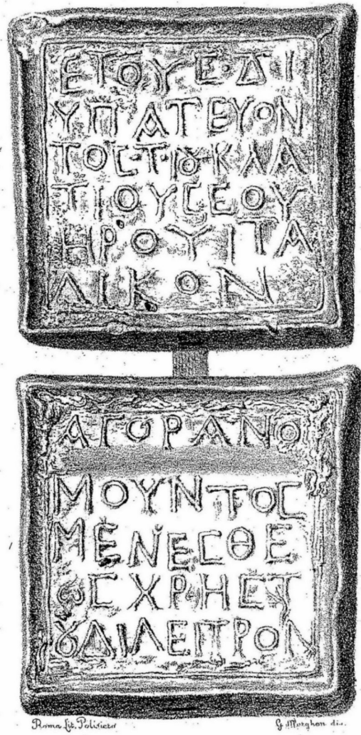
Fig. 3. Incisione da Secchi 1835.