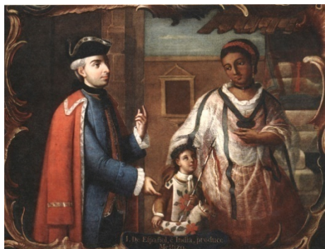
Fig. 5. José de Páez, De español e india, produce mestizo , olio su tela (circa 1780).

raffigura una coppia di genitori con il loro figlio. Quella che vediamo (Figura 4) ritrae il tor-natrás , il figlio di un padre spagnolo e di una madre con sangue moresco, indio e nero. Ma sono anche i meticci a costituire un fattore di instabilità. Di padre spagnolo e di madre india, il mestizo , il tipo del “pícaro mexicano”, il cui ritratto è esemplarmente tratteggiato nel