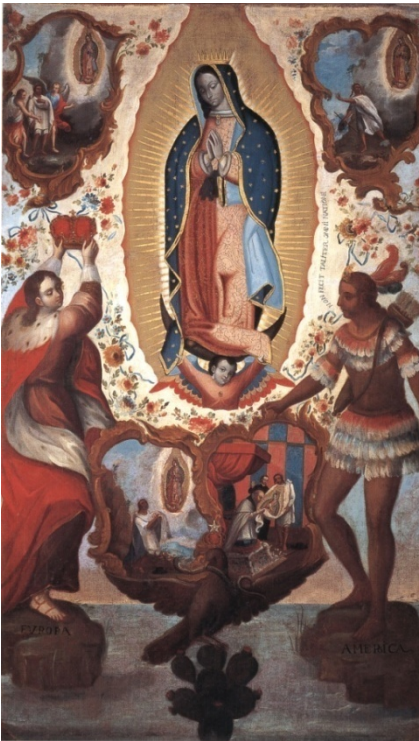
Fig. 3. Anonimo, Nuestra Señora de Guadalupe de México , olio su tela (Nuova Spagna XVIII secolo).

In questo gigantesco sforzo per cooptare all'interno delle nuove forme di governo e di organizzazione sociale le etnie americane, l'opera degli ordini missionari trova un fertile terreno nella componente soprannaturale della mentalità e delle culture preispaniche. La cristianizzazione dell'immaginario indigeno – in quella “tierra de pecados” qual è reputato il Messico – si compie ad esempio con la diffusione del culto mariano da cui nasce la venerazione per la Vergine di Guadalupe che trova efficace rappresentazione nel dipinto Nuestra Señora de Guadalupe de México, patrona de la Nueva España del XVIII secolo. (Figura 3) Il quadro testimonia il carattere mimetico delle riproduzioni di soggetti religiosi da parte di artisti indigeni. In