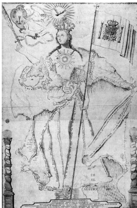
Fig. 1. Vicente de Memije, Aspetto simbolico del Mundo Hispánico: puntualmente arreglado al Geográfico (1761).

americani del regno di Castiglia fanno dell'imperatore, e del re di Spagna, un dominus mundi in quanto il suo dominio abbraccia gli illimitati territori delle Indie. All'iconografia il compito di ribadire la vocazione al dominio planetario: apponendo alle colonne d'Ercole il trasfigurato motto oraziano "plus ultra" nello stemma reale, il nuovo Carlo Magno salda la vocazione imperiale asburgica alle ambizioni espansionistiche e alla missione evangelizzatrice della Castiglia in America 5 .