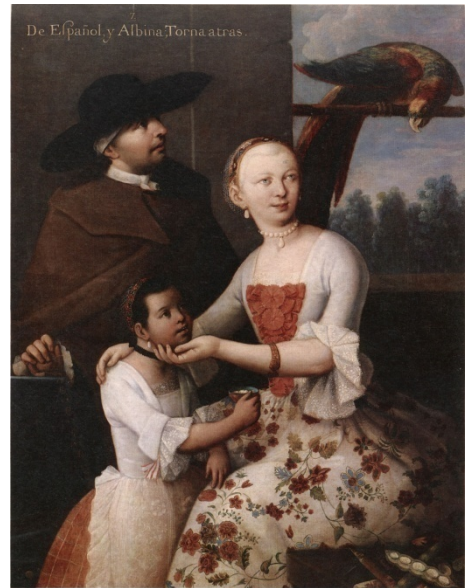
Fig. 4. Miguel Cabrera, De español y albina, tornatrás , olio su tela (1763).

Nel Seicento queste società multirazziali sono codificate, oltre che da un'ossessiva nomenclatura (cambujo, castizo, cuarterón, cholo, jarocho, lobo, mestizo, morisco, mulato, saltatrás), da quella che si chiama pintura de castas 18 . Le rappresentazioni visive di razze più o meno pigmentate sono esempi di come la cultura dominante classifichi le molteplici combinazioni razziali di uno spazio multi-etnico, dove la riproduzione genetica produce la mescolanza e non la continuità. È anche questo che fa della Nuova Spagna uno spazio del mondo non solo nuovo, ma soprattutto altro dall'Europa. Dove la valenza simbolica del ritratto – che spesso si ispira alla pittura spagnola o a scene di interni veneziani alla maniera di Pietro Longhi – è spia di un'ansia classificatoria e di un desiderio di controllo razionale e culturale su ciò che è diverso e contrario al criterio discriminatorio della pureza de sangre . Dei tipi umani sorti dalla mescolanza la pittura si appropriava dividendola, frammentandola, per offrirla come una replica della classificazione illuminista di piante e animali, come emblema di una società di cui il tratto principale è la disomogeneità. Bianchi, indios, meticci, neri e quant'altro scaturisce dalla loro fusione sono dalla pintura de castas ritratti come caselle di un mosaico che vuole essere un repertorio di geometria genetica, la mappatura di una nuova geografia sociale. Ogni quadro