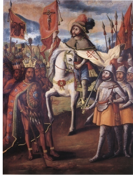
Fig. 2. Anonimo, Santiago Caballero, los ejércitos de Cortés y Moctezuma , olio su tela (Nuova Spagna XVIII secolo).

Conquista, occidentalizzazione e mimetismo sono le principali modalità dell'instaurazione dell'impero spagnolo in America e della nascita della società coloniale. Impresa cristiana universale volta al dominio di territori, di corpi e di immaginari, l'impero americano sarà solo in parte il riuscito tentativo di costituire una replica della società castigliana. "Colonizzazione" risulta perciò una categoria desueta e inefficace per dare conto di un gigantesco sforzo di trasferire nel Nuovo Mondo istituzioni, credenze, pratiche capaci di trasformare l'identità de "los naturales". Distinta da quella della penisola,