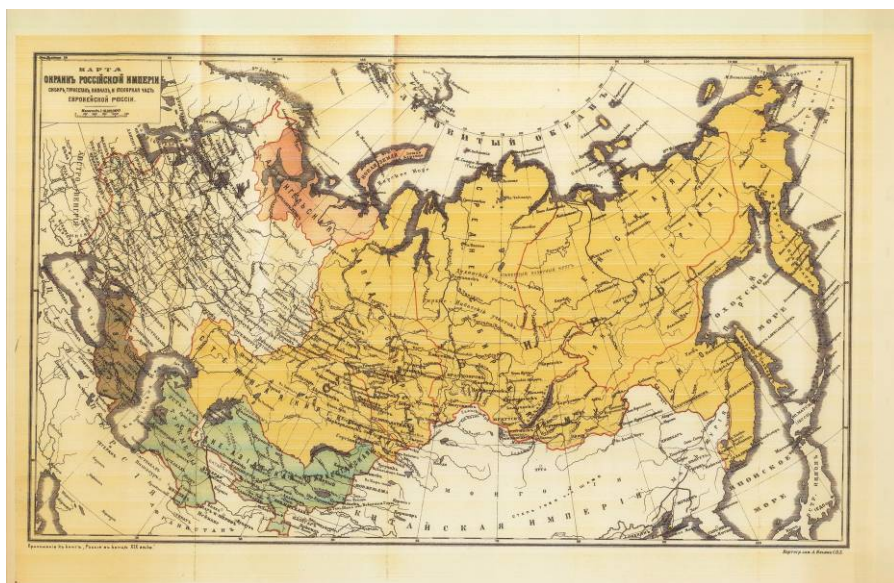
Fig. 1 Carta delle periferie dell'Impero russo, 1900

L'esistenza di una fascia intermedia tra il nucleo centrale dell'Impero e i suoi confini esterni era percepita chiaramente dai contemporanei. La “Carta delle periferie dell'Impero russo” (Fig. 1) ne fissava una rappresentazione grafica che rifletteva il punto di vista del tempo (1900). Tracciava un arco fortemente sbilanciato verso Oriente che comprendeva, procedendo in senso orario da Nord a Sud, le regioni più settentrionali della Russia europea (Arcangelo), l'intera, smisurata Siberia fino all'Oceano pacifico, poi verso Sud-est la Regione delle steppe (gran parte dell'odierno Kazachstan) e più oltre il Turkestan; infine, a Sud, il Caucaso esotico, complicato e riottoso 3 .