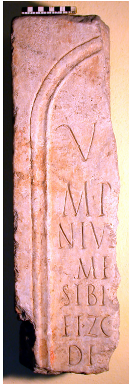
Fig. 1. Frammento angolare superiore sinistro di stele centinata in pietra calcarea attualmente conservato nel Museo "L. Bailo" di Treviso (nr. inv. 3317).