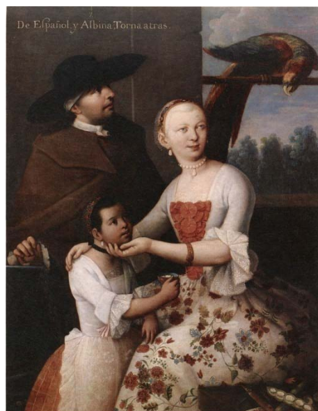
Fig. 4. Miguel Cabrera, De español y albiña, tornatrás , olio su tela (1763).

Nel Seicento queste società multirazziali sono codificate, oltre che da un'ossessiva nomenclatura (cambujo, castizo, cuarterón, cholo, jarocho, lobo, mestizo, morisco, mulato, saltatrás), da quella che si chiama pintura de castas 18 . Le rappresentazioni visive di razze più o meno pigmentate sono esempi di come la cultura dominante classifichi le molteplici combinazioni razziali di uno spazio multi-etnico, dove la riproduzione genetica produce la mescolanza e non la continuità. È anche questo che fa della Nuova Spagna uno spazio del mondo non solo nuovo, ma soprattutto altro dall'Europa. Dove la valenza simbolica del ritratto – che spesso si ispira alla pittura spagnola o a scene di interni veneziani alla maniera di Pietro Longhi – è spia di un'ansia classificatoria e di un desiderio di controllo razionale e culturale su ciò che è diverso e contrario al criterio discriminatorio della pureza de sangre . Dei tipi umani sorti dalla mescolanza la pittura si appropria dividendola, frammentandola, per offrirla come una replica della classificazione illuminista di piante e animali, come emblema di una società di cui il tratto principale è la disomogeneità. Bianchi, indios, meticci, neri e quant'altro scaturisce dalla loro fusione sono dalla pintura de castas ritratti come caselle di un mosaico che vuole essere un repertorio di geometria genetica, la mappatura di una nuova geografia sociale. Ogni quadro