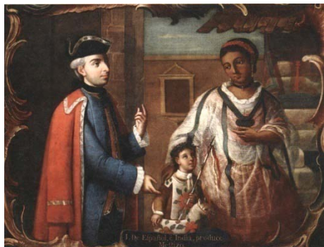
Fig. 5. José de Páez, De español e india, produce mestizo , olio su tela (circa 1780).

raffigura una coppia di genitori con il loro figlio. Quella che vediamo (Figura 4) ritrae il natrás , il figlio di un padre gnolo e di una madre con gue moreSCO, indio e nero. Ma sono anche i meticci a costituire un fattore di instabilità. Di dre spagnolo e di madre india, il mestizo , il tipo del “pícaro mexicano”, il cui ritratto è sempramente tratteggiato nel