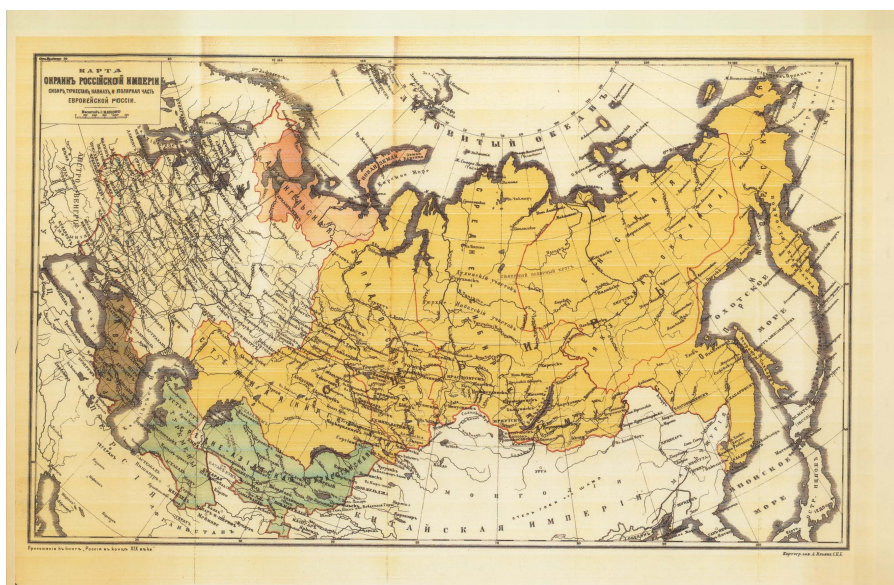
Fig. 1 Carta delle periferie dell'Impero russo, 1900

L'esistenza di una fascia intermedia tra il nucleo centrale dell'Impero e i suoi confini esterni era percepita chiaramente dai contemporanei. La “Carta delle periferie dell'Impero russo” (Fig. 1) ne fissava una rappresentazione grafica che rifletteva il punto di vista del tempo (1900). Tracciava un arco fortemente sbilanciato verso Oriente che comprendeva, procedendo in senso orario da Nord a Sud, le regioni più settentrionali della Russia europea (Arcangelo), l'intera, smisurata Siberia fino all'Oceano pacifico, poi verso Sud-est la Regione delle steppe (gran parte dell'odierno Kazachstan) e più oltre il Turkestan; infine, a Sud, il Caucaso esotico, complicato e riottoso 3 .