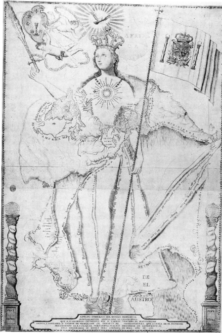
Fig. 1. Vicente de Memije, Aspecto simbólico del Mundo Hispánico: puntualmente arreglado al Geográfico (1761).

del regno di Castiglia fanno dell'imperatore, e del re di Spagna, un dominus mundi in quanto il suo dominio sia gli illimitati territori delle Indie. All'iconografia il compito di ribadire la vocazione al dominio planetario: do alle colonne d'Ercole il trasfigurato motto oraziano "plus ultra" nello stemma le, il nuovo Carlo Magno da la vocazione imperiale sburgica alle ambizioni espansionistiche e alla ne evangelizzatrice della Castiglia in America 5 .