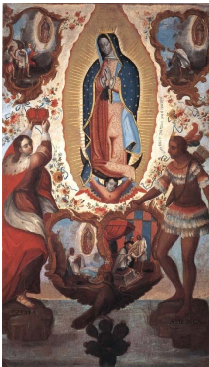
Fig. 3. Anonimo, Nuestra Señora de Guadalupe de México , olio su tela (Nuova Spagna XVIII secolo).

In questo gigantesco sforzo per cooptare all'interno delle nuove forme di governo e di organizzazione sociale le etnie americane, l'opera degli ordini missionari trova un fertile terreno nella componente soprannaturale della mentalità e delle culture preispaniche. La cristianizzazione dell'immaginario indigeno – in quella “tierra de pecados” qual è reputato il Messico – si compie ad esempio con la diffusione del culto mariano da cui nasce la venerazione per la Vergine di Guadalupe che trova efficace rappresentazione nel dipinto Nuestra Señora de Guadalupe de México, patrona de la Nueva España del XVIII secolo. (Figura 3) Il quadro testimonia il carattere mimetico delle riproduzioni di soggetti religiosi da parte di artisti indigeni. In