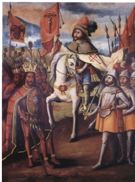
Fig. 2. Anonimo, Santiago Caballero, los ejércitos de Cortés y Moctezuma , olio su tela (Nuova Spagna XVIII secolo).

Conquista, occidentalizzazione e mimetismo sono le principali modalità dell'instaurazione dell'impero spagnolo in America e della nascita della società coloniale. Impresa cristiana universale volta al dominio di territori, di corpi e di immaginari, l'impero americano sarà solo in parte il riuscito tentativo di costituire una replica della società castigliana. "Colonizzazione" risulta perciò una categoria desueta e inefficace per dare conto di un gigantesco sforzo di trasferire nel Nuovo Mondo istituzioni, credenze, pratiche capaci di trasformare l'identità de "los naturales". Distinta da quella della penisola,