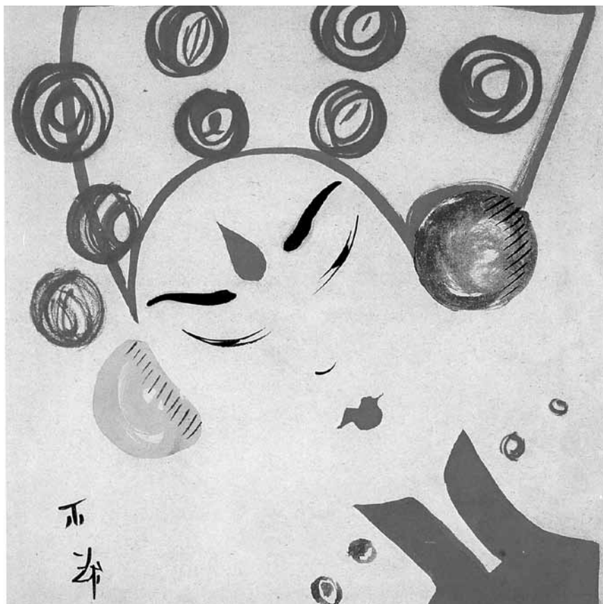
Fig. 6 - M.I. Kurzin, Eroina con fazzoletto rosso , 1922, Museo di Nukus, Uzbekistan