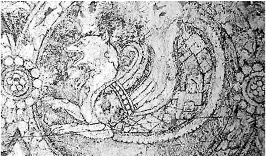
Fig. 2 - Dettaglio della veste di tributario dalla Parete Ovest, con esempio di pseudo-Senmorv, nella Sala degli ambasciatori , Afrāsyāb, sec. VII (da Otavsky, 1998, fig. 93).