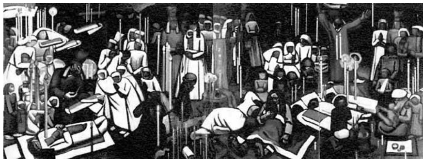
Fig. 7 - N. Šin, Casa celeste (da Slavica occitanica , 19, 2004, tra p. 58 e p. 59)