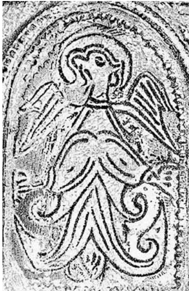
Fig. 4 - Immagine su monile (da Lelekov, 1978, fig. 6).