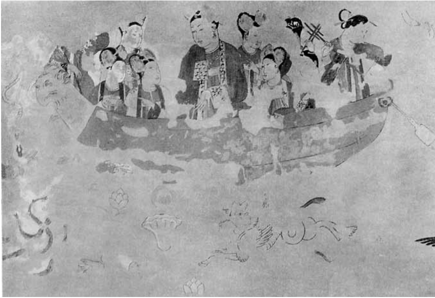
Fig. 1 - Dettaglio della Parete Nord della Sala degli ambasciatori , Afrāsyāb, sec. VII.