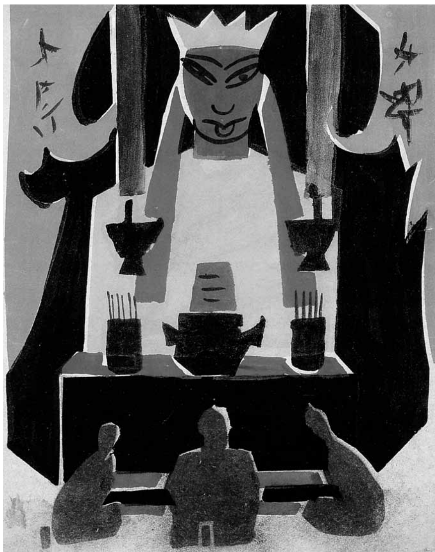
Fig. 5 - M.I. Kurzin, Divinità , 1922, Museo di Nukus, Uzbekistan