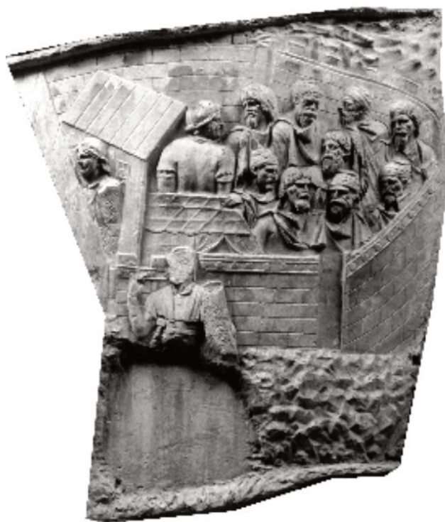
Fig. 3. Colonna Traiana, scena XLIII raffigurante Daci pileati e comati (da FULGER, BOHÎLȚEA-MIHUȚ 2021, p. 48, fig. 9c).