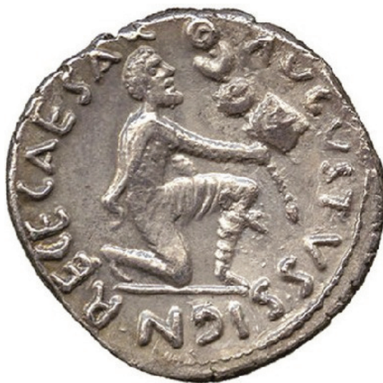
Fig. 1. Rovescio del denario di M. Durmio (19 a.C.) raffigurante il Parto che restituisce le insegne romane (da ZANKER 1989, fig. 146b).

ad Augusto, togato (Fig. 2) 9 , o, ancora, in età traiana, le multiple rappresentazioni dei Daci, pileati e comati secondo il caratteristico costume nazionale che popolano le realizzazioni della politica edilizia dell'imperatore, in memoria del suo trionfo (Fig. 3) 10 .