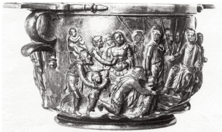
Fig. 2. Tazza argentea di Boscoreale a soggetto augusteo (da ZANKER 1989, fig. 180).