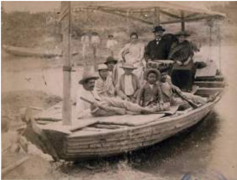
Figura 46 Viajeros al Beni. 1900. Fuente: Historische Fotos aus Bolivien, Instituto Iberoamericano, Berlín