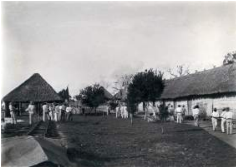
Figura 5 Cachuea Esperanza. 1908-11.