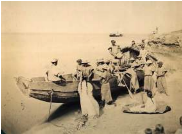
Figura 44 Grupo de remadores bolivianos embarcam em sua canoa e navegam pelo então Rio Madeira. Circa 1867.