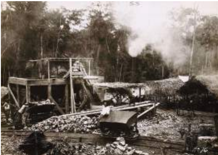
Figura 7 Trabajadores del ferrocarril Madeira-Mamoré. 1909.