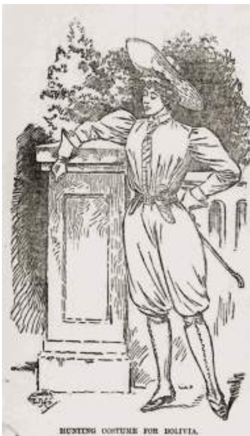
Figura 48 Dibujo en The Morning Leader , 29 de diciembre de 1896.

—¿No tienes miedo de recorrer todos esos miles de kilómetros y adentrarte en lugares tan peligrosos?