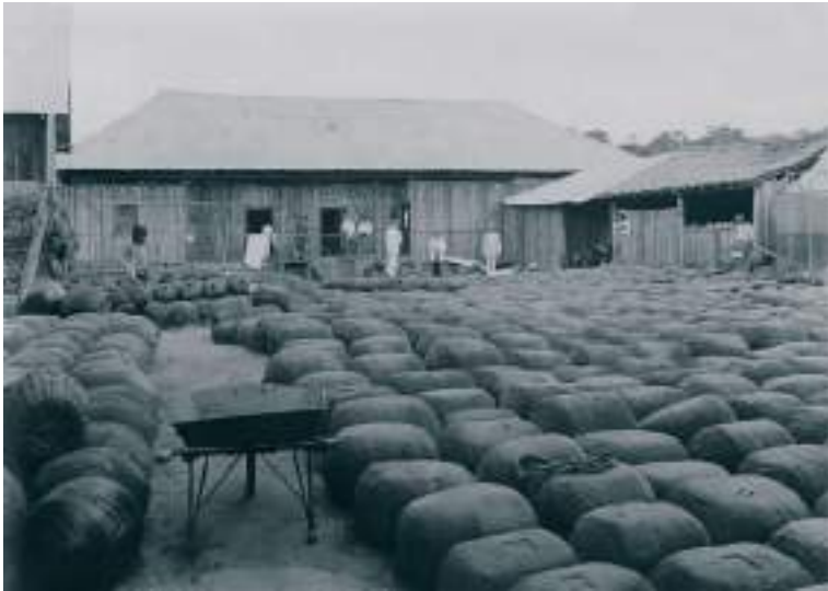
Figura 4 Patio de la Casa Suárez con bolachas de goma en Cobija, Alto Acre, 11 de enero de 1912.