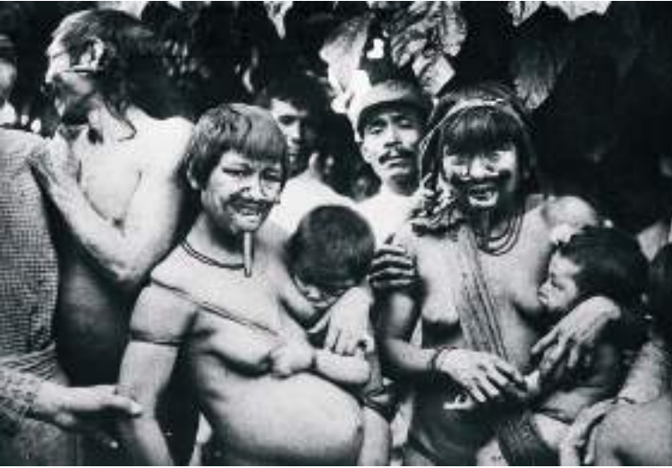
Figura 18 Pacahuaras.

“Con ése ahí [pequeño machete] he dado a luz sola a todos mis hijos. Al Deudato siempre lo mando fuera cuando siento que ha llegado el momento; ¡pues no se necesita un hombre para estas cosas, no se necesita nada más!” A Heremegilda ni se le ocurría venir a la barraca a recuperarse; iba a sus árboles, cargando al recién nacido sobre el pecho en una especie de hamaca, y acarrea la leche de goma de su viaje diario por los malos senderos de la selva, ¡de ocho a diez kilómetros cada día! (304)