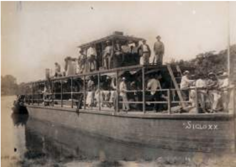
Figura 3 Lancha siglo XXI. 1900.

óptima, pasados veinte años del descubrimiento de Heath no había habido mejoría sensible en las vías de navegación o los ferrocarriles: año tras año, la extensión del área dedicada a la explotación cauchera era mejor conocida y mayor. Han ido explorándose vetas próximas, y se ha descubierto que hay allí más árboles productores de goma, y que éstos son todavía más rendidores y féculos que en casi cualquier otra región, a lo que se añade que el país presenta ventajas con respecto a la salubridad. Pero la naturaleza ha hecho que Bolivia resulte prácticamente inaccesible. Hoy en día no existe comunicación entre el río Beni y el mundo exterior que no demore, al menos, dos o tres meses. («Conditions of Rubber Trading in Bolivia» 1902)