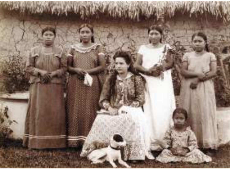
Figura 13 Mujeres de la región de la bahía del río Madeira. 1908-11.

El tipo araona es agraciado, de esbeltas formas y cutis bastante limpio. Las doncellas, sobre todo, son muy apetitosas. Vestidas a la europea, en nada desmerecen de las cruceñas, en concepto de algunos aficionados del Beni. En las barracas son las odaliscas del barraquero; en Riberalta he visto más de una mujer araona casada canónicamente y convertida en excelente ama de su casa. Un comerciante alemán había llevado una de estas indias a Europa, la hizo educar en un colegio, casó después con ella y puedo asegurar que por su educación y cultura es toda una señora, de las más señoras que conocí en el Beni.