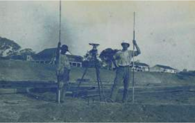
Figura 6 Ingenieros trabajando en el ferrocarril Madeira-Mamoré. 1878.

meses después, el mismo ferrocarril ya hacía solamente un viaje por semana. La máquina del progreso había llegado demasiado tarde (Fifer 1972; Weinstein 1983).