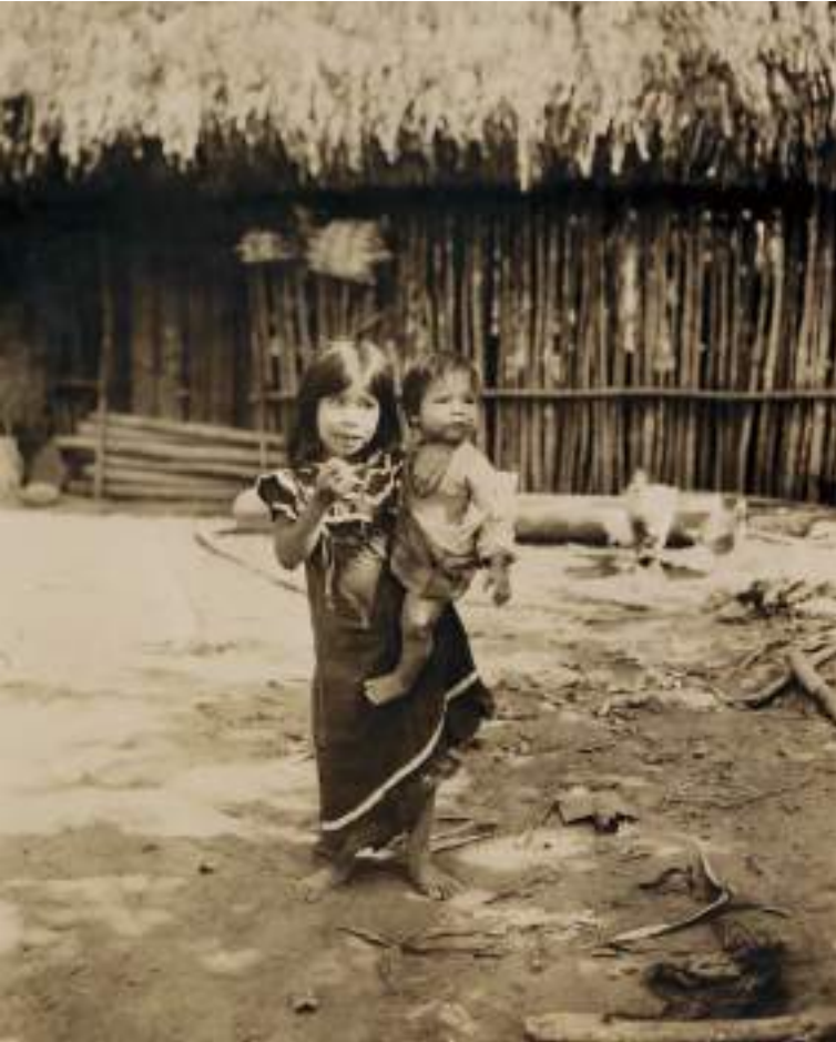
Figura 16 Niños cavinas . 1914.

al niño a Europa. El segundo caso es el de otro trabajador alemán, Hans Hauschild, quien, cuando debe regresar a Europa, opta por dejar atrás tanto a su concubina Melchora como asimismo al pequeño que ha tenido con ella.