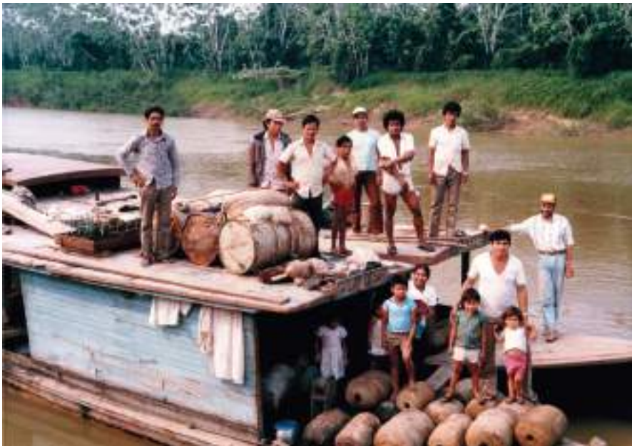
Figura 50 Transportando bolachas por el río Orthon hasta Riberalta. 1985.