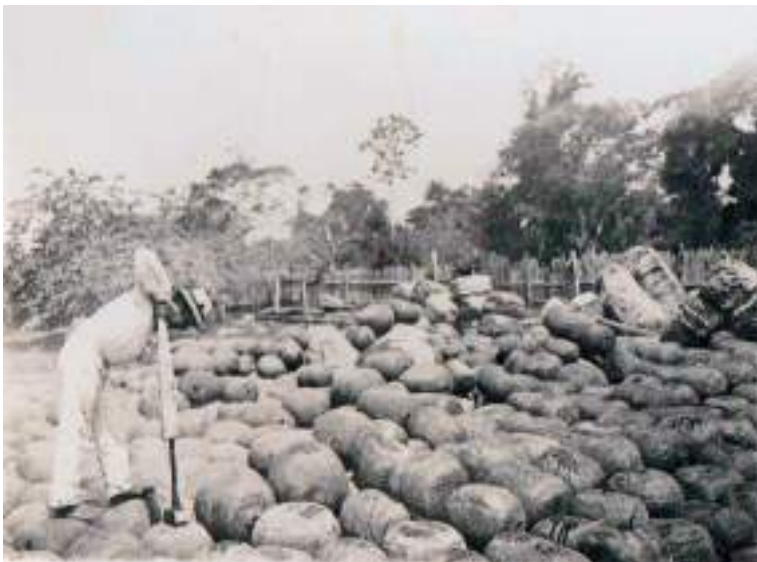
Figura 1 Postales de la época. Sin fecha. Sobre n.º 1.