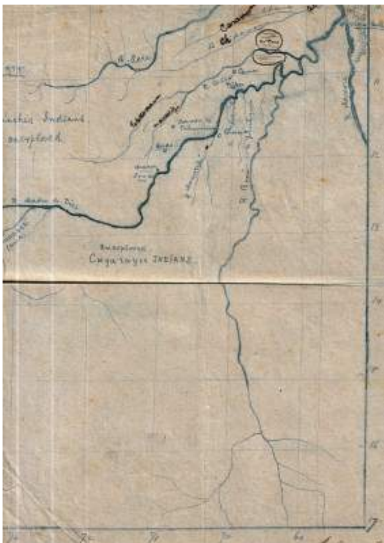
Figura 41 Mapa realizado por Fred para su cuñado Bert.