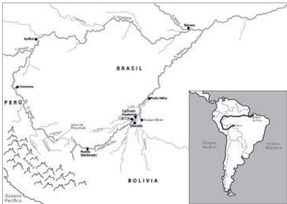
Mapa. El recorrido de Lizzie y Fred Hessel por la región amazónica. Elaboración: Alberto Preci y Lorena Córdoba