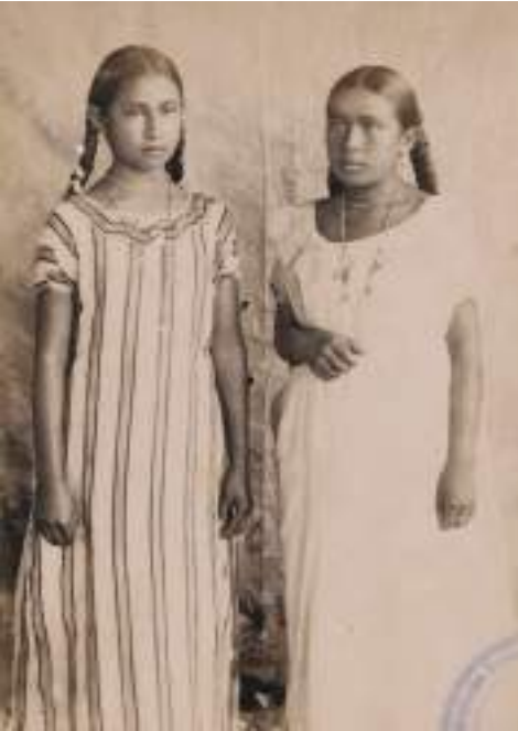
Figura 14 Indias baures. 1900.