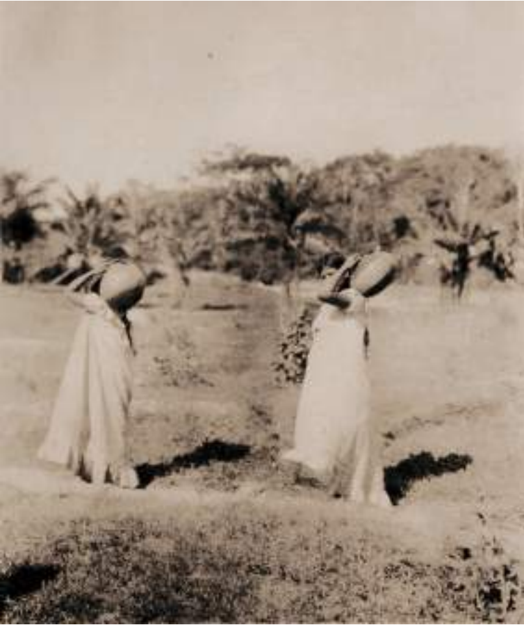
Figura 11 Mujeres acarreado agua, Misión Cavinás, 1914.

que participan del esfuerzo extractivo como picadoras que acompañan a sus parejas a la selva para recolectar el látex, o con mayor frecuencia oficinan de vendedoras, tejedoras, cocineras, lavanderas o personal doméstico que cuida los ‘pequeños detalles’ de la domesticidad de las barracas -lo cual en definitiva parece más previsible-, o hasta vendiendo su cuerpo; pero también, como advertimos en el reporte de Craig, encargándose eventualmente de un proceso tan esencial como el reclutamiento de la mano de obra. Como veremos, todas estas mujeres no eran ajenas a la lógica extractivista que moldeaba la experiencia gomera en las barracas y