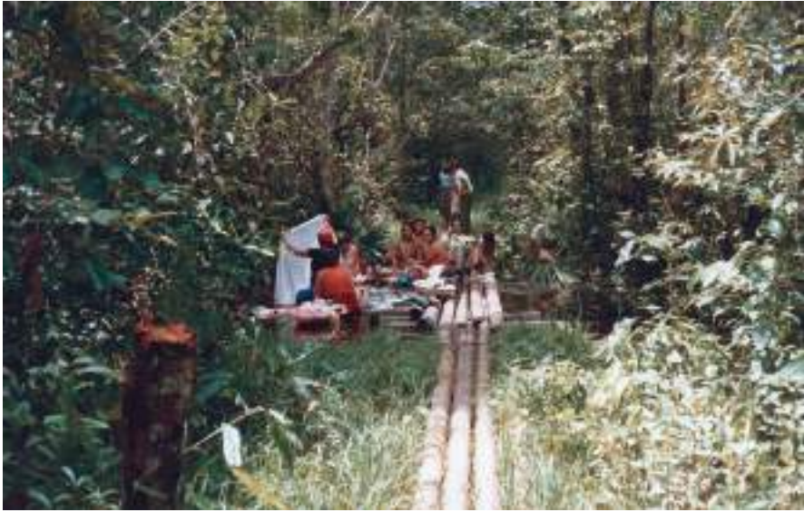
Figura 49 Lavanderas en el río Orthon. Navidad de 1982.