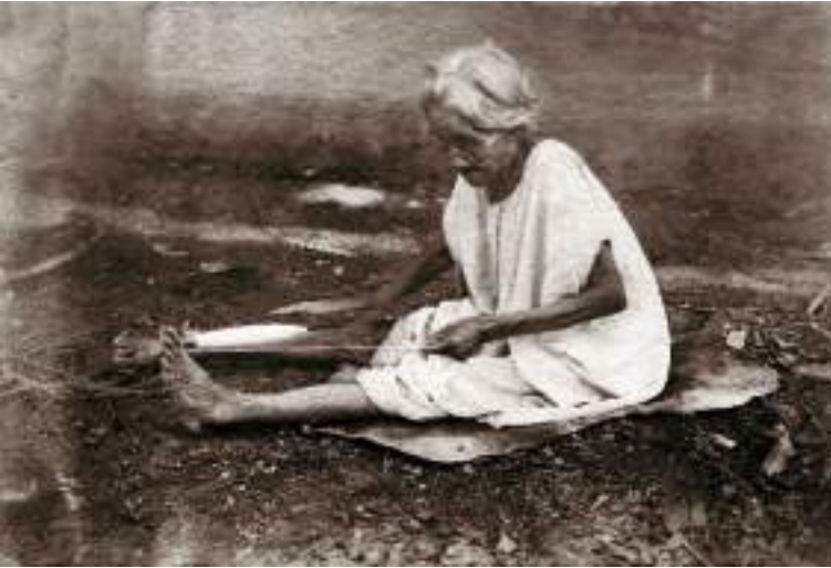
Figura 12 India hilando. 1908-11.

eran pocas, de hecho, las que lograban eludir el penoso ‘encuentamiento’ que solía condenar a los trabajadores nativos y extranjeros a una deuda casi endémica.