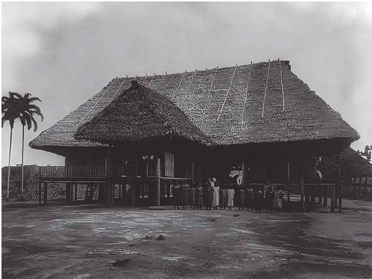
Figura 42 Estación [barraca] donde se vende el látex seco.