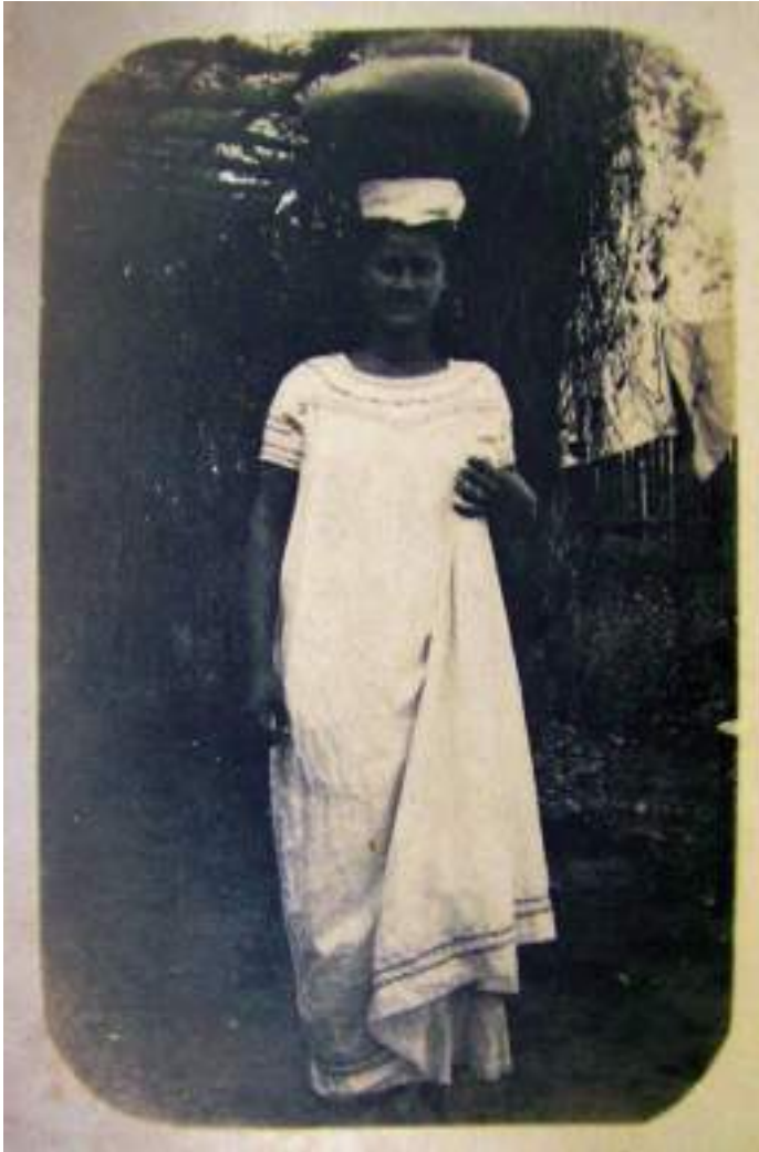
Figura 22 Tumupaceña, Reyes-Beni-Bolivia. Sin fecha. Postal. Sobre n.º 1.