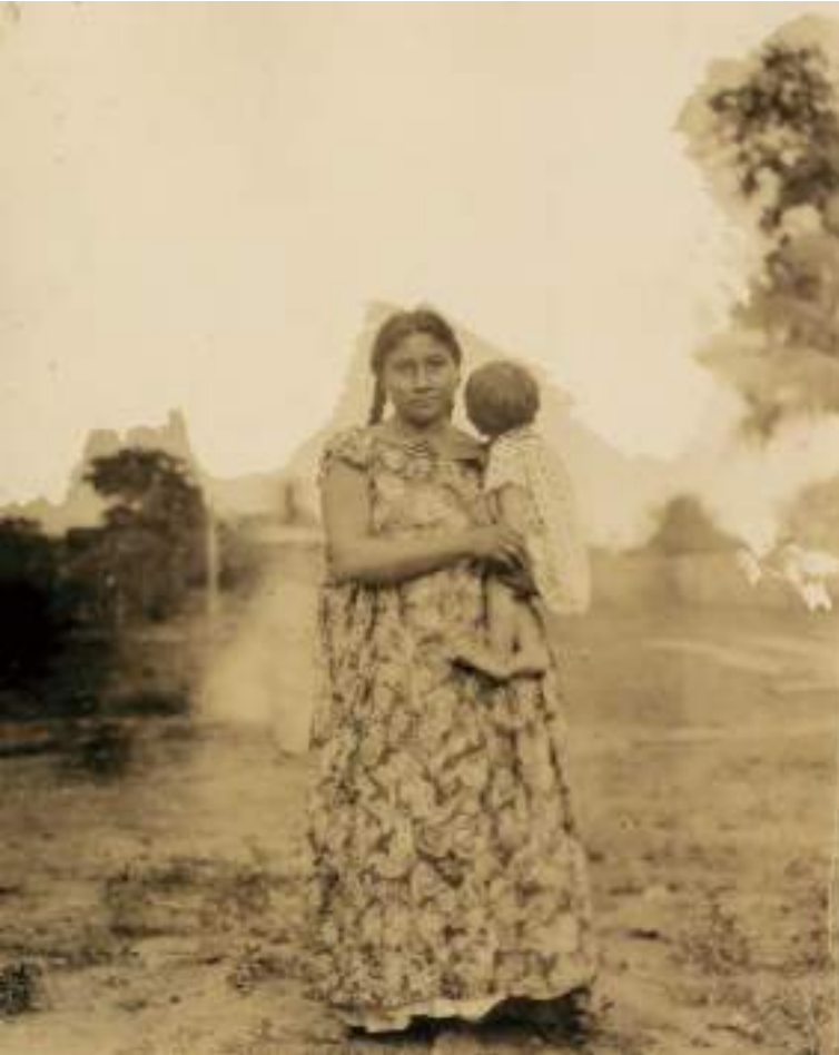
Figura 15 Mujer baure. 1909.