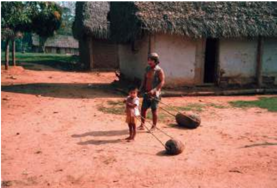
Figura 51 Padre e hijo llegados del centro gomero, barraca San Ignacio. Julio 1985.