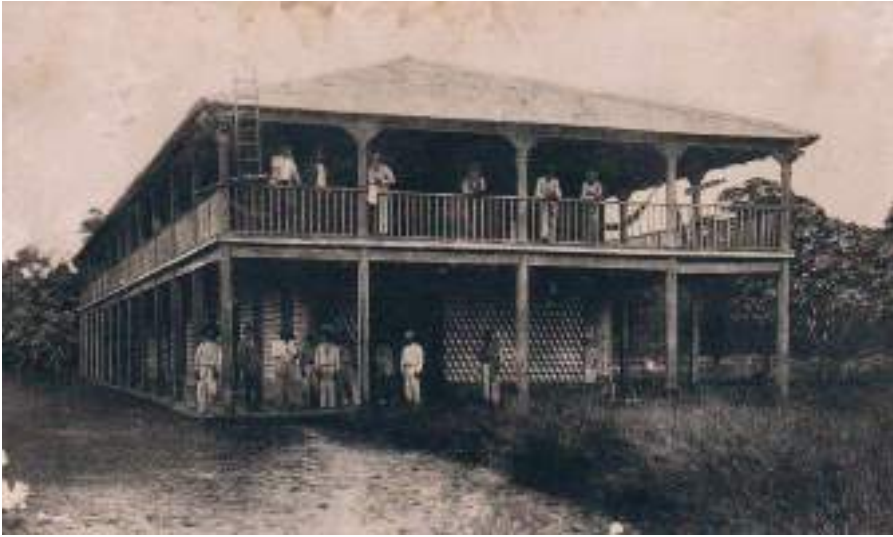
Figura 31 La casa de The Orthon Rubber Co. Postal. Sobre n.º 1.