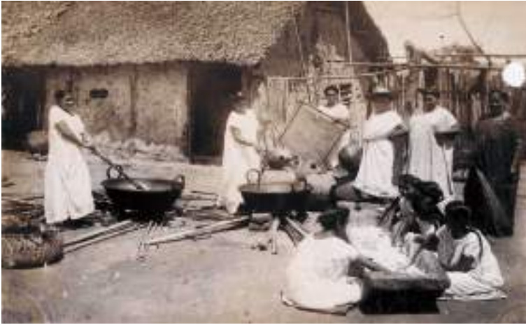
Figura 21 Fábrica de chicha en Baures. 1900.