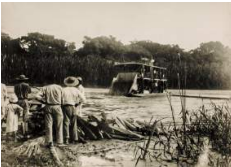
Figura 8 Dos balsas en el río Beni, 1927.