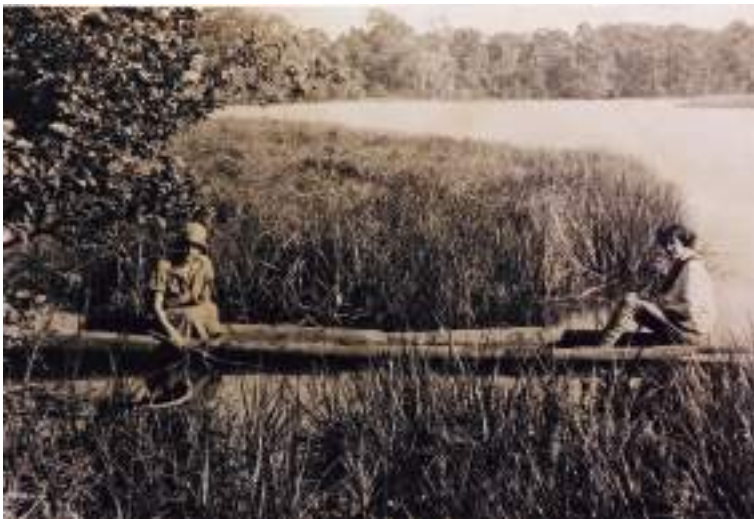
Figura 19 Emilia Bickel de Hecker. Sin fecha. Álbum n.º 5.