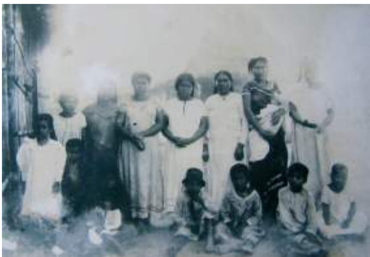
Figura 17 Indias tacanas, Beni, Bolivia. Sin fecha. Postal. Sobre n.º 1.