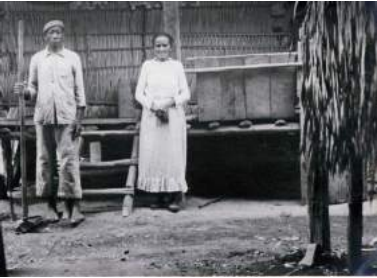
Figura 10 Seringueiro y su mujer cerca de la casa, noviembre 1938.

Sin destacar tanto como en los grandes emporios gomeros como Pará o Manaos –donde abundaban las coristas polacas judías, los burdeles flotantes, las tinas llenas de champagne y el pago en libras esterlinas, oro y diamantes–, las meretrices bolivianas son llamadas ‘indias horizontales’ por el viajero español Ciro Bayo, que observa que adornan los collares con las libras esterlinas que reciben de los clientes: