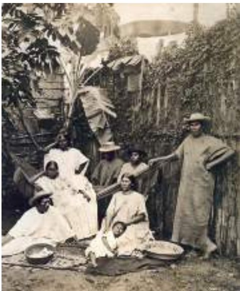
Figura 45 Familia de remadores bolivianos en las márgenes del río Madeira. Circa 1867.