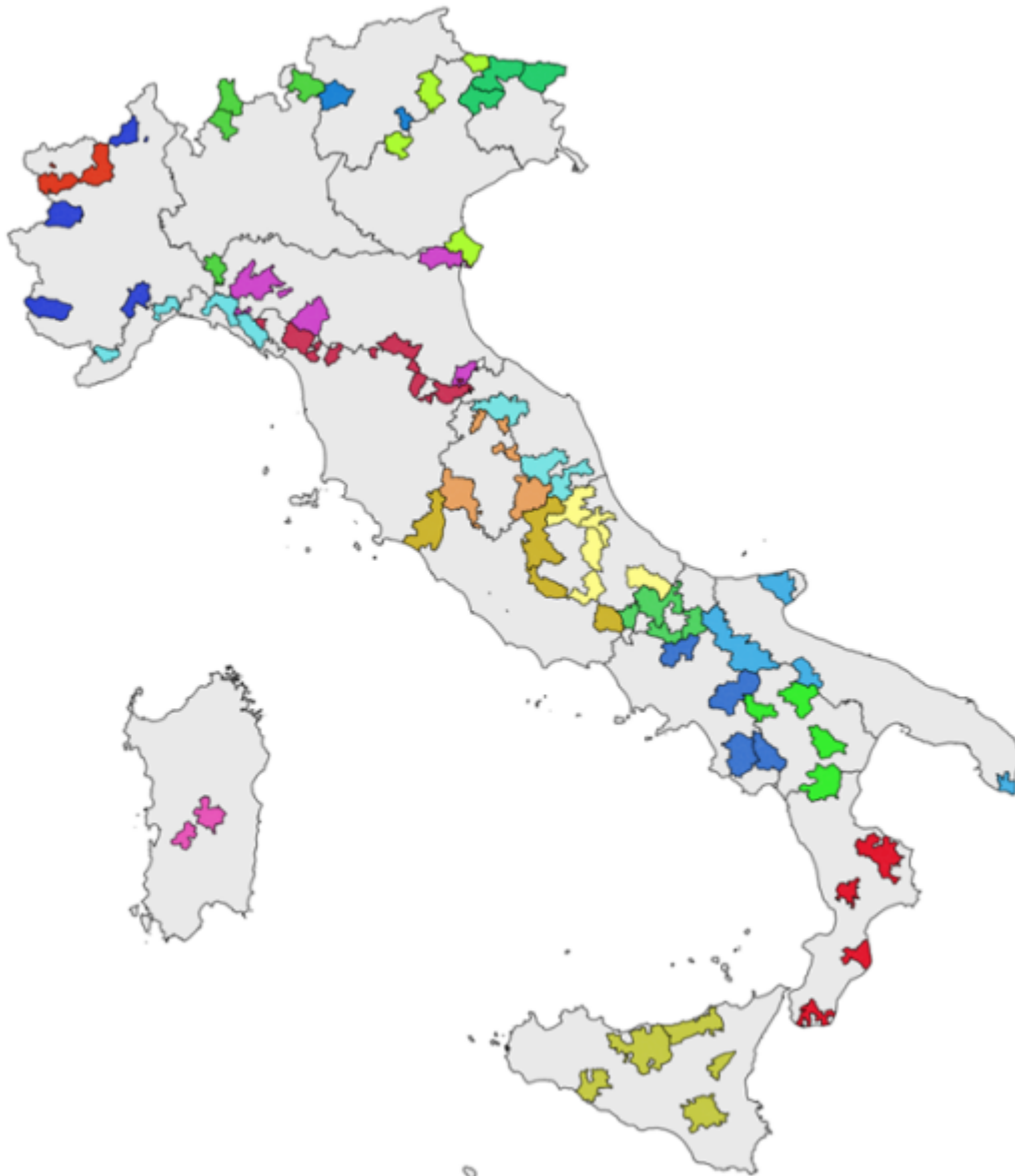
Figure 2. Les 72 « zones-projet » de la SNAI

Source : Comitato Tecnico Aree Interne, 2019.