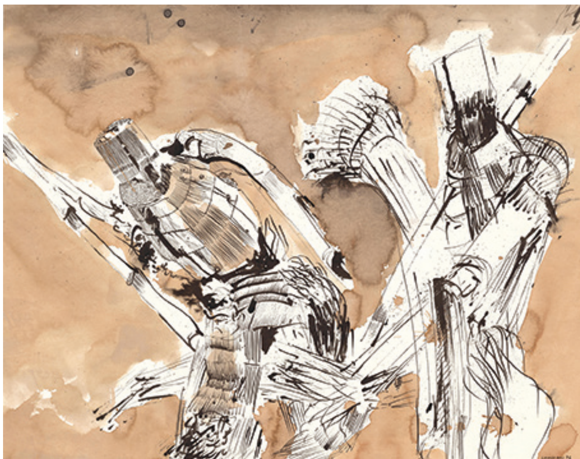
Giancarlo Consonni, Don Chisciotte (Tecnica mista su carta, cm 46,4x58,9, 1974)