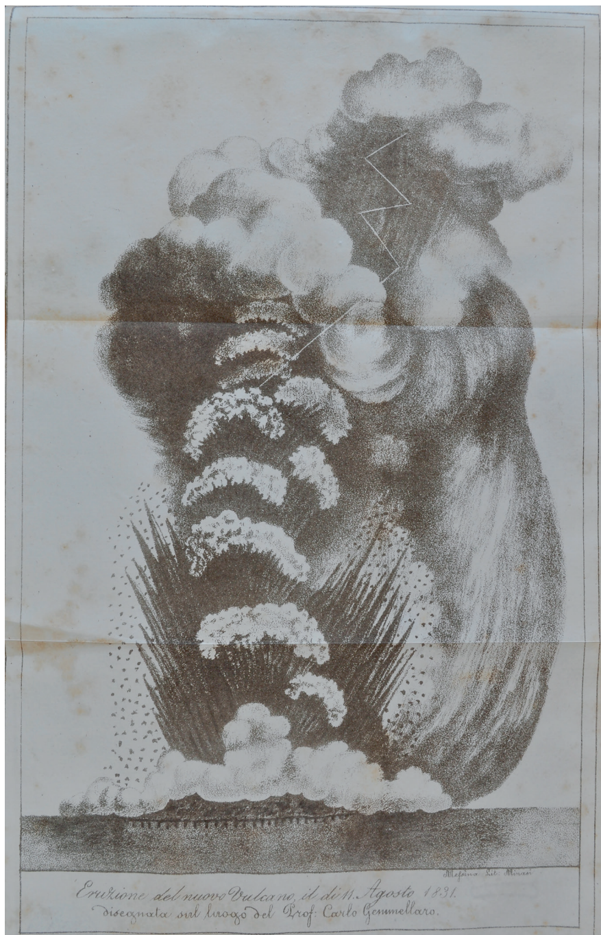
Eruzione del nuovo Vulcano, il dì 11 Agosto 1831, disegnata sul luogo dal Prof. Carlo Gemellaro, Litografia Minasi, Messina, in C. Gemellaro, Relazione dei fenomeni del nuovo vulcano sorto dal mare fra la costa di Sicilia e l'Isola di Pantelleria [...], Catania, 1831. Colloc. 7.C.42.