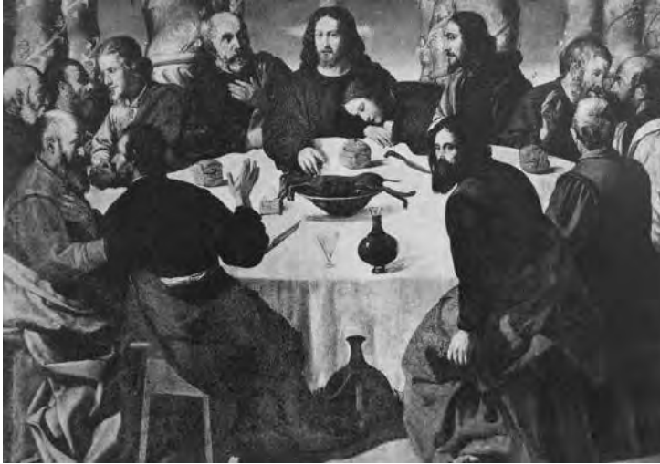
Fig. 5. Anonimo (già attr. a Guido Cagnacci), Ultima Cena, donazione Soardi , già Pinacoteca di Rimini, distrutto durante la seconda guerra mondiale.