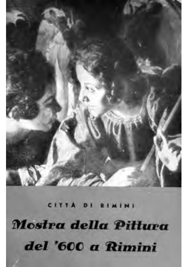
Fig. 1. Il catalogo della Mostra della Pittura del '600 a Rimini.

Una accurata ricognizione generale sulla presenza di opere di Cagnacci presso le collezioni – sia quelle reperibili, sia quelle solo citate dalle fonti – è stata compiuta da Gabriello Milantoni e inserita in calce alla voce biografica per il volume sulla Scuola di Guido Reni nel 1992 (14) , mostrando una diffusione significativa di suoi dipinti (ovvero di opere attribuitegli). L'autore ha compiuto anche un primo censimento delle pitture poste all'incanto, che testimoniano un mercato particolarmente vivace tra la fine del XVIII secolo e gli inizi del successivo, proprio negli anni in cui calò un sostanziale silenzio su Cagnacci nella letteratura artistica. È merito di altri studi aver poi arricchito la ricerca in specifici contesti, come quello