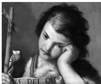
Fig. 7. Guido Cagnacci, San Giovanni Battista , Rimini, Fondazione Cassa di Risparmio di Rimini.

duti dal figlio Francesco dimorante in Parma Borgo San Giovanni n. 4” risultava: