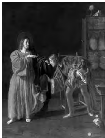
Fig. 3. Guido Cagnacci, La vocazione di San Matteo , Rimini, Museo della Città “Luigi Tonini” (foto Gilberto Urbinati).

maggiore delle monache della chiesa di San Matteo a Rimini, in seguito passata nella collezione di Giovanni Simbeni e oggi presso il Museo della città “Luigi Tonini” (29) (fig. 3). Tra i suoi quadri anche un San Giovanni Battista analogamente attribuito a Guido Cagnacci (30) . Abbiamo notizia di un altro dipinto di Cagnacci, oggi purtroppo perduto (31) , che si riteneva proveniente dalla chiesa dei Gesuiti e a sua volta considerato una copia, ovvero i Tre martiri del Giappone (fig. 4) confluiti, probabilmente durante le requisizioni, nella galleria comunale, per il quale l’economista del Comune chiese al presidente Mattioli che fosse consegnato a Pietro Santi ad uso della scuola di disegno e ornato: