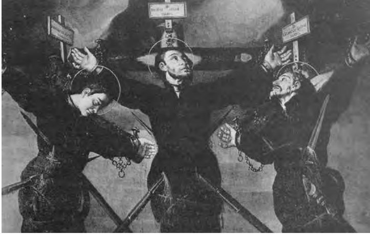
Fig. 4. (da?) Guido Cagnacci, Tre martiri del Giappone , già Pinacoteca di Rimini, distrutto durante la seconda guerra mondiale.

dell'opera che attualmente apre il catalogo dell'artista (34) , ancora oggi conservata in collezione privata. Nell'importante collezione di Andrea Bizzocchi, stimata dal pittore e incisore Alessandro Bornaccini nel 1826, tra i 130 dipinti alcuni dei quali ritenuti di rilevanti artisti risultava anche “un quadro bislungo rappresentante S. Giovanni con cornice a velatura, creduto del Cagnacci” (35) . Nello stesso torno d'anni, nel 1827, fu stimata anche la collezione di Francesco Tosi, segretario del comune di Montescudo e noto nel mondo antiquario riminese per i suoi reperti archeologici (36) .