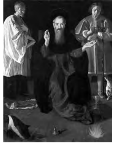
Fig. 6. Guido Cagnacci, Sant'Antonio abate tra due santi, Rimini, Museo della Città “Luigi Tonini”.