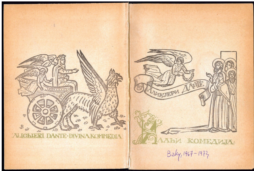
3. Dante Alighieri, Ilahi komedija , Bakı, Azərənəş, 1973; Trionfo di Dante (frontespizio e contropiatto anteriore).