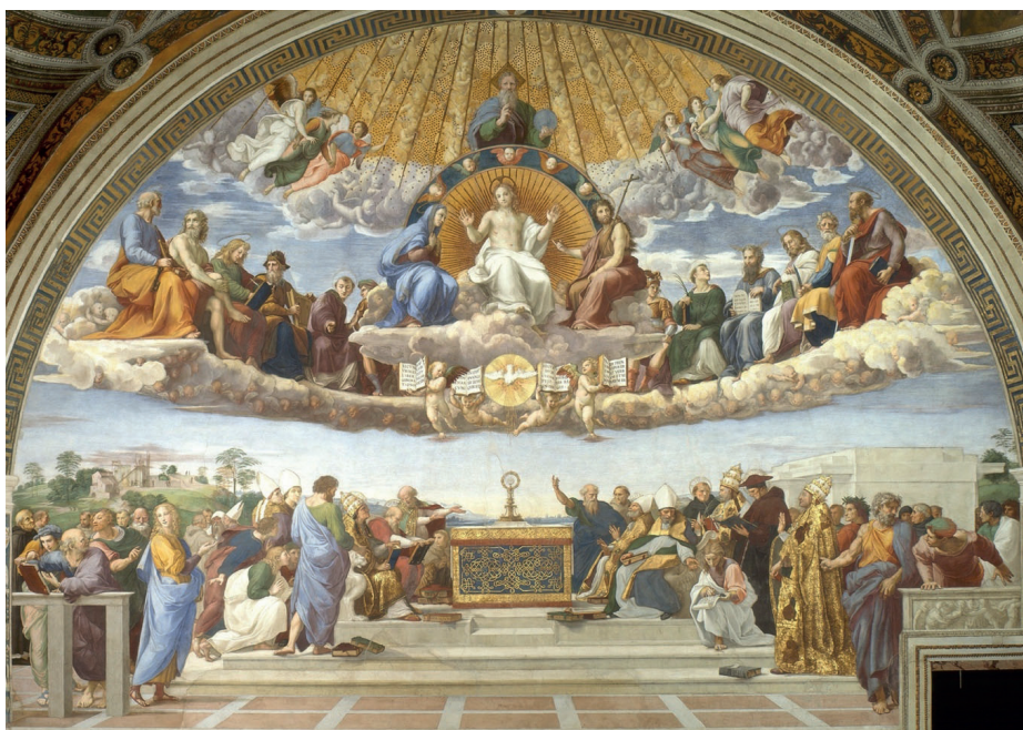
2. Raffaello Sanzio, La disputa del Sacramento (1509), Città del Vaticano, Musei Vaticani, Stanza della Segnatura; in basso a destra il ritratto di Dante.