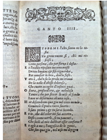
5. Dante Alikjeri, Ilahi komedija , Bakı, Azərənəş, 1973; Inferno I, p. 19 (a sinistra); La Divina Comedia di Dante [...]. In Vinegia: appresso Gabriel Giolito de Ferrari, et fratelli, 1555, Inferno IV (a destra; © Venezia, Biblioteca Nazionale Marciana).