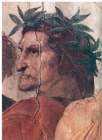
1. Dante Alikjeri, Ilahi komedija , Baki, Azərənəşr, 1973, copertina in tela con il ritratto di Dante (a sinistra); il modello di Raffaello, part. de La disputa del Sacramento , 1509, (a destra).