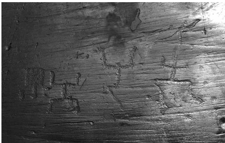
Fig. 2 – Coppia di antropomorfi con mani o piedi espressi in associazione a orante e paletta. Bèrg, roccia 1