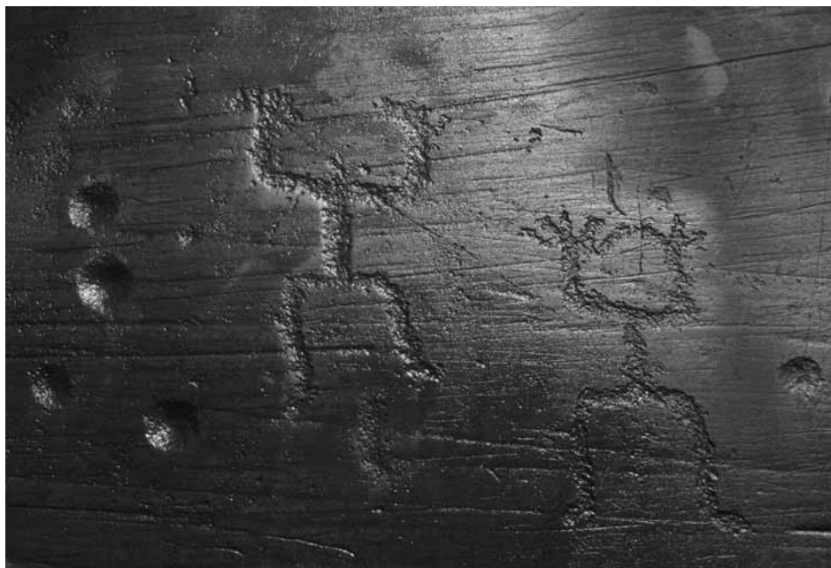
Fig. 1 – Coppia di oranti a grandi mani in associazione a moduli di coppelle. Bèrg, roccia 1