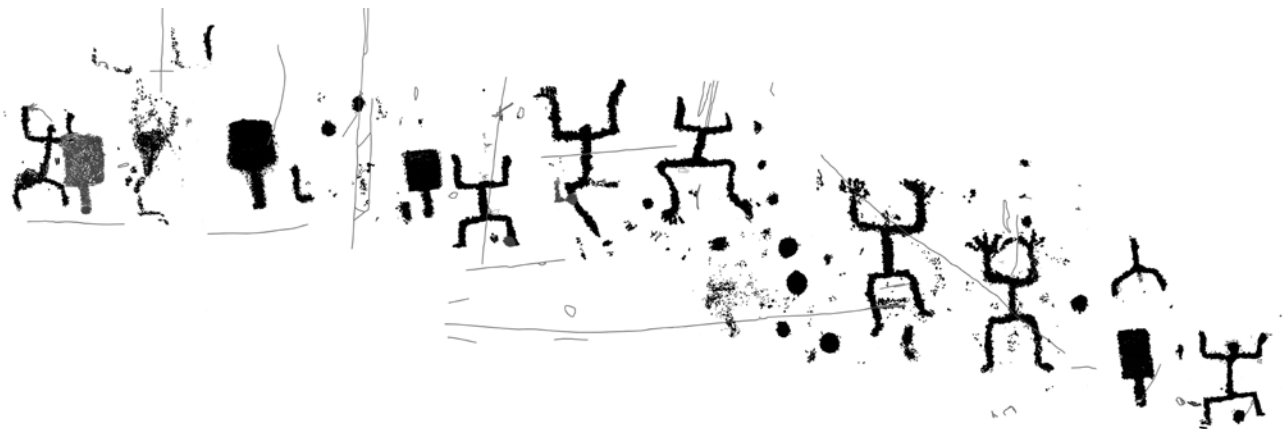
Fig. 3 – Bèrg, fascia centrale della roccia 1. Ricomposizione digitale dei rilievi (Dip. CCSP)

grandi mani/ grandi piedi. Si segnala che la dimensione degli oranti semplici è, come accade di frequente, inferiore a quella delle figure con mani o piedi espressi. Questo elemento, già discusso in precedenti occasioni (GAVALDO 1999; GAVALDO, SANSONI 2009), pare interpretabile come un caso di “prospettiva per importanza” e contribuisce a sottolineare il ruolo centrale delle figure di grandi mani/ grandi piedi nell’ambito della concezione ideologico-culturale degli incisori camuni.