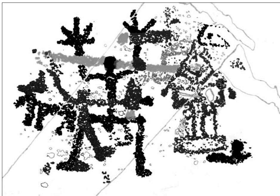
Fig. 5 – Gruppo con orante grandi mani associato ad armato, capanna e probabile canide. Ronchi d'Izmir, roccia 76, sett. D (rilievo Dip. VC del CCSP)