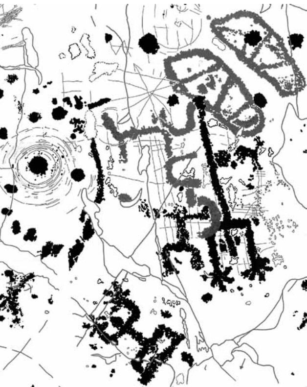
Fig. 6 - Figura a grandi mani e figura a grandi piedi. Ronchi d'Iziri, roccia 104. (rilievo Dip. VC del CCSP)

Nella parte sommitale della sella si snoda un fitto intrico di figurazioni, a martellina e graffite, che includono un elevatissimo numero di cospicue e segni circolari concentrici, complessi sistemi di oranti schematici, simboli a U posti orizzontalmente e verticalmente rispetto al piano e, in stretta connessione con una figura maschile a grandi piedi (Fig. 6) - eccezionalmente senza mani, né braccia espresse - due impronte destre con campitura a losanga, uno zoomorfo non identificato e un plausibile armato, con lancia ricavata da una frattura naturale della roccia.